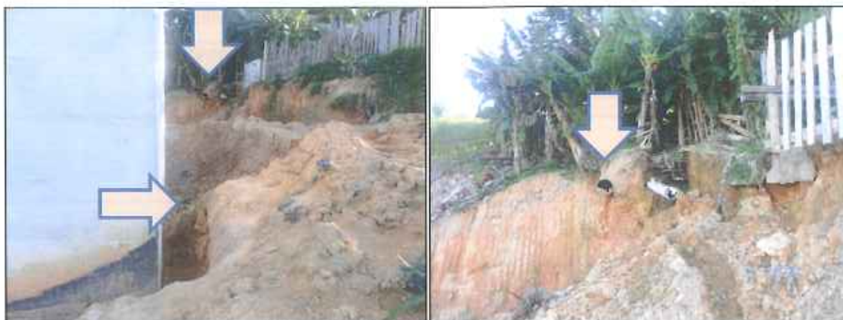
Figura 2: Adutora cortada e desativada

Segundo os funcionários que estão trabalhando nas obras de melhoria e ampliação do reservatório R01, após o término dos serviços, toda área será aterrada e as águas provenientes dos extravasores dos reservatórios e da limpeza dos reservatórios serão drenadas para a rede pluvial localizada na Rua Coletor Irineu Comelli.