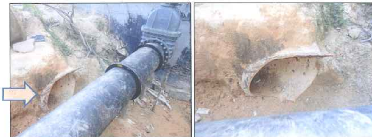
Figura 3: Adutora desativada no reservatório e sua entrada no terreno abaixo