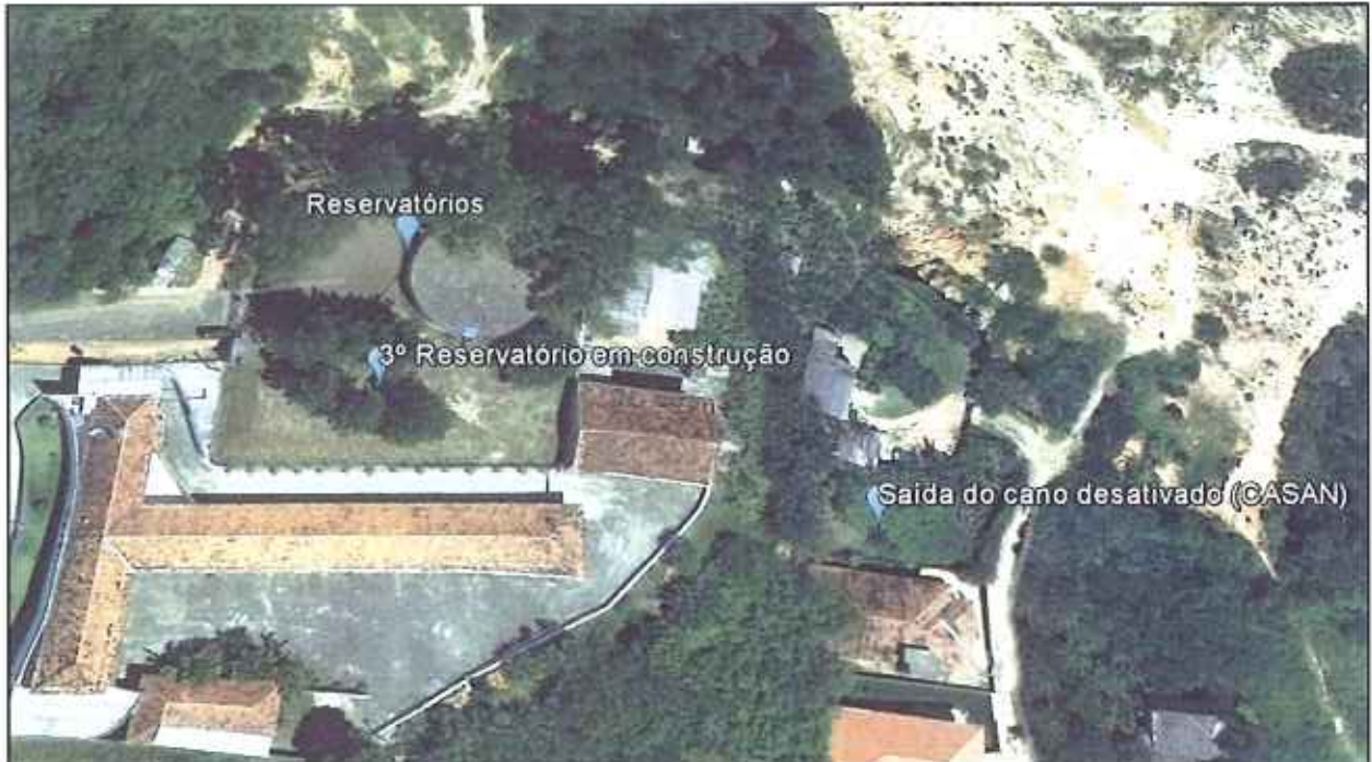
Figura 01: Imagem dos Reservatórios

Para atender os fatos constantes no Ofício nº 074/2016/VISA/SMS/SJ da Vigilância Sanitária, a equipe técnica da ARES realizou uma visita emergencial no Centro do município de São José para verificar a adutora desativada da concessionária localizada na área do reservatório R01. Durante a fiscalização a equipe visitou os seguintes locais, conforme descrito na figura 1: terreno do reservatório R01 e local de saída da tubulação (Rua Madre Jonas de Gusmão).