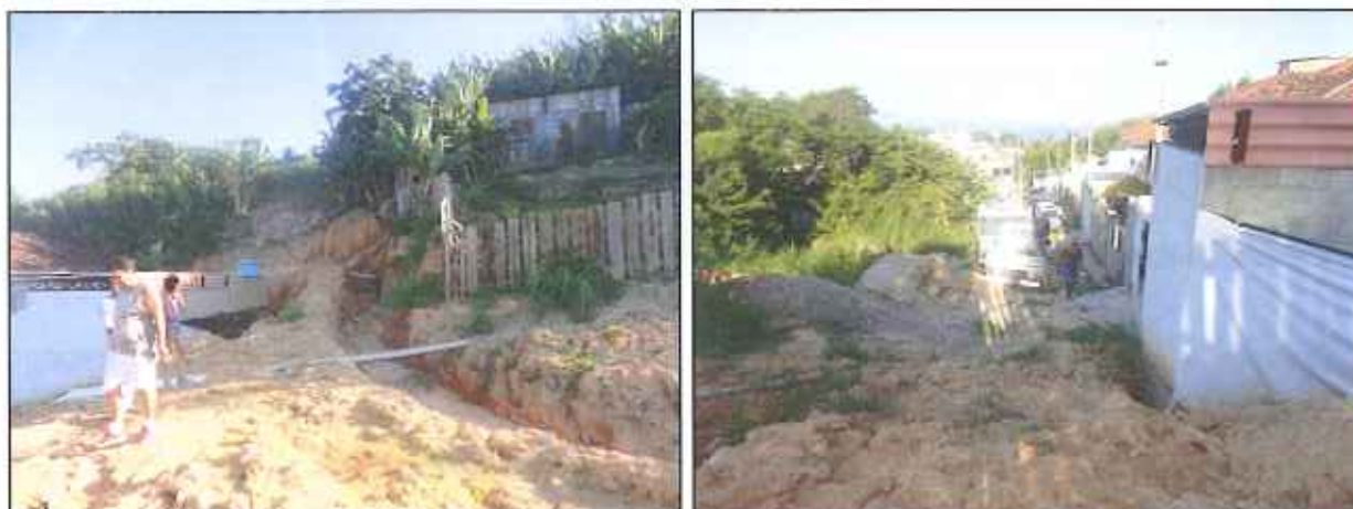
Figura 4: Terreno onde ocorreu o alagamento e Rua Madre J. de Gusmão