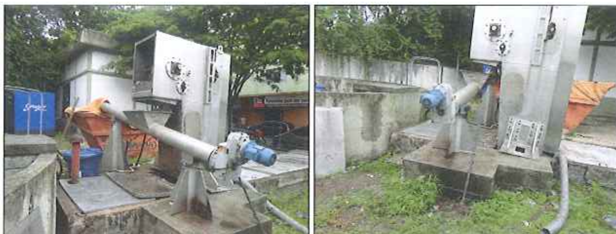
Figura 2: Gradeamento mecanizado e contêiner instalado na EEE de Campinas

ocorrências de vários insetos, aves e roedores, além de expor os moradores e as pessoas que ali circulam a exalação de forte mau cheiro.