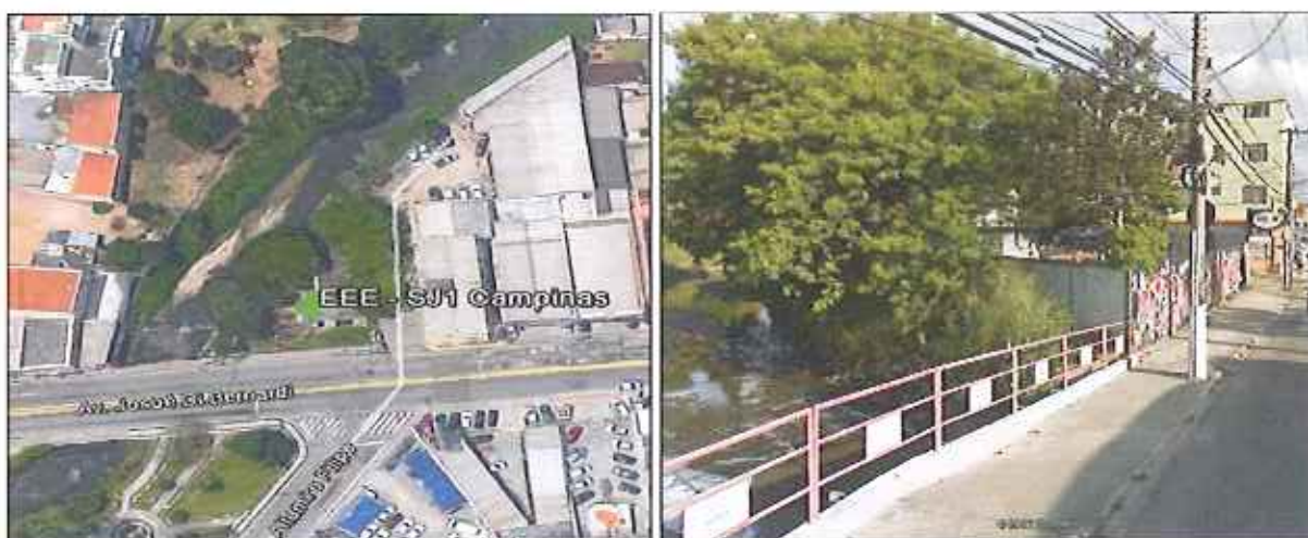
Figura 1: EEE SJ1 - Campinas com o Rio Araújo aos fundos.

No dia 28/01/2016, a equipe técnica da ARES esteve na Estação Elevatória de Esgoto (EEE) SJ1 – Campinas, juntamente com funcionário da Concessionária, Eng. Rafael Zimmermann, para verificar o possível lançamento de efluente para o Rio Araújo, localizado nas proximidades da Elevatória, conforme figura 1.