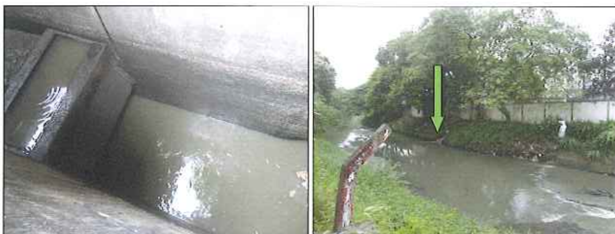
Figura 3: Canal afluente e lançamento direto no rio Araújo