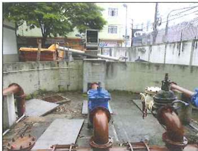
Figura 5: Bombas instaladas na EEE Campinas (28/01/2016)