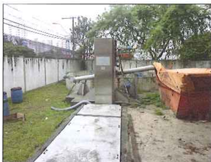
Figura 4: Área interna e externa do poço de chegada da EEE

Cabe lembrar que a Estação Elevatória de Campinas possui três conjuntos motobomba que recalcam o efluente (figura 5) e é munida de sistema de supervisão (telemetria), porém, se algum problema de entupimento no gradeamento e de desvio do fluxo do efluente ocorre, o sistema de supervisão pode não detectar a falha de imediato.