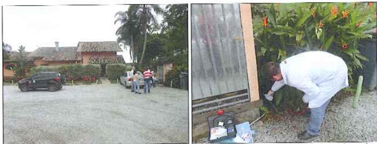
Figura 4: Coleta de amostra de água na Rua Brigadeiro Eduardo Gomes (Restaurante Casa do Peixe)