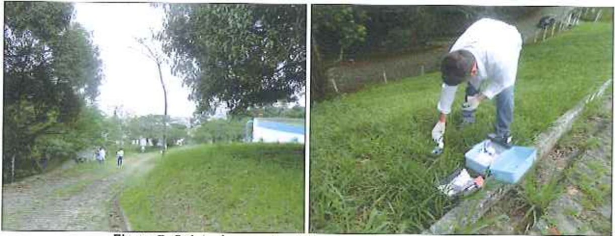
Figura 7: Coleta de amostra de água no Reservatório Serraria