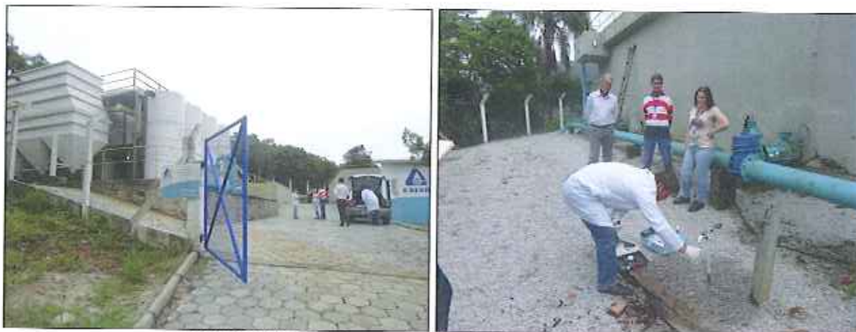
Figura 2: Coleta de amostra de água na ETA São Miguel