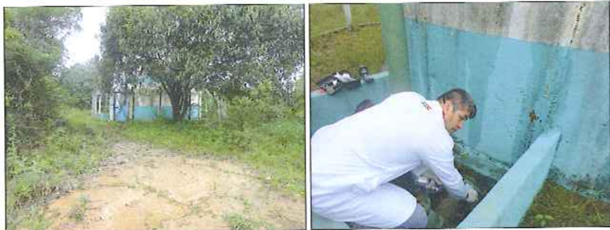
Figura 3: Coleta de amostra de água no Reservatório Cachoeira

Abaixo (Figuras 3 a 6) estão algumas imagens da coleta de água nos locais.