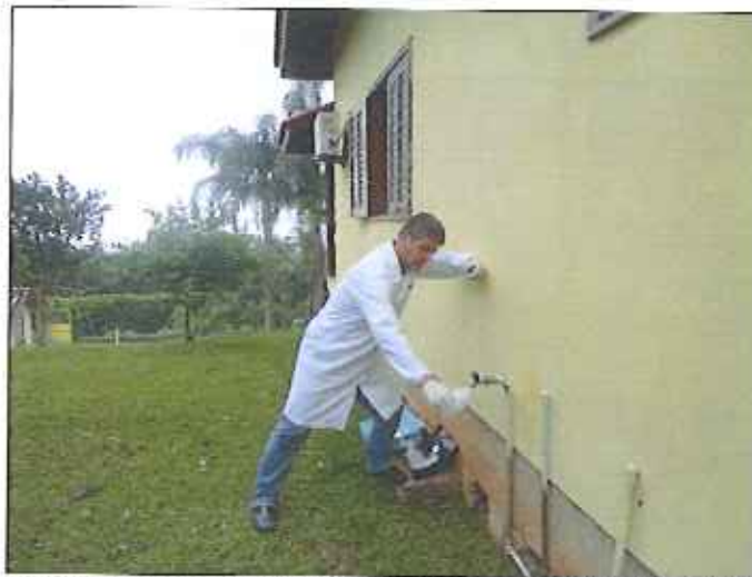
Figura 8: Coleta de amostra de água na Rua das Orquídeas (Residência)