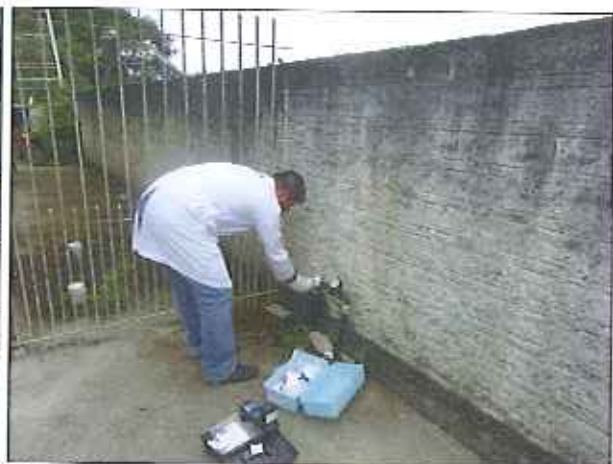
Figura 6: Coleta de amostra de água na Rua Antônio José Garcia (Panificadora Gropã)