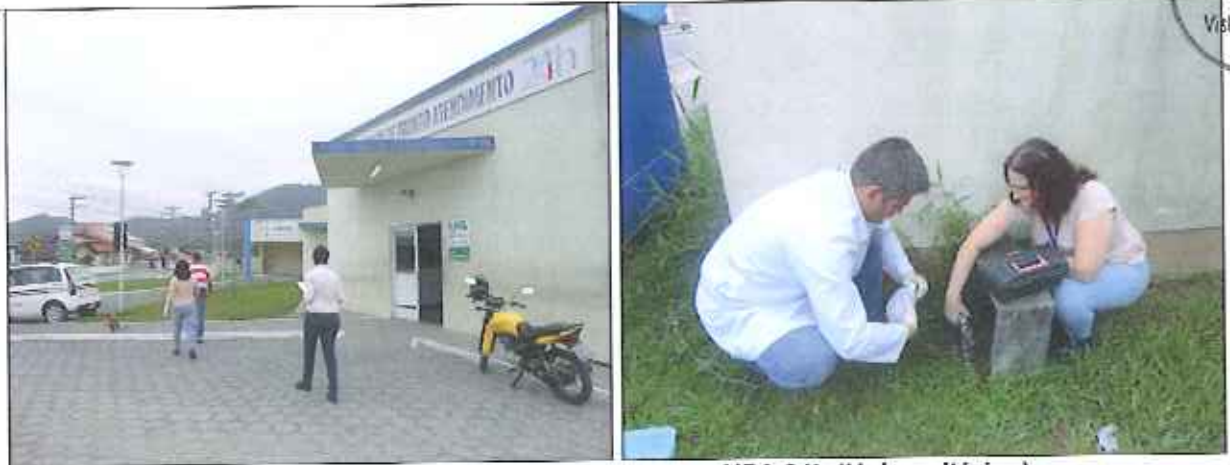
Figura 10: Coleta de amostra de água na UPA 24h (Universitários)