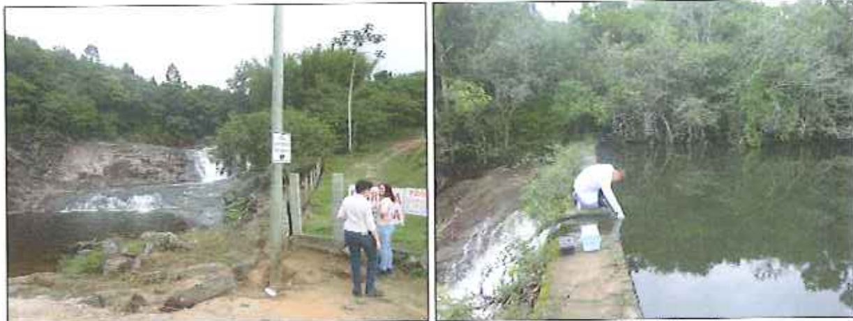
Figura 1: Coleta de amostra de água bruta da represa São Miguel