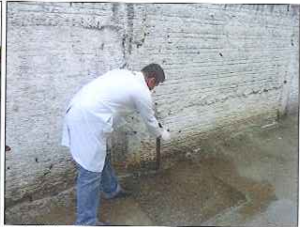
Figura 5: Coleta de amostra de água no Colégio Cônego Rodolfo Machado