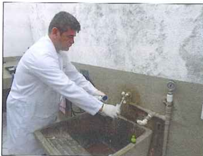
Figura 9: Coleta de amostra de água na CASAN (Centro)