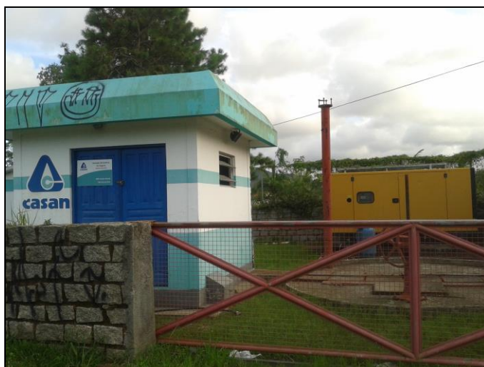
Figura 3: EEE Rio do Braz com gerador

A Figura 3 mostra que a Estação Elevatória conta com um grupo gerador de energia elétrica, para que o recalque do efluente não seja prejudicado em casos de falta de energia elétrica.