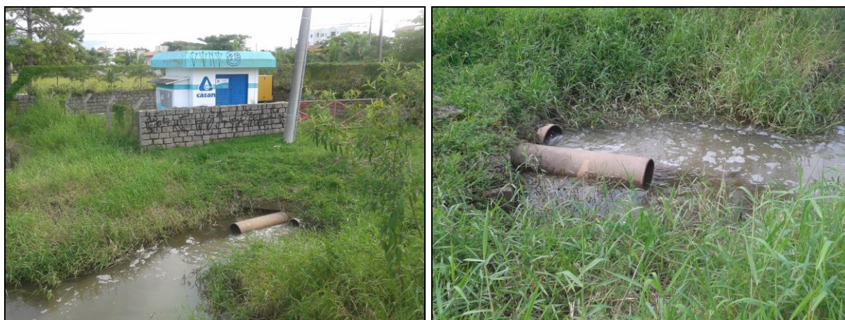
Figura 1: EEE Rio do Braz (à esquerda) e extravasor (à direita)

No dia 29 de dezembro de 2015 foi constatado que a Estação Elevatória de Esgoto Rio do Braz, localizada no bairro de Canasvieiras, e os Poços de Visitas da região, estavam com problemas de vazamento de esgoto bruto. A Elevatória extravasava para o Rio do Braz; e os PV's (Rua Antenor Borges), para a rede pluvial, conforme Figuras 1 e 2.