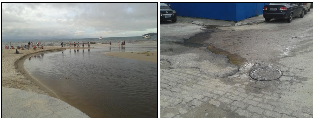
Figura 2: Rio do Braz desaguando na praia de Canasvieiras (à esquerda) e PV da Rua Antenor Borges com vazamento (à direita)