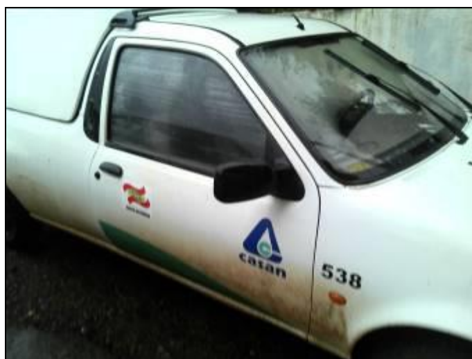
Figura 4: Veículo que atende a agência

RECOMENDAÇÃO 07: Atualizar dados da tabela 3.