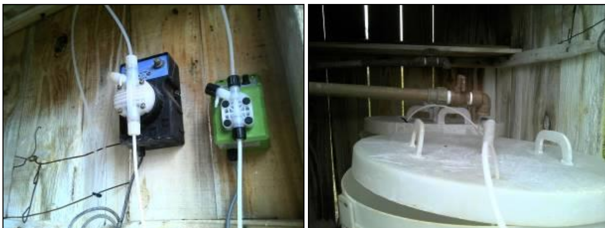
Figura 8: Dosagem dos produtos químicos