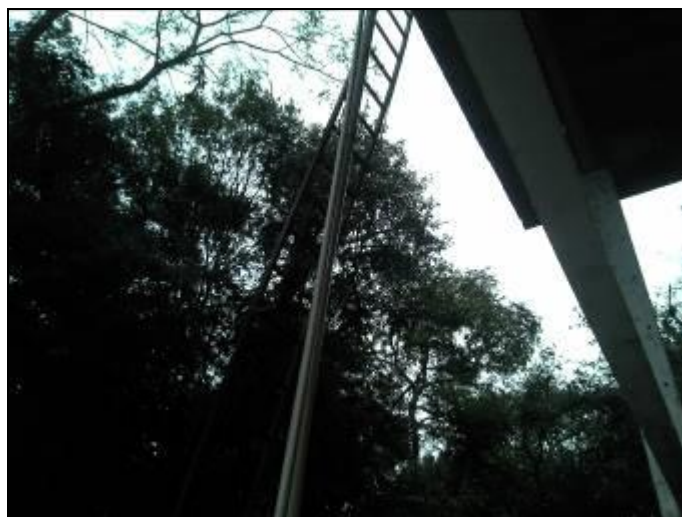
Figura 12: Escada no reservatório

9) Existe guarda-corpo nas áreas de visitação (Resolução AGESAN Nº11 Art. 23º)? Sim ( ) Não ( x )