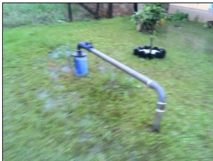
Figura 6: Poço 3

Coordenadas geográficas: 26°44'32" S / 52° 23' 60" O