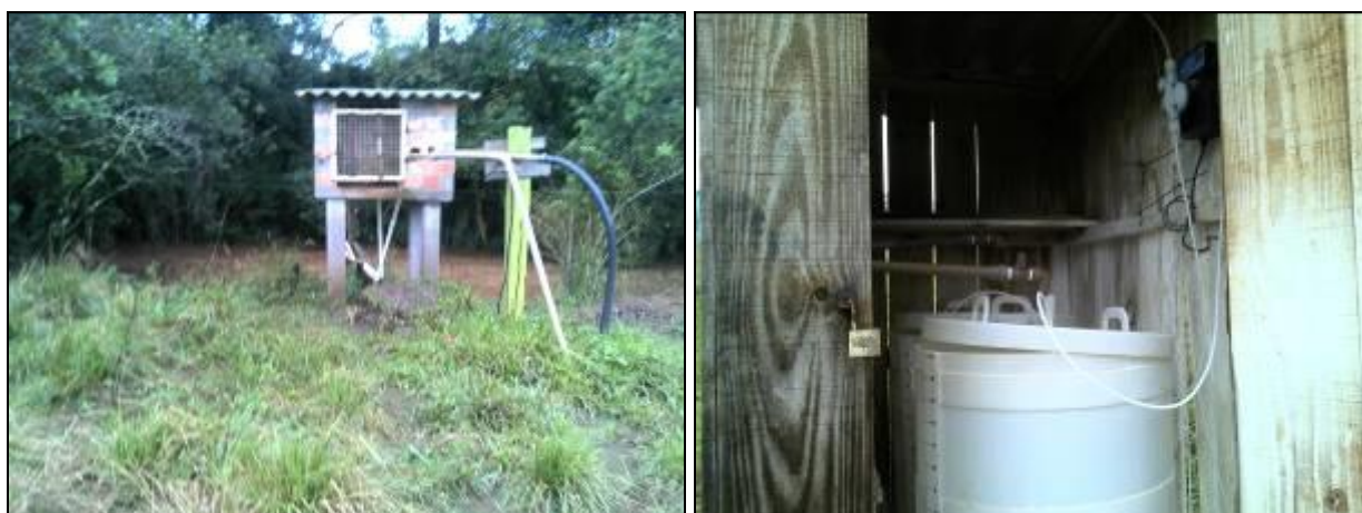
Figura 7: Vista externa e interna da Casa de química

Unidades de tratamento: Na Casa de química somente são feitas a desinfecção da água bruta com cloro e a fluoração. A dosagem dos produtos químicos é feita no poço 2, sendo que o Poço 2, assim como os outros dois poços, são direcionados para o reservatório de contato onde ocorre a mistura.