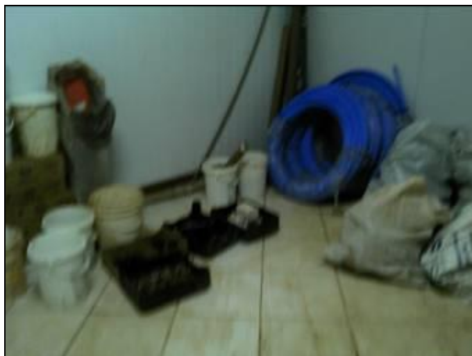
Figura 3: Almoxarifado junto ao laboratório

RECOMENDAÇÃO 05: Providenciar local adequado para o almoxarifado.