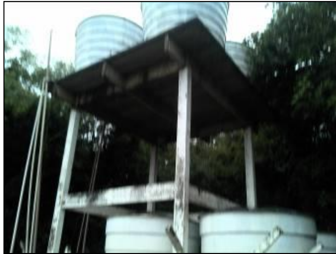
Figura 11: Reservatórios interligados

Coordenadas geográficas: 26° 44' 25" S / 52° 23' 89" O