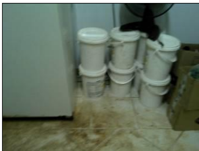
Figura 10: Produtos Químicos

RECOMENDAÇÃO 15: Providenciar local adequado para o armazenamento dos produtos químicos.