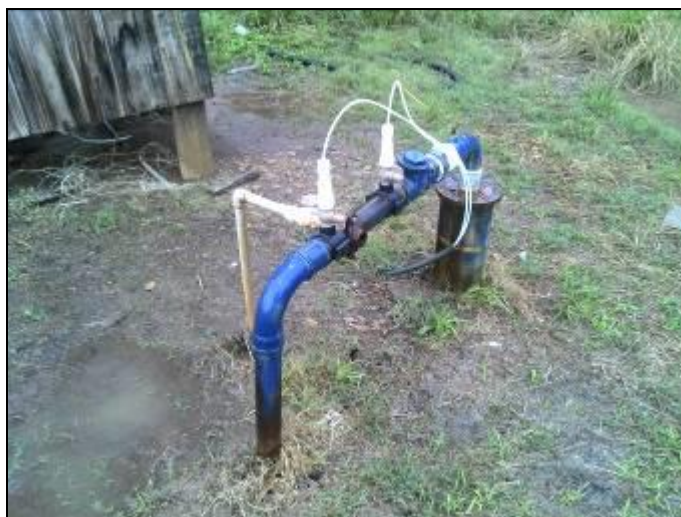
Figura 5: Poço 2

1) Qual o documento que garante a propriedade ou a posse da área/imóvel ou locação 7 ? Não informado.