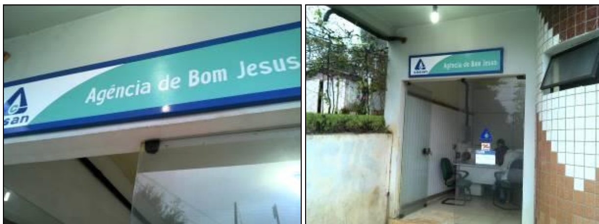
Figura 1: Agência de Bom Jesus

1) Existe identificação de que ali funciona um escritório de atendimento (Lei nº 8.078 Art. 6º)? Sim ( x ) Não ( )