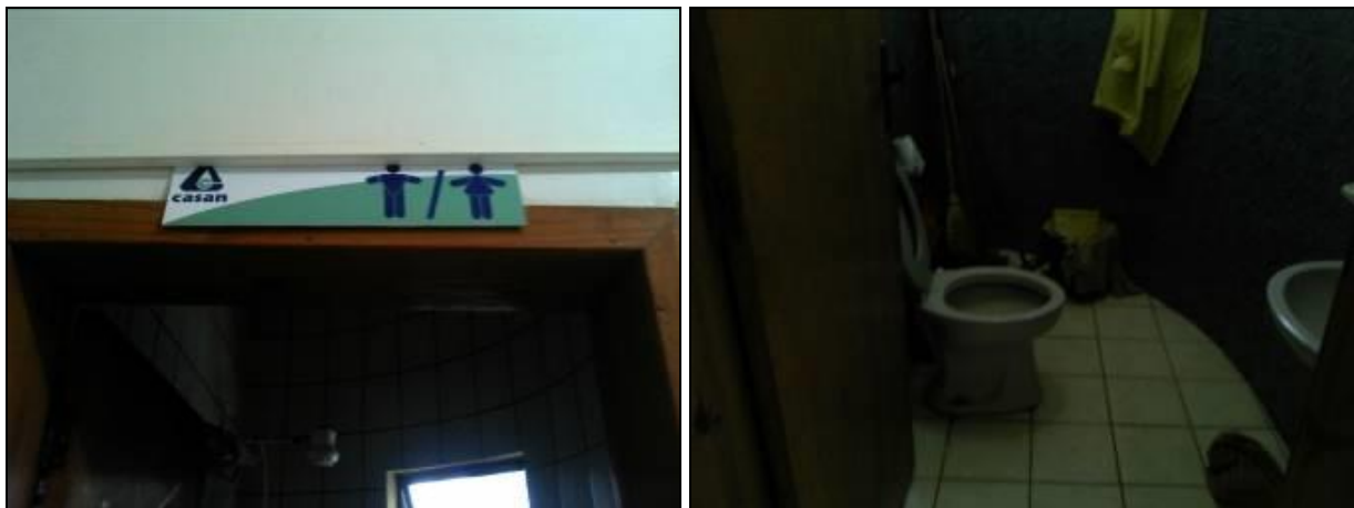
Figura 2: Sanitário da Agência

RECOMENDAÇÃO 04: Afixar cartaz indicando ao usuário o uso compartilhado do sanitário.