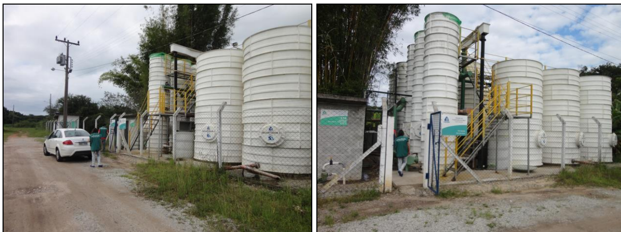
Figura 1: Vista Frontal da ETA compacta (27/04/2015)

Abaixo seguem imagens da visita feita à ETA Compacta da Daniela. (Figuras 1 e 2).