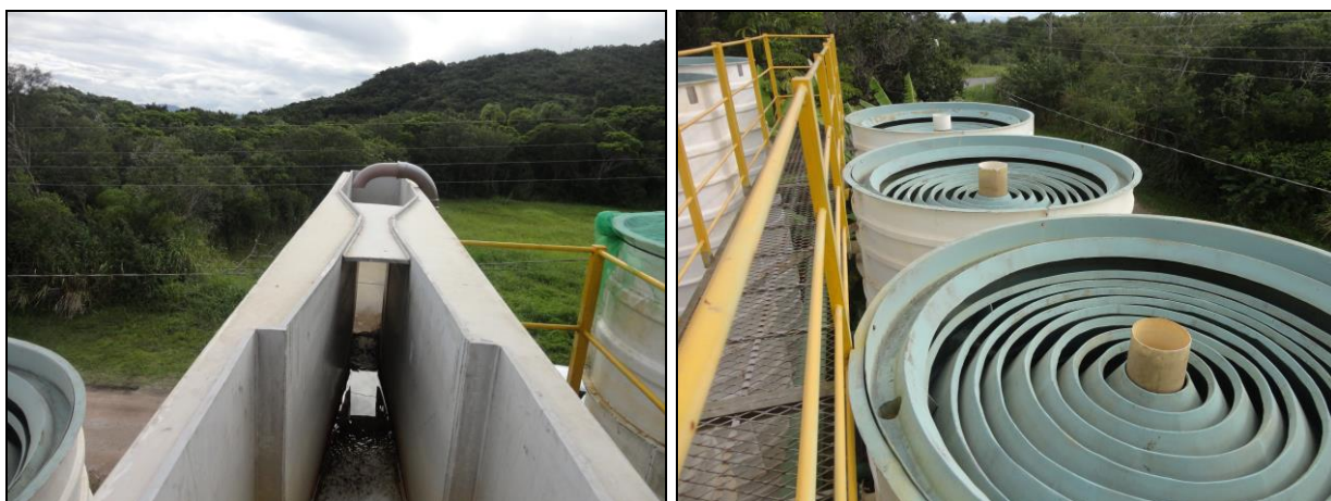
Figura 2: Entrada de água na ETA (27/04/2015)