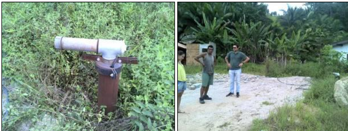
Figura 9: Poço novo e terreno adquirido (Acompanhamento n° 12/2015)

feita licitação para construção da casa de química junto ao poço. O terreno onde se localizará o poço, a casa de química e também o escritório já foi adquirido pela Concessionária (Figura 9). Além disso, obras de rede de distribuição estão sendo feitas na rua principal (Figura 10).