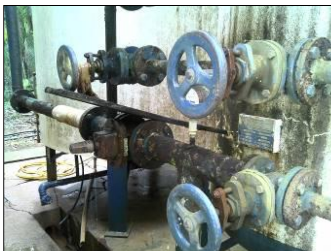
Figura 8: Vazamentos encontrados (Acompanhamento n° 12/2015)

CONCLUSÃO AGESAN: Encontrados vazamentos nos registros e tubulações da ETA, conforme Figura 8.