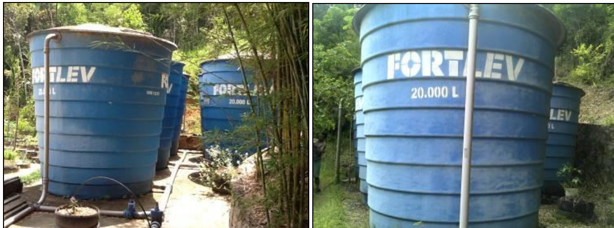
Figura 11: Reservatório sem isolamento

CONCLUSÃO AGESAN: Os reservatórios ainda não estão isolados (Figura 11).