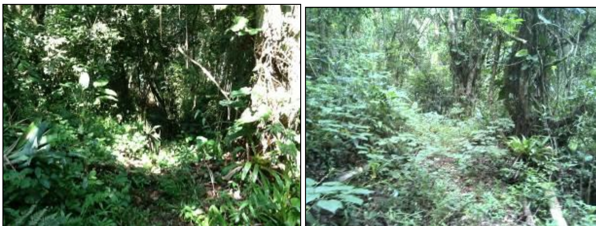
Figura 5: Acesso à captação (Inicial nº 65/2013 e Acompanhamento nº 12/2015)

CONCLUSÃO AGESAN: O acesso permanente o mesmo: ruim (Figura 5).