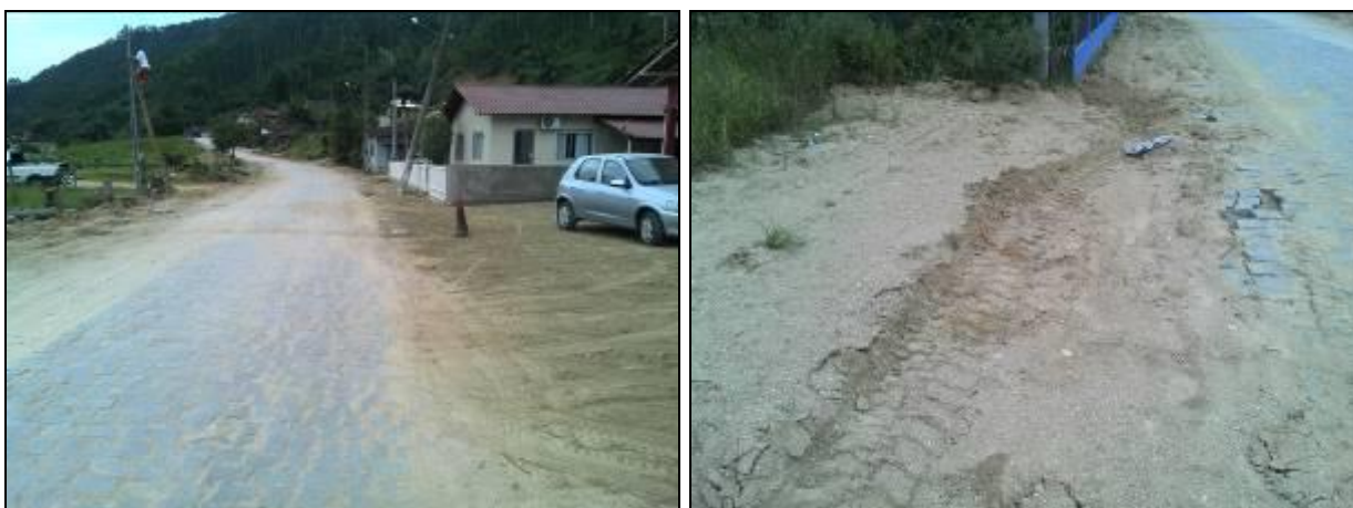
Figura 10: Obras na rede de distribuição (Acompanhamento n° 12/2015)