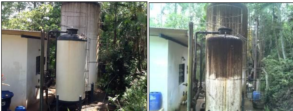
Figura 6: ETA (Inicial nº 65/2013 e Acompanhamento nº 12/2015)

CONCLUSÃO AGESAN: A ETA encontra-se em péssimo estado de operação e estrutural, enferrujada, com vazamentos, causando perigo ao operador, podendo afetar a qualidade da água distribuída à população (Figura 6).