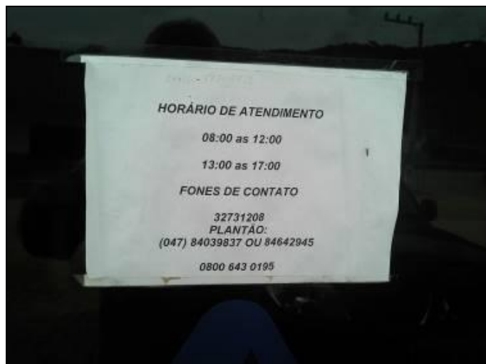
Figura 2: Identificação do horário de atendimento (Acompanhamento nº 12/2015)

CONCLUSÃO AGESAN: Horário de atendimento afixado na porta do escritório (Figura 2).