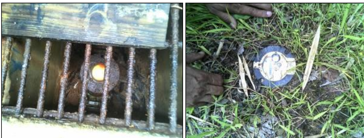
Figura 7: Macromedidores de entrada de água bruta e saída de água tratada (Acompanhamento nº 12/2015)

CONCLUSÃO AGESAN: Recomendações atendidas conforme Figura 7.