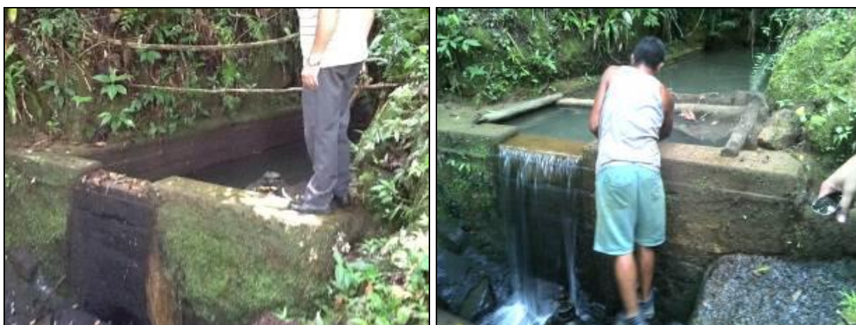
Figura 4: Condições da área de captação (Inicial nº 65/2013 e Acompanhamento nº 12/2015)

CONCLUSÃO AGESAN: As condições de segurança permanecem as mesmas desde a visita feita em 2013: ruins; colocando em risco os funcionários (Figura 4).