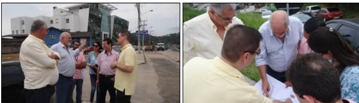
Figura 3: AGESAN e CASAN na visita

A AGESAN estará acompanhando o término das obras que está previsto para o dia 15 de dezembro de 2014.