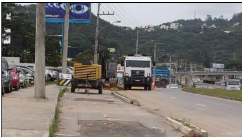
Figura 2: Trecho com obras em andamento – SOS Cárdio

Com essa nova macro adutora, a região Norte do município contará com mais 60 L/s de água tratada para melhorar o abastecimento, principalmente na temporada de verão onde o número de consumidores aumenta significativamente. A conclusão destas obras está prevista para o dia 15 de dezembro de 2014.