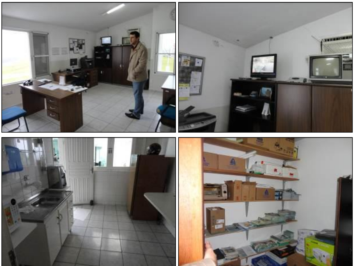
Figura 10: Outras áreas administrativas.