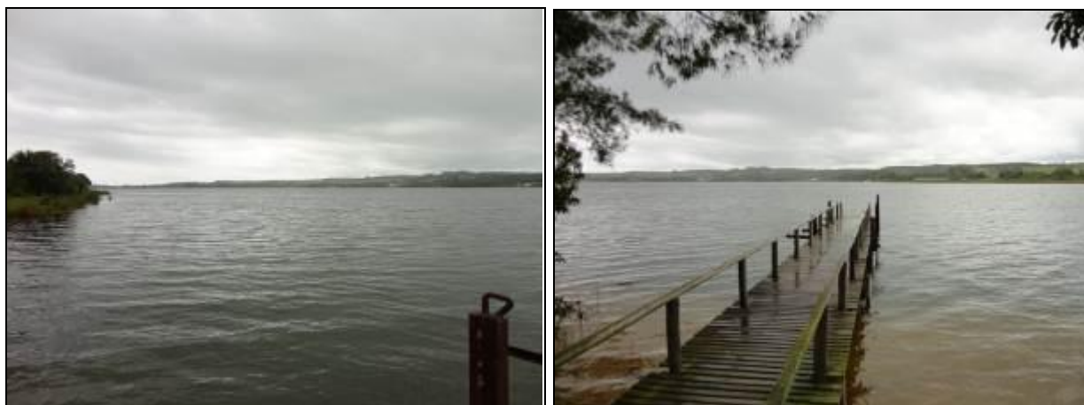
Figura 12: Área de Captação da Lagoa do Faxinal (inicial)

Onde é tratada a água deste manancial? ETA Rincão.