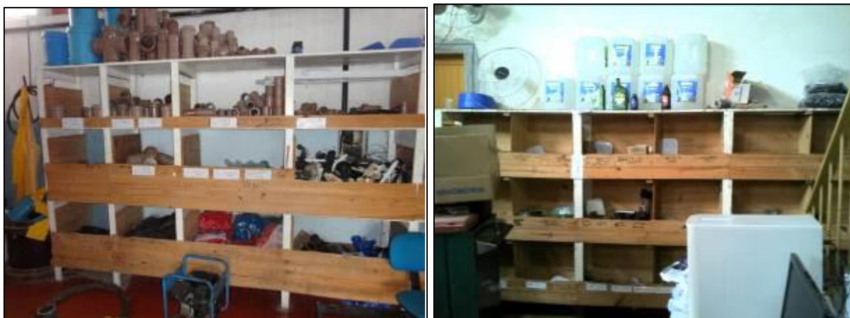
Figura 4: Almoxarifado (inicial e acompanhamento)

10) Existe almoxarifado em boas condições? Sim (x) Não ( ) Pendência ( ):