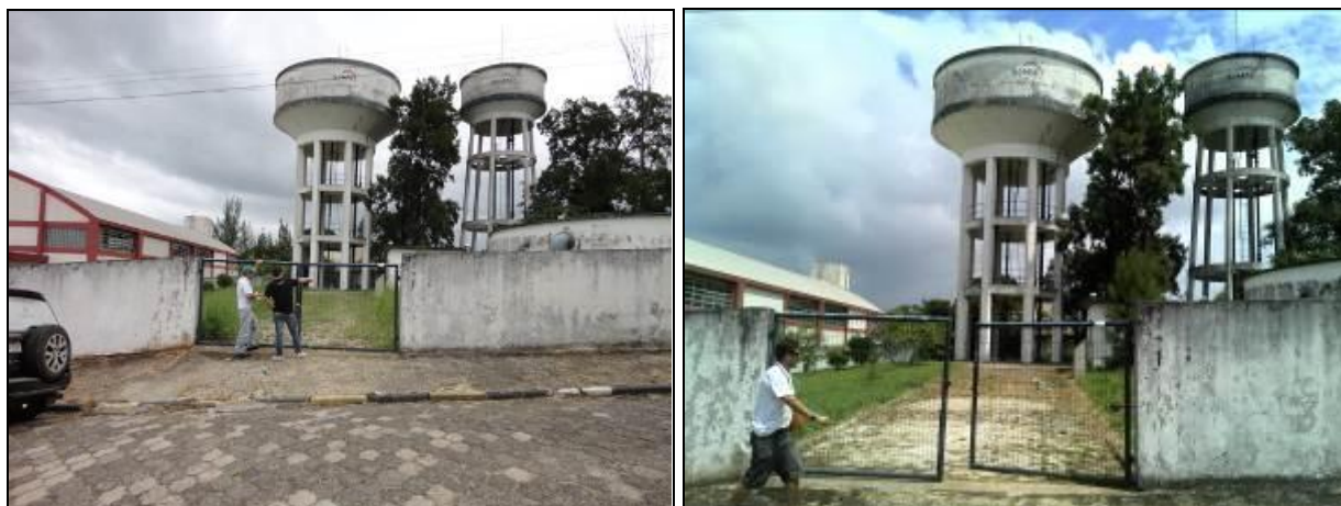
Figura 29: R- 04-05 - Cristo Rei (inicial e Acompanhamento)

Posição: Apoiado (x) Elevado (x) Outro ( )