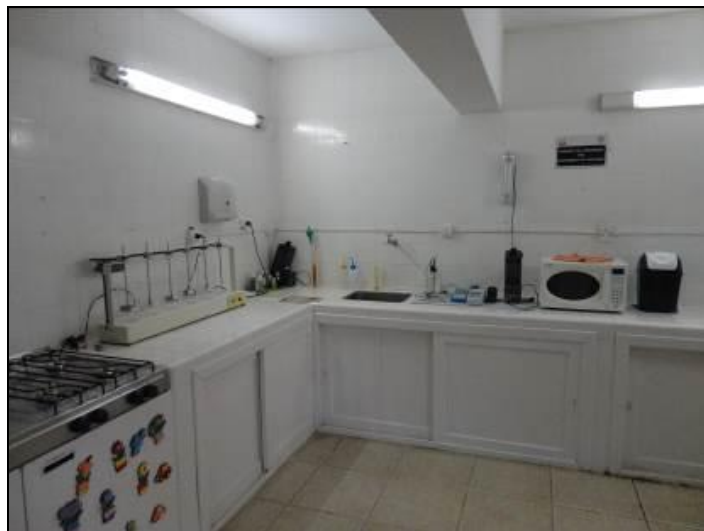
Figura 15: Condições do Laboratório.

3) As condições do Laboratório são adequadas? Sim (x) Não ( ) Pendência ( ):