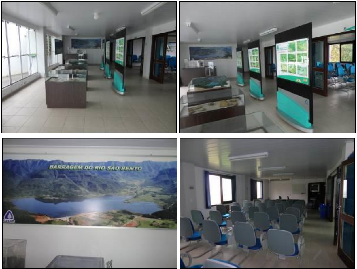
Figura 9: Auditório e Áreas de Exposição e Treinamento.