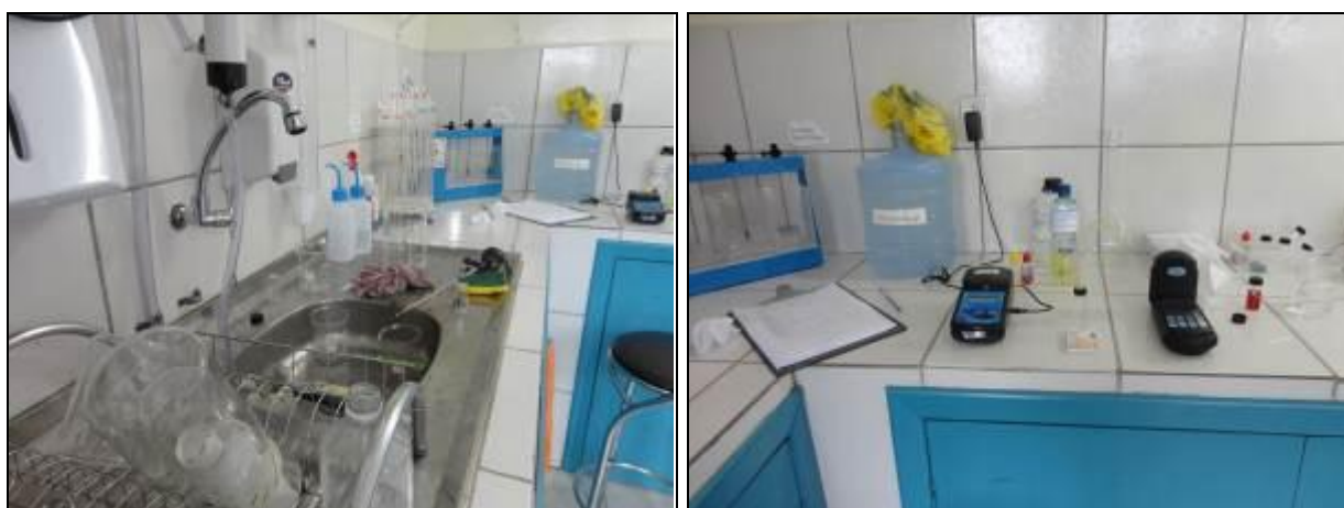
Figura 25: Condições do Laboratório (inicial)

03) As condições do Laboratório são adequadas? Sim (x) Não ( ) Pendência ( ):