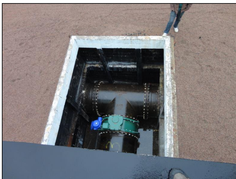
Figura 21: Equipamentos desprotegidos.

RECOMENDAÇÃO 12: Providenciar a instalação de gradeamento nos equipamentos