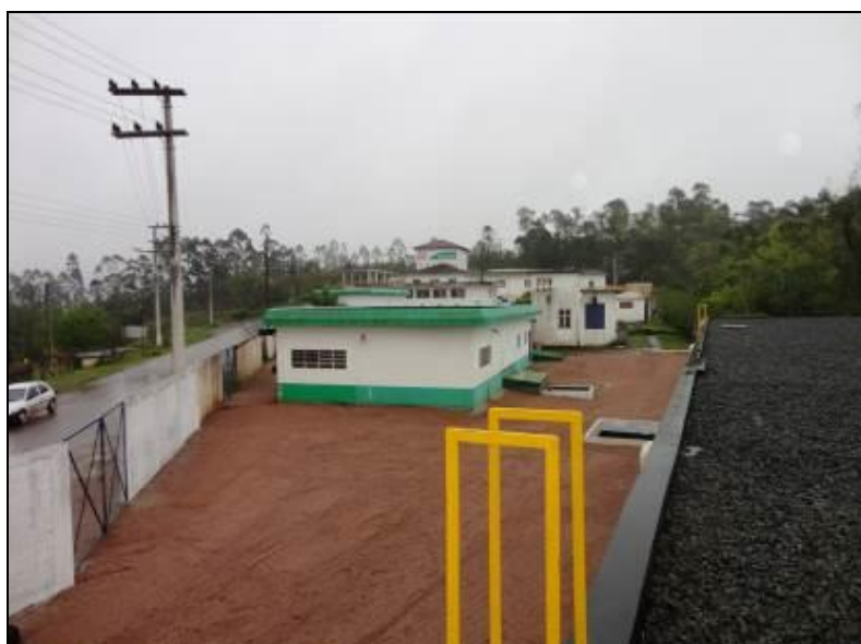
Figura 14: Vista geral da ETA

RECOMENDAÇÃO 07? Apresentar Licença ou requerimento.