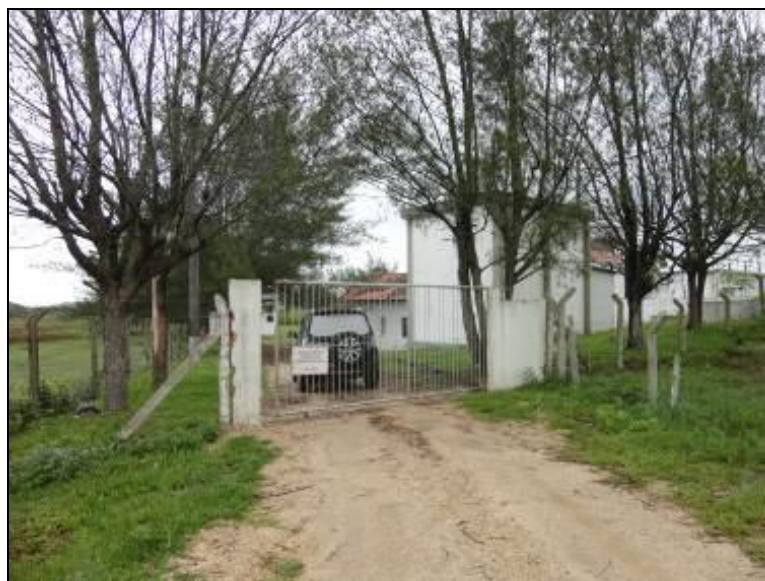
Figura 24: Fachada da ETA (inicial)

Qual região é atendida por esta Estação? Região Leste e Parte do Perímetro Urbano.