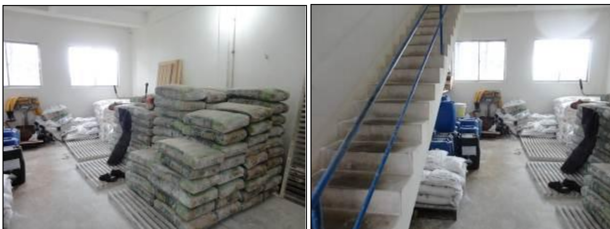
Figura 28: Armazenamento de produtos químicos (inicial)

21) Existe almoxarifado para acondicionamento de produtos químicos (Resolução AGESAN nº11 - Art. 18º §2º)? Sim (x) Não ( ) Pendência ( ):