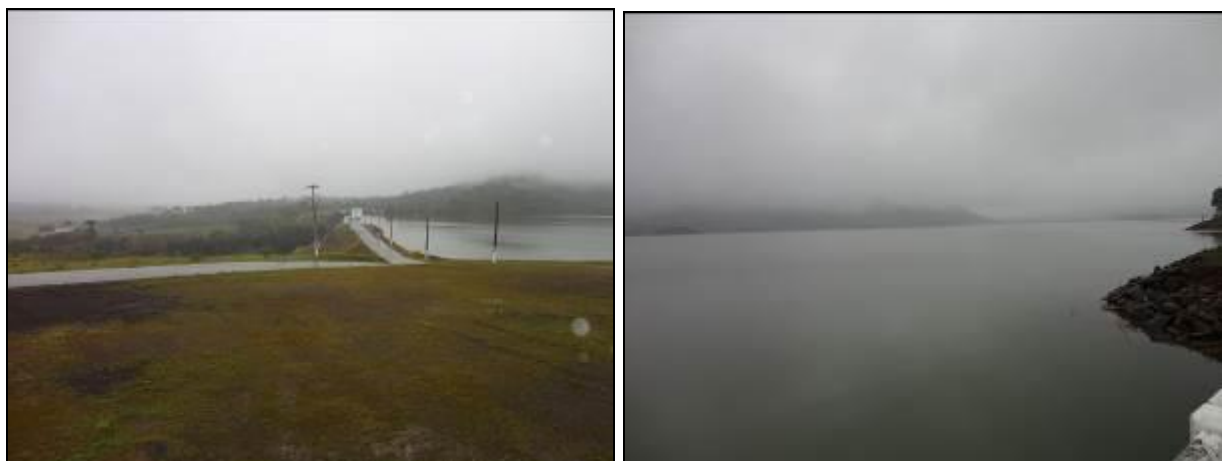
Figura 7: Vistas parciais da Represa