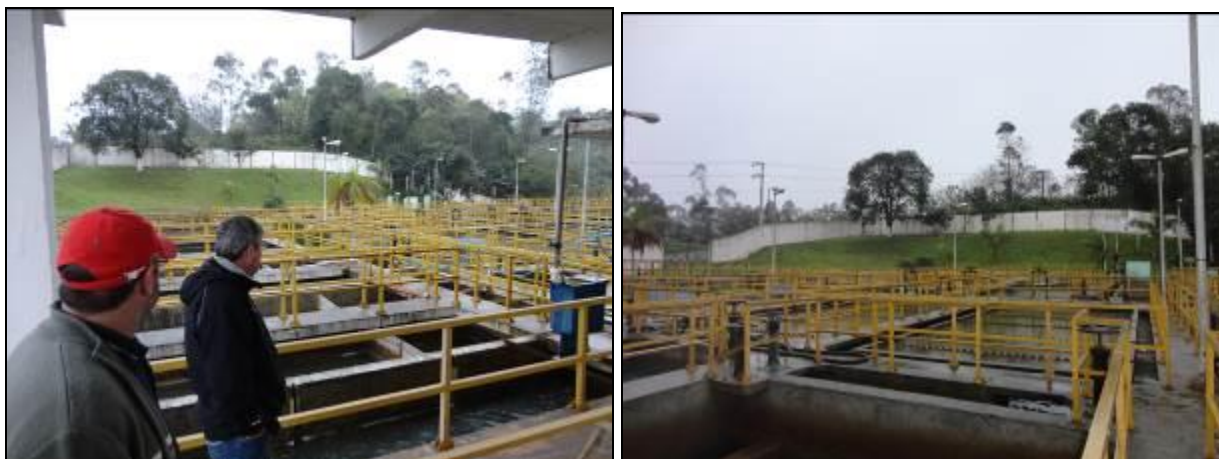
Figura 16: ETA é toda murada

9) Existe cerca de proteção da ETA em bom estado de conservação (Resolução AGESAN Nº11 - Art. 15º)? Sim (x) Não ( ) Pendência ( ):