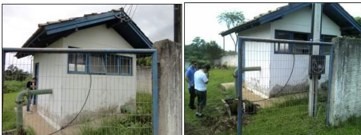
Figura 33: ERAT (inicial e acompanhamento)