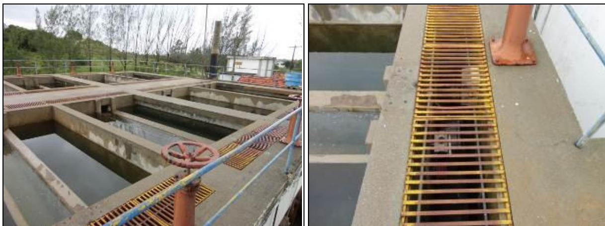
Figura 26: Filtros da ETA (Inicial)

17) Os filtros estão em boas condições (Resolução AGESAN nº11 - Art. 15º)? Sim (x) Não ( ) Nº de filtros: 10 (dez).