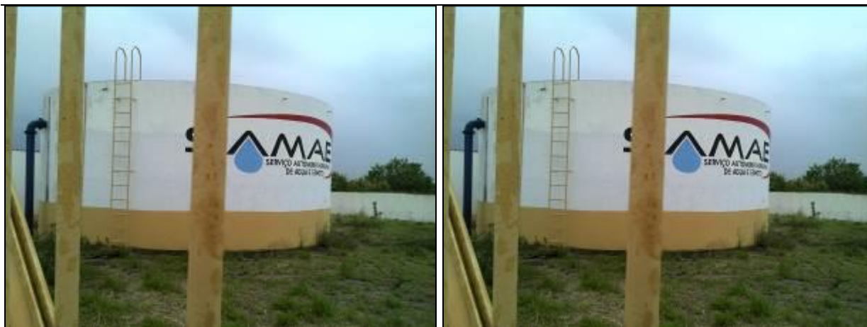
Figura 30: R-07 (inicial e Acompanhamento)

1) Existem placas indicativas de propriedade e restrição de uso das áreas dos reservatórios (Resolução AGESAN nº 004 - Art.19 - §2º)? Sim ( ) Não (x) Pendência ( ):