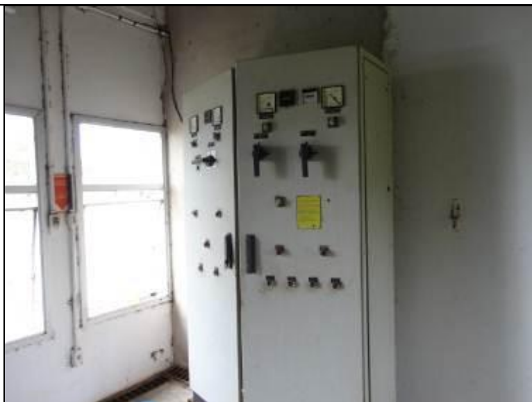
Figura 32: Quadro de Energia (acompanhamento)