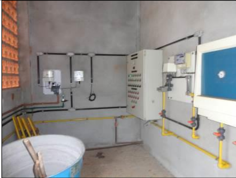
Figura 22: Equipamentos de fluxo e controle

21) Existe almoxarifado para acondicionamento de produtos químicos (Resolução AGESAN nº11 - Art. 18º §2º)? Sim (x) Não ( ) Pendência ( ):