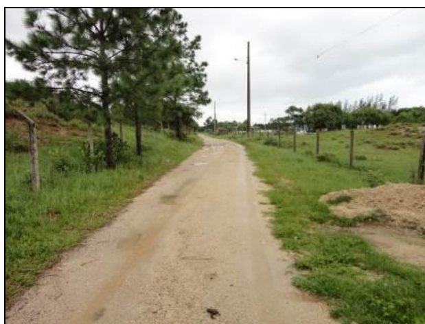
Figura 13: Acesso a Captação (inicial)

07) Existe facilidade de acesso ao local (Resolução AGESAN nº11 - Art. 11º)? Sim (x) Não ( ) Pendência ( ):