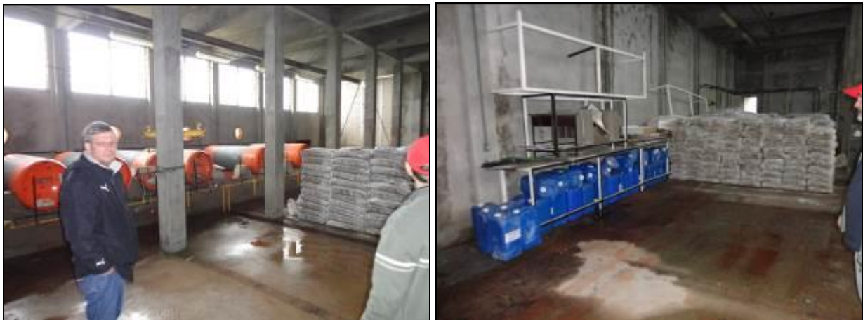
Figura 23: Depósito de produtos químicos

21) Existe almoxarifado para acondicionamento de produtos químicos (Resolução AGESAN nº11 - Art. 18º §2º)? Sim (x) Não ( ) Pendência ( ):