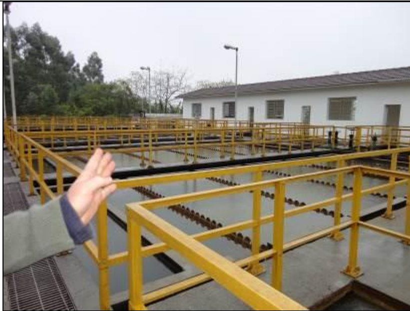
Figura 19: Área e cercada por guarda-corpo

13) Os decantadores estão em boas condições (Resolução AGESAN nº11 - Art. 15º)? Sim (x) Não ( ) - N° de decantadores: 07 (sete) .