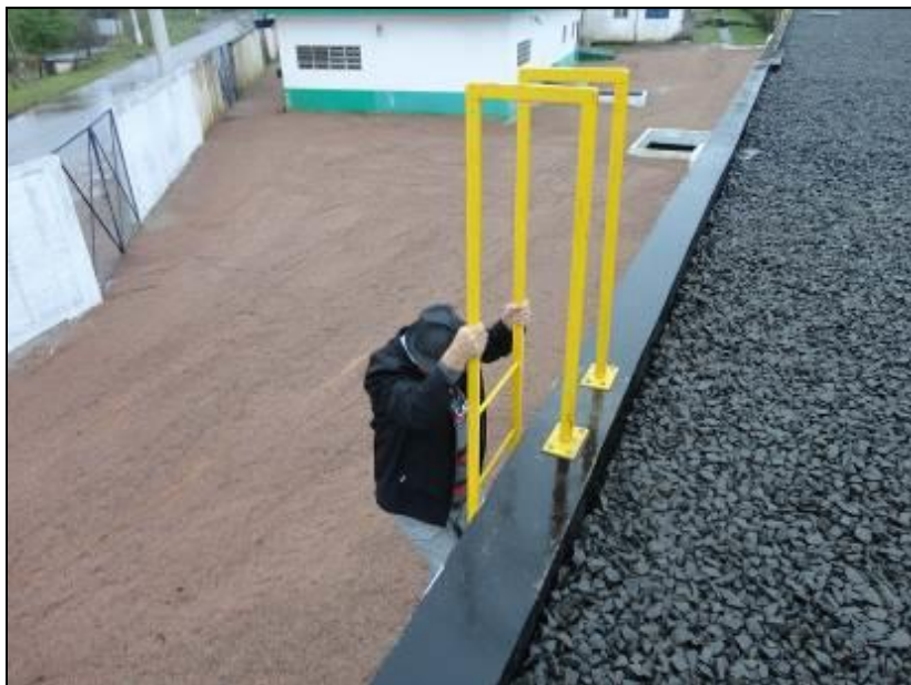
Figura 18: Escadas satisfatórias

11) As escadas de acesso estão em boas condições de uso (Resolução AGESAN nº11 - Art. 15º)? Sim (x) Não ( ) Pendência ( ):