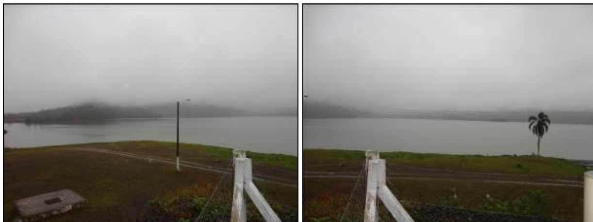
Figura 6: Manancial – Rio São Bento

Onde é tratada a água deste manancial? R.: ETA São Defende/Criciúma