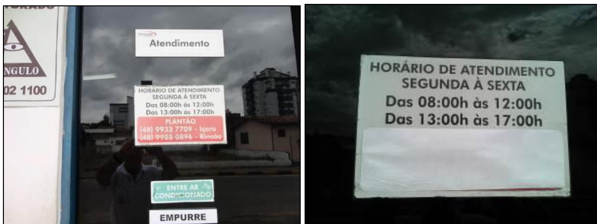
Figura 2: Cartaz de Expediente (inicial e acompanhamento)

3) Há placa indicativa do horário de funcionamento (Lei nº 8.078 - Art. 6º)? Sim (x) Não ( ) Pendência ( ):