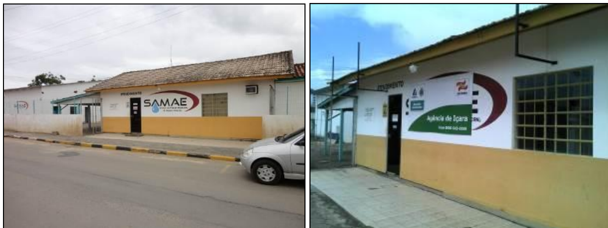
Figura 1: Fachada do Escritório (inicial e acompanhamento)

1) Existe identificação de que ali funciona um escritório de atendimento (Lei nº 8.078 Art. 6º)? Sim (x) Não ( ) Pendência ( ):