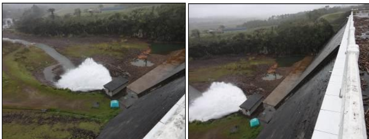
Figura 8: Barragem