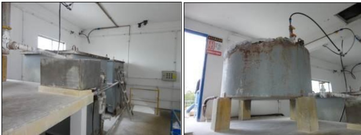
Figura 27: Estrutura da casa de química (inicial)

20) A estrutura do prédio da casa de química está aparentemente segura (Resolução AGESAN nº11 Art. 15º)? Sim (x) Não ( ) Pendência ( ):