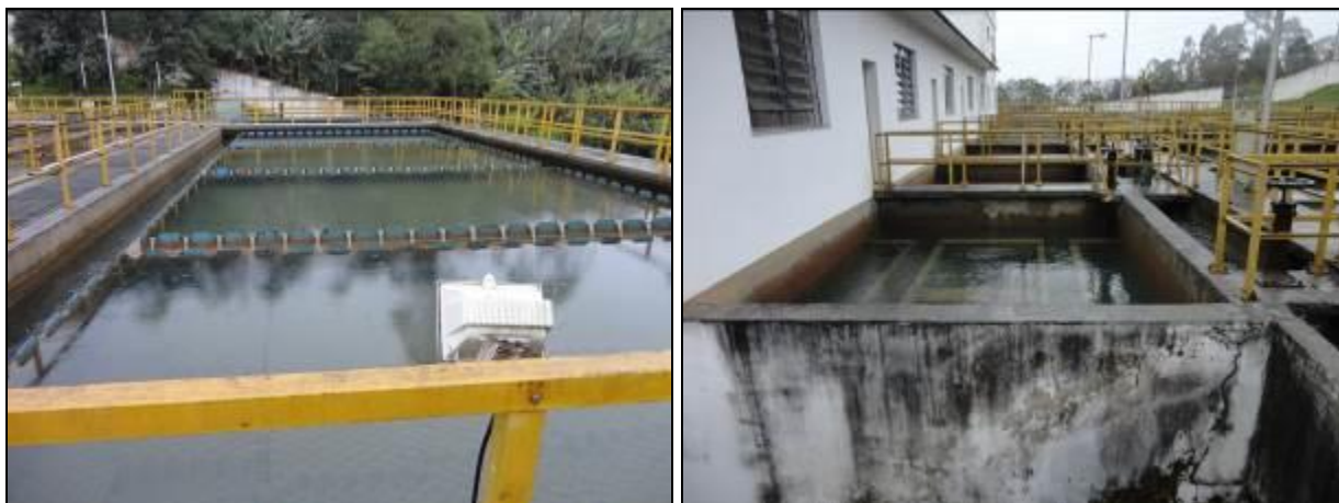
Figura 20: Estruturas de tratamento físico da ETA

18) Os instrumentos possuem tampas (Resolução AGESAN nº11 - Art. 15º)? Sim ( ) Não (x) Pendência ( )