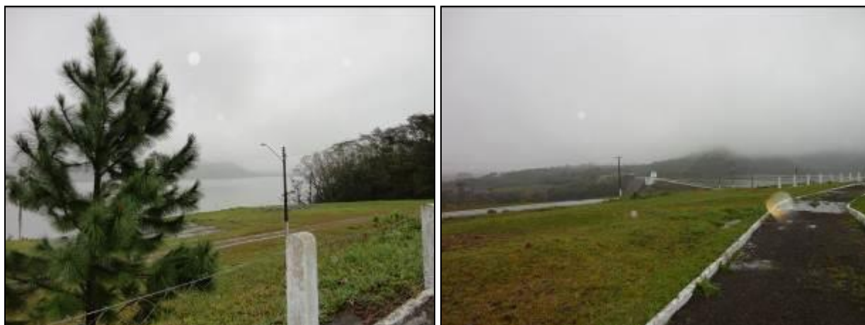
Figura 11: imagens do cercamento.

3) Existe cerca de proteção da área do manancial (Resolução AGESAN nº11- Art. 10º)? Sim (x) Não ( ) Pendência ( ):