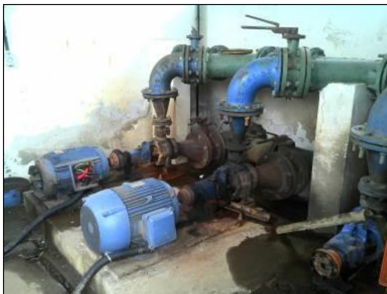
Figura 31: ERAB junto a ETA (acompanhamento)

RECOMENDAÇÃO 19: Deverá apresentar a informação em 15 (quinze) dias