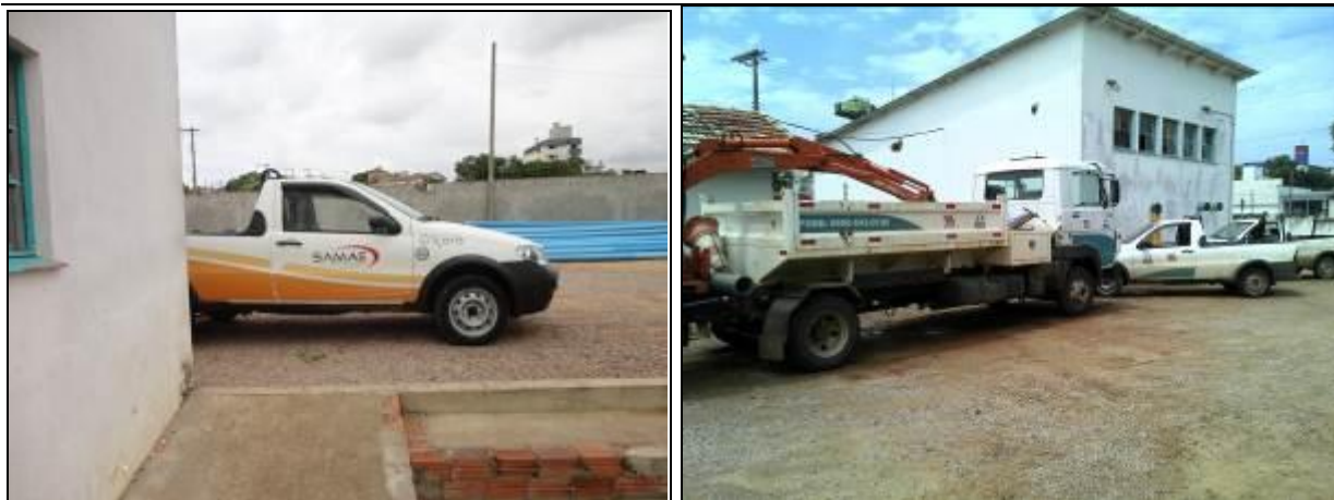
Figura 5: Frota de veículos da agência (inicial e acompanhamento)

19) O usuário é comunicado da possibilidade de acompanhamento (Lei nº 8.078 - Art. 6º) ? Sim (x) Não ( )