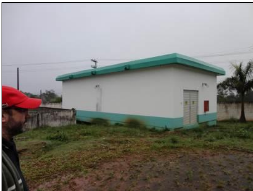
Figura 17: Entorno da ETA necessitando de melhorias

RECOMENDAÇÃO 10: Melhorar as condições gerais de limpeza e conservação da área externa da Estação.