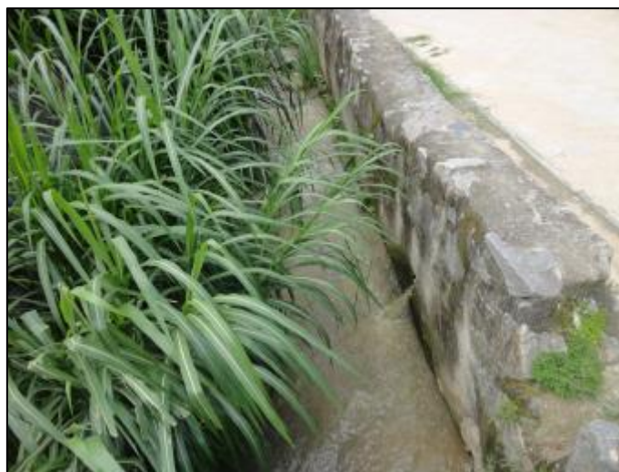
Figura 2: Lançamento do efluente bruto no córrego ao lado da Estação (18/02/2014)

No dia 06/03/2014, a AGESAN foi novamente ao local verificar se as providências solicitadas tinham sido tomadas. Porém, a situação permanecia a mesma (Figura 3).