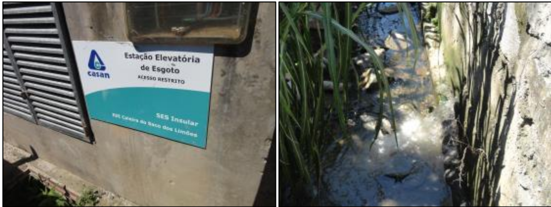
Figura 3: Lançamento do esgoto bruto (06/03/2014)

Em defesa, por meio da CT/Comitê 0081/2014 no dia 06/03/2014, a CASAN afirma que “a elevatória apresentava grande quantidade de sujeira (areia, gordura, pedras, etc) no poço de sucção, proveniente do lançamento indevido pelos usuários do sistema, o que acarretou na obstrução do rotor bomba e conseqüentemente o acionamento do sistema de segurança”. E que, “providenciamos a limpeza manual da elevatória”. Porém, em visita realizada no mesmo dia pela AGESAN, o lançamento de esgoto bruto ainda ocorria. No Relatório de Acompanhamento GEFIS nº 018/2013, de setembro de 2013, problemas de vazamento na Estação também foram verificados.