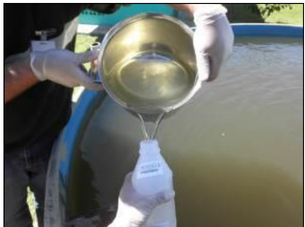
Figura 14- Coleta no ponto de saída da ETE Barra da Lagoa