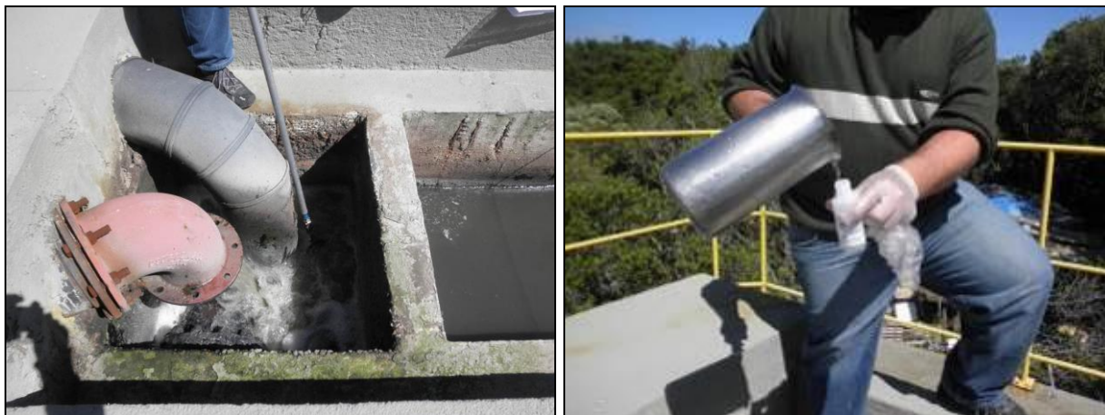
Figura 1- Coleta no ponto de entrada da ETE Lagoa da Conceição

A seguir, estão as imagens das coletas realizadas nas sete Estações de Tratamento de Esgoto de Florianópolis, tanto no ponto de entrada quanto no de saída de esgoto.