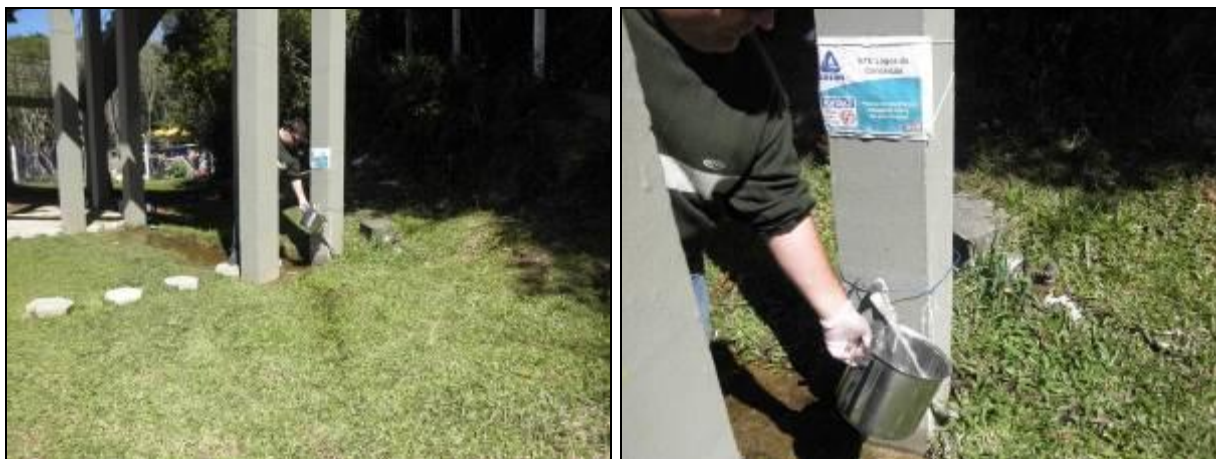
Figura 2- Coleta no ponto de saída da ETE Lagoa da Conceição