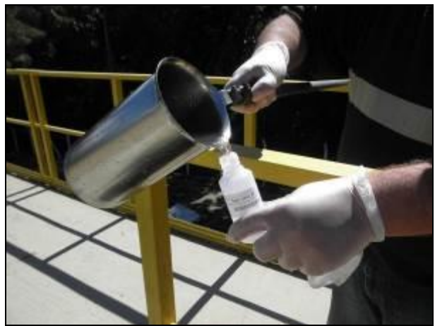
Figura 13- Coleta no ponto de entrada da ETE Barra da Lagoa