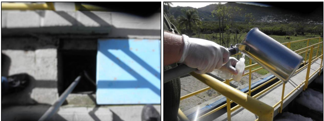
Figura 5- Coleta no ponto de entrada da ETE Saco Grande