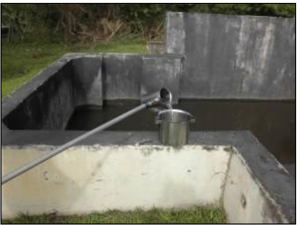
Figura 10- Coleta no ponto de saída da ETE Canasvieiras