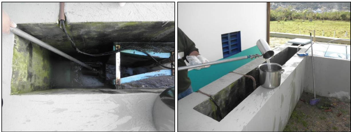
Figura 6- Coleta no ponto de saída da ETE Saco Grande