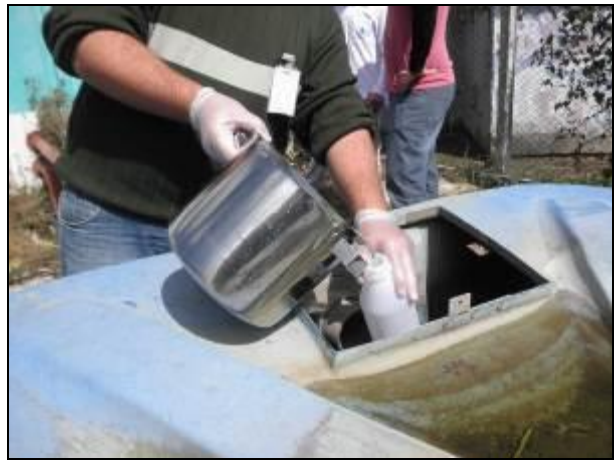
Figura 12- Coleta no ponto de saída da ETE Vila União