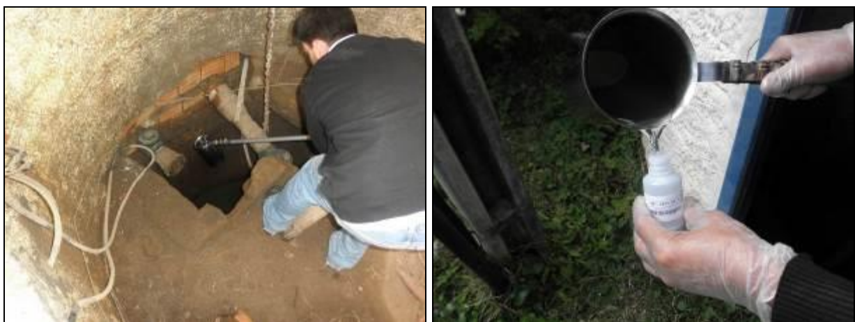
Figura 7- Coleta no ponto de entrada da ETE Praia Brava