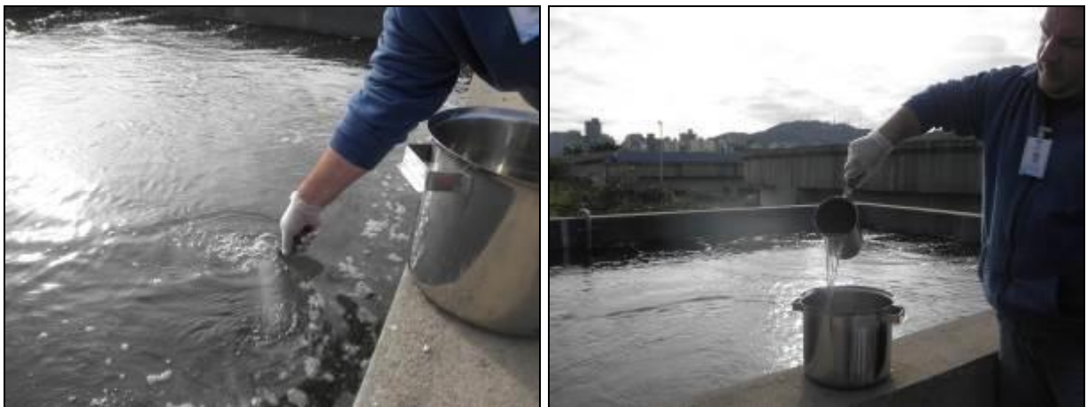
Figura 4- Coleta no ponto de saída da ETE Insular