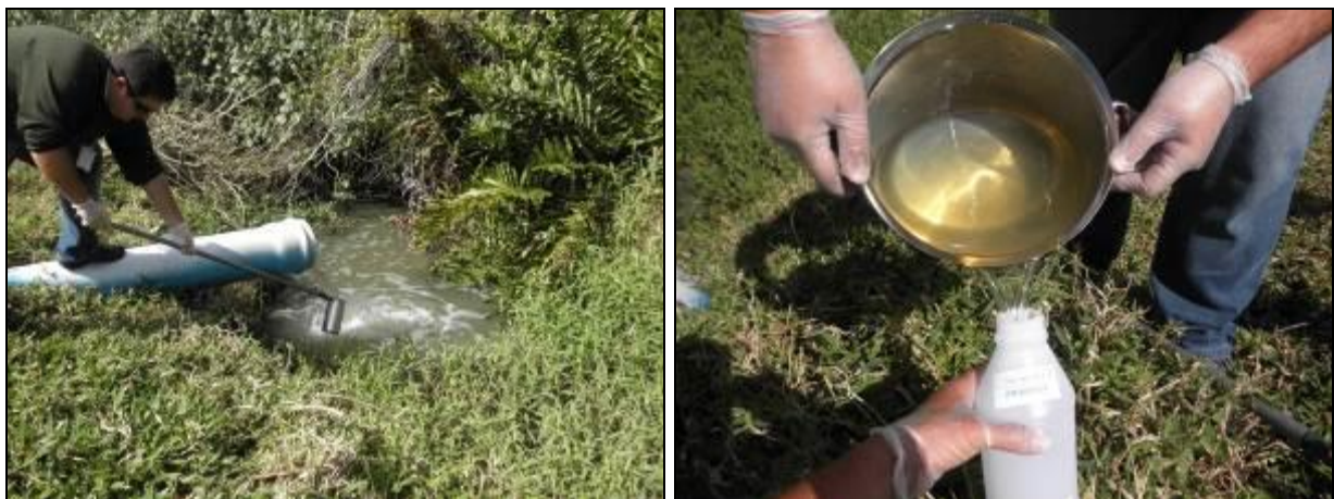
Figura 8- Coleta no ponto de saída da ETE Praia Brava