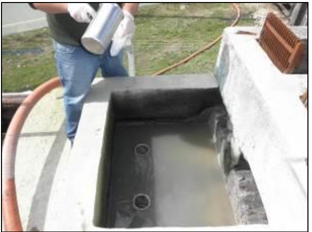
Figura 11- Coleta no ponto de entrada da ETE Vila União