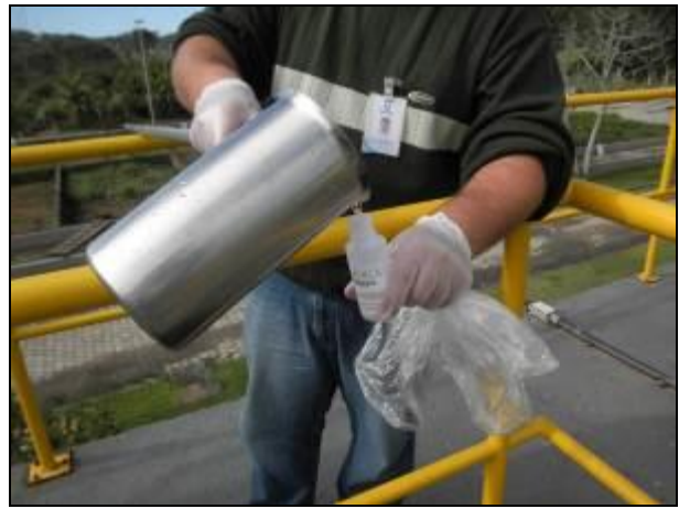
Figura 9- Coleta no ponto de entrada da ETE Canasvieiras