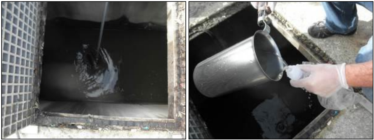
Figura 3- Coleta do ponto de entrada da ETE Insular