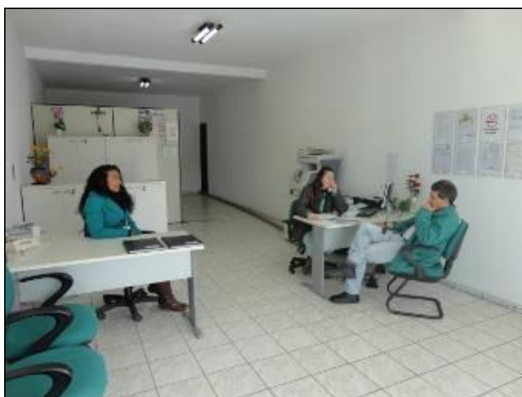
Figura 6: Aspectos internos da Agência de Antônio Carlos. (acompanhamento)

7) Os equipamentos e instalações elétricas estão em bom estado (Resolução AGESAN n° 004 - Art. 127)? Sim (x) Não ( ) Pendência ( ):