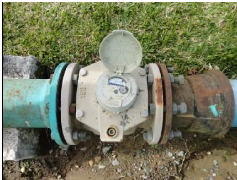
Figura 20: Macromididor

6) Existe Macromedição na entrada (Res. AGESAN nº11 - Art. 17º)? Sim ( ) Não (x)