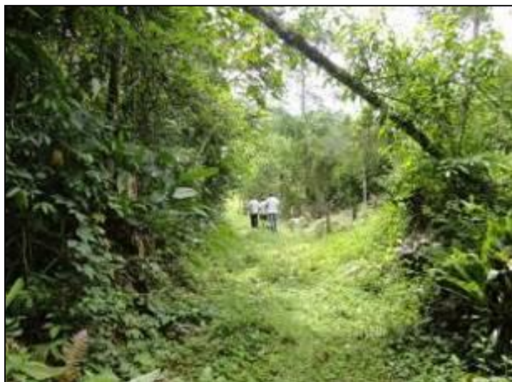
Figura 14: Acesso ao manancial (inicial)

7) Existe facilidade de acesso ao local (Resolução AGESAN nº11 - Art. 11º)? Sim (x) Não (x) Pendência ( ):