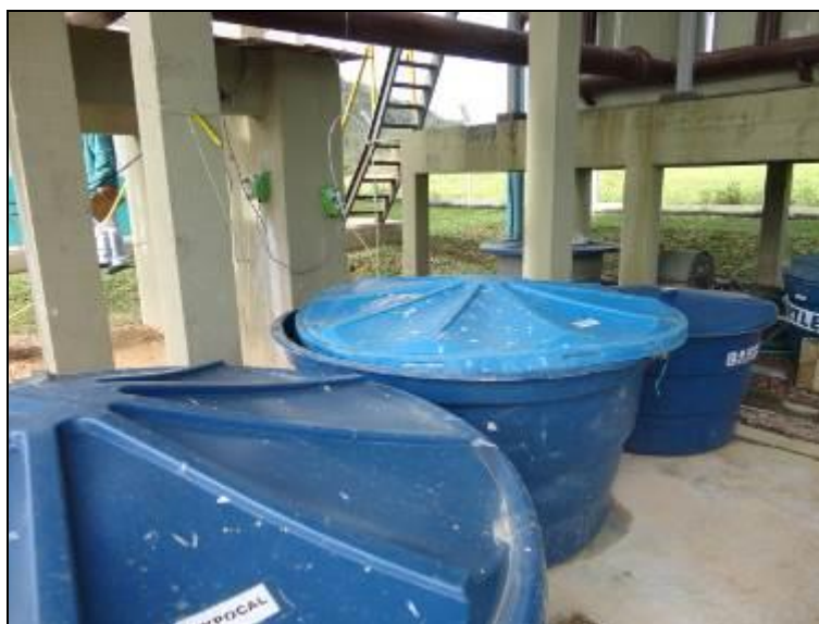
Figura 23: Casa de Química

20) A estrutura do prédio da casa de química está aparentemente segura (Resolução AGESAN nº11 Art. 15º)? Sim (x) Não ( ) Pendência ( ) :