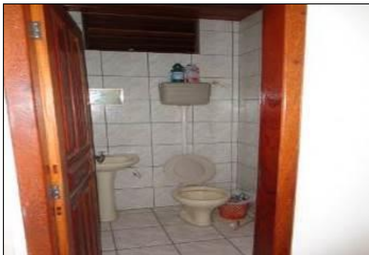
Figura 7: Instalações sanitárias em condições satisfatórias. (Inicial)