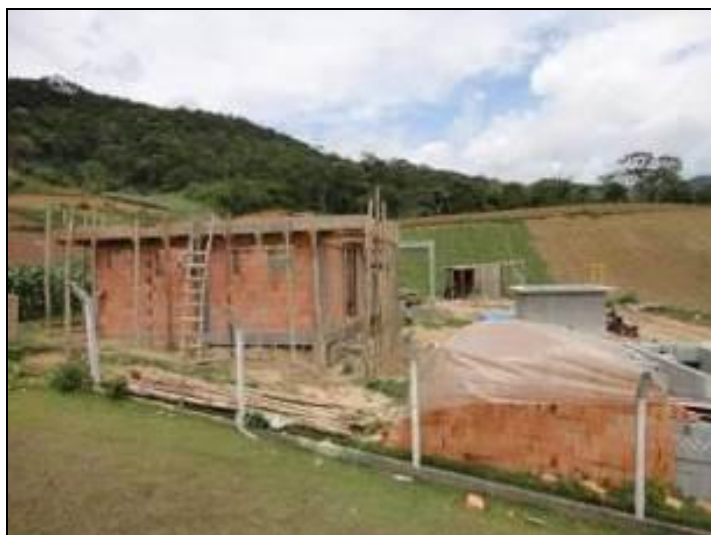
Figura 18: Obras do novo Laboratório. (Inicial)