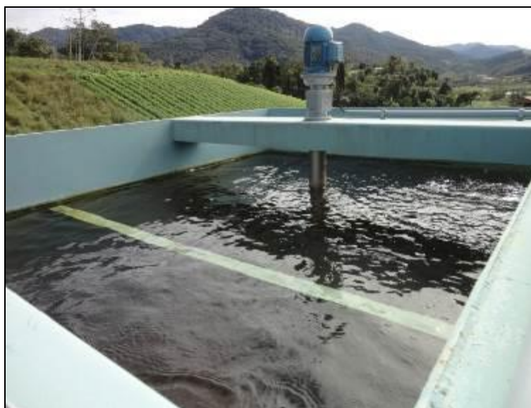
Figura 22: Decantadores

13) Os decantadores estão em boas condições (Resolução AGESAN nº11 - Art. 15º)? Sim (x) Não ( ) - N° de decantadores: 02 (dois) .