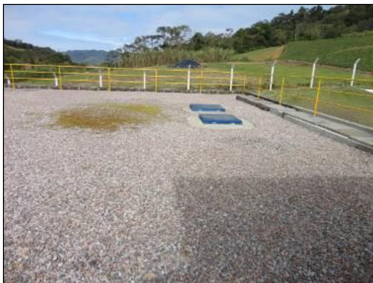
Figura 27: Cobertura do reservatório

6) As áreas de cobertura encontram-se em condições adequadas (Resolução AGESAN Nº11 - Art. 23º)? Sim (x) Não ( ) Pendência ( ):