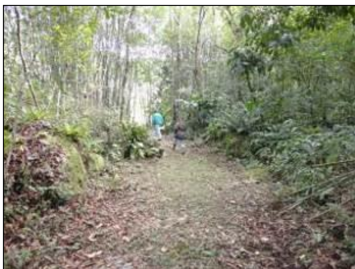
Figura 15: Acesso ao Manancial (acompanhamento)