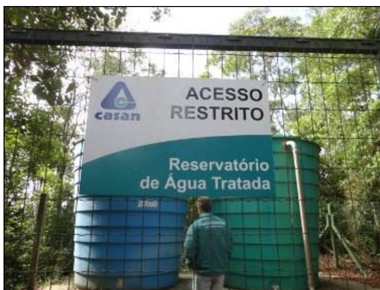
Figura 30: Identificação

1) Existem placas indicativas de propriedade e restrição de uso das áreas dos reservatórios (Resolução AGESAN nº 004 - Art.19 - §2º)? Sim (x) Não ( ) Pendência ( ):