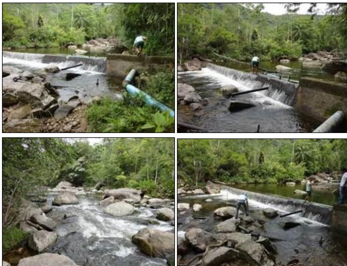
Figura 11: Visão da área de Captação de água bruta junto ao Rio Farias – Antônio Carlos (Inicial)