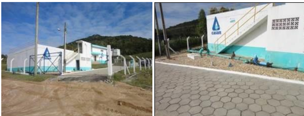
Figura 17: Obras Realizadas na ETA (Acompanhamento)