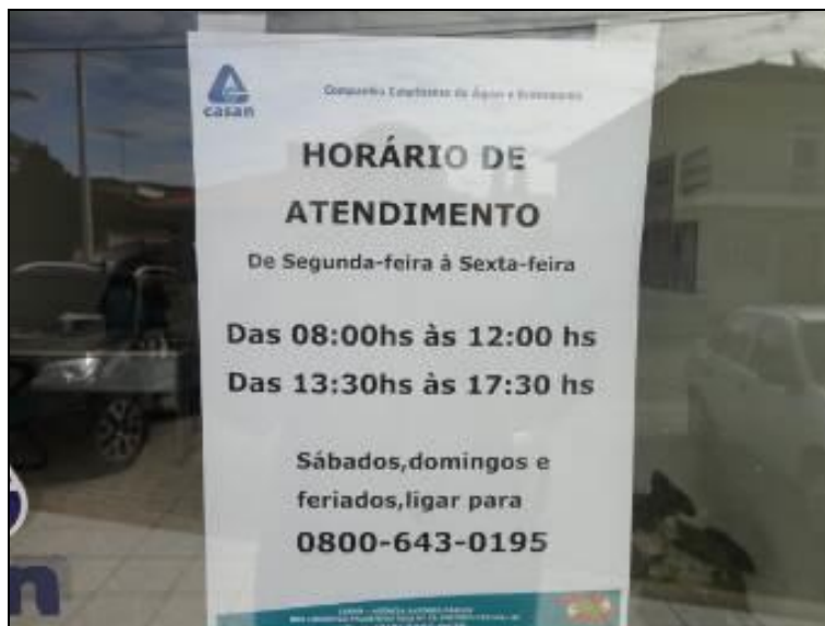
Figura 3: Placa indicativa de horário

3) Há placa indicativa do horário de funcionamento (Lei nº 8.078 - Art. 6º)? Sim (x) Não ( ) Pendência ( ):