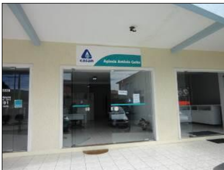
Figura 2: Fachada do escritório (acompanhamento)