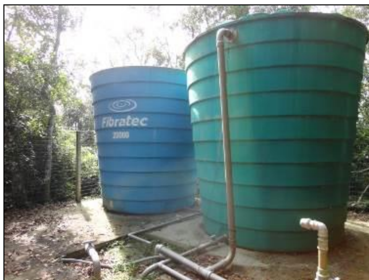
Figura 29: Reservatório Lot. Santa Catarina

Posição: Apoiado (x) Elevado ( ) Outro ( )