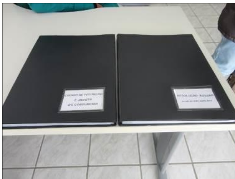
Figura 4: Manuais e Resolução

4) Existem manuais, guias e informações adequadas disponíveis aos usuários (CDC, Resoluções Agesan, etc.)? Sim (x) Não ( ) Pendência ( )