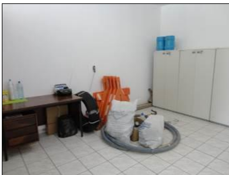
Figura 10: Aspecto do Almojarifado. (Acompanhamento)