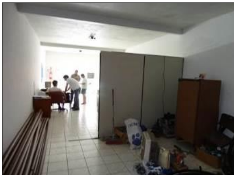
Figura 9: Aspecto do Almojarifado. (Inicial)