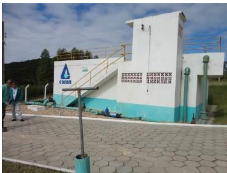
Figura 25: Reservatório junto a ETA

Posição: Apoiado (x) Elevado ( ) Outro ( )