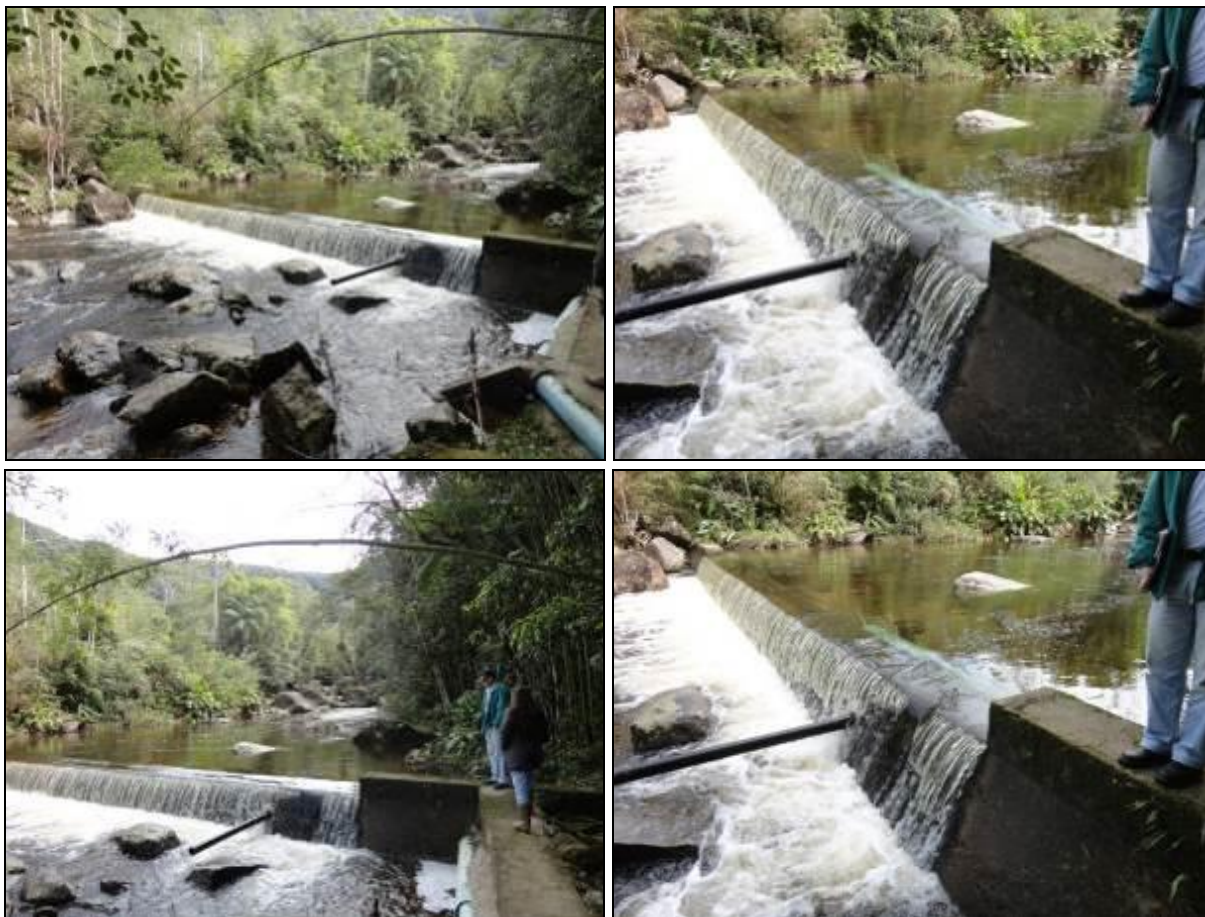
Figura 12: Visão da área de Captação de água bruta junto ao Rio Farias (acompanhamento)

Onde é tratada a água deste manancial? Na ETA – Rio Farias