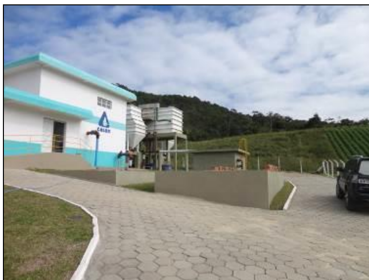
Figura 21: Vista do entorno da ETA

9) Existe cerca de proteção da ETA em bom estado de conservação (Resolução AGESAN Nº11 - Art. 15º)? Sim (x) Não ( ) Pendência ( ):