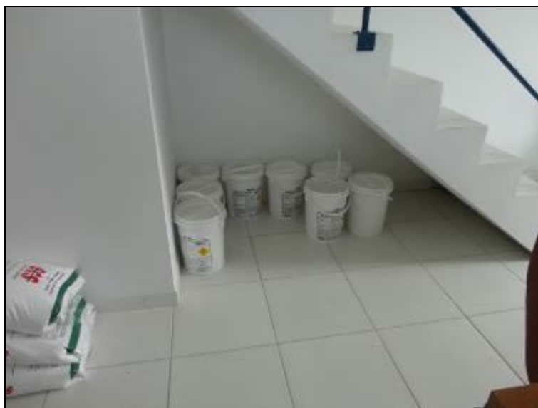
Figura 24: Acondicionamento químico