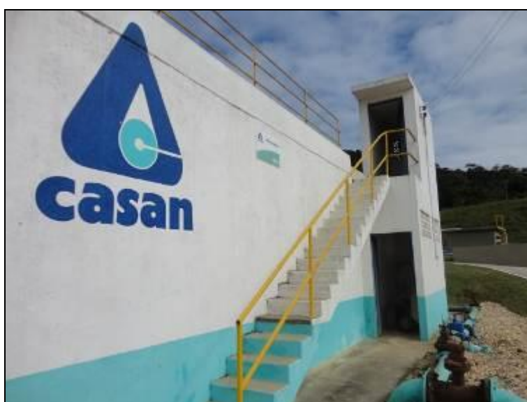
Figura 26: Escada de acesso ao Reservatório