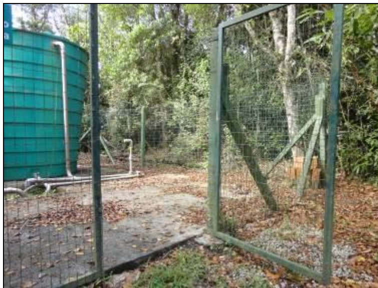
Figura 31: Entrada do Reservatório