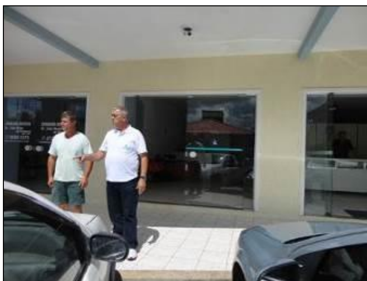
Figura 1: Fachada do Escritório (inicial)

1) Existe identificação de que ali funciona um escritório de atendimento (Lei nº 8.078 Art. 6º)? Sim (x) Não ( ) Pendência ( ):