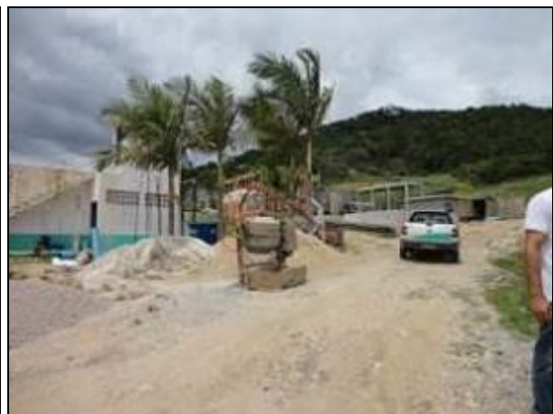
Figura 16: - Obras na ETA devem melhorar consideravelmente as condições de tratamento da água de Antônio Carlos (inicial)