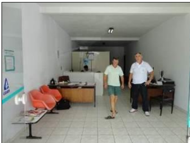
Figura 5: Aspectos internos da Agência de Antônio Carlos. (Inicial)