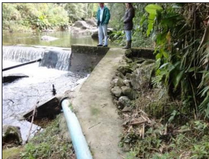
Figura 13: Área em torno do manancial sem proteção

7) Existe facilidade de acesso ao local (Resolução AGESAN nº11 - Art. 11º)? Sim (x) Não (x) Pendência ( ):