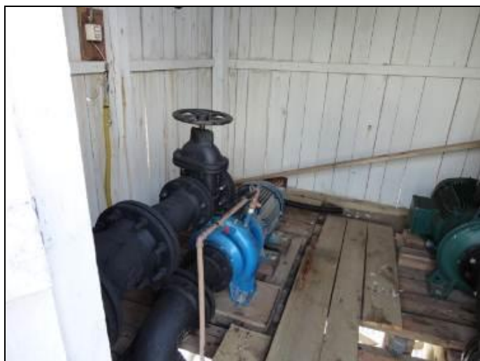
Figura 17: ERAB - 01

1) Estão devidamente identificadas? Sim ( ) Não (x) Pendência ( ):