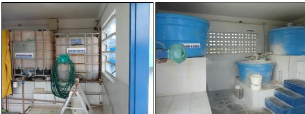
Figura 15: Casa de Química