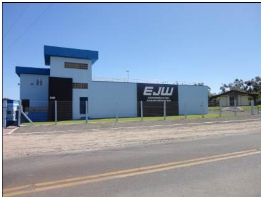
Figura 10: Fachada da ETA

2) O acesso à ETA está em boas condições (Resolução AGESAN N°11 - Art. 15°)? Sim (x) Não ( ) Pendências ( ):