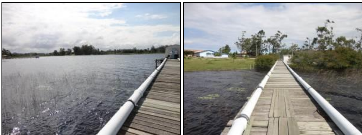
Figura 6: Captação Poço 1.

Onde é tratada a água deste manancial? Na ETA