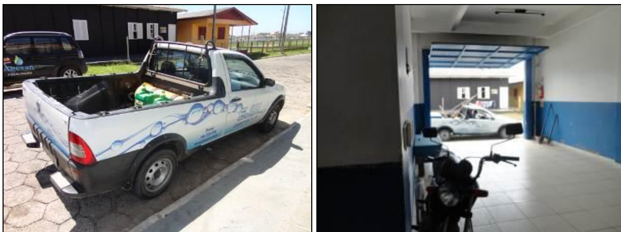
Figura 5: Veículos da Agência

9) Existem veículos para uso dos funcionários? Sim (x) Não ( ) Pendência ( ): Quantos? (relacionar com marca, tipo e placa) Obs.: Não Informado.