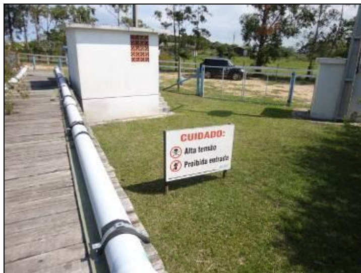
Figura 18: ERAB - 01

1) Estão devidamente identificadas? Sim ( ) Não (x) Pendência ( ):