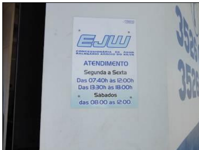
Figura 2: Cartaz com Horário de Expediente.

3) Há placa indicativa do horário de funcionamento (Lei nº 8.078 - Art. 6º)? Sim (x) Não ( ) Pendência ( ):