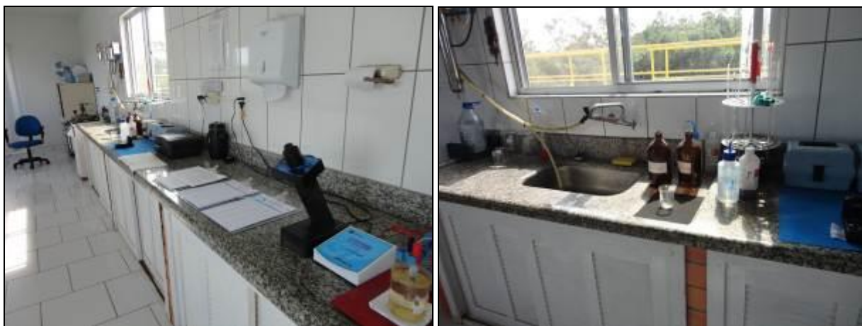
Figura 11: Laboratório da ETA

4) Quais parâmetros são analisados na ETA local? Cloro ( ) / Flúor ( ) / PH ( ) / Cor ( ) / Turbidez ( ) / Outros: _____ . Obs.: Não Informado.