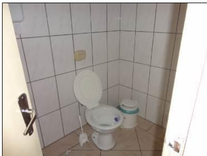
Figura 3: Sanitário Disponível

5) Encontra-se em boas condições de higiene e limpeza? Sim (x) Não ( )