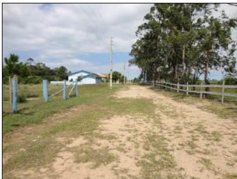
Figura 9: Acesso a área de captação

7) Existe facilidade de acesso ao local (Resolução AGESAN nº11 - Art. 11º)? Sim (x) Não ( ) Pendência ( ):