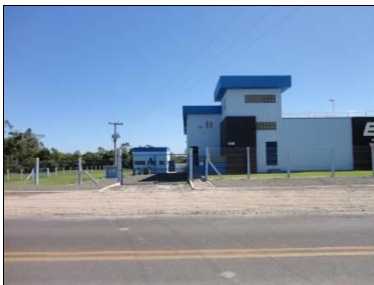
Figura 12: Cercamento da ETA

9) Existe cerca de proteção da ETA em bom estado de conservação (Resolução AGESAN Nº11 - Art. 15º)? Sim (x) Não ( ) Pendência ( ):