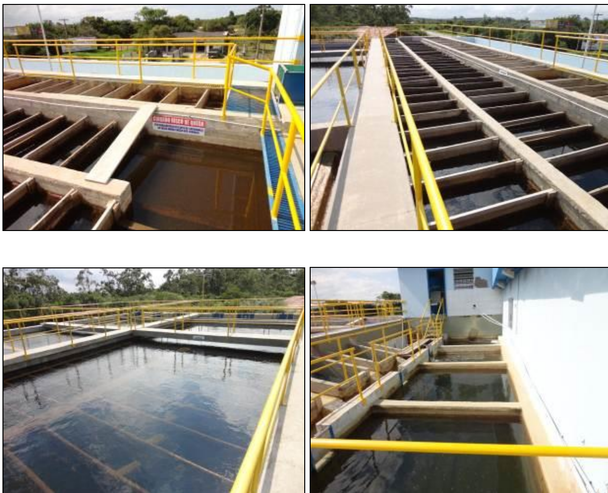
Figura 13: Estruturas de tratamento físico da água.

13) Os decantadores estão em boas condições (Resolução AGESAN nº11 - Art. 15º)? Sim (x) Não ( ) - Nº de decantadores: 04 (quatro)