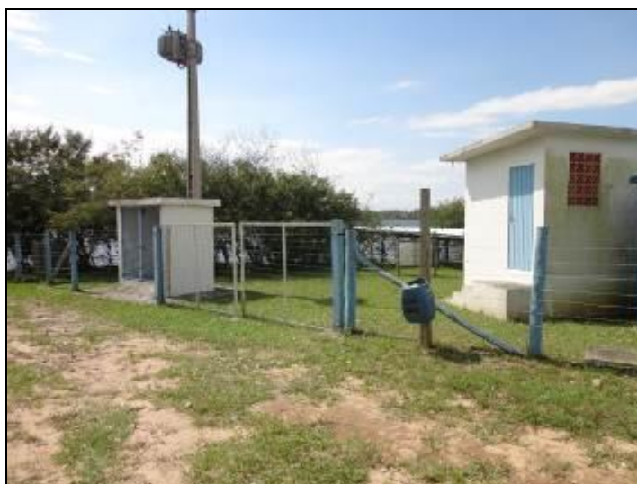
Figura 7: Entrada da área de captação

3) Existe cerca de proteção da área do manancial (Resolução AGESAN nº11- Art. 10º)? Sim (x) Não ( ) Pendência ( ):