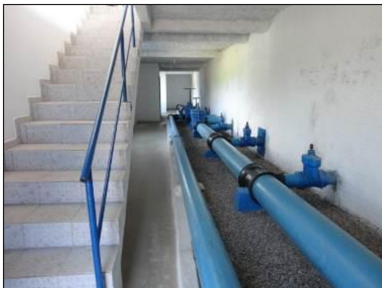
Figura 14: Escadas de acesso à área de tratamento.