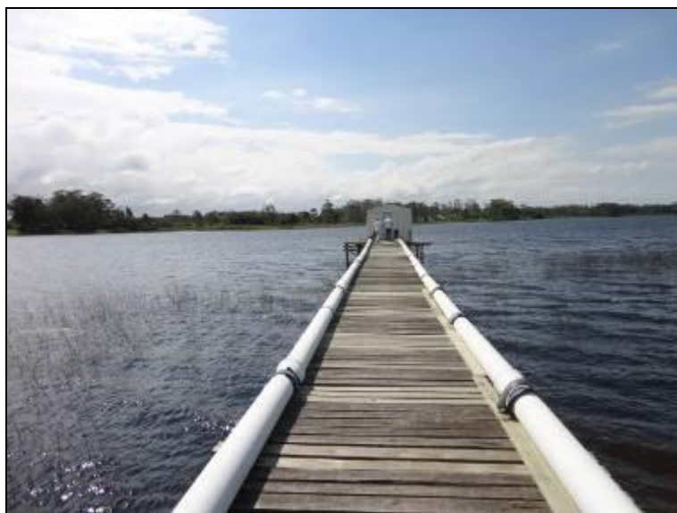
Figura 8: Trapiche que leva ao crivo de captação.

5) O tipo de captação é adequado (NBR 12.213)? Sim (x) Não ( ) Pendência ( ):