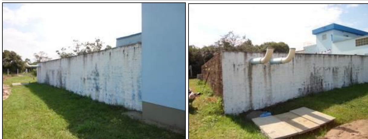
Figura 16: Reservatório R-01

01) Existe facilidade de acesso ao local? Sim (x) Não ( )