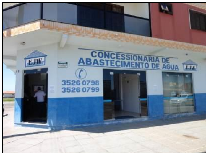
Figura 1: Fachada do Prédio

1) Existe identificação de que ali funciona um escritório de atendimento (Lei nº 8.078 Art. 6º)? Sim (x) Não ( ) Pendência ( ):