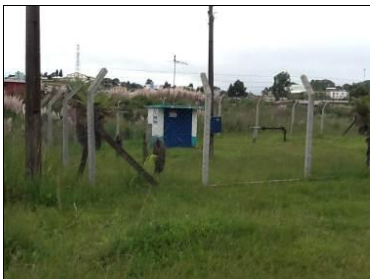
Figura 7: Poço 1

3) Existe cerca de proteção da área do manancial (Resolução AGESAN nº11- Art. 10º)? Sim (x) Não ( ) Pendência ( ):