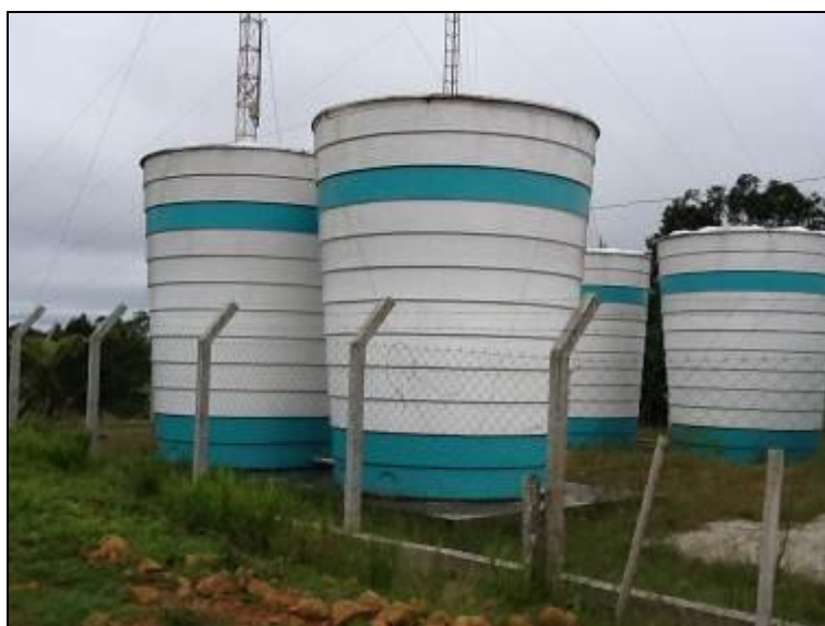
Figura 12: Reservatório R-02.

2) Existem placas indicativas de propriedade e restrição de uso das áreas dos reservatórios (Res. AGESAN nº 004 - Art.19 - §2º)? Sim ( ) Não (x) Pendência ( ):