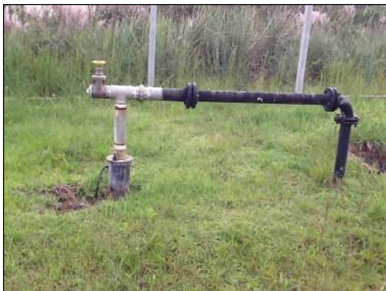
Figura 6: Manancial 1

Onde é tratada a água deste manancial? Casa de Química anexa.