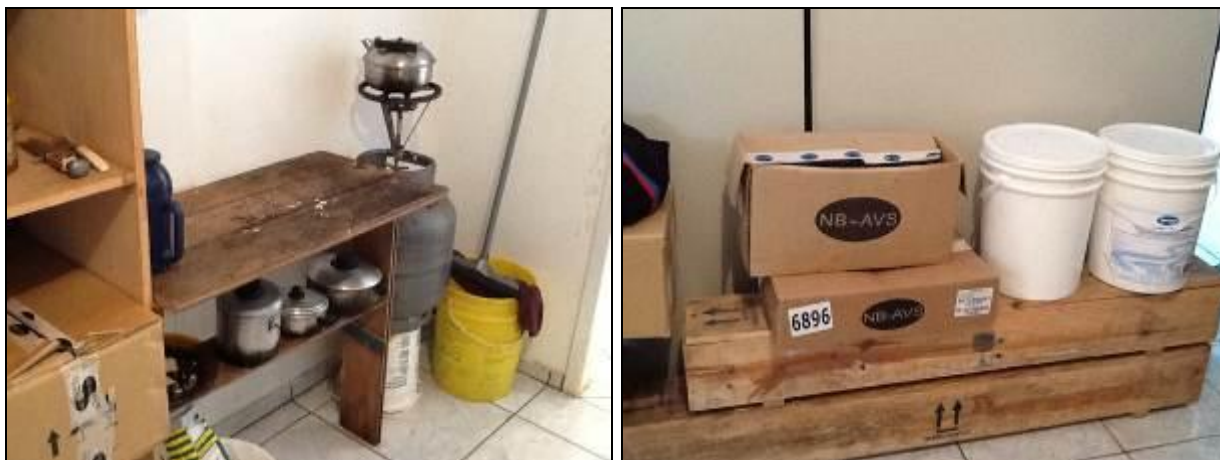
Figura 4: Outras áreas do Escritório.

14) As condições gerais de limpeza são favoráveis (Resolução AGESAN Nº 004 - Art. 127)? Sim ( ) Não (x) Pendência ( ):