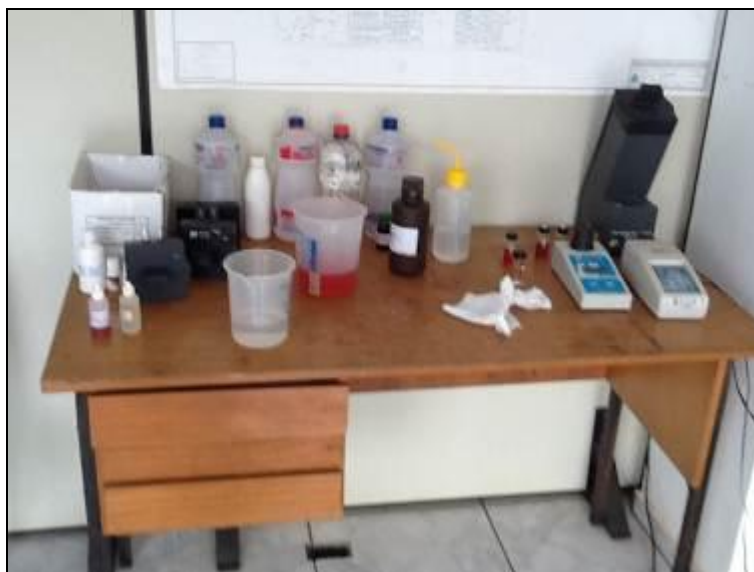
Figura 10: Laboratório em condições inadequadas, junto ao escritório.

3) As condições do Laboratório são adequadas? Sim ( ) Não (x) Pendência ( ):