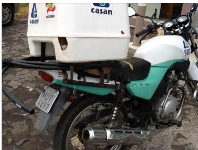
Figura 5: Veículo que atende a Unidade.