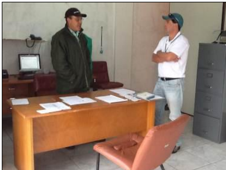
Figura 2: Estrutura do Escritório

6) As condições de mobiliário são favoráveis (Resolução AGESAN nº 004 - Art. 127)? Sim ( ) Não (x) Pendência ( ):