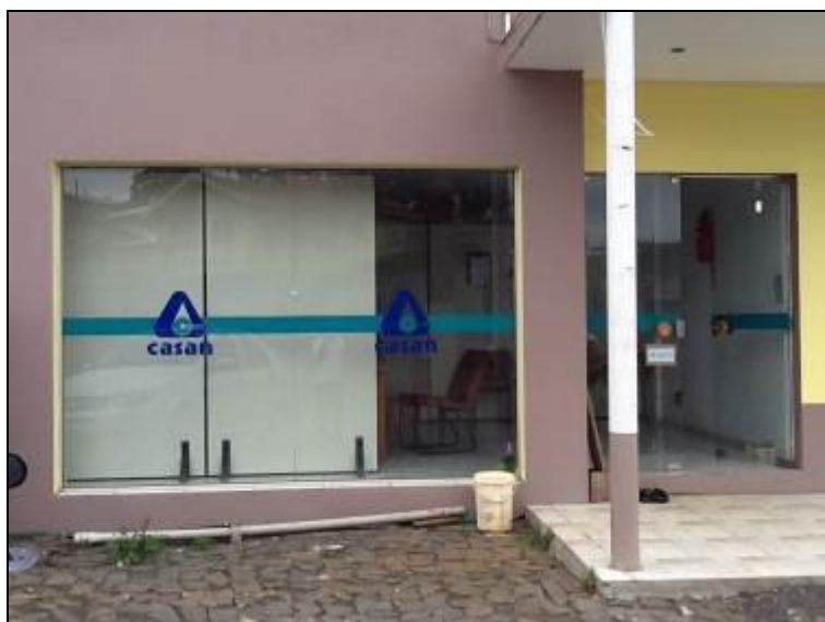
Figura 1: Fachada do Escritório Local