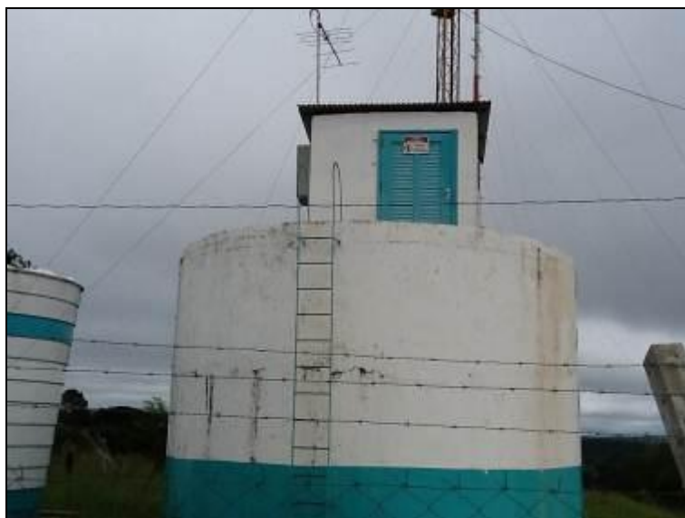
Figura 11: Reservatórios R-01.

1) Existe facilidade de acesso ao local? Sim (x) Não ( )