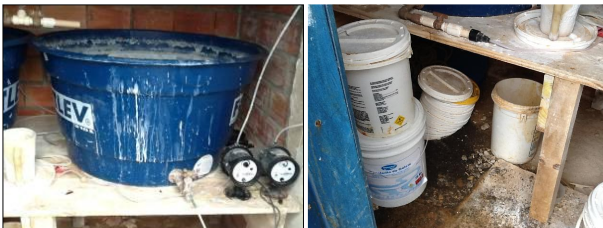
Figura 9: Casa de Química.

1) A ETA possui licenciamento do órgão AMBIENTAL para funcionamento (Conama 237/97 Anexo 1)? Sim ( ) Não (x) - Nº: xxxxxxxxxxxxxxxxxxxxxxxx