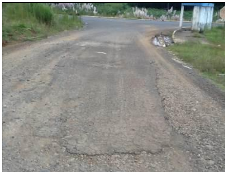
Figura 8: Acesso à captação

7) Existe facilidade de acesso ao local (Resolução AGESAN nº11 - Art. 11º)? Sim (x) Não ( ) Pendência ( ):