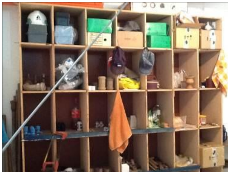
Figura 4: Almoxarifado

11) Existe almoxarifado em boas condições? Sim ( ) Não (x) Pendência ( ): RECOMENDAÇÃO 05: Providenciar adequação.