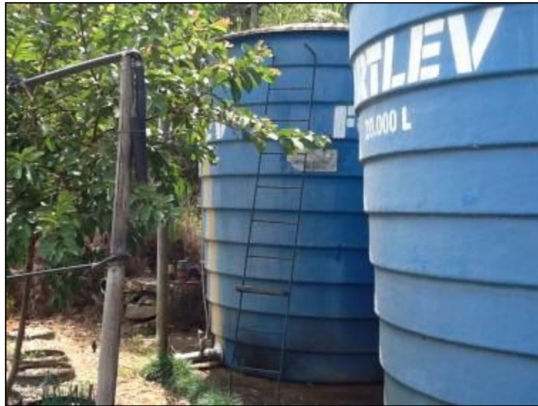
Escada de Acesso

6) Existem escadas em boas condições de uso (Resolução AGESAN N°11 - Art. 23º)? Sim ( ) Não ( ) Pendência ( ): Não se aplica.