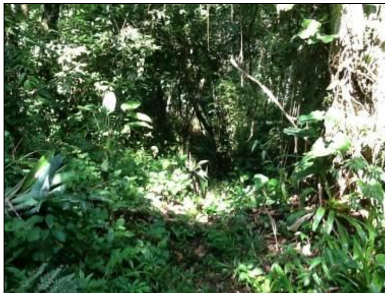
Área do Manancial superficial: não identificada, nem isolada.

4) O volume captado atualmente garante o abastecimento de água sem haver colapso no abastecimento (NBR 12211 item 5.5)? Sim (x) Não ( ) Pendência ( ):