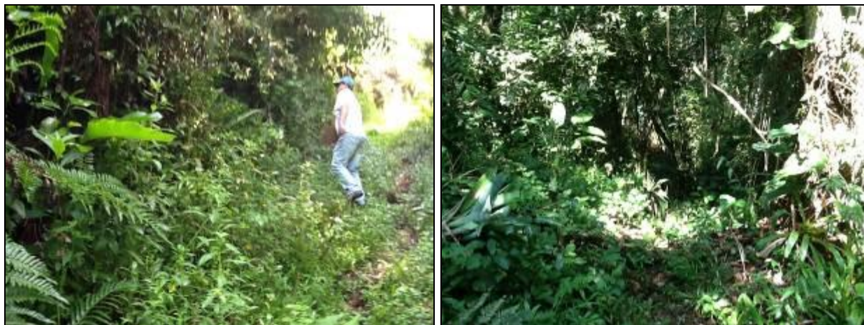
Acesso à área de captação superficial.

RECOMENDAÇÃO 09: Melhorar as condições de acesso, especialmente com relação à segurança.