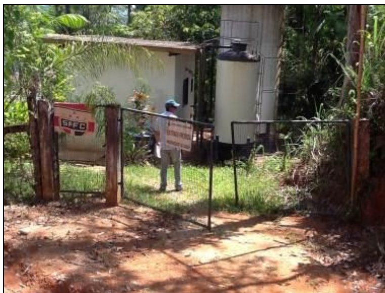
Fachada da ETA

1) A ETA possui licenciamento do órgão AMBIENTAL para funcionamento (Conama 237/97 Anexo 1)? Sim ( ) Não (x) - Nº: Não