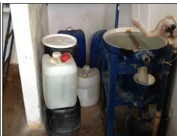
Casa de Química da ETA.

20) Existe almoxarifado para acondicionamento de produtos químicos (Resolução