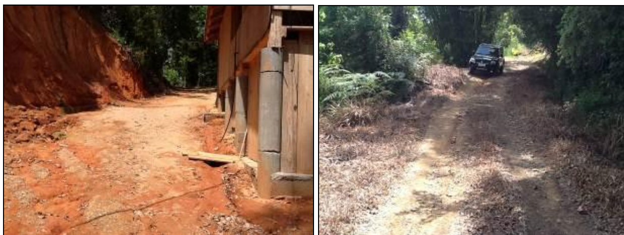
Acesso à ETA

RECOMENDAÇÃO 13: Apresentar projeto/proposta de melhorias gerais, recuperação do decantador/filtro, etc.