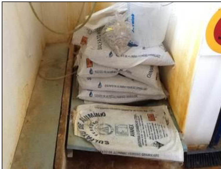
Acondicionamento de produtos químicos.

AGESAN N°11 - Art. 18° §2°)? Sim ( ) Não (x) Pendência ( ):