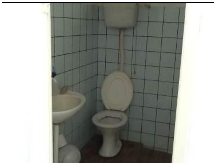
Sanitário do Escritório.

6) Existe sanitário disponível para uso dos funcionários (Resolução AGESAN nº 004 Art. 127)? Sim (x) Não ( ) Encontra-se em boas condições de higiene e limpeza? Sim (x) Não ( ) Pendência ( ):