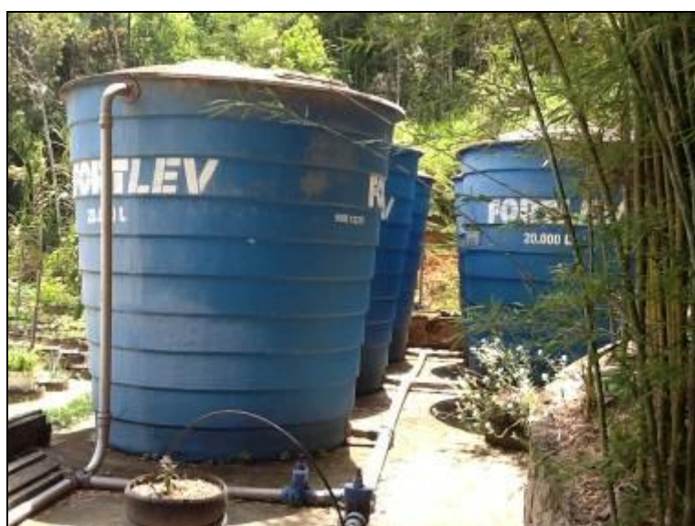
Pátio dos Reservatórios

RECOMENDAÇÃO 21: Providenciar adequado isolamento.