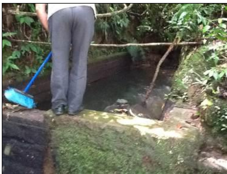
Área Manancial 1: Rio Bonito

a) Manancial 1: Rio Água Fria - Localização: Morro do Descanso.