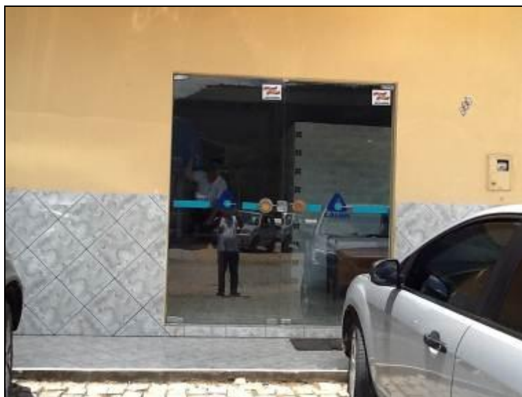
Fachada do Escritório.

Endereço: Rua José de Souza, 239 – Centro – Major Gercino – SC