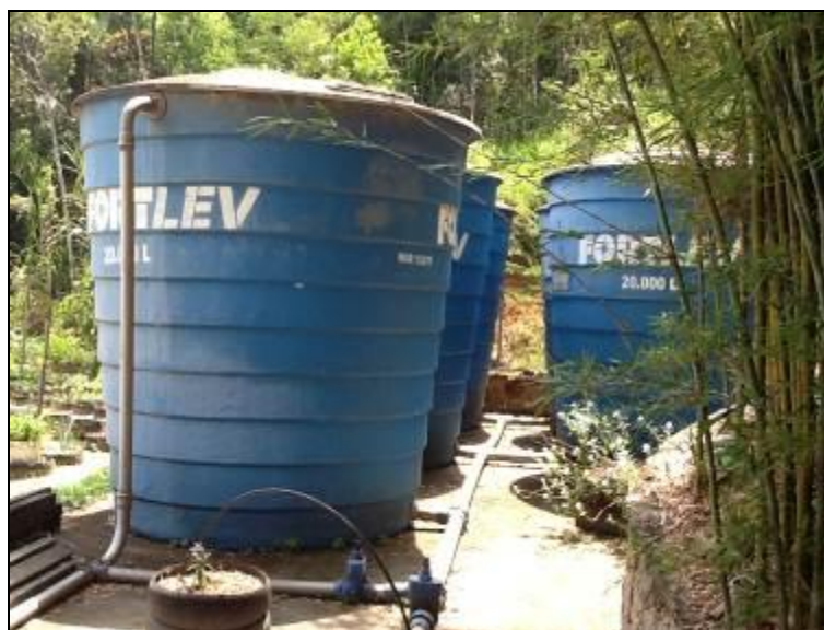
R-01 a R04: reservatórios de fibra.

3) Existem placas indicativas de propriedade e restrição de uso das áreas dos reservatórios (Resolução AGESAN N° 004 - Art.19 - §2º)? Sim ( ) Não (x) Pendência ( ):