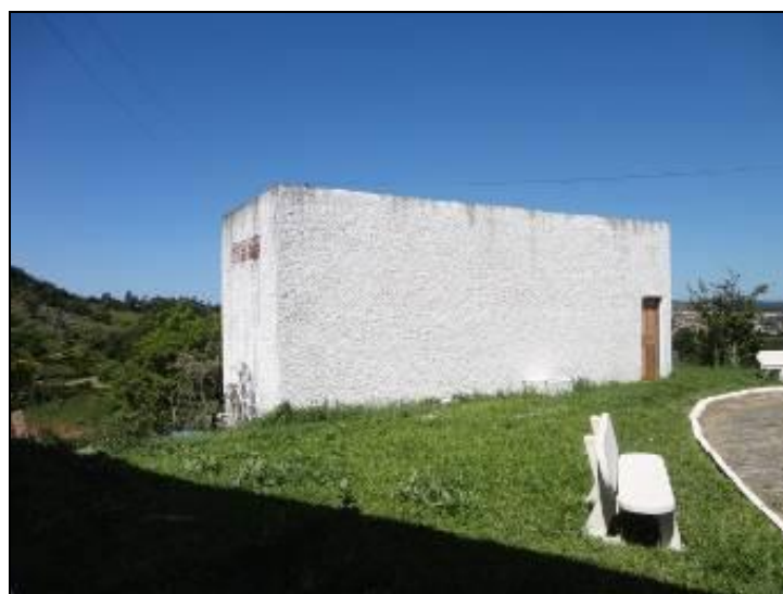
Figura 17 – R 3 – Morro da Cruz

Posição: Apoiado (x) Elevado ( ) Outro ( )