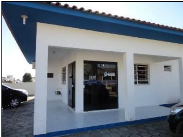
Figura 1: Fachada da Sede da SAME em Jaguaruna.

1) Existe identificação de que ali funciona um escritório de atendimento (Lei nº 8.078 Art. 6º)? Sim ( ) Não ( ) Pendência (x): Obs.: Deverá ser dado mais destaque à CASAN, proprietária do edifício, e não a SDR que ocupa espaço por empréstimo.