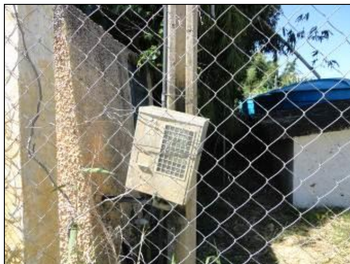
Figura 29 – Quadro de Energia

4) O disjuntor está devidamente trancado? Sim (x) Não ( ) Pendência ( ):