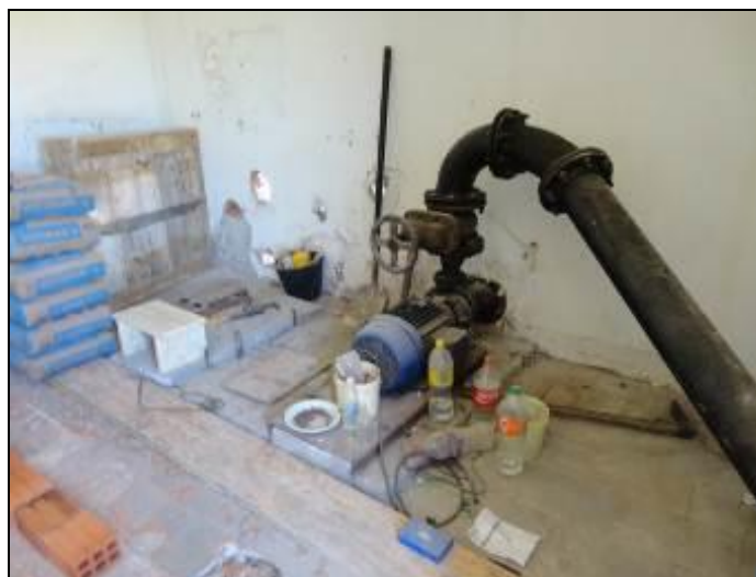
Figura 13: Guarda de produtos químicos

22) Existem vazamentos nas instalações - tubos, registros, etc.? (Resolução AGESAN nº11 - Art. 15º) ? Sim ( ) Não (x) Pendência ( ):