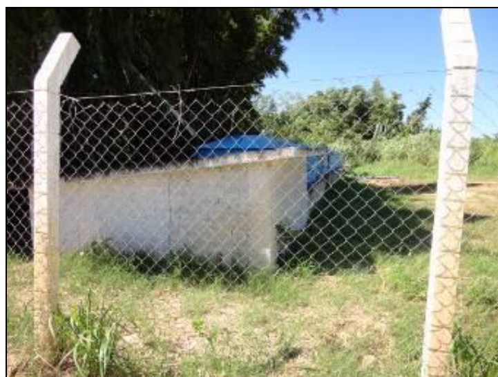
Figura 27 – Identificação ERAT

1) Estão devidamente identificadas? Sim ( ) Não (x) Pendência ( ):