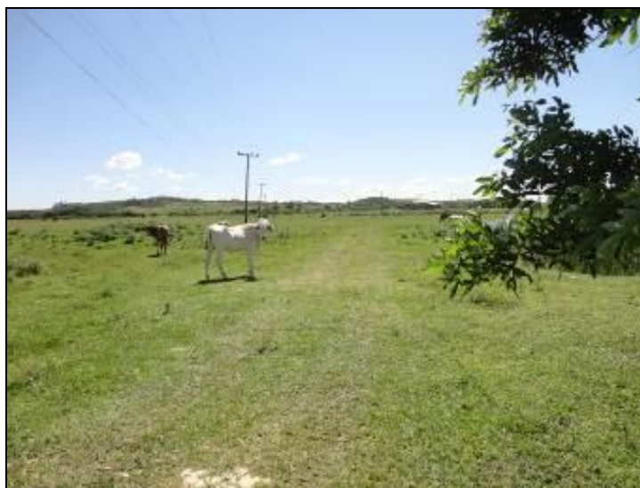
Figura 8: Local de acesso com presença de animais.

18) Existe proteção contra enchentes e entrada de pessoas estranhas e animais (Resolução AGESAN N°11 - Art. 10º)? Sim (x) Não ( ) Pendência ( ):