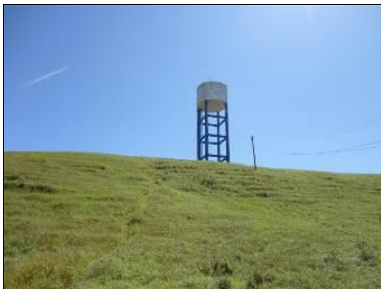
Figura 20 – Entorno do reservatório

4) As áreas estão devidamente cercadas e trancadas (Resolução AGESAN nº11 - Art. 23º)? Sim (x) Não ( ) Pendência ( ):