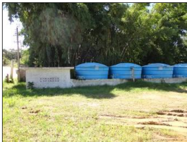
Figura 28 – Isolamento da ERAT

2) Estão devidamente isoladas? Sim (x) Não ( ) Pendência ( ):