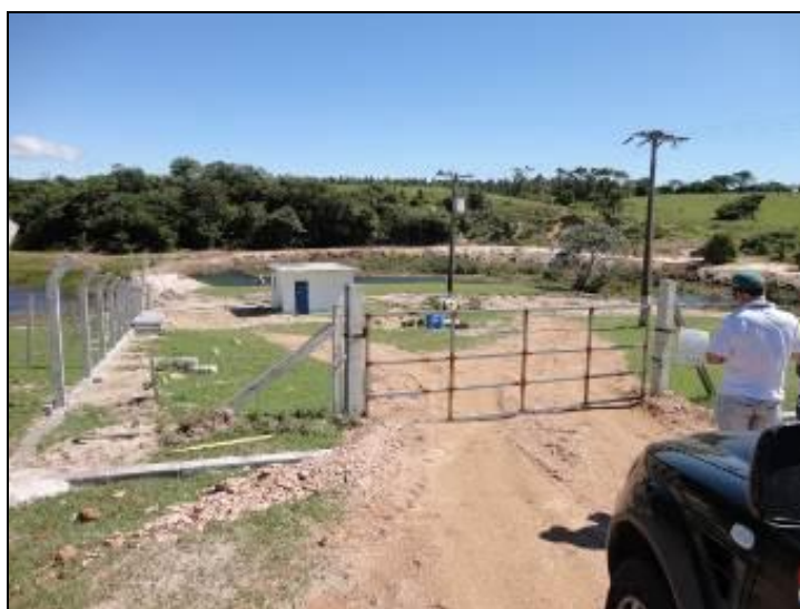
Figura 11: Cercas de proteção.

8) Existe cerca de proteção da ETA em bom estado de conservação (Resolução AGESAN N°11 - Art. 15º)? Sim (x) Não ( ) Pendência ( ):