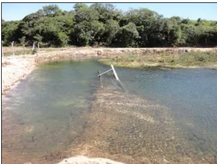
Figura 3: Captação Arroio Grande.

Onde é tratada a água deste manancial? ETA -