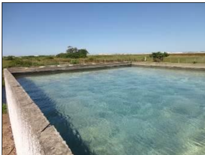
Figura 12: Decantadores