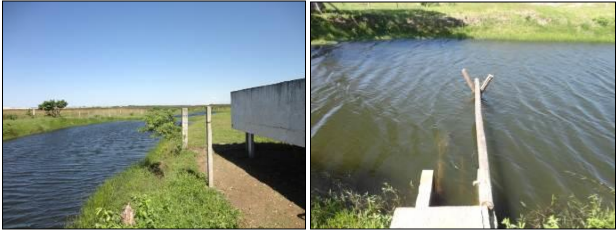
Figura 6: Lagoa da Encantada

11) Outorga de Uso (Lei nº 9.433/97 - Art. 12º): Sim ( ) Não ( ) Pendência (x):