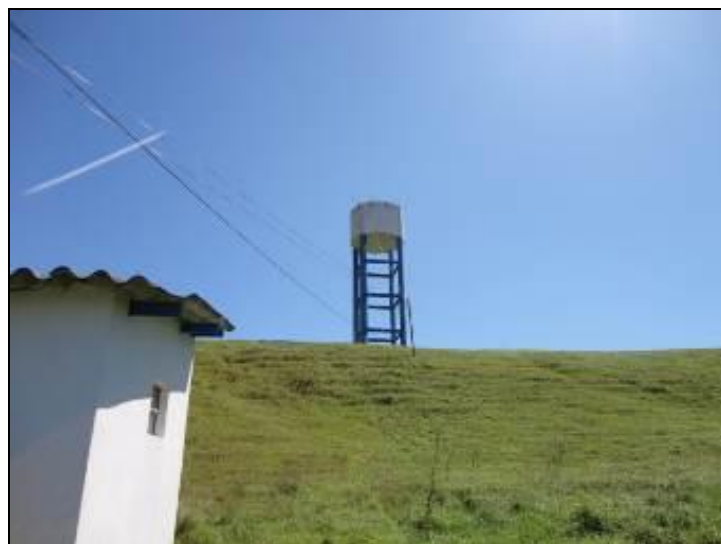
Figura 16 – R-2 Lagoa da Encantada

c) Reservatório n – Endereço: Morro da Cruz