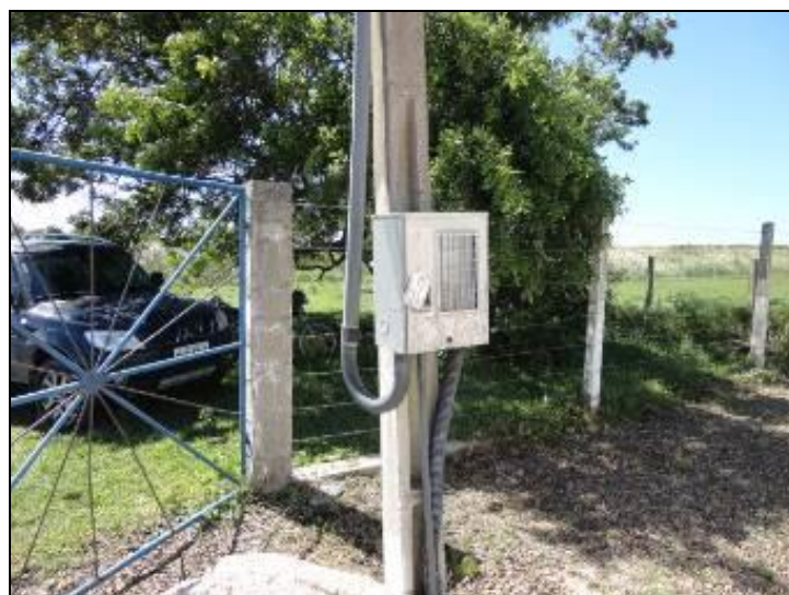
Figura 26 – Quadro Disjuntor

4) O disjuntor está devidamente trancado? Sim (x) Não ( ) Pendência ( ):