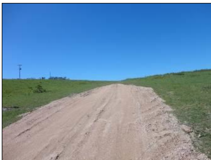
Figura 5 – Acesso a Captação

8) Existe proteção contra enchentes e entrada de pessoas estranhas e animais (Resolução AGESAN N°11 - Art. 10º)? Sim (x) Não (x) Pendência ( ):