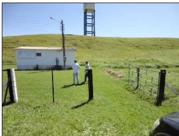
Figura 14: Vista da ETA Garopaba do Sul

Qual região é atendida por esta Estação? Obs.: Não Informado .