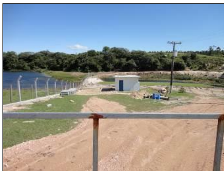
Figura 24: Área isolada da ERAB

2) Estão devidamente isoladas? Sim (X) Não ( ) Pendência ( ):