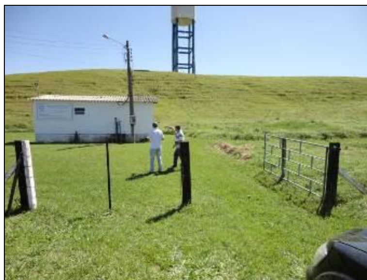
Figura 21 – Área cercada

4) As áreas estão devidamente cercadas e trancadas (Resolução AGESAN nº11 - Art. 23º)? Sim (x) Não ( ) Pendência ( ):