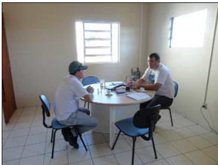
Figura 2: Áreas internas da administração

7) Os equipamentos e instalações elétricas estão em bom estado (Resolução AGESAN nº 004 - Art. 127)? Sim (x) Não ( ) Pendência ( ):