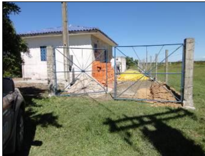
Figura 7: Entrada da área de captação Lagoa da Encantada

13) Existe cerca de proteção da área do manancial (Resolução AGESAN nº11- Art. 10º)? Sim (x) Não ( ) Pendência ( ):