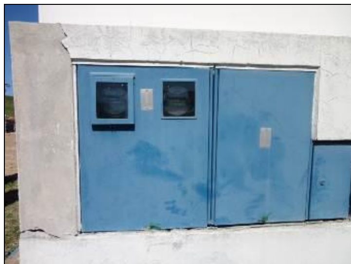
Figura 25 – Quadro de Energia

4) O disjuntor está devidamente trancado? Sim (x) Não ( ) Pendência ( ):