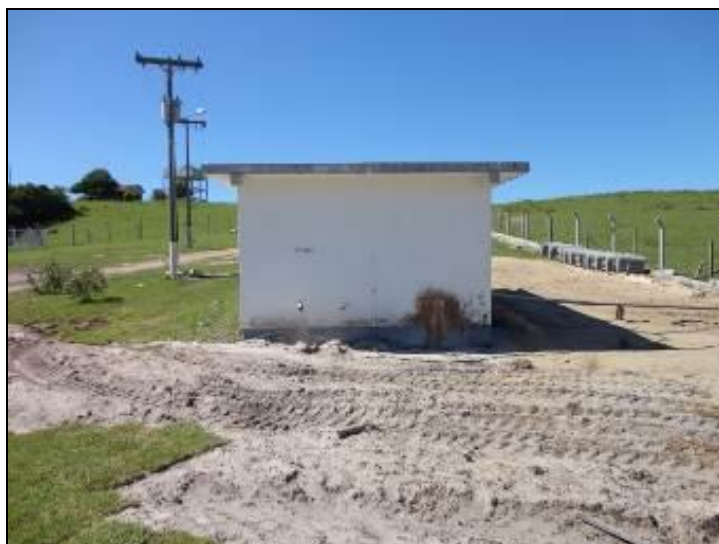
Figura 9: Vista geral da ETA.

1) A ETA possui licenciamento do órgão AMBIENTAL para funcionamento (Conama 237/97 Anexo 1)? Sim ( ) Não ( ) - Nº: xxxxxxxxxxxxxxxxxxxxxxxx