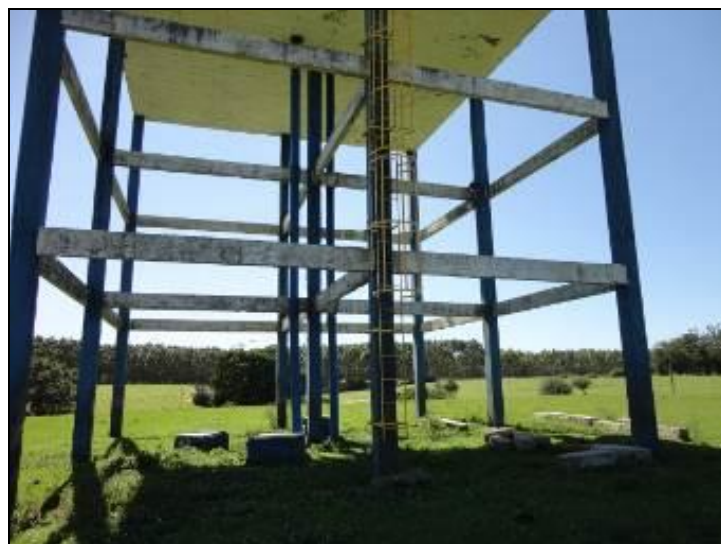
Figura 22 – Escada de acesso

6) Existe guarda-corpo nas áreas de visitação (Resolução AGESAN N°11 Art. 23°)? Sim ( ) Não (x) Pendência ( ):