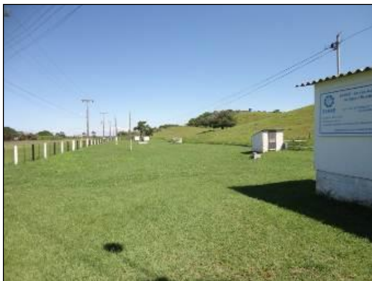
Figura 19 – Placa Indicativa

RECOMENDAÇÃO 07: Todas as Unidades devem contar com placas de identificação (Ex.: R-01) com a logo da proprietária e as informações de capacidade.