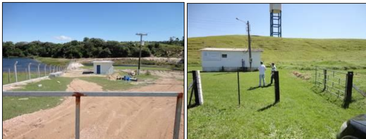
Figura 23 - ERABs

1) Estão devidamente identificadas? Sim ( ) Não ( ) Pendência (x):