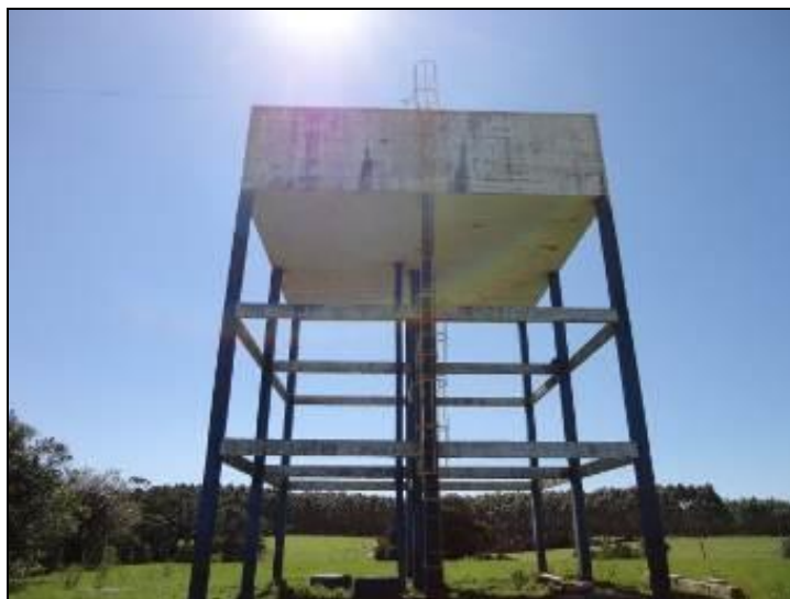
Figura 15 – R-1 Arroio Corrente

Posição: Apoiado ( ) Elevado (x) Outro ( )