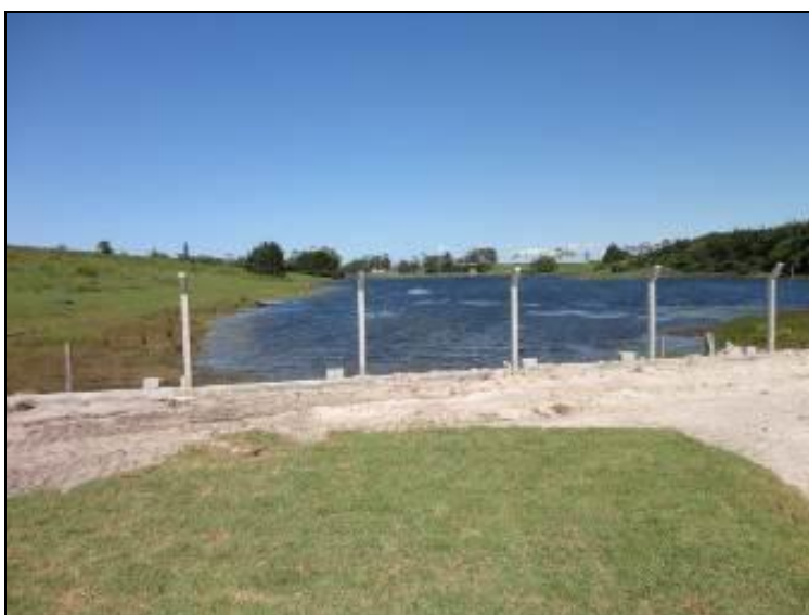
Figura 4: Área de proteção da Captação

3) Existe cerca de proteção da área do manancial (Resolução AGESAN nº11- Art. 10º)? Sim ( ) Não (x) Pendência ( ):