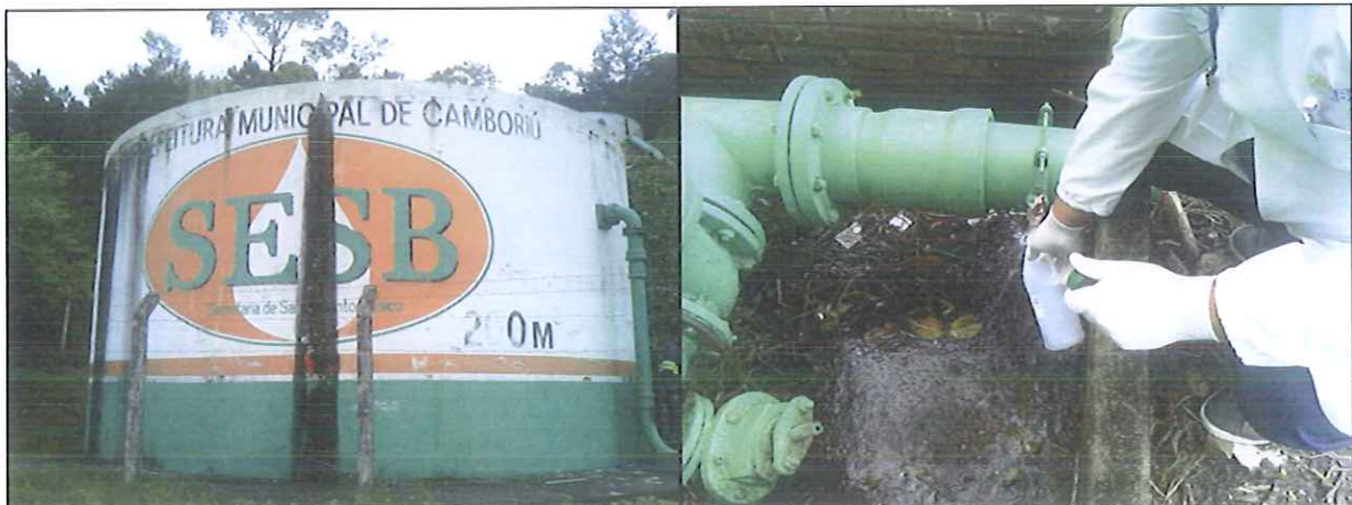
Figura 3: Coleta de amostra de água do Reservatório R02 - Centro

Abaixo há imagens das coletas de amostra de água tratada no sistema de distribuição do município de Camboriú (figuras 3 a 12).