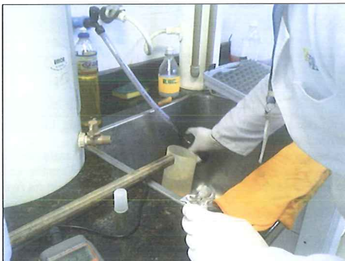
Figura 2: Coleta de amostra de água tratada ETA Balneário Camboriú/EMASA

Abaixo há imagens das coletas de amostra de água tratada na ETA Balneário Camboriú, que também abastece a população do município de Camboriú (figura 2).