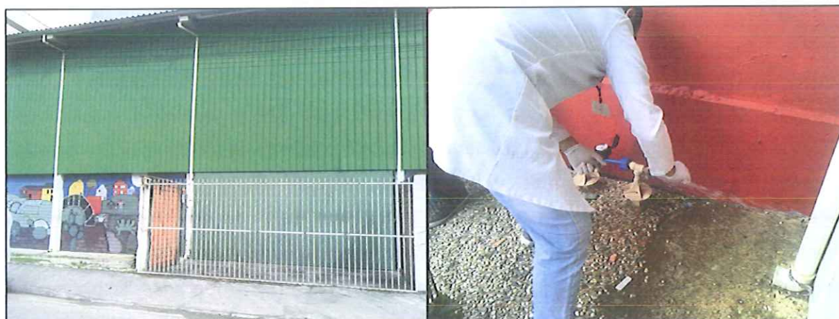
Figura 10: Coleta de amostra de água na Rede de distribuição: Colégio Alcino Gonçalo Vieiras