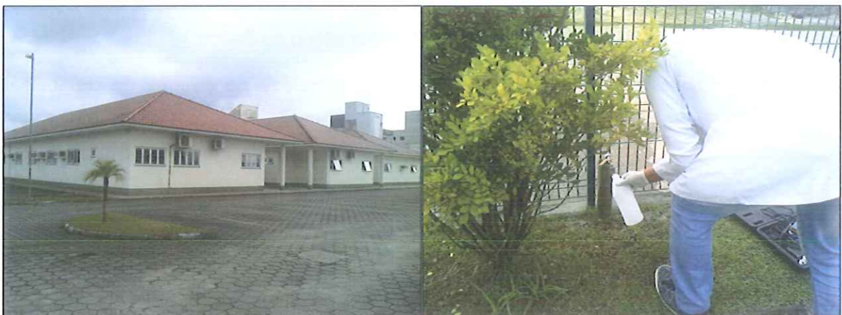
Figura 6: Coleta de amostra de água na Rede de distribuição: Fórum da Comarca de Camboriú