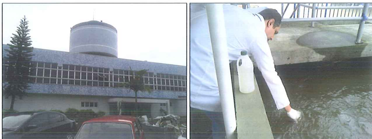
Figura 1: Coleta de amostra de água bruta na entrada da ETA Balneário Camboriú/EMASA

Abaixo se encontra imagem da coleta de amostra de água bruta realizada na entrada da ETA Balneário Camboriú da EMASA (figura 1).