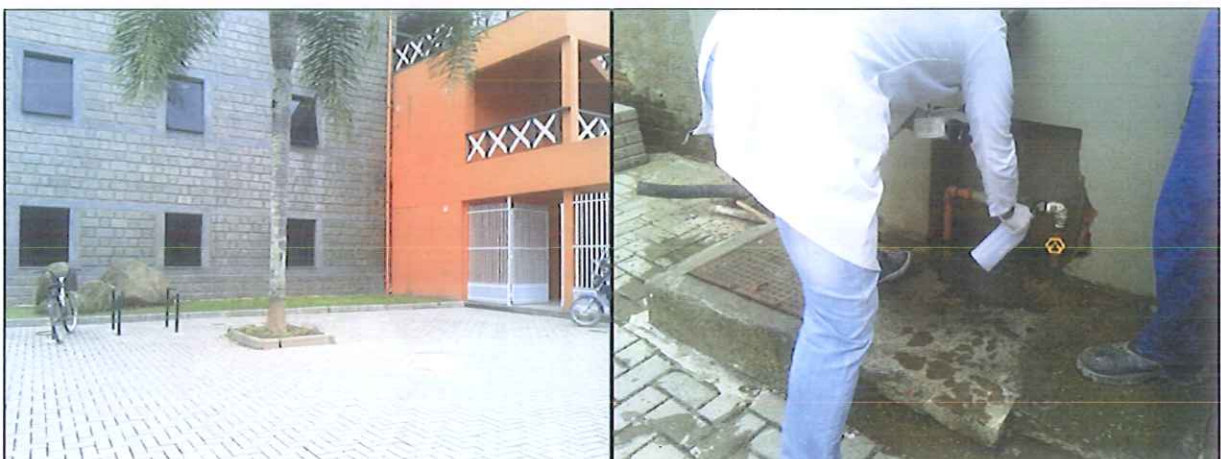
Figura 7: Coleta de amostra de água na Rede de distribuição: Prefeitura Municipal de Camboriú