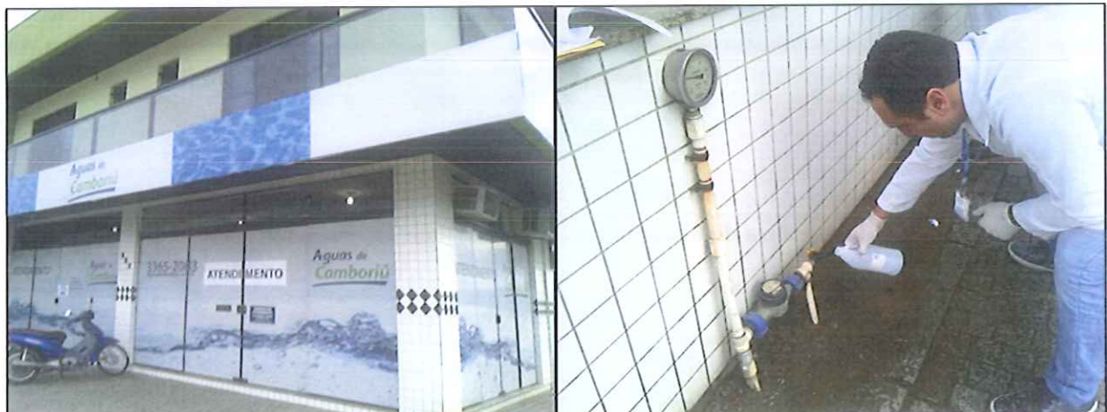
Figura 4: Coleta de amostra de água na Rede de distribuição: Águas de Camboriú