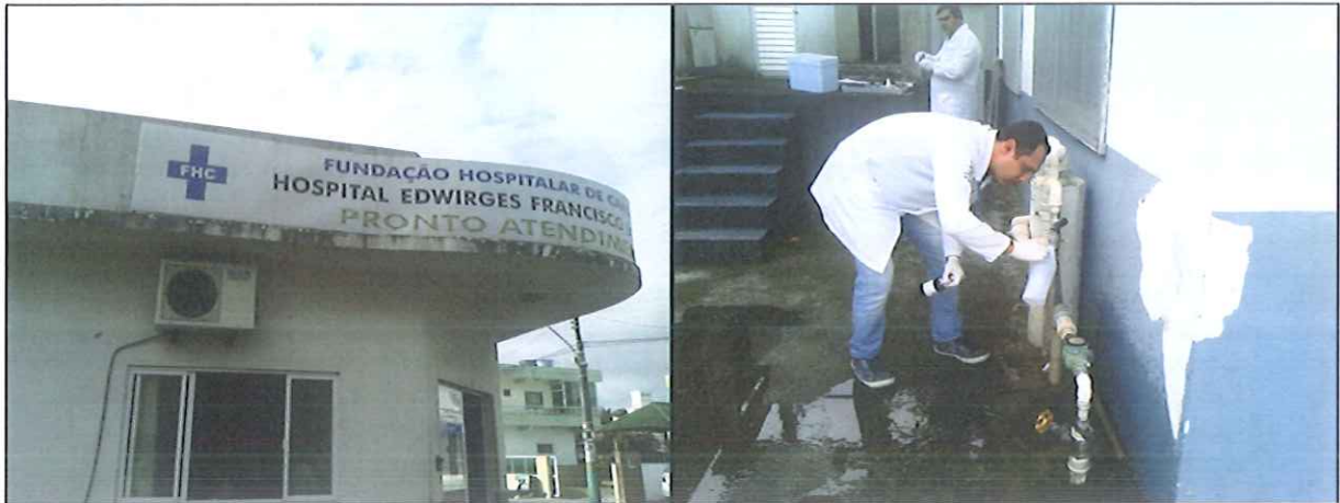
Figura 5: Coleta de amostra de água na Rede de distribuição: Hospital Edwirges Francisco de Bernardes