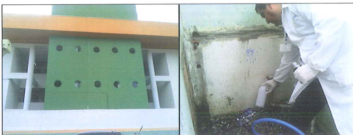
Figura 9: Coleta de amostra de água na Rede de distribuição: Colégio Abalor Américo Madeira