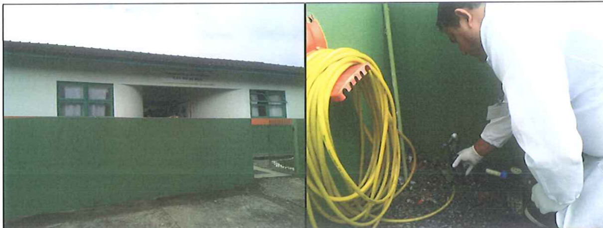
Figura 8: Coleta de amostra de água na Rede de distribuição: Centro de Educação Infantil Rio do Meio