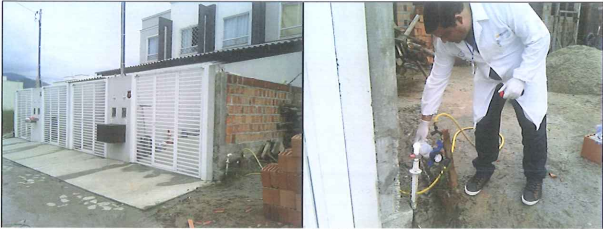
Figura 11: Coleta de amostra de água na Rede de distribuição: Residência Rua Santa Clara