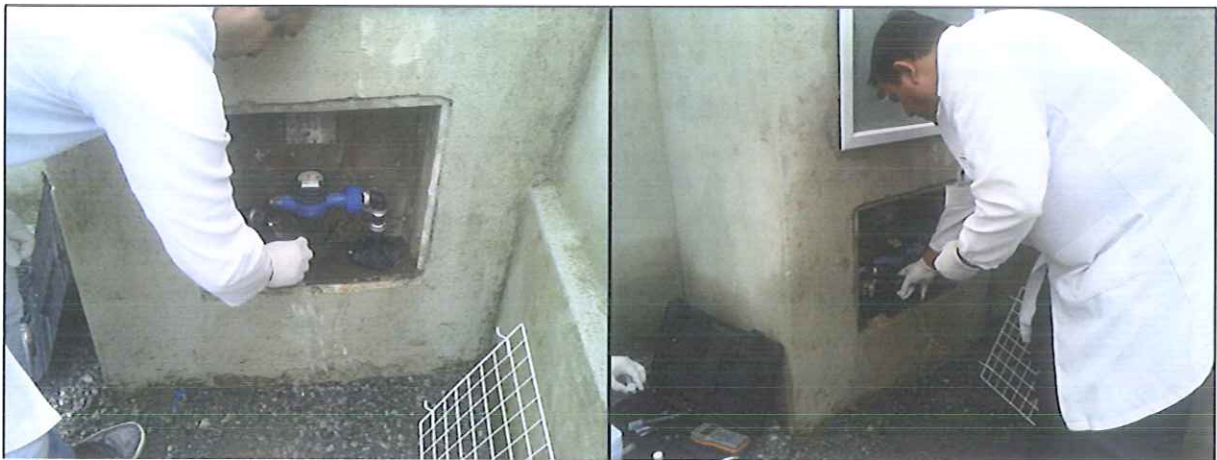
Figura 12: Coleta de amostra de água na Rede de distribuição: Residência Rua Rio Amazonas