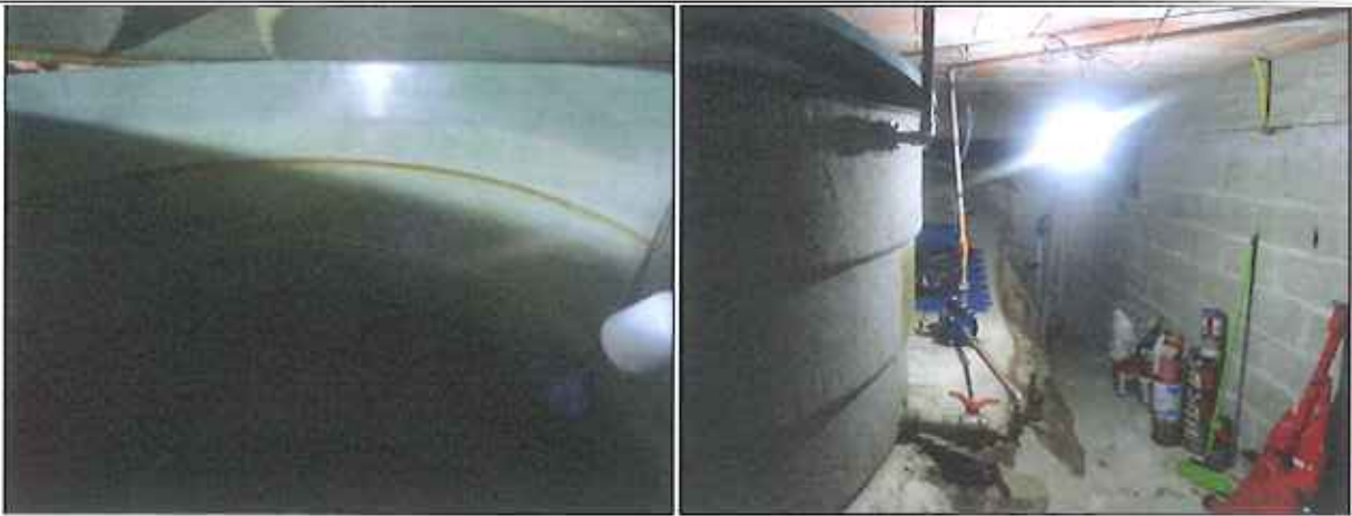
Figura 2: Reservatório da residência, sem água no momento da visita