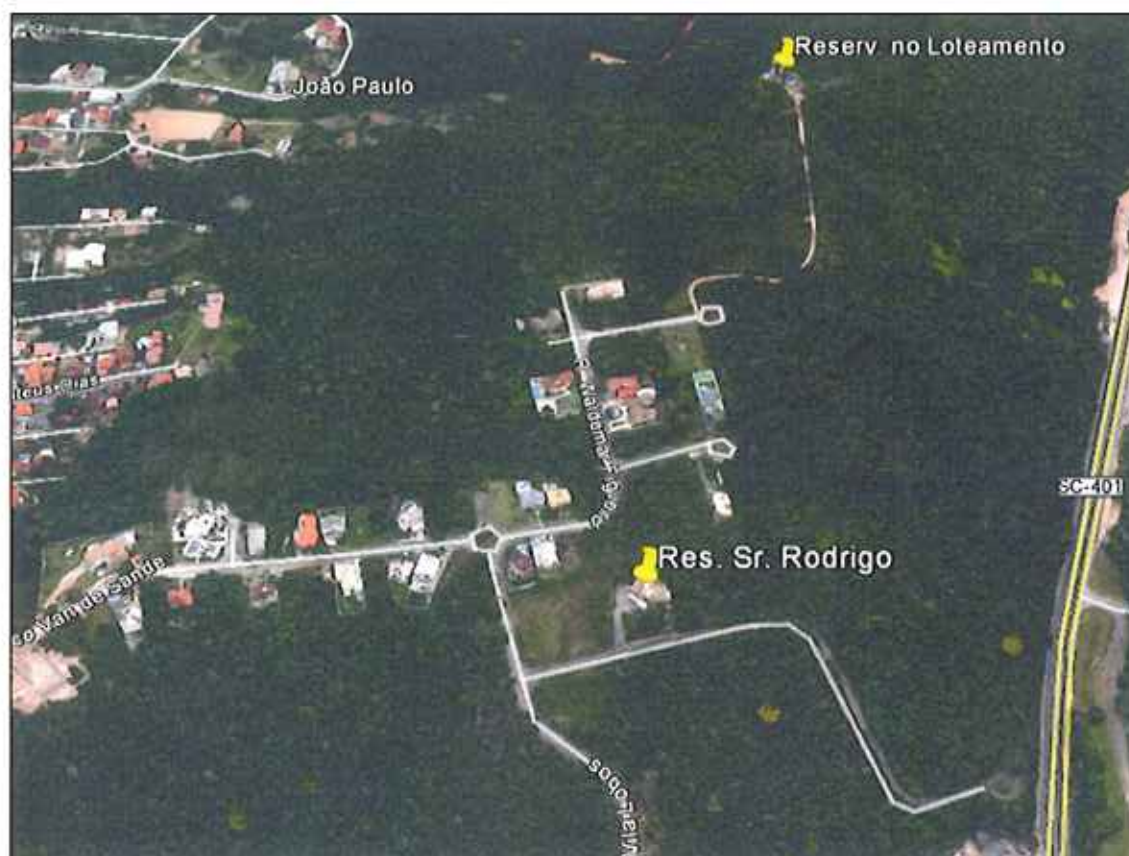
Figura 1: Imagem do loteamento Caiobig