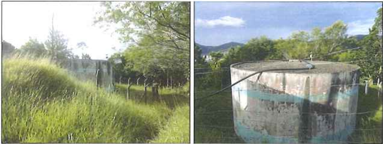
Figura 3: Reservatório existente no Loteamento Caiobig

Assim que houve o recebimento da denúncia na Ouvidoria da ARESC (Protocolo nº 2016009569) providências imediatas foram solicitadas a concessionária para reestabelecer o abastecimento de água imediatamente. No mesmo dia, a concessionária realizou conserto de cinco rompimentos da rede de distribuição no loteamento. Porém, o abastecimento ainda não foi normalizado e os moradores continuam sem água há quinze dias.