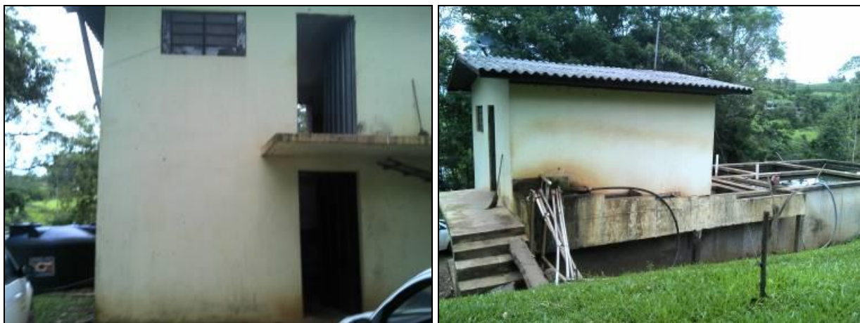
Figura 3: ETA Santa Helena

Unidades de tratamento: Floculação; Decantação; Filtros; Desinfecção; Tanque de Contato.