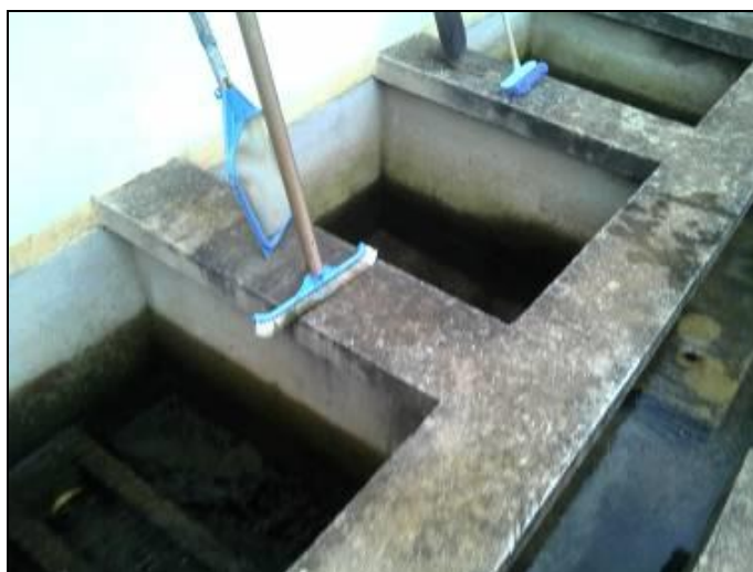
Figura 6: Filtro da ETA

23) Os filtros estão em boas condições (Resolução ARESN N°11 - Art. 17°)? Sim ( x ) Não ( )