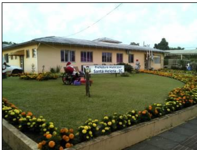
Figura 1: Fachada da Prefeitura

2) O imóvel é: Próprio ( x ) Alugado ( )