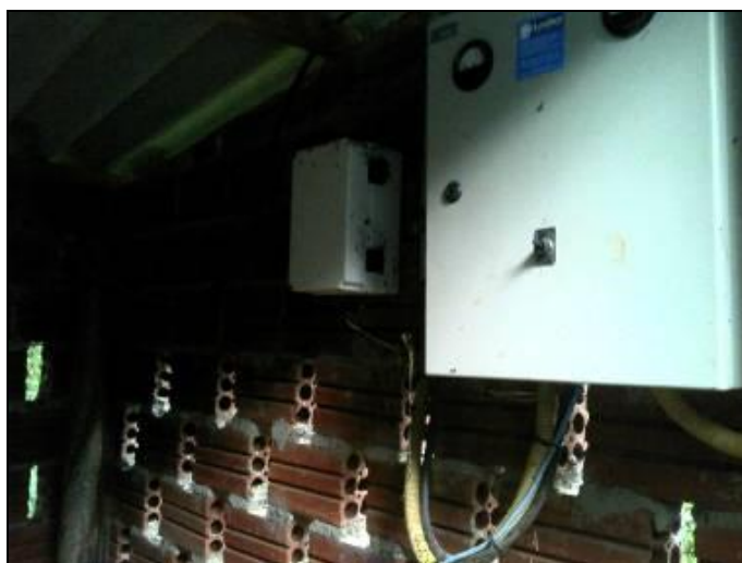
Figura 14: Disjuntor da ERAT

6) O disjuntor está devidamente trancado? Sim ( ) Não ( ) - Obs.: Não vistoriado.