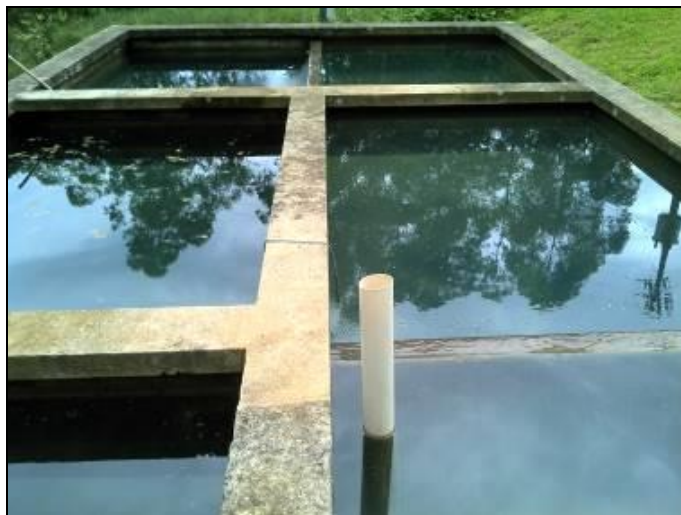
Figura 5: Decantadores da ETA

20) Existem escadas de acesso aos decantadores (Resolução ARESN n°11 - Art. 15°)? Sim ( x ) Não ( )