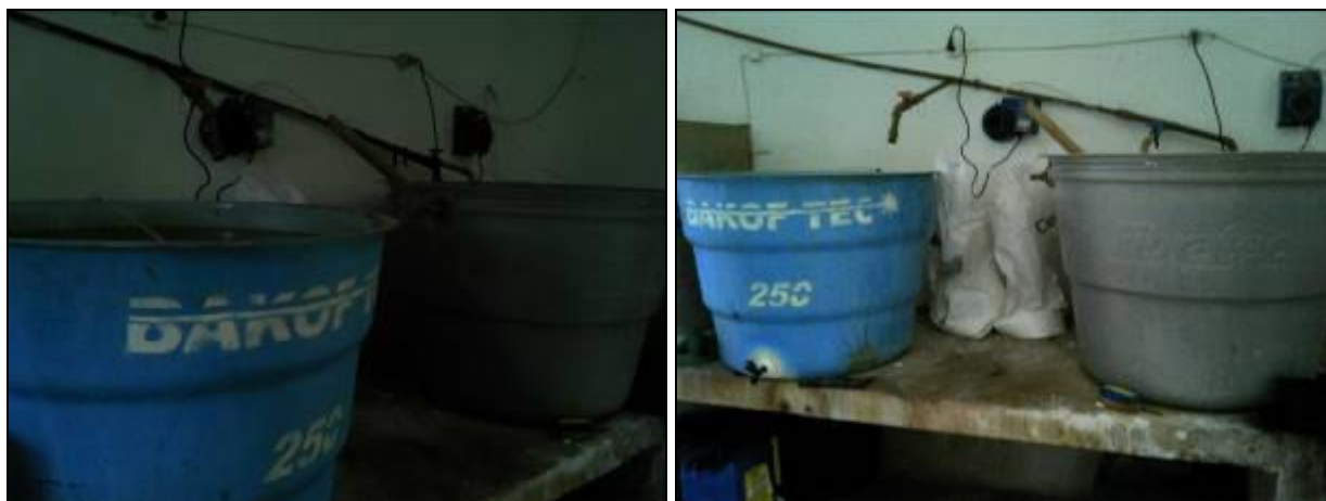
Figura 7: Casa de Química da ETA

RECOMENDAÇÃO 19: Melhorar condições da casa de química.