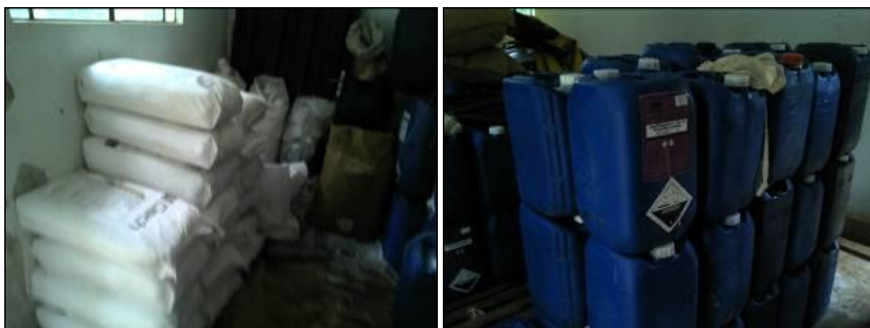
Figura 8: Produtos químicos da ETA

RECOMENDAÇÃO 20: Providenciar local adequado para armazenamento dos produtos químicos.