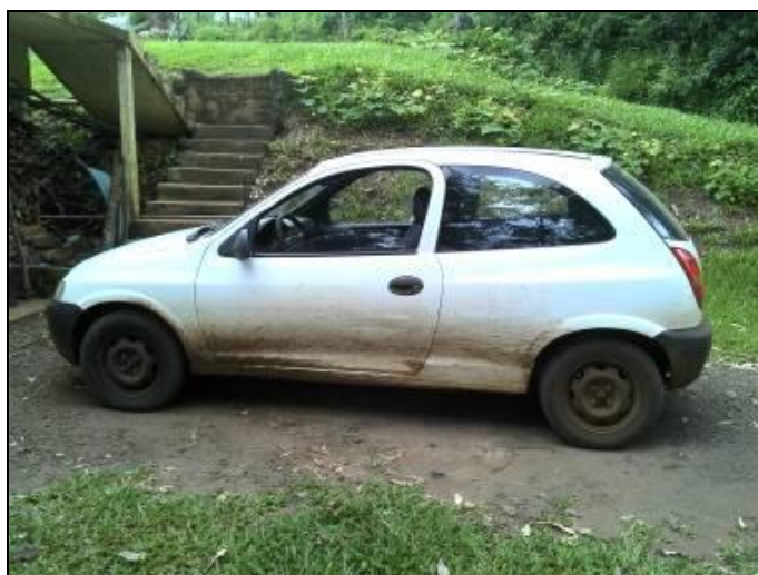
Figura 2: Veículo da prefeitura

19) Existem veículos para uso dos funcionários 3 ? Sim ( x ) Não ( ) - Obs.: Dois veículos da prefeitura, sendo um de uso próprio de operador da ETA.