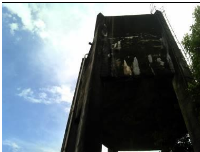
Figura 12: Escada do reservatório

09) Existe guarda-corpo nas áreas de visitação (Resolução ARESC N°11 Art. 23°)? Sim ( ) Não ( x )