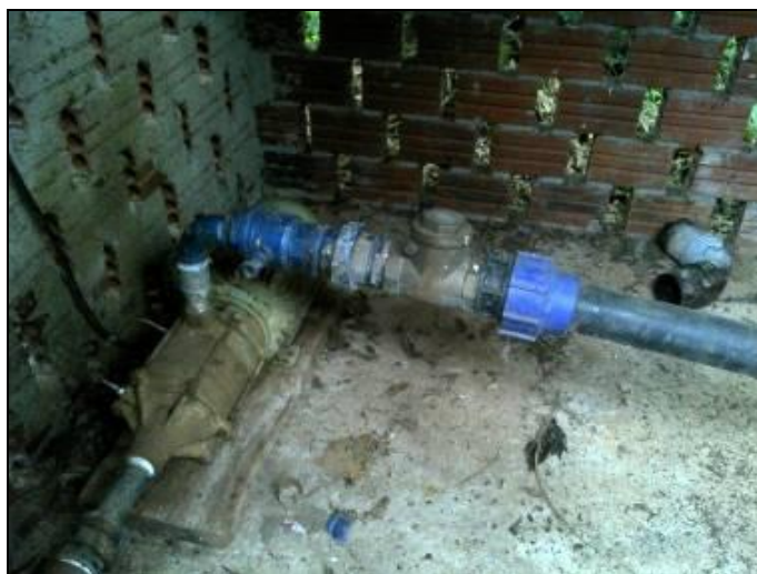
Figura 13: ERAT junto a ETA

1) Qual o documento que garante a propriedade ou a posse da área/imóvel ou locação 9 ? Propriedade do município.