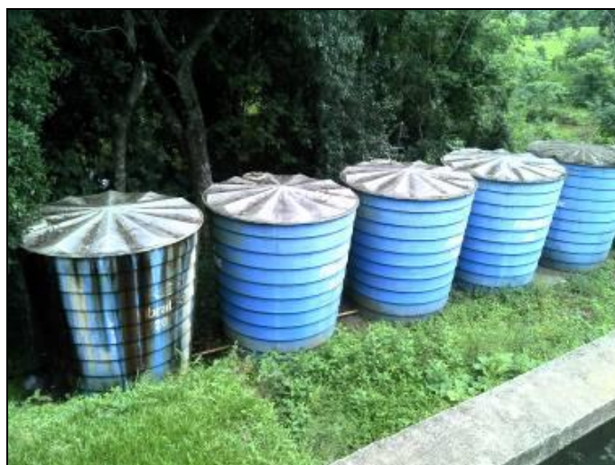
Figura 9: Reservatórios junto a ETA

Coordenadas geográficas: 26° 56' 13" S / 53° 36' 36" O