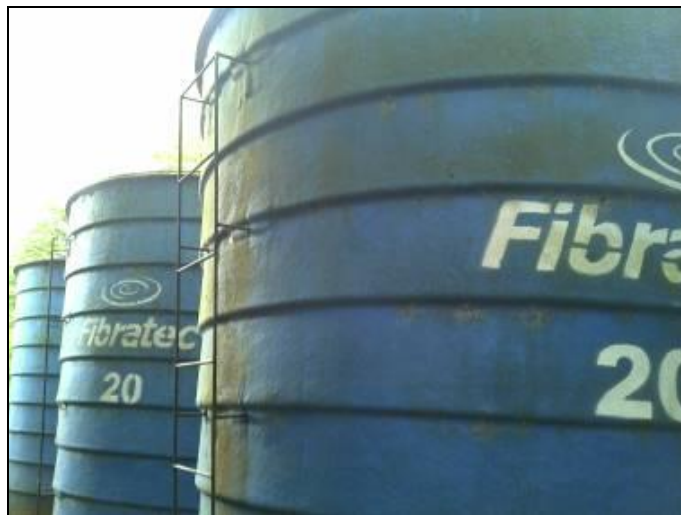
Figura 10: Escada do Reservatório

RECOMENDAÇÃO 24: Instalar escada fixa do tipo marinhoiro.