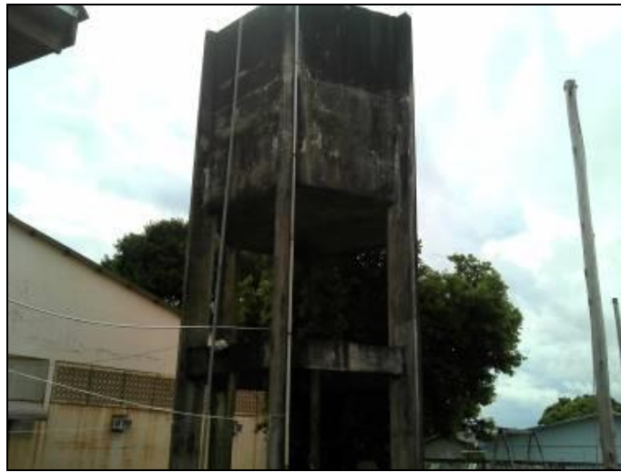
Figura 11: Reservatório do Centro

01) O Material do reservatório é: Fibra ( ) Concreto ( x ) Outro ( )