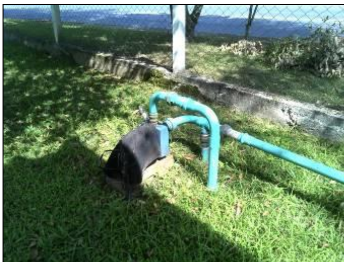
Figura 5: Poço não identificado