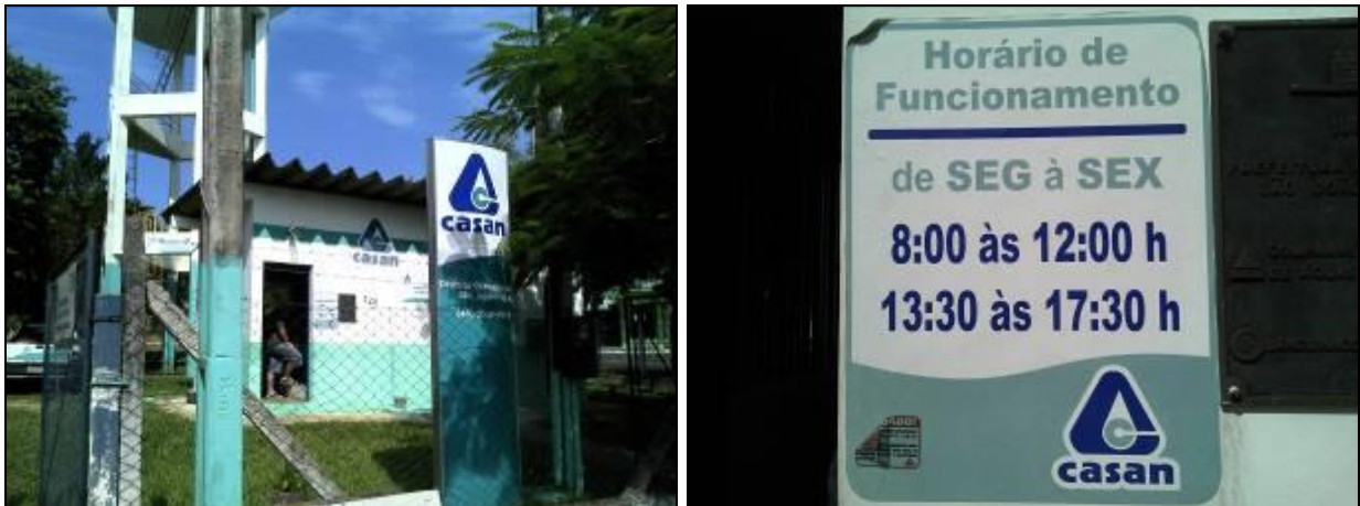
Figura 1: Informações disponíveis aos usuários

ITEM 4: Existem manuais, guias e informações adequadas disponíveis aos usuários ( CDC, Resoluções Agesan, etc. )? Sim (x) Não ( ) Pendência ( ): Obs.: Não foram apresentados os manuais e guias, solicitadas na visita inicial.