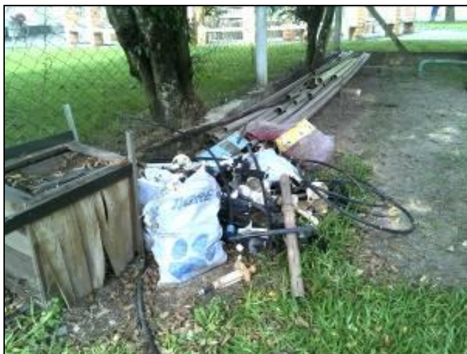
Figura 4: Materiais exposto no terreno

CONCLUSÃO AGESAN: Esta recomendação também foi feita no Relatório Inicial e continuou pendente no Relatório de Acompanhamento. Na última visita, não houve mudanças, os materiais não estão armazenados adequadamente, estando expostos no terreno, conforme figura 4.