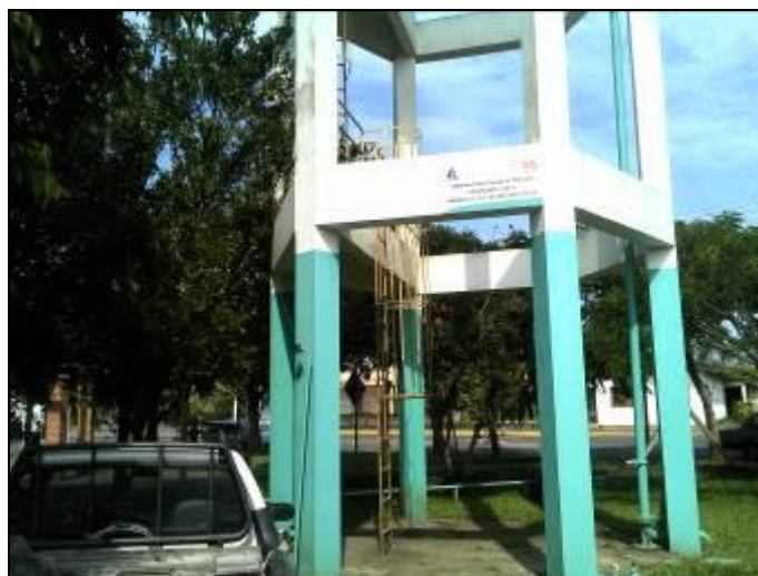
Figura 6: Reservatório identificado

CONCLUSÃO AGESAN: Recomendação atendida. Placa instalada conforme figura 7.