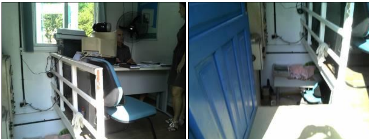
Figura 3: Área de atendimento

de água, sendo que o funcionário e os usuários estão expostos a muito ruído. Também não oferece bom atendimento aos usuários por falta de espaço e acesso, principalmente aos deficientes físicos. A estrutura deve ser reformada para dar boas condições ao atendimento aos usuários e ao trabalho dos funcionários.