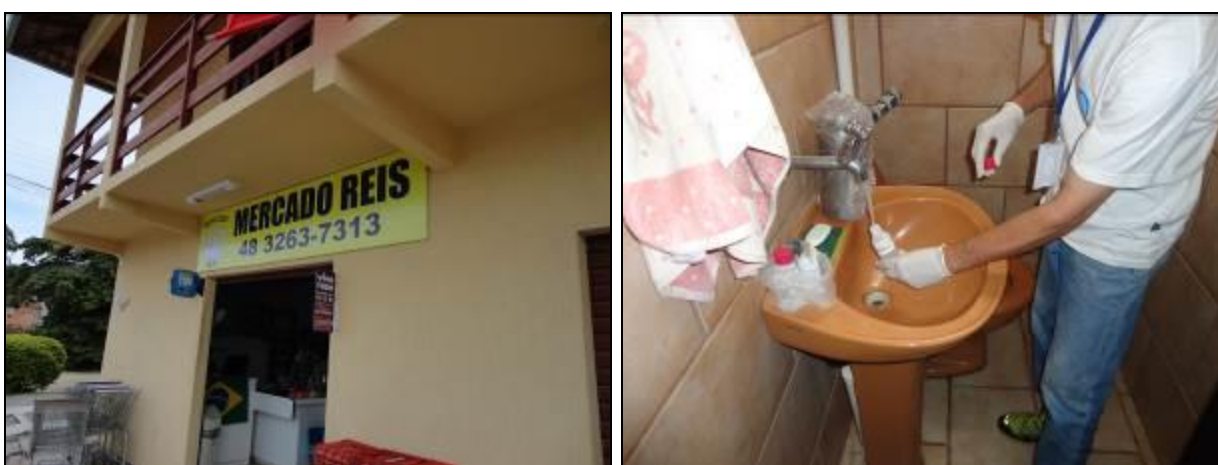
Figura 12: Coleta de água no Mercado Reis (10/06/2014)