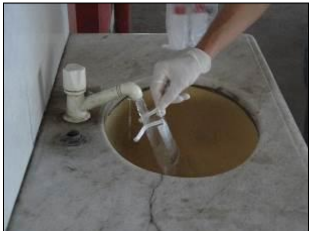
Figura 8: Coleta de água no Terminal Rodoviário de Tijucas (10/06/2014)