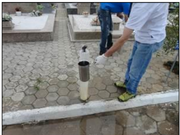
Figura 9: Coleta de água no Cemitério Municipal (10/06/2014)