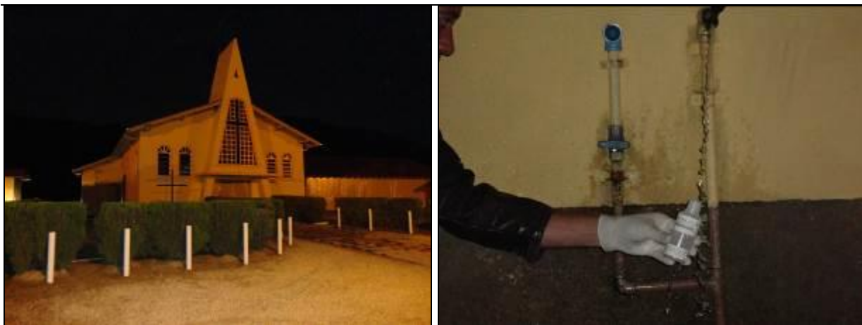
Figura 13: Coleta de água bruta no Centro de Itinga (10/06/2014)