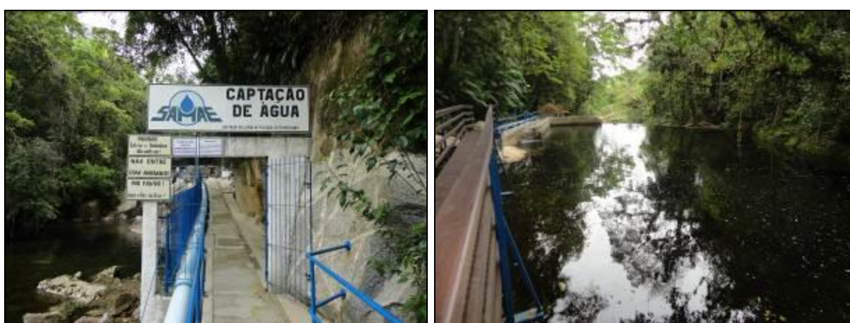
Figura 3: Manancial de captação de água bruta Rio Itinga (arquivo AGESAN: 22/11/2013)