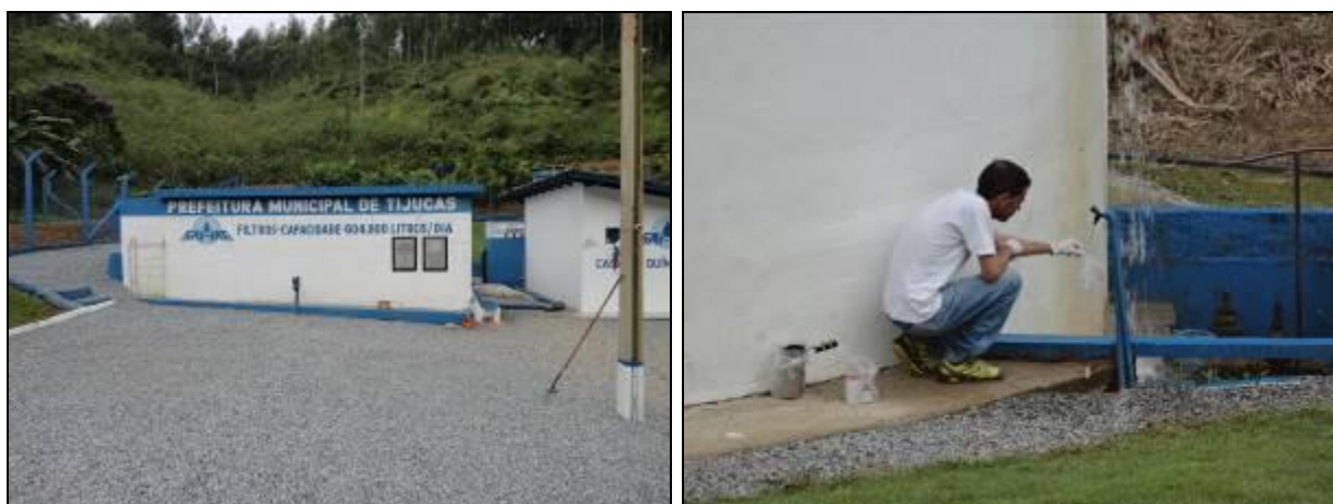
Figura 4: Coleta de água na ETA Oliveira (10/06/2014)

As Figuras 4 e 5 mostram imagens das coletas de água tratada feitas no reservatório da ETA Oliveira e no laboratório da ETA Itinga.