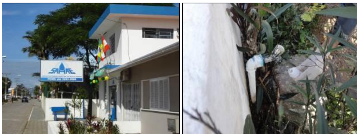
Figura 7: Coleta de água no SAMAE (10/06/2014)

Imagens dos locais e das coletas de água estão expostos a seguir (Figuras 7 a 12).