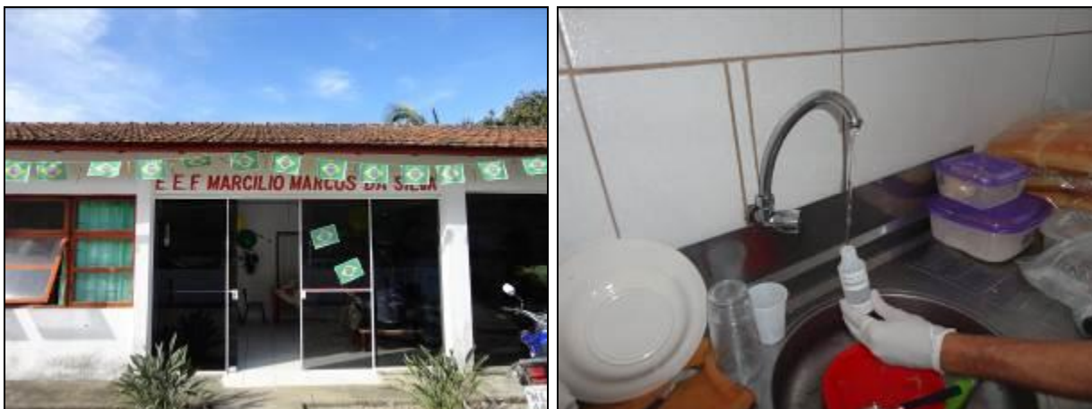
Figura 11: Coleta de água na Escola Marcílio Marcos da Silva (10/06/2014)