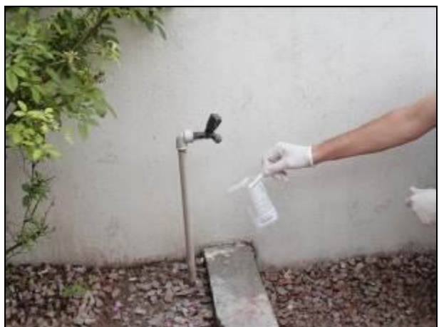
Figura 10: Coleta de água na Escola Unidade Sanitária Reinoldo João Rosa (10/06/2014)