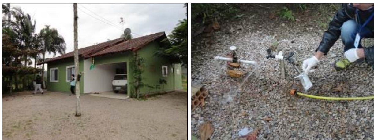
Figura 15: Coleta de água bruta em Campo Novo (07/07/214)