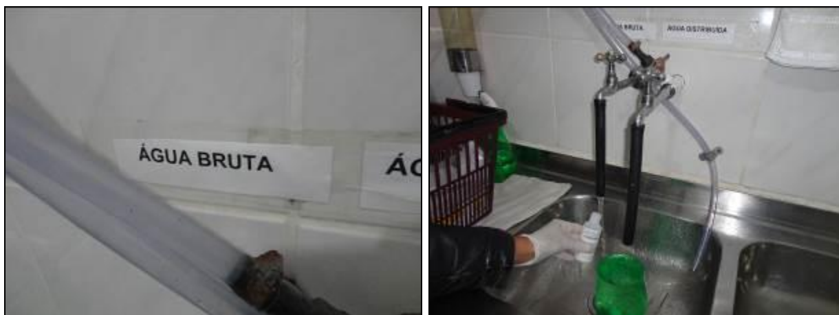
Figura 2: Coleta de água bruta do Rio Itinga na torneira da ETA Itinga (10/06/2014)