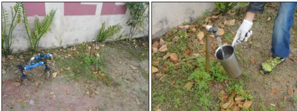
Figura 14: Coleta de água bruta em Nova Descoberta (07/07/2014)