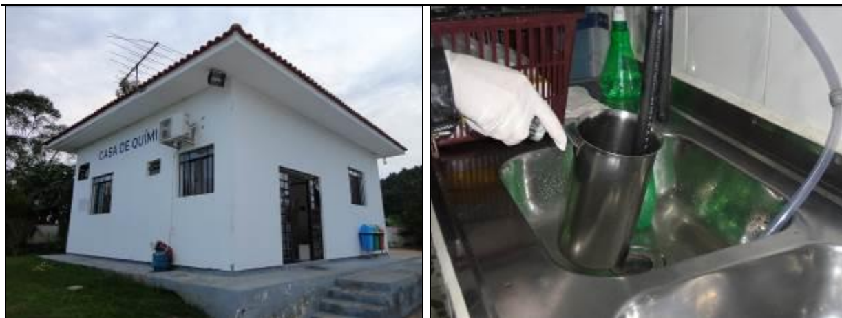
Figura 5: Coleta de água na ETA Itinga (10/06/2014)