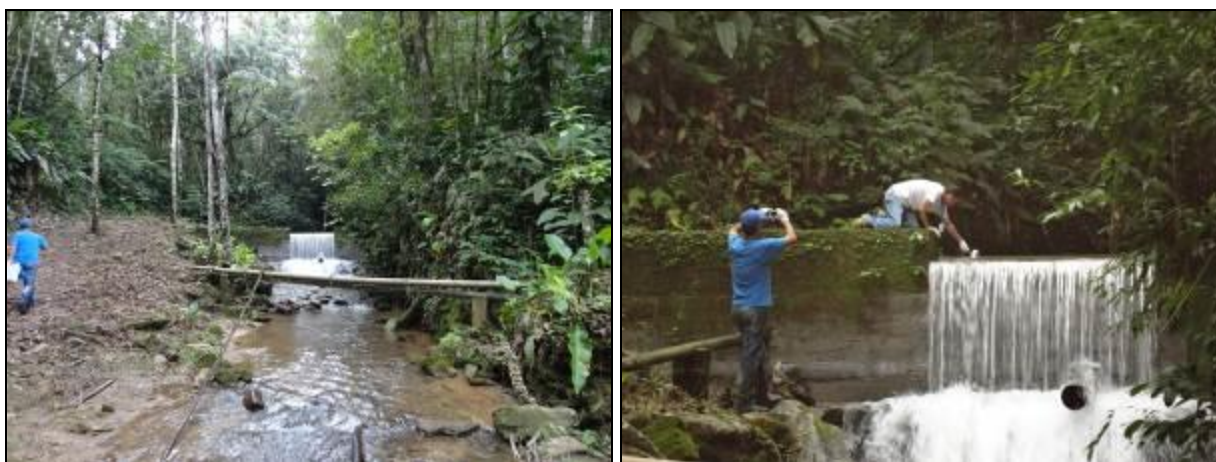
Figura 1: Coleta de água bruta no manancial Oliveira (10/06/2014)

Abaixo estão algumas imagens da área de captação, bem como da coleta de água bruta realizada (Figuras 1 a 3).