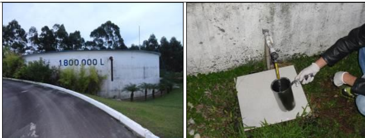
Figura 6: Coleta de água no Reservatório da ETA Itinga de 1.800.000 litros (10/06/2014)