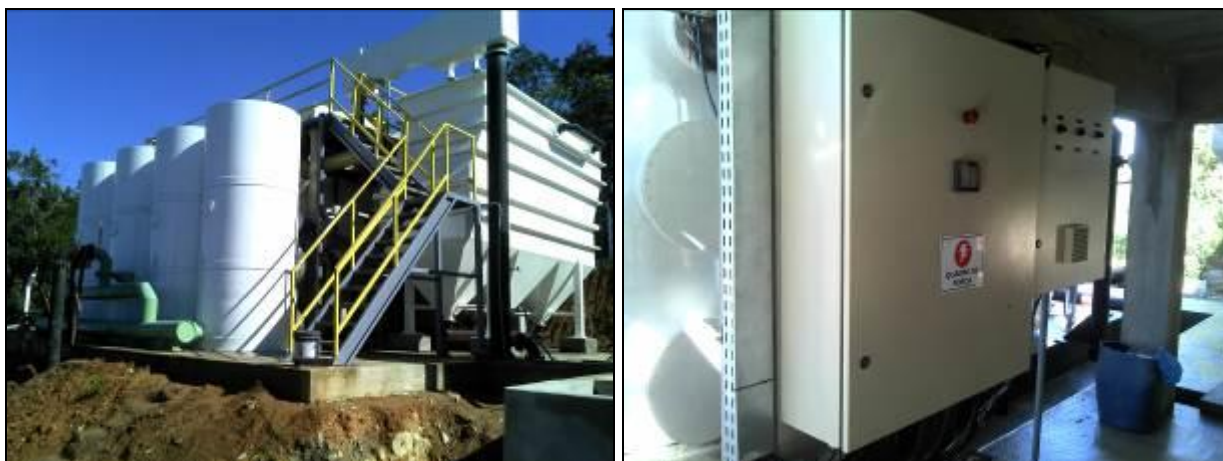
Figura 1: ETA - Quadro de Comando (09/05/2014)