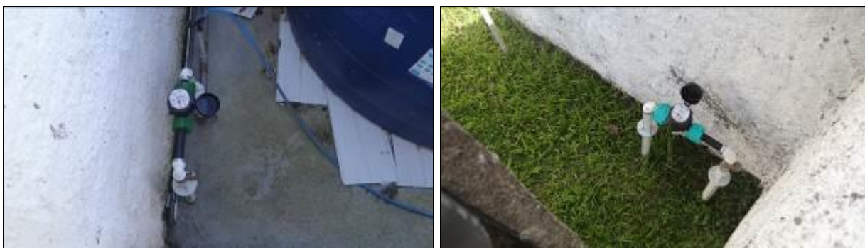
Figura 7: Setor 200: Rua Bento Francisco – hidrômetros dentro dos terrenos dos proprietários (30/05/2014)