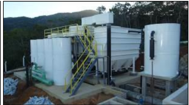
Figura 4: Vista geral da ETA (30/05/2014)