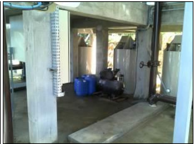
Figura 3: Floculadores e Produtos Químicos (09/05/2014)