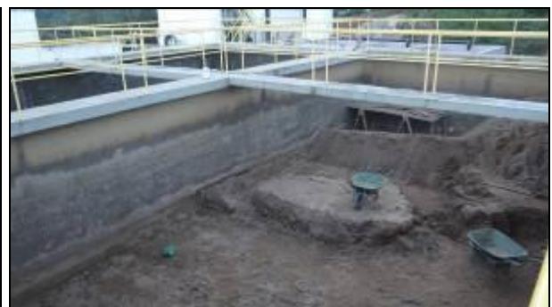
Figura 6: Futuros reservatórios (30/05/214)