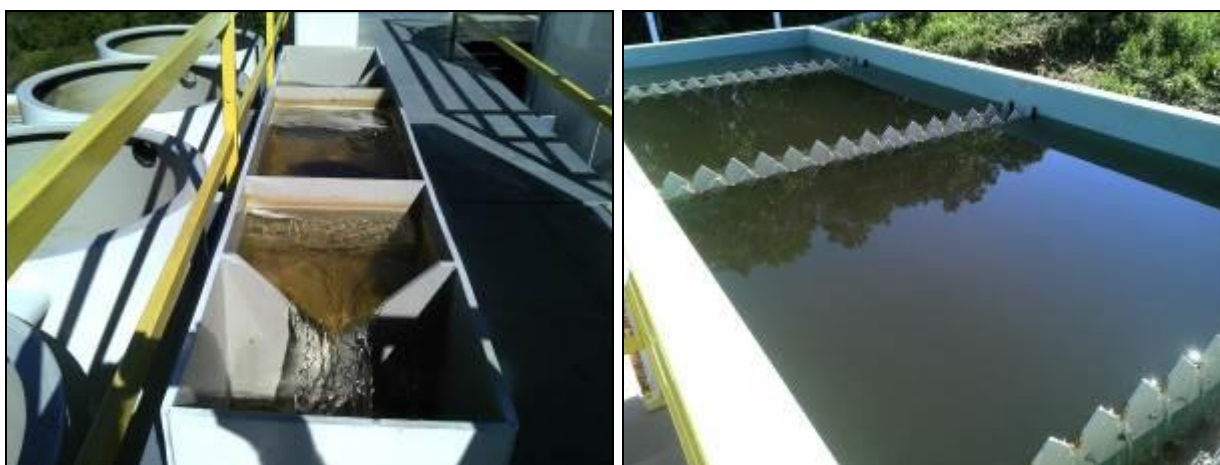
Figura 2: Entrada da Água e Decantadores (09/05/2014)