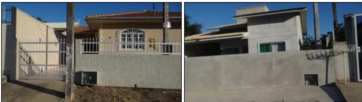
Figura 10: Setor 213: Rua João Benedito da Luz – modelo padrão de hidrômetro (30/05/2014)