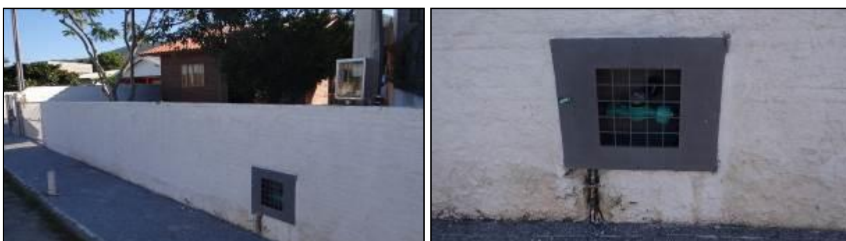
Figura 8: Setor 202: Rua Brigadeiro Eduardo Gomes – modelo padrão de hidrômetro (30/05/2014)