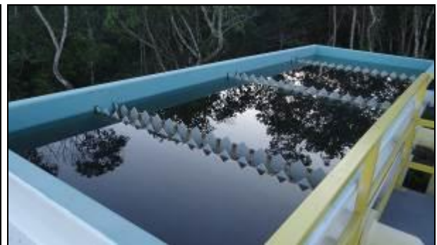
Figura 5: Entrada de água e decantadores (30/05/2014)