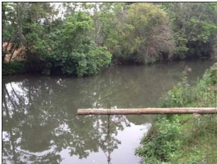
Área do manancial onde é feita a captação.

Manancial: Rio Famoso - Localização: Linha Famoso