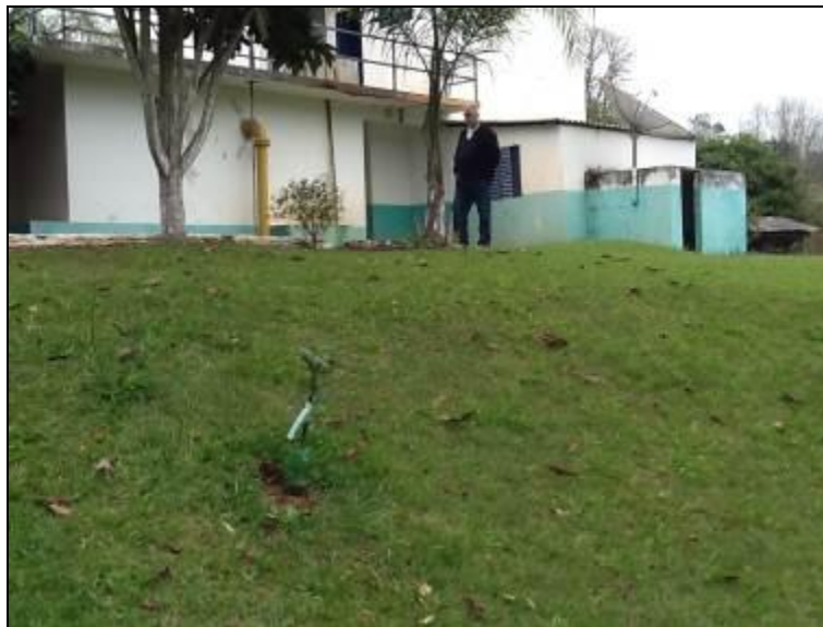
Áreas externas em bom estado de conservação.

10) As condições de limpeza do pátio externo são boas (Resolução AGESAN N°11 - Art. 15º)? Sim (x) Não ( ) Pendência ( ):