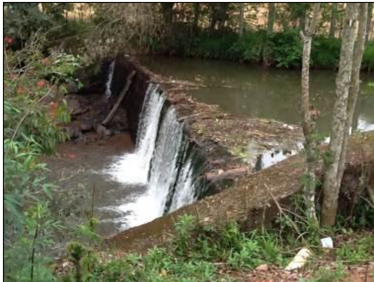
Cada das máquinas onde é feito o recalque para a ETA

8) Existe proteção contra enchentes e entrada de pessoas estranhas e animais (Resolução AGESAN N°11 - Art. 10º)? Sim ( ) Não (x) Pendência ( ):