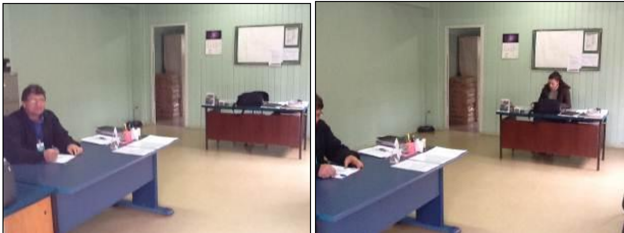
Áreas internas do Escritório.

RECOMENDAÇÃO 1: Avaliar melhorias no mobiliário, especialmente nas cadeiras.