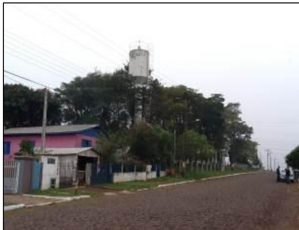
R- 02 Descanso.