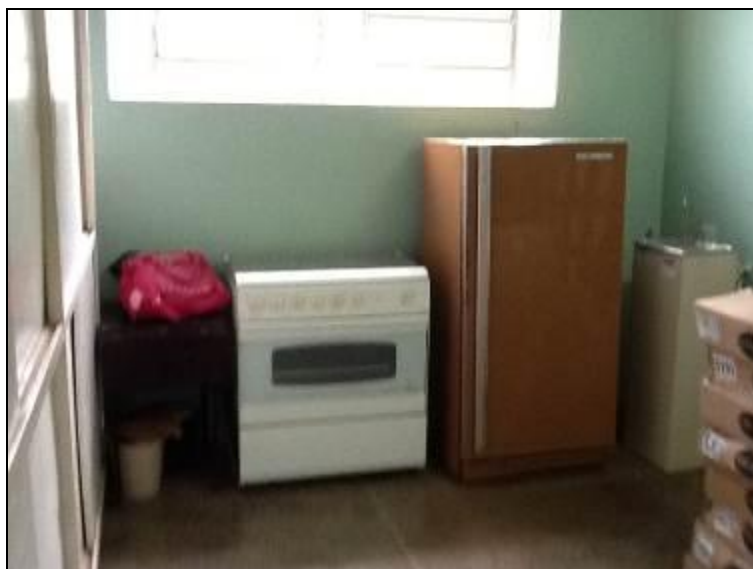
Áreas de uso comum em boas condições de organização e limpeza.

10) As condições gerais de limpeza são favoráveis (Resolução AGESAN Nº 004 - Art. 127)? Sim (x) Não ( ) Pendência ( ):