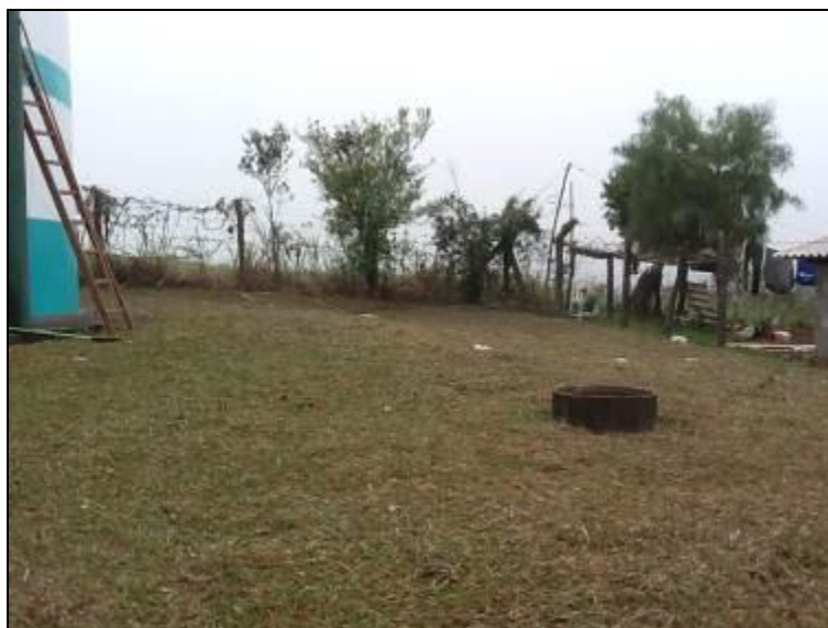
Áreas de entorno dos Reservatórios do SAA.

5) As áreas estão devidamente cercadas e trancadas (Resolução AGESAN N°11 - Art. 23°)? Sim ( ) Não (x) Pendência ( ):