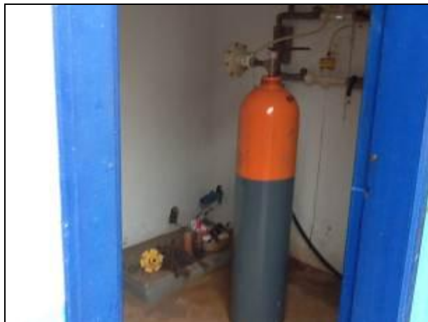
Acondicionamento de produtos químicos.

22) O empilhamento dos produtos químicos é adequado (Resolução AGESAN N°11 - Art. 18° §2°)? Sim (x) Não ( ) Pendência ( ) :