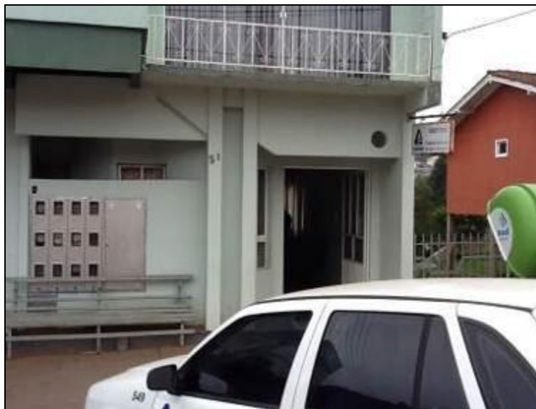
Fachada do Escritório

Endereço: Rua José Bonifácio, 31 - Centro – Descanso/SC