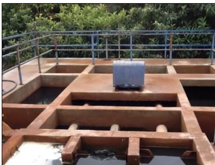
As áreas de tratamento da água físico.

12) Há guarda-corpos de segurança para os acessos e aerador (Resolução AGESAN N°11 - Art. 15º)? Sim (x) Não ( ) Pendência ( ):