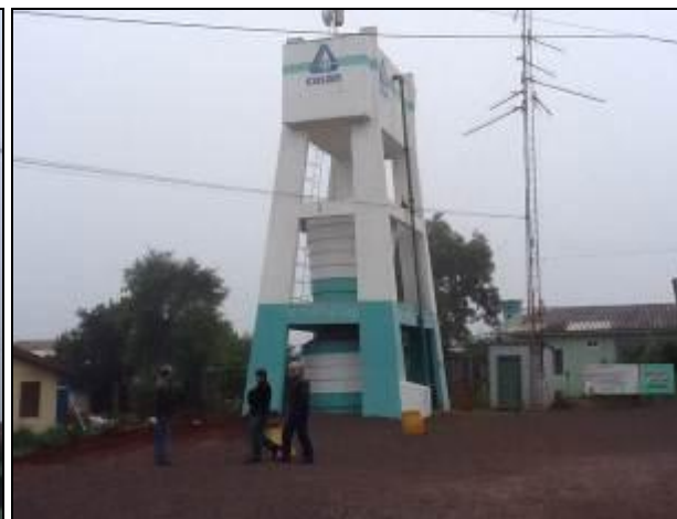
Belmonte 1, 2 e 3 (elevado).

3) Existem placas indicativas de propriedade e restrição de uso das áreas dos reservatórios (Resolução AGESAN N° 004 - Art.19 - §2º)? Sim ( ) Não (x) Pendência ( ):