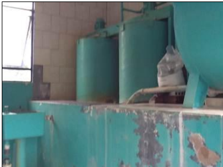
Casa de Química da ETA Descanso.

20) A estrutura do prédio da casa de química está aparentemente segura (Resolução AGESAN N°11 Art. 15°)? Sim (x) Não ( ) Pendência ( ) :