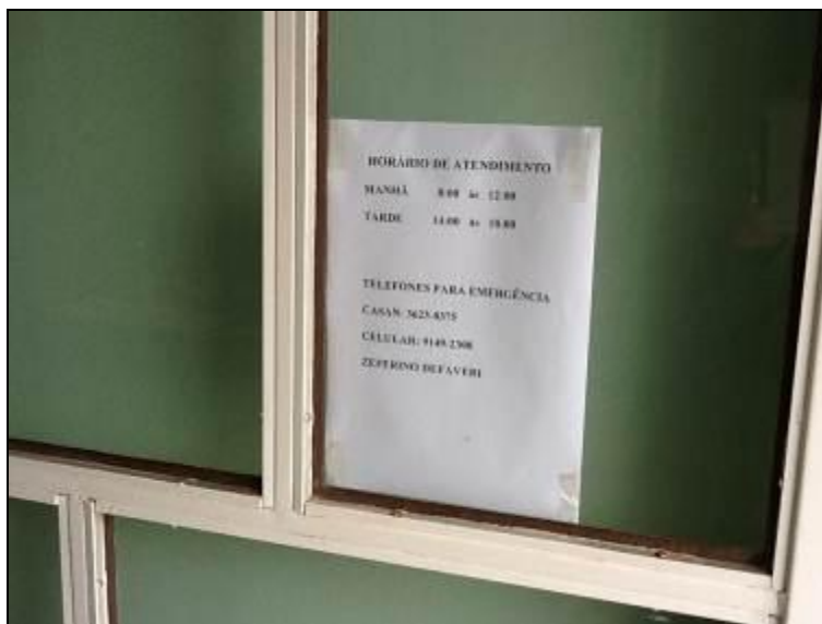
Cartaz com horário

2) Há placa indicativa do horário de funcionamento (Lei nº 8.078 - Art. 6º)? Sim Não Pendência :