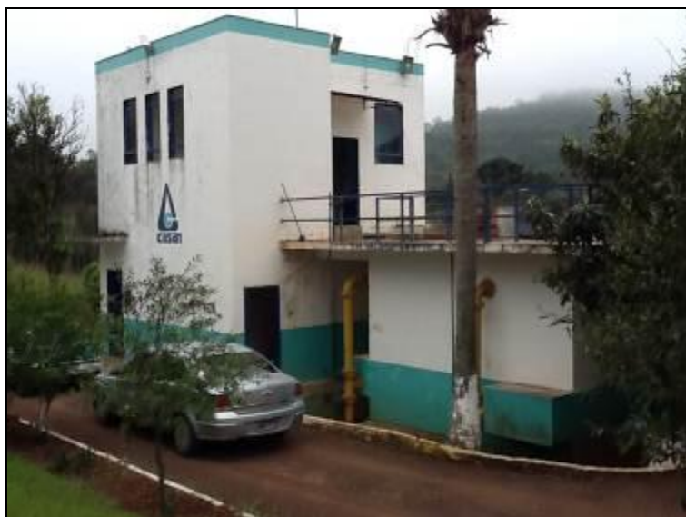
Fachada da ETA