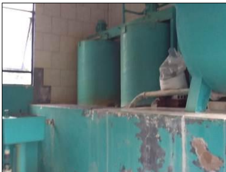
Outros equipamentos de acompanhamento da ETA.

7) Existe Macromedição na saída (Res. AGESAN nº11 - Art. 17º)? Sim (x) Não ( )