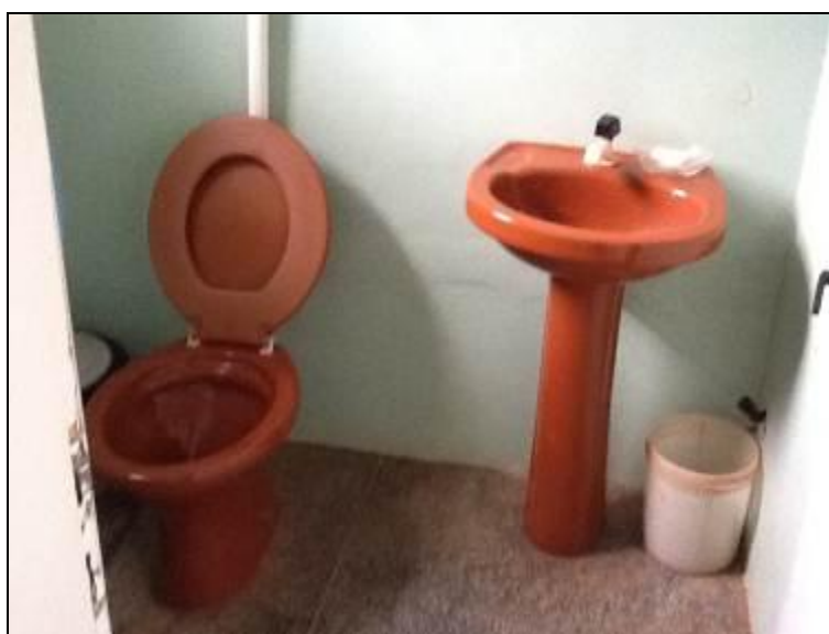
Sanitários de unidades da estrutura.

6) Existe sanitário disponível para uso dos funcionários (Resolução AGESAN nº 004 Art. 127)? Sim (x) Não ( ) Encontra-se em boas condições de higiene e limpeza? Sim (x) Não ( ) Pendência ( ):