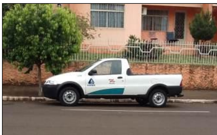
Veículo à disposição de Descanso