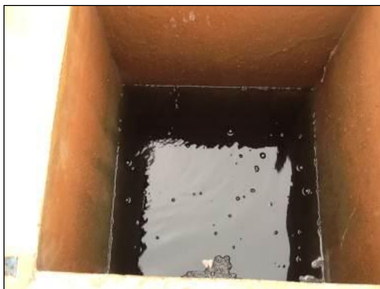
Filtros da ETA Descanso.

17) Os filtros estão em boas condições (Resolução AGESAN nº11 - Art. 15º)? Sim (x) Não ( ) Nº de filtros: 04 (quatro) .