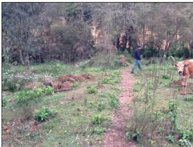
Área do manancial não é cercada, nem identificada.

3) Existe cerca de proteção da área do manancial (Resolução AGESAN nº11- Art. 10º)? Sim (x) Não ( ) Pendência ( ):