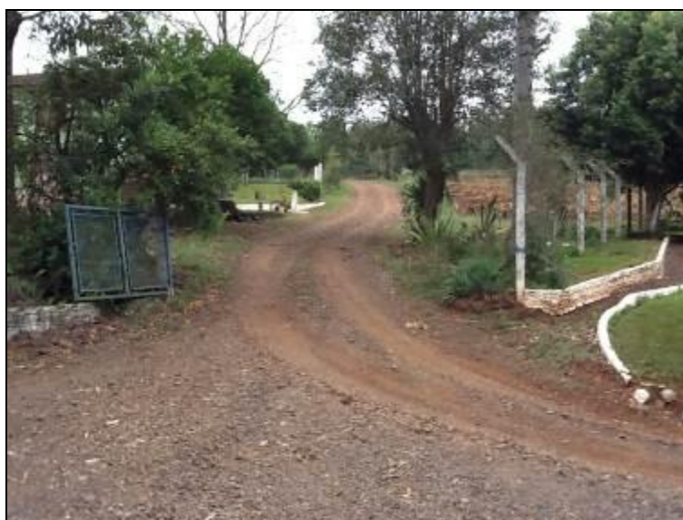
Acesso e entrada da ETA