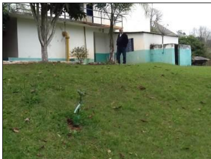
Figura 22: Entorno da ETA

9) Existe cerca de proteção da ETA em bom estado de conservação (Resolução AGESAN Nº11 - Art. 15º)? Sim (x) Não ( ) Pendência ( ):