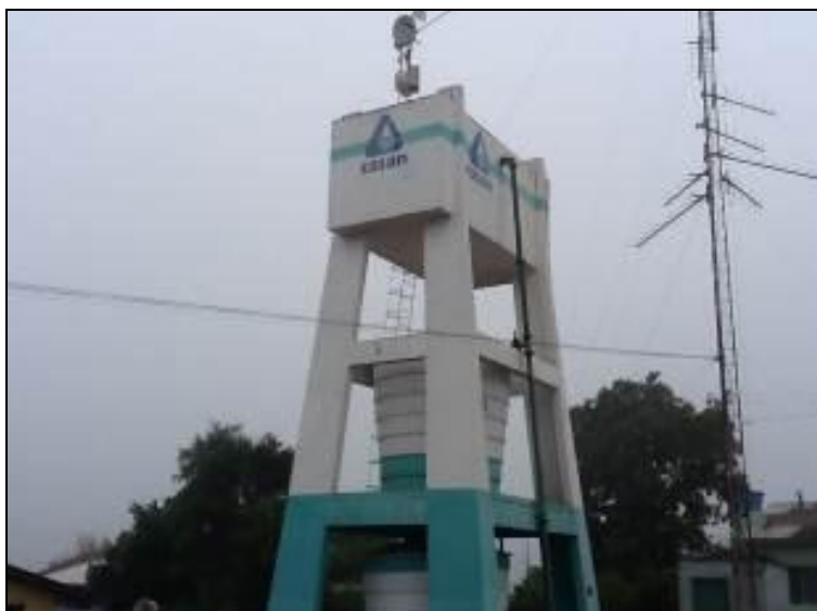
Figura 39: Reservatório Belmonte 1-2-3 (inicial)

Posição: Apoiado ( ) Elevado (x) Outro ( )