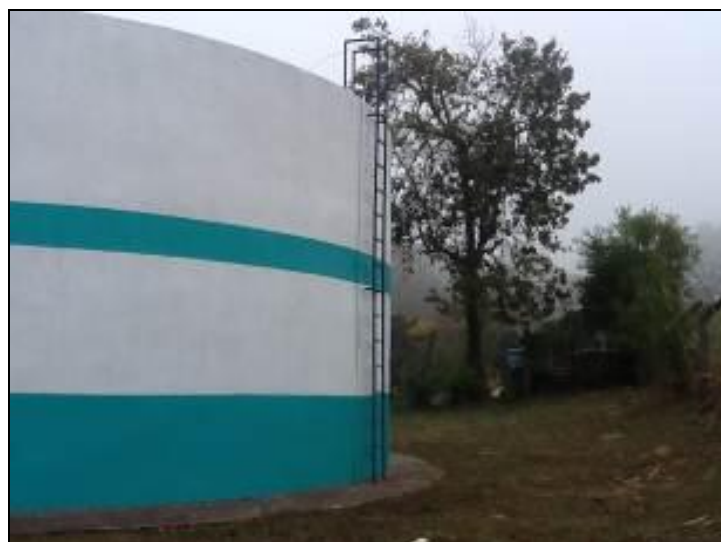
Figura 33: Escada do R-01

4) Existem escadas em boas condições de uso (Resolução AGESAN nº11 - Art. 23º)? Sim (x) Não ( ) Pendência ( ):