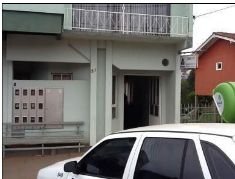
Figura 1: Fachada do Escritório (inicial)

1) Existe identificação de que ali funciona um escritório de atendimento (Lei nº 8.078 Art. 6º)? Sim (x) Não ( ) Pendência ( ):