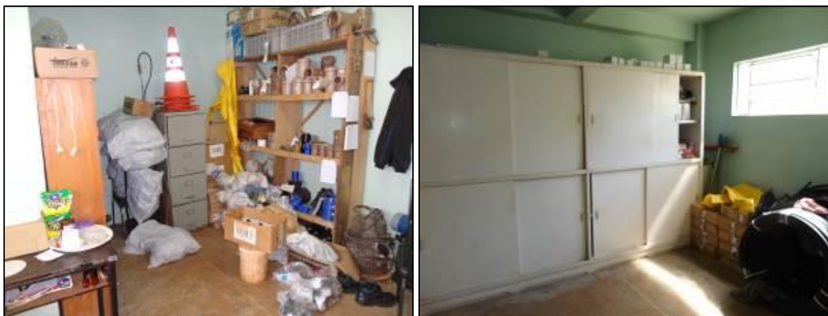
Figura 9: Almoxarifado