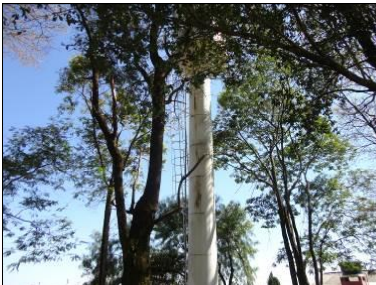
Figura 37: Escada de acesso do R-02 (acompanhamento)

4) Existem escadas em boas condições de uso (Resolução AGESAN nº11 - Art. 23º)? Sim (x) Não ( ) Pendência ( ):