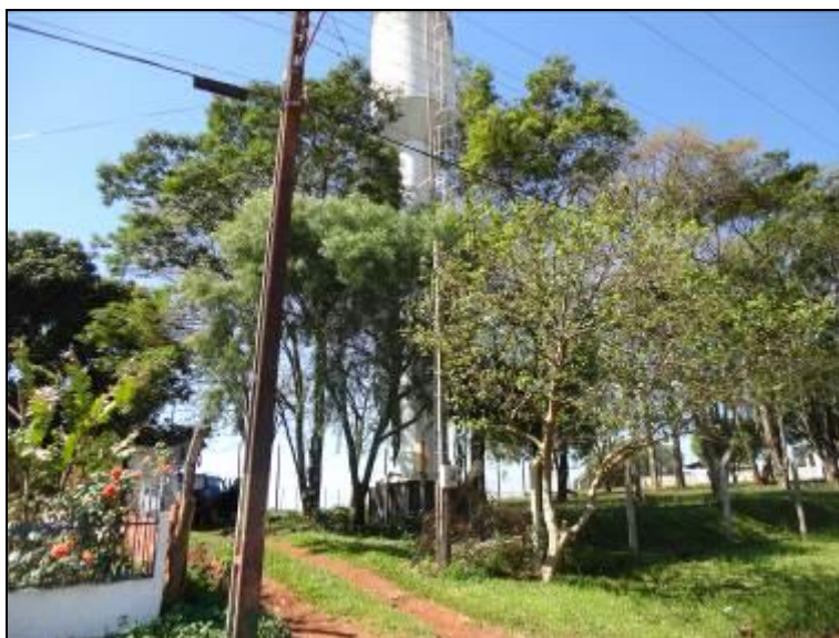
Figura 36: Entorno do R-02 (acompanhamento)

2) As condições de limpeza dos entornos são adequadas (Resolução AGESAN nº11 - Art. 23º)? Sim (x) Não ( ) Pendência ( ):