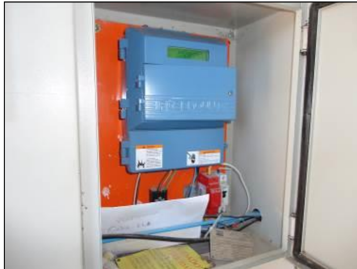
Figura 21: Macro medidor de saída ETA

7) Existe Macromedição na saída (Res. AGESAN nº11 - Art. 17º)? Sim (x) Não ( )