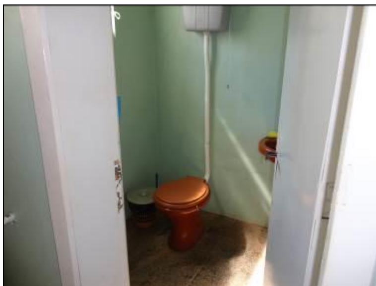
Figura 8: Banheiro Coletivo (acompanhamento)

9) Há sanitários para os usuários (Resolução AGESAN nº 004 - Art. 127)? Sim ( ) Não (x) Encontram-se em boas condições de higiene e limpeza? Sim ( ) Não ( ) Pendência ( ): Obs.: O sanitário é usado tanto para os funcionários como para os usuários.