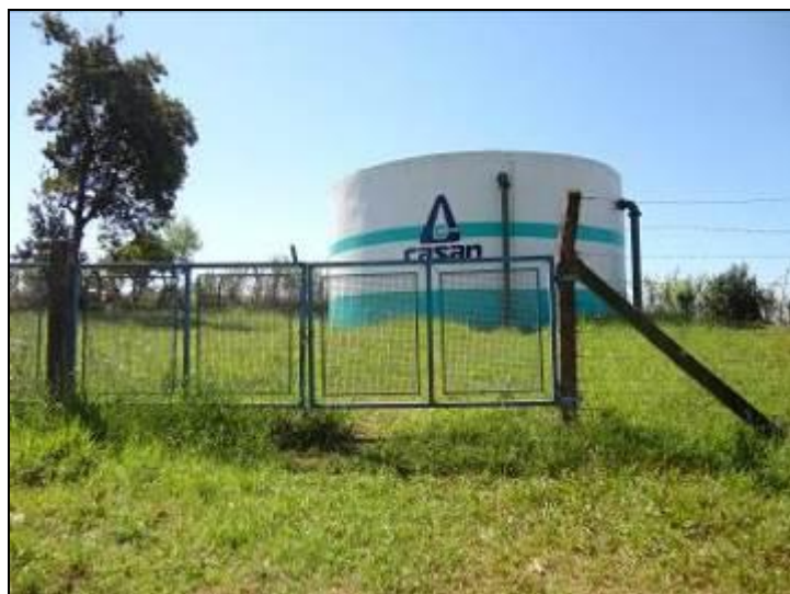
Figura 32: Entorno do R-01 (acompanhamento)

3) As áreas estão devidamente cercadas e trancadas (Resolução AGESAN nº11 - Art. 23º)? Sim (x) Não ( ) Pendência ( ):