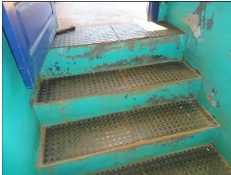
Figura 23: Escada de acesso a ETA

11) As escadas de acesso estão em boas condições de uso (Resolução AGESAN nº11 - Art. 15º)? Sim (x) Não ( ) Pendência ( ):