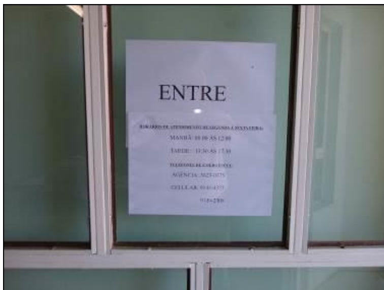
Figura 3: Identificação Horário (acompanhamento)

3) Há placa indicativa do horário de funcionamento (Lei nº 8.078 - Art. 6º)? Sim (x) Não ( ) Pendência ( ):