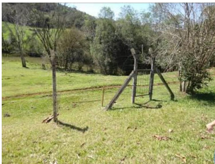
Figura 14: Acesso a captação com cercas precárias (acompanhamento)

RECOMENDAÇÃO 06: Deverá ser providenciado o isolamento dos instrumentos de captação e sua devida identificação.