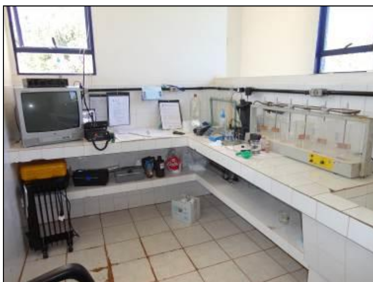
Figura 20: Laboratório da ETA (acompanhamento)