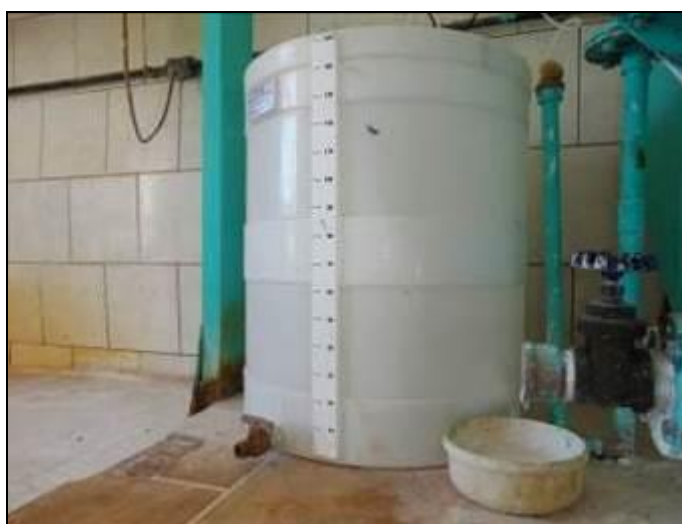
Figura 27: Casa de Química (acompanhamento)

21) Existe almoxarifado para acondicionamento de produtos químicos (Resolução AGESAN nº11 - Art. 18º §2º)? Sim (x) Não ( ) Pendência ( ):