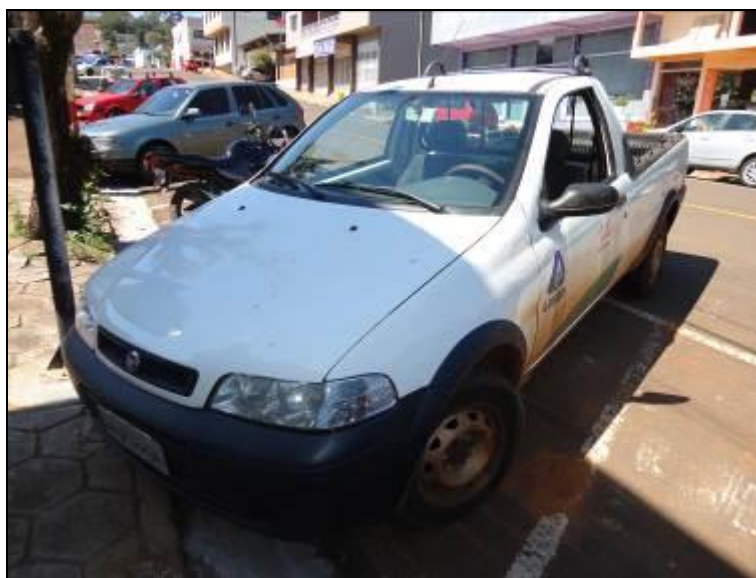
Figura 10: Veículo utilizados pelos funcionários

19) O usuário é comunicado da possibilidade de acompanhamento (Lei nº 8.078 - Art. 6º) ? Sim (x) Não ( )