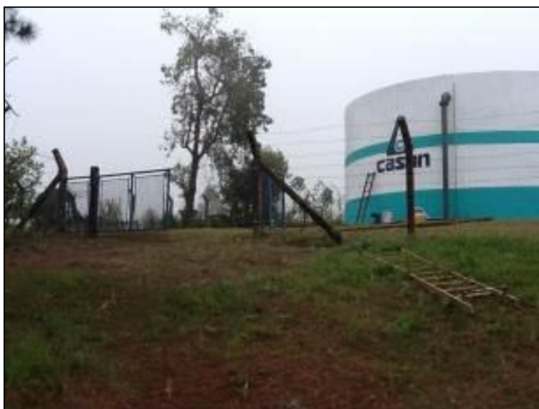
Figura 30: R-01 (inicial)

RECOMENDAÇÃO 11: Providenciar placas indicativas como determina a Resolução.