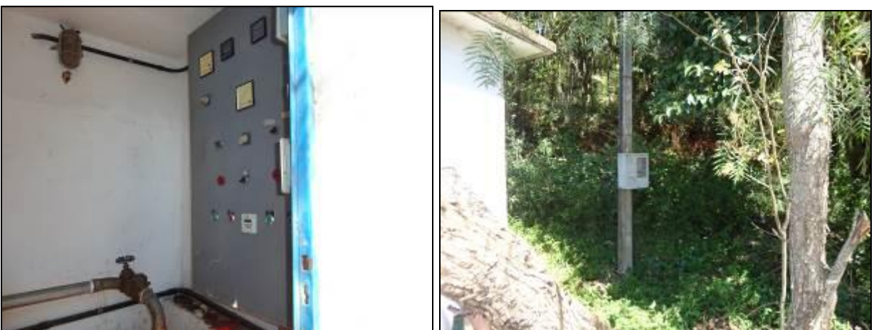
Figura 46: Disjuntor e Quadro de Energia ERAT (acompanhamento)

3) O disjuntor está devidamente trancado? Sim (x) Não ( )