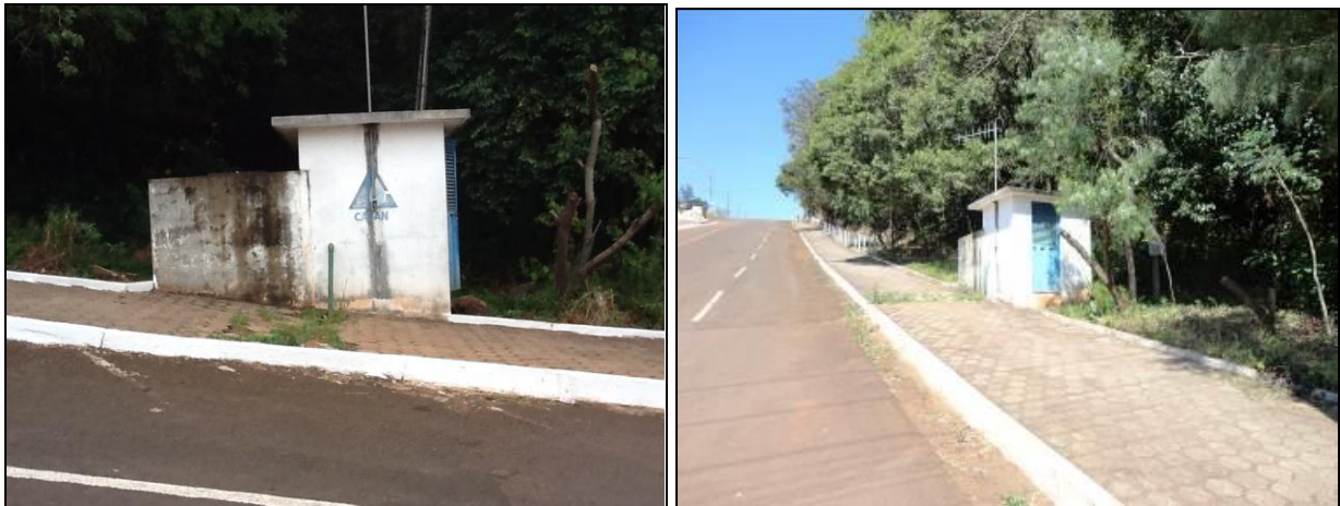
Figura 45: ERAT 2 (inicial e acompanhamento)

2) Estão devidamente isoladas? Sim (x) Não ( ) Pendência ( ):