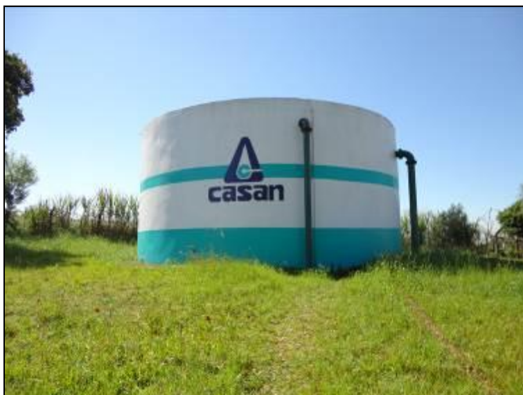
Figura 31: R-01 (acompanhamento)

2) As condições de limpeza dos entornos são adequadas (Resolução AGESAN nº11 - Art. 23º)? Sim (x) Não ( ) Pendência ( ):