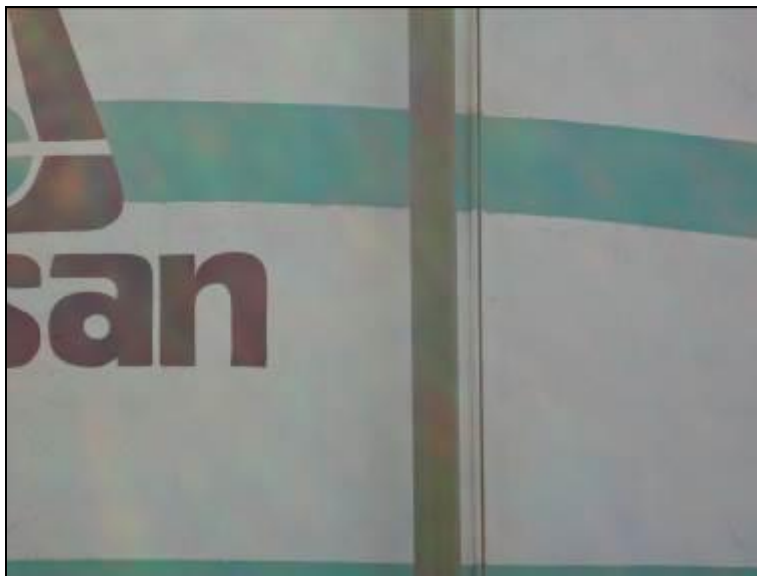
Figura 38: Nível do R-02

9) Existe medidor de nível do reservatório em condições adequadas (Resolução AGESAN Nº11 - Art. 23º)? Sim (x) Não ( ) Pendência ( ):