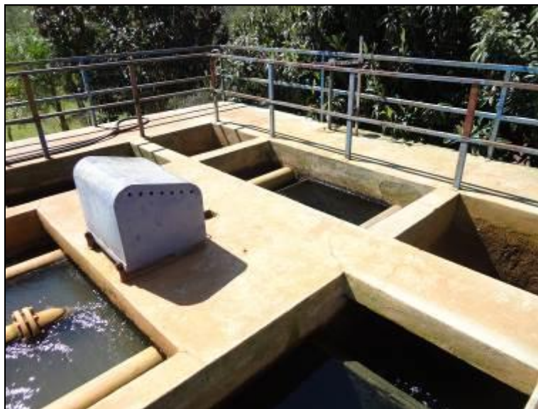
Figura 24: Guarda-Corpo da ETA

12) Há guarda-corpos de segurança para os acessos e aerador (Resolução AGESAN Nº11 - Art. 15º)? Sim (x) Não ( ) Pendência ( ):