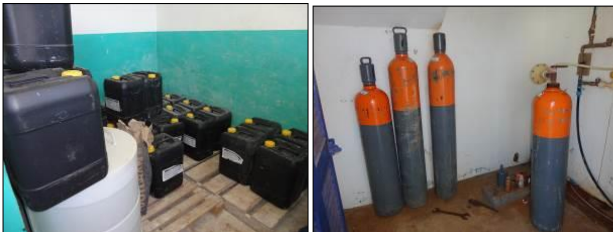
Figura 29: Armazenamento dos produtos químicos (acompanhamento)

22) O empilhamento dos produtos químicos é adequado (Resolução AGESAN Nº11 - Art. 18º §2º)? Sim (x) Não ( ) Pendência ( ):