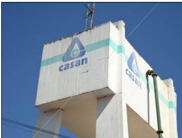
Figura 42: Para-raios do Reservatório (acompanhamento)

7) Apresentam para-raios, iluminação e sinalização noturna (Resolução AGESAN Nº11 - Art. 23º)? Sim (x) Não ( ) Encontram-se em boas condições? Sim ( ) Não ( ) Pendência ( ):