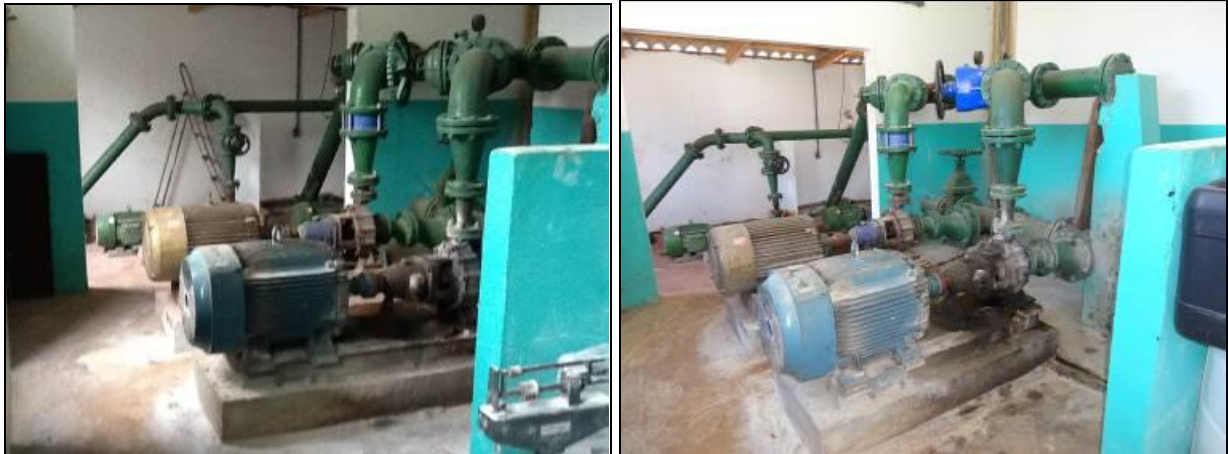
Figura 44: ERAT 1 (inicial e acompanhamento)

RECOMENDAÇÃO 21: Providenciar a identificação na ERAT 02 conforme determina a Resolução.