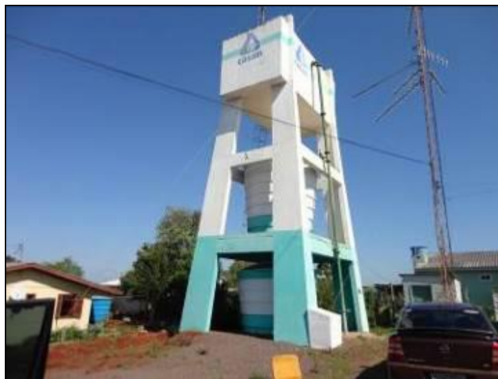
Figura 40: reservatório Belmonte 1-2-3 (acompanhamento)

1) Existem placas indicativas de propriedade e restrição de uso das áreas dos reservatórios (Resolução AGESAN nº 004 - Art.19 - §2º)? Sim ( ) Não (x) Pendência ( ):