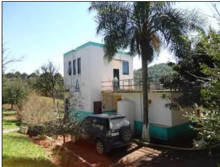
Figura 17: Fachada da ETA (acompanhamento)

1) A ETA possui licenciamento do órgão AMBIENTAL para funcionamento (Conama 237/97 Anexo 1)? Sim ( ) Não ( ) - Nº: Não Informado