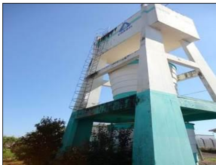
Figura 41: Escada de Acesso do Reservatório (acompanhamento)

4) Existem escadas em boas condições de uso (Resolução AGESAN nº11 - Art. 23º)? Sim (x) Não ( ) Pendência ( ):