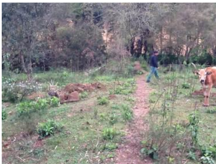
Figura 13: Área do manancial não é cercada, nem identificada (inicial)

3) Existe cerca de proteção da área do manancial (Resolução AGESAN nº11- Art. 10º)? Sim ( ) Não (x) Pendência ( ):