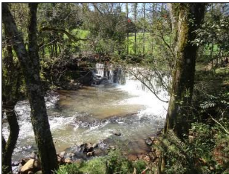
Figura 15: Área do Manancial (acompanhamento)

8) Existe proteção contra enchentes e entrada de pessoas estranhas e animais (Resolução AGESAN Nº11 - Art. 10º)? Sim ( ) Não (x) Pendência ( ):