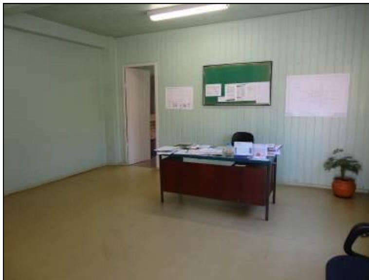
Figura 6: Estrutura do mobiliário (acompanhamento)

7) Os equipamentos e instalações elétricas estão em bom estado (Resolução AGESAN n° 004 - Art. 127)? Sim (x) Não ( )