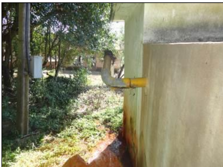
Figura 47: Vazamento na EBAT 2 (acompanhamento)

Observações: Na ERAT 2 verificou-se um vazamento pelo lado externo, ocasionando grande desperdício de água. Todas as áreas das instalações deverão estar documentadas cujas cópias deverão estar disponíveis nas respectivas Agências para Fiscalização.