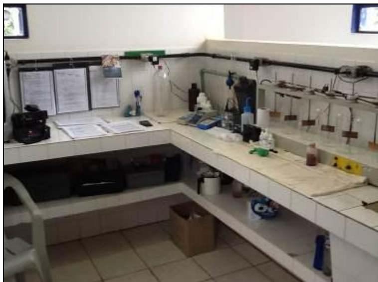
Figura 19: Laboratório da ETA (inicial)

3) As condições do Laboratório são adequadas? Sim (x) Não ( ) Pendência ( ):