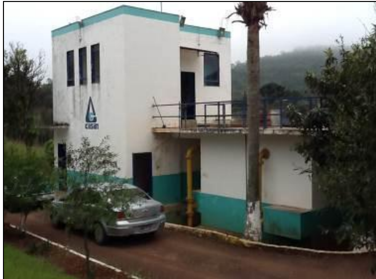
Figura 16: fachada da ETA (inicial)