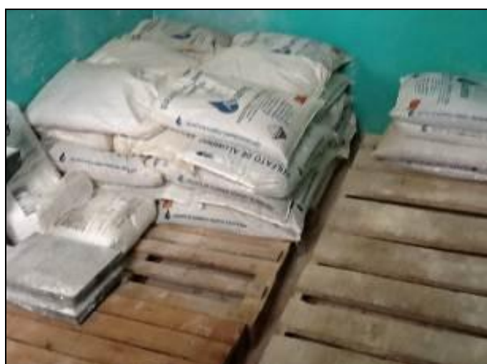
Figura 28: Acondicionamento dos produtos químicos (inicial)

21) Existe almoxarifado para acondicionamento de produtos químicos (Resolução AGESAN nº11 - Art. 18º §2º)? Sim (x) Não ( ) Pendência ( ):