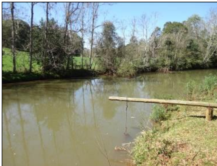
Figura 43: ERAB 1 (acompanhamento)

1) Estão devidamente identificadas? Sim ( ) Não (x) Pendência ( ):