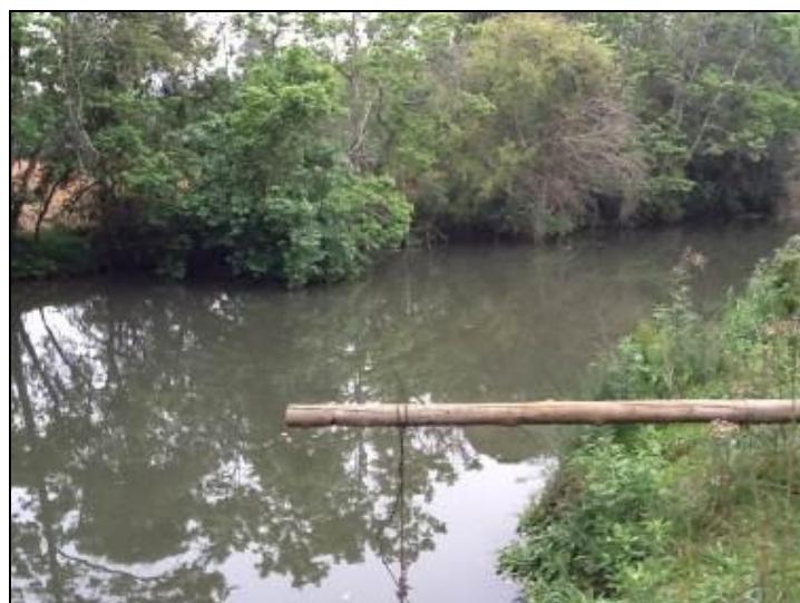
Figura 11: Área do manancial onde é feita a captação (inicial)

Onde é tratada a água deste manancial? ETA