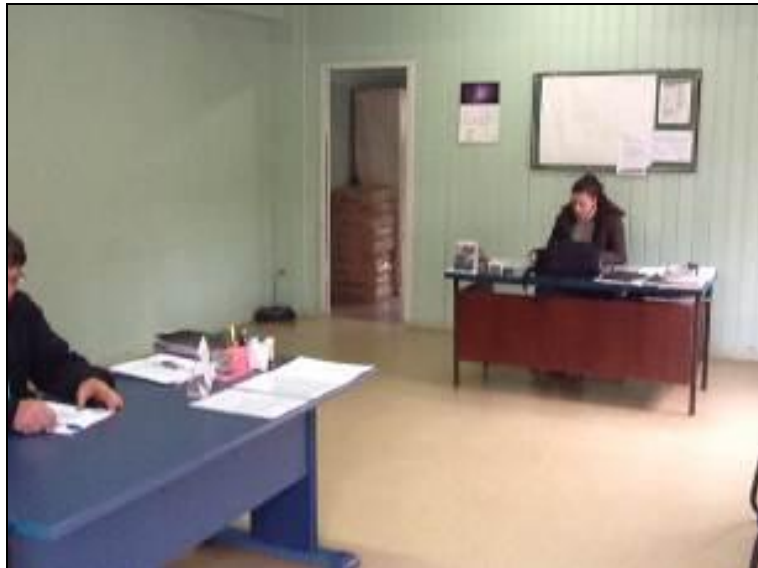
Figura 5: Mobiliário (inicial)