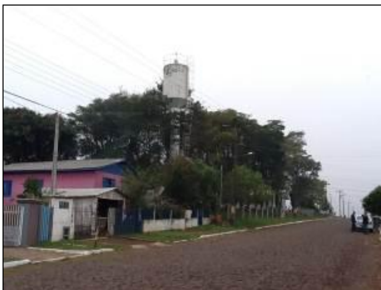
Figura 34: R-02 (inicial)

Posição: Apoiado ( ) Elevado (x) Outro ( )