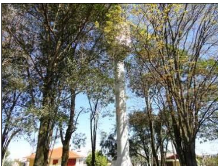
Figura 35: R-02 (acompanhamento)

1) Existem placas indicativas de propriedade e restrição de uso das áreas dos reservatórios (Resolução AGESAN nº 004 - Art.19 - §2º)? Sim ( ) Não (x) Pendência ( ):