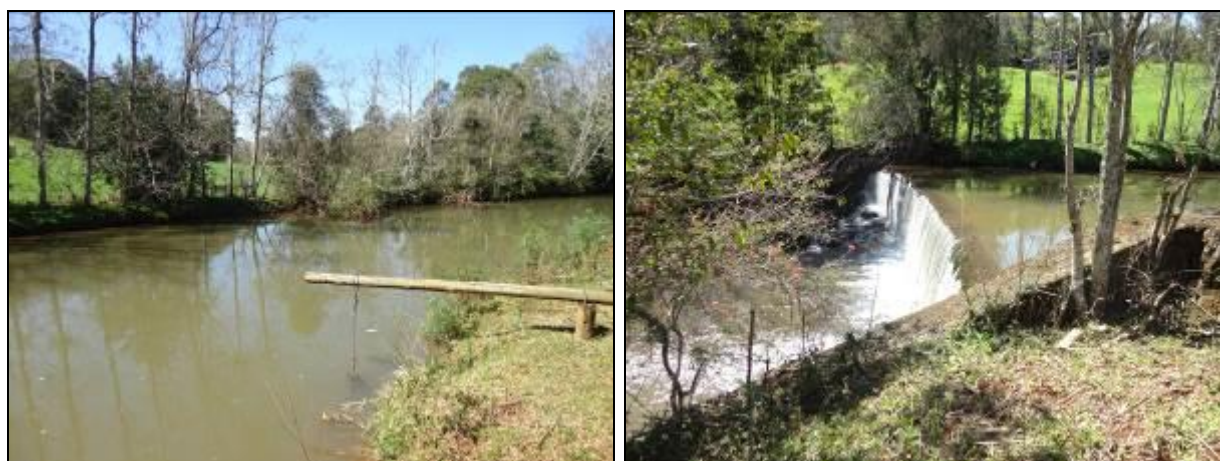
Figura 12: Área de captação - Manancial, barragem e bomba (acompanhamento)

1) Outorga de Uso (Lei nº 9.433/97 - Art. 12º): Sim ( ) Não ( ) Pendência (x):