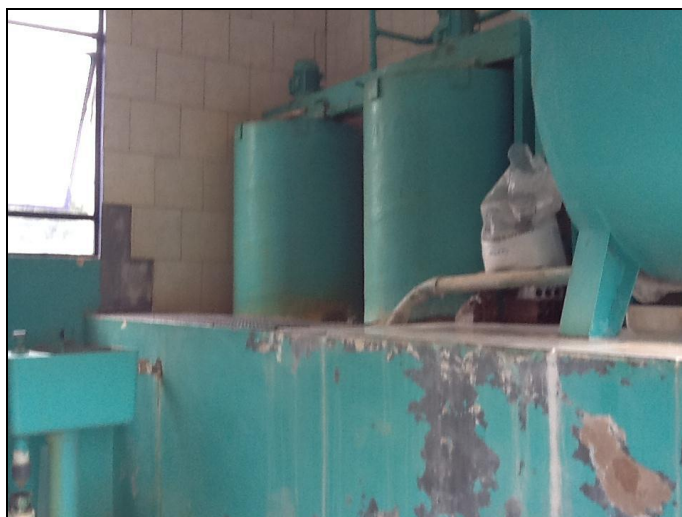
Figura 26: Casa de Química da ETA (inicial)