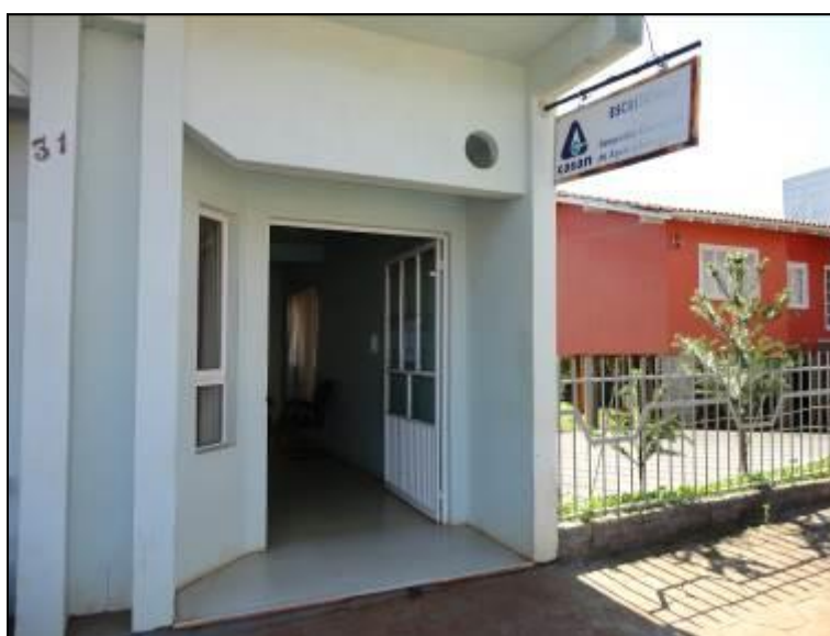
Figura 2: Fachada do escritório (acompanhamento)