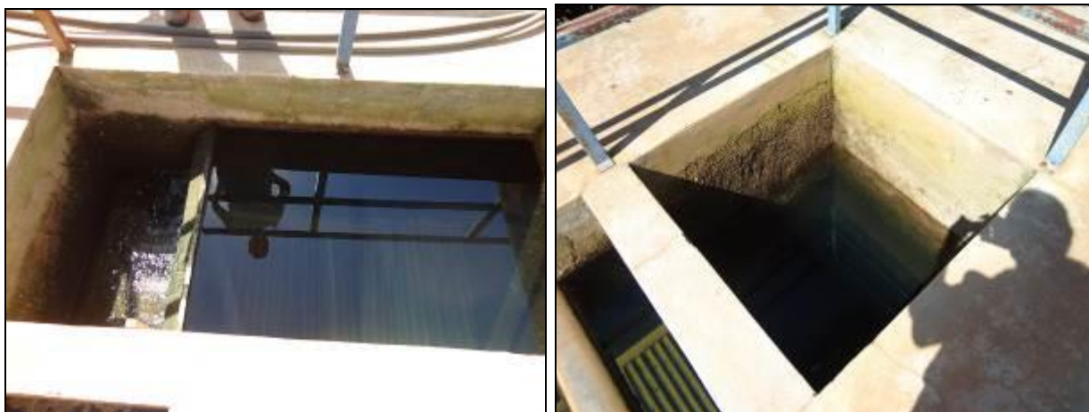
Figura 25: Decantadores

14) Existem escadas de acesso aos decantadores (Resolução AGESAN N°11 - Art. 15°)?