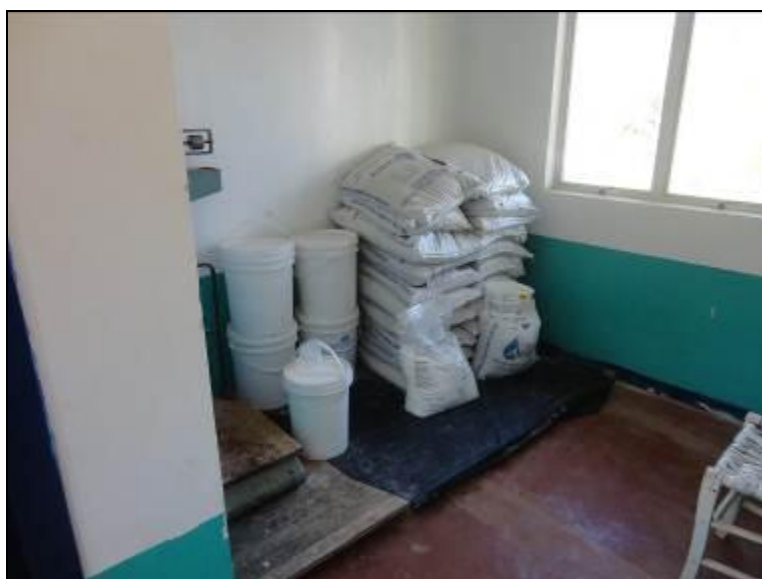
Acondicionamento de produtos químicos.

21) Existe almoxarifado para acondicionamento de produtos químicos (Resolução AGESAN N°11 - Art. 18° §2°)? Sim (x) Não ( ) Pendência ( ): _____