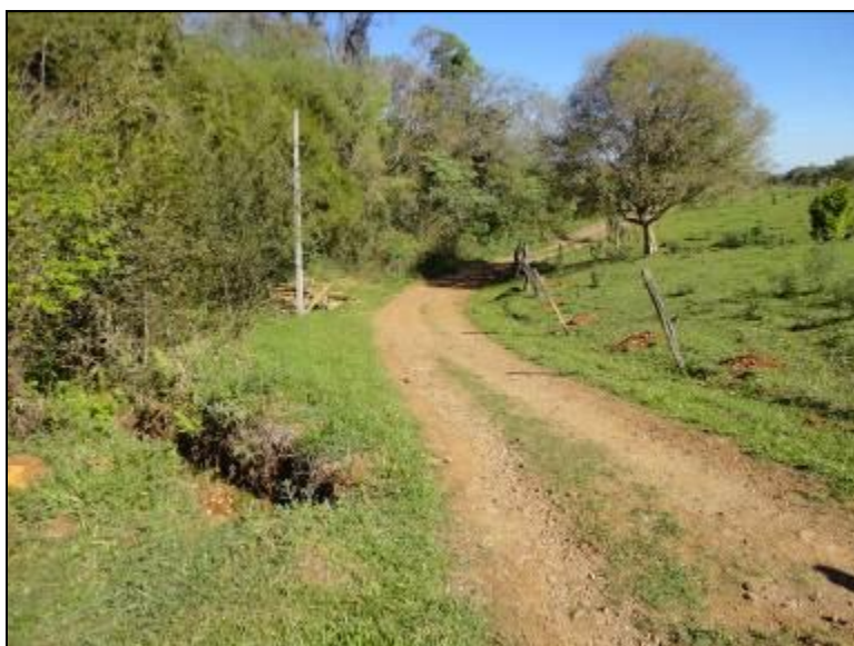
Acesso e entrada da ETA

3) As condições do Laboratório são adequadas? Sim (x) Não ( ) Pendência ( ): _____