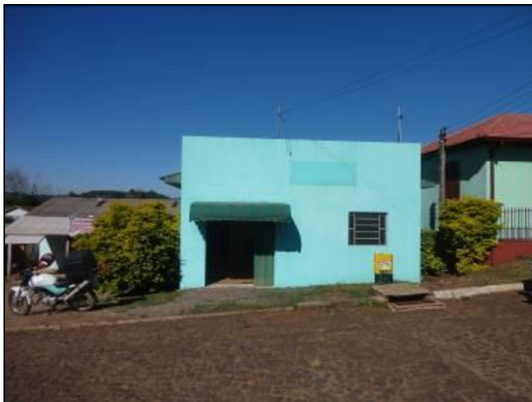
Fachada do Escritório de Bandeirante: ainda não foi aberto ao público

Endereço: Rua João Bataglin, s/n - Centro - Bandeirante/SC