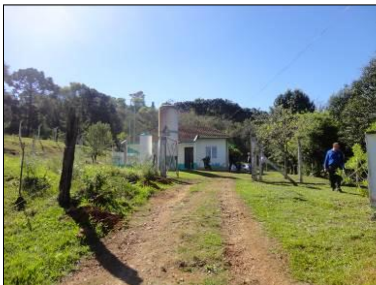
Visão geral da ETA: áreas externas em bom estado de conservação.

10) As condições de limpeza do pátio externo são boas (Resolução AGESAN Nº11 - Art. 15º)? Sim (x) Não ( ) Pendência ( ): _____