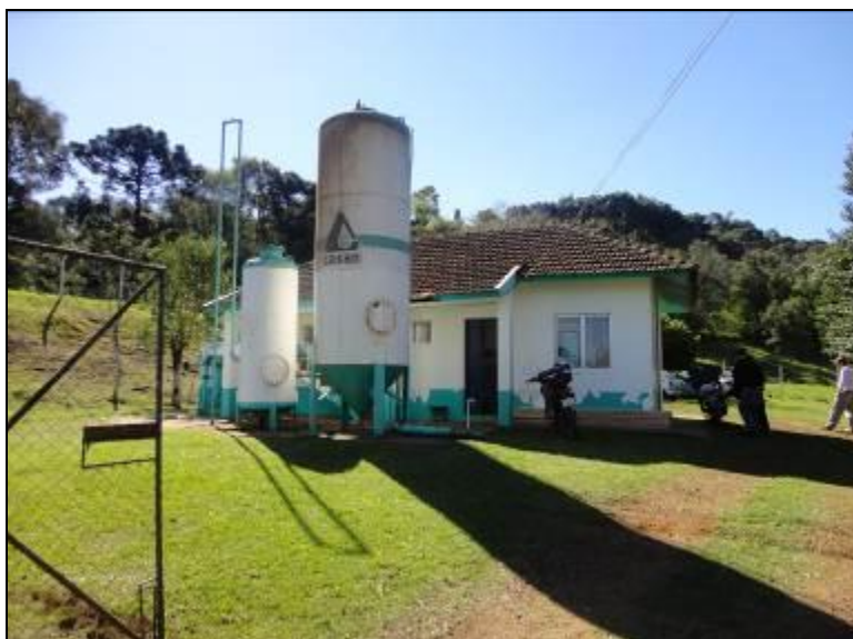
Fachada do prédio da ETA.

2) O acesso à ETA está em boas condições (Resolução AGESAN N°11 - Art. 15º)?