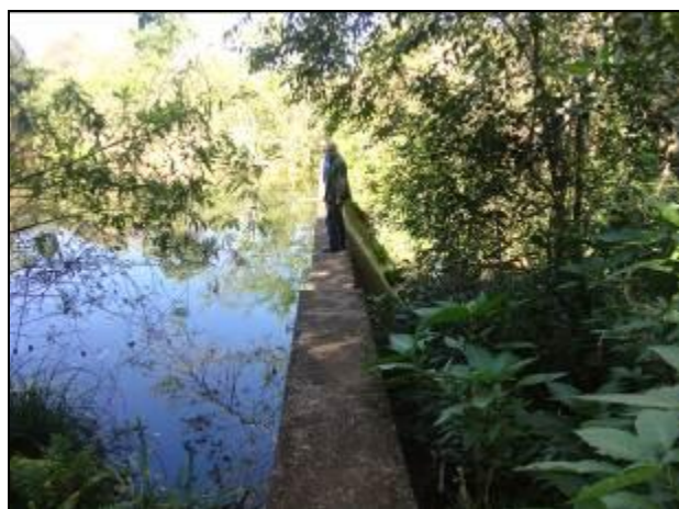
Acessos à captação não oferecem segurança aos operadores.

7) Existe facilidade de acesso ao local (Resolução AGESAN nº11 - Art. 11º)? Sim (x) Não ( ) Pendência (x): Trilha pelo mato e sobre a barragem.