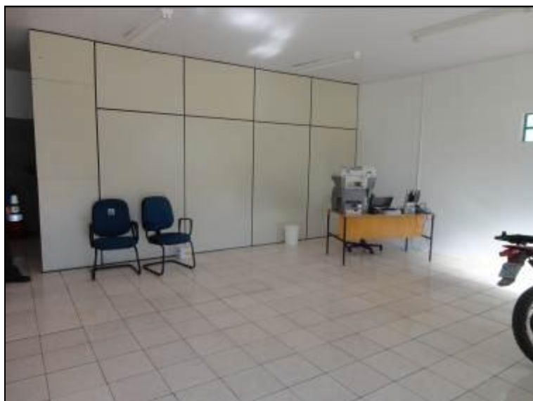
Área interna do Escritório (em implantação).

5) Os equipamentos e instalações elétricas estão em bom estado (Resolução AGESAN nº 004 - Art. 127)? Sim (x) Não ( ) Pendência ( ): _____