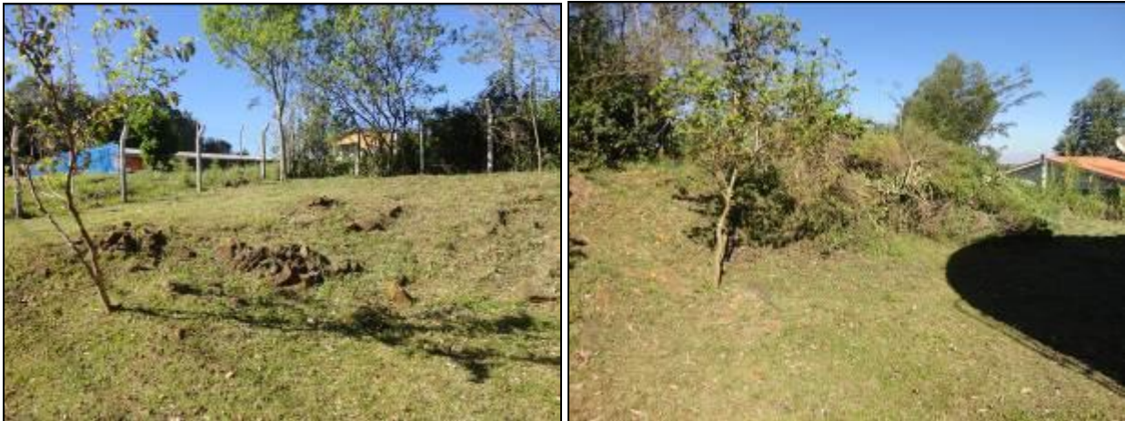
Áreas de entorno dos Reservatórios do SAA.

5) As áreas estão devidamente cercadas e trancadas (Resolução AGESAN N°11 - Art. 23°)? Sim ( ) Não (x) Pendência ( ): _____