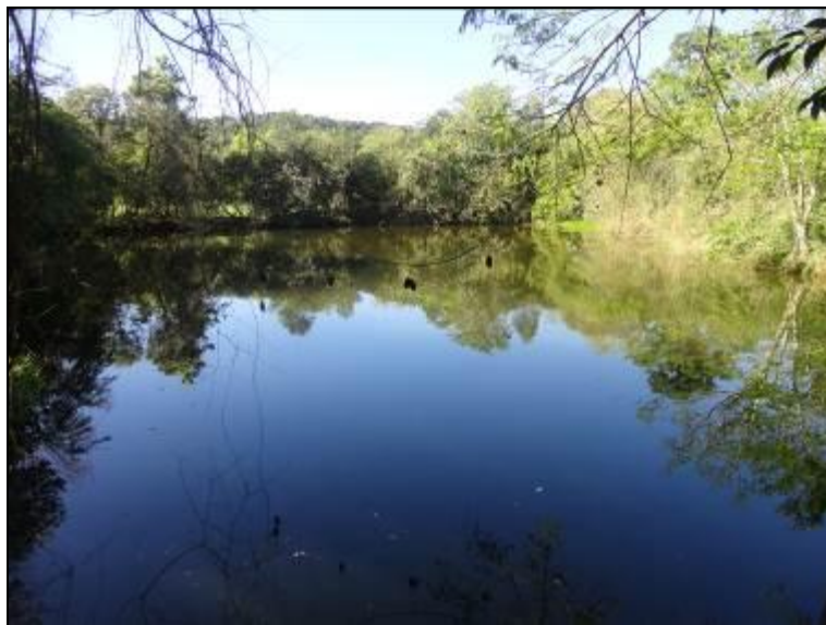
Área do manancial onde é feita a captação.

Manancial: Arroio Bandeirante - Localização: Linha Flor da Serra