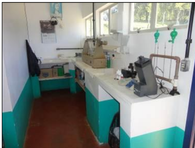
Laboratório da ETA Bandeirante.

6) Existe Macromedição na entrada (Res. AGESAN nº11 - Art. 17º)? Sim ( ) Não (x)