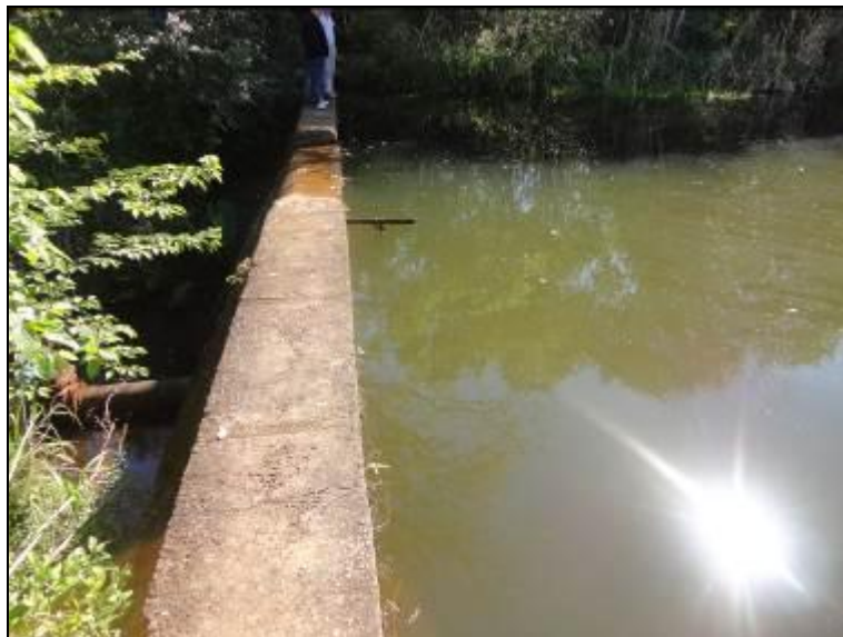
Área do manancial encontra-se desprotegida.

RECOMENDAÇÃO 11: Providenciar o isolamento da área e a instalação de placas de restrição de acesso.