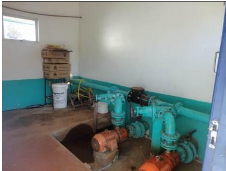
Cada das bombas onde é feito o recalque para a ETA

RECOMENDAÇÃO 12: Providenciar “corredor de acesso” com segurança aos funcionários que fazem a proteção/manutenção da área de captação.