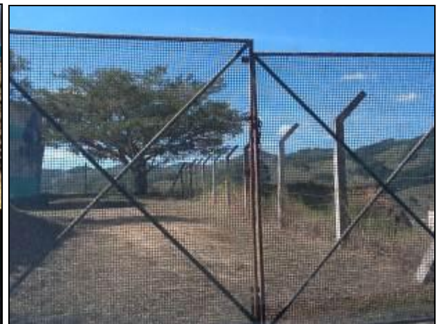
Áreas do entorno da ETA de Armazém.

3) Quais parâmetros são analisados na ETA local? (x) Cloro (x) Flúor ( ) Outros: cor e turbidez (no Laboratório Regional).