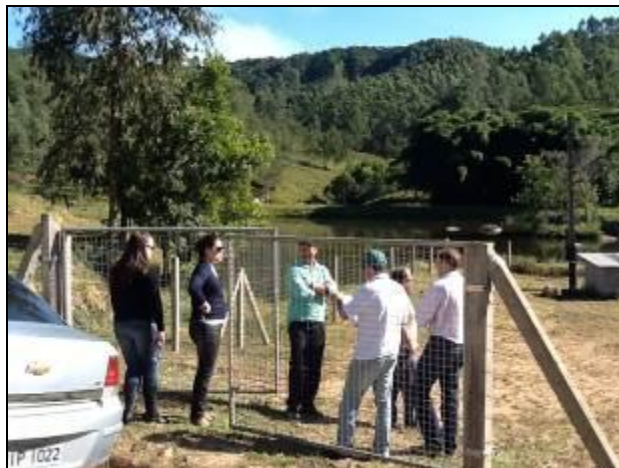
Área do Poço 2, no interior do município.