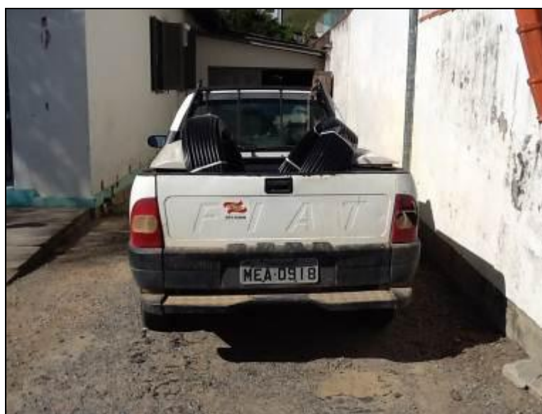
Veículo à disposição da Agência Armazém.