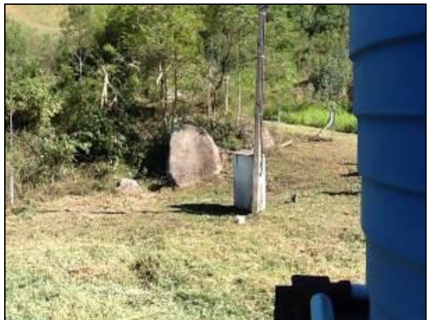
Área do manancial principal: cercas em estado de conservação ruim.

4) O volume captado atualmente garante o abastecimento de água sem haver colapso no abastecimento (NBR 12211 item 5.5)? Sim (x) Não ( ) Pendência ( ): _____