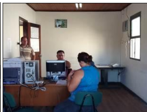
Áreas internas do Escritório.

5) Os equipamentos e instalações elétricas estão em bom estado (Resolução AGESAN N° 004 - Art. 127)? Sim ( ) Não ( ) Pendência (x): Alguns problemas de conservação.