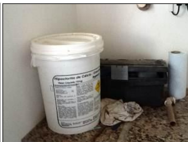
Acondicionamento de produtos químicos.

21) O empilhamento dos produtos químicos é adequado (Resolução AGESAN N°11 - Art. 18° §2°)? Sim (x) Não ( ) Pendência ( ) : _____