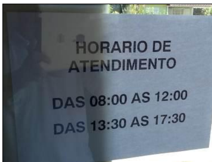
Cartaz com horário

2) Há placa indicativa do horário de funcionamento (Lei nº 8.078 - Art. 6º)? Sim (x) Não ( ) Pendência ( ): _____