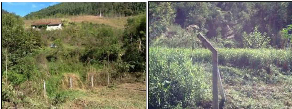
Vista geral do cercamento da área de captação.

R7: Deverão ser providenciadas as reformas necessárias de cercamento, identificação e restrições de uso.