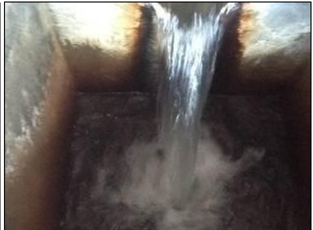
As áreas de tratamento químico da água: apenas aplicação de cloro e flúor por ser água de poço.

12) Os decantadores estão em boas condições (Resolução AGESAN N°11 - Art. 15°)? Sim (x) Não ( ) - N° de decantadores: Não se aplica.