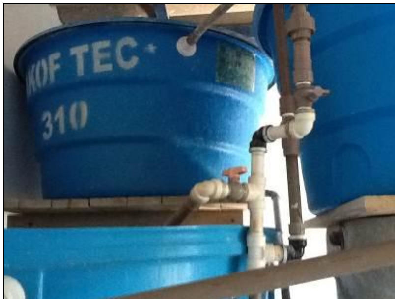
Casa de Química da ETA Armazém.

19) A estrutura do prédio da casa de química está aparentemente segura (Resolução AGESAN N°11 Art. 15°)? Sim (x) Não ( ) Pendência ( ) : _____