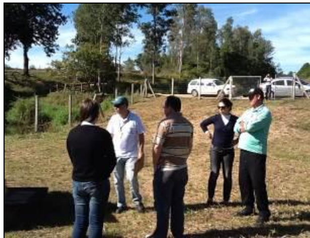
Acesso à área e do Poço 2.

18) Existe proteção contra enchentes e entrada de pessoas estranhas e animais (Resolução AGESAN N°11 - Art. 10°)? Sim ( ) Não ( ) Pendência ( ): Áreas estão cercadas mas não há monitoramento.