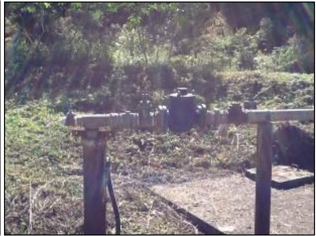
Área do Poço 1, que atende a sede do município.