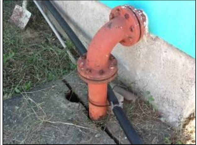
Áreas externas em estado de conservação razoável, apesar de problemas nas cercas e falta de identificação e comunicação visual de restrições de uso..

10) As escadas de acesso estão em boas condições de uso (Resolução AGESAN N°11 - Art. 15°)? Sim ( ) Não ( ) Pendência ( ): Não se aplica.