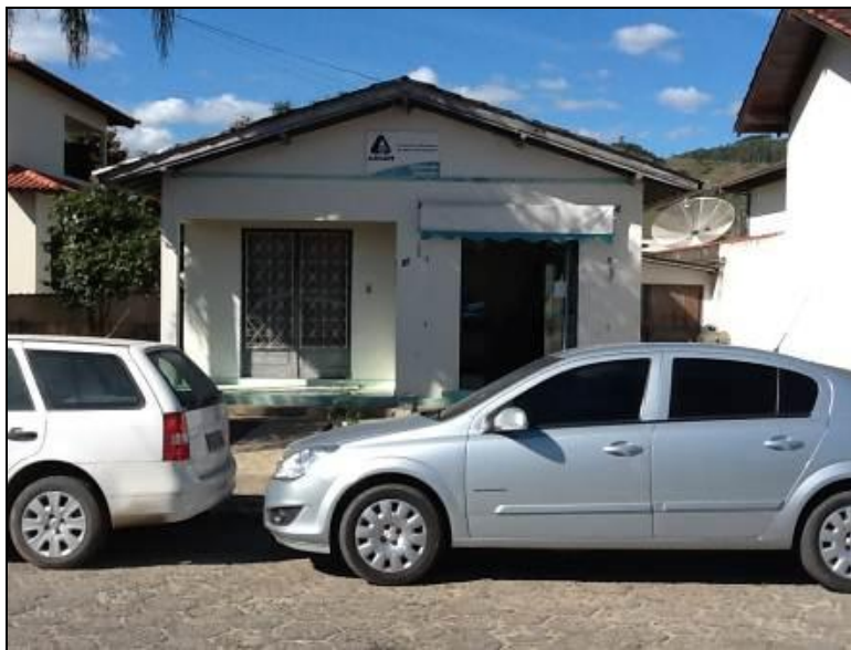
Fachada do Escritório

Endereço: Rua José Mendonça, 135 – Centro (88740-000)