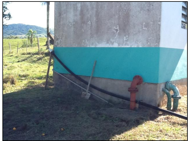
Vistas externas da ETA