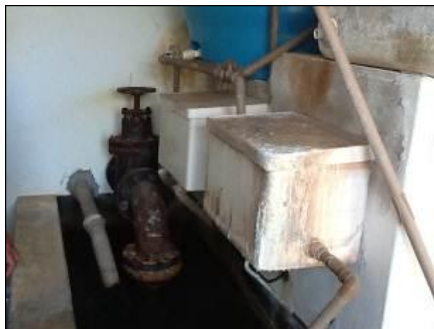
Outros equipamentos de acompanhamento da ETA.