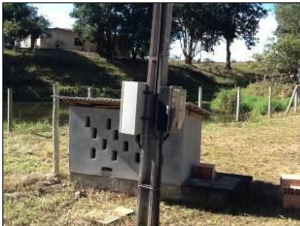
Área do manancial cercada mas não identificada (sem placas).