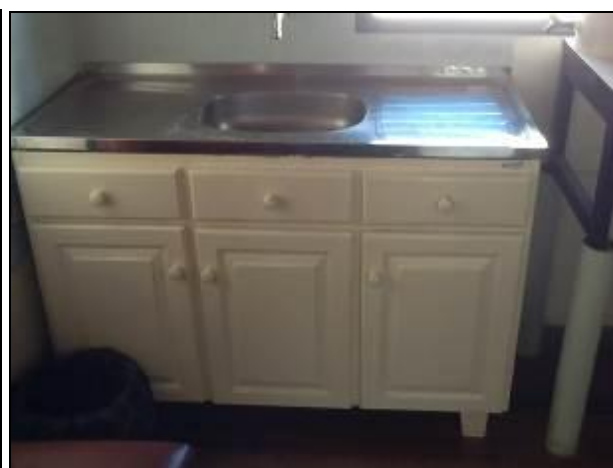
Áreas de uso comum em boas condições de organização e limpeza.