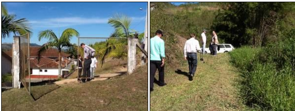
Acesso à área de captação principal, Poço 1.

7) Existe facilidade de acesso ao local (Resolução AGESAN Nº11 - Art. 11º)? Sim (x) Não ( ) Pendência: As estradas de acesso necessitam de melhorias (Pref. Municipal)