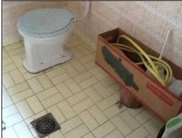
Sanitários de unidades da estrutura de Armazém.