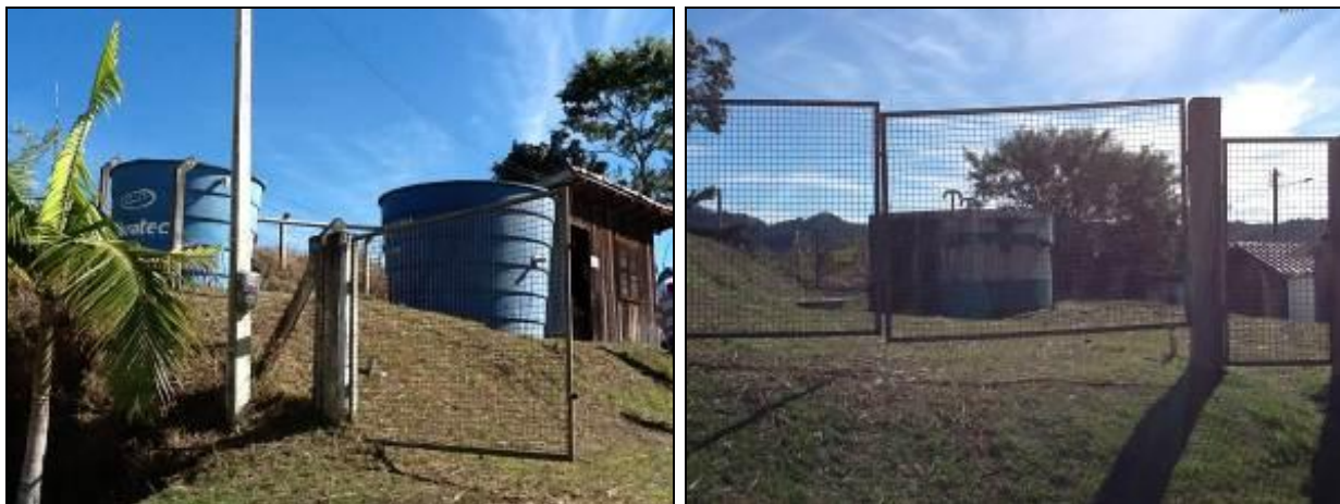
Áreas de entorno dos Reservatórios do SAA Armazém.

4) As condições de limpeza dos entornos são adequadas (Resolução AGESAN N°11 - Art. 23º)? Sim (x) Não ( ) Pendência ( ): _____