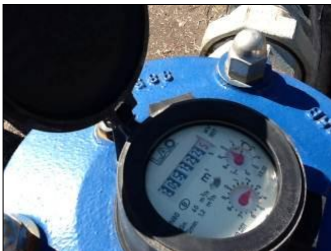
Macromedidor localizado na ETA.