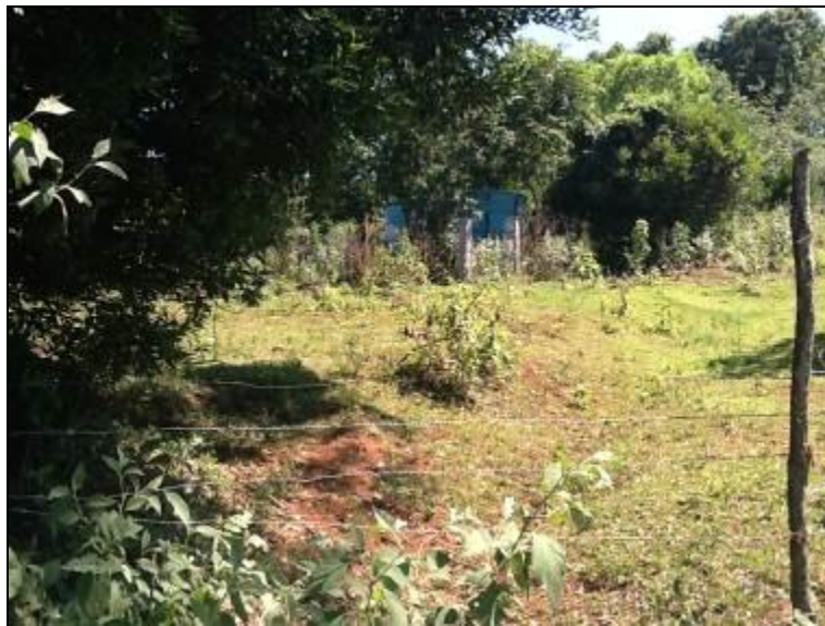
R-03: Pedra Branca