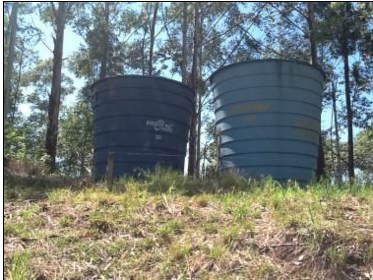
R-02 – Flor da Serra