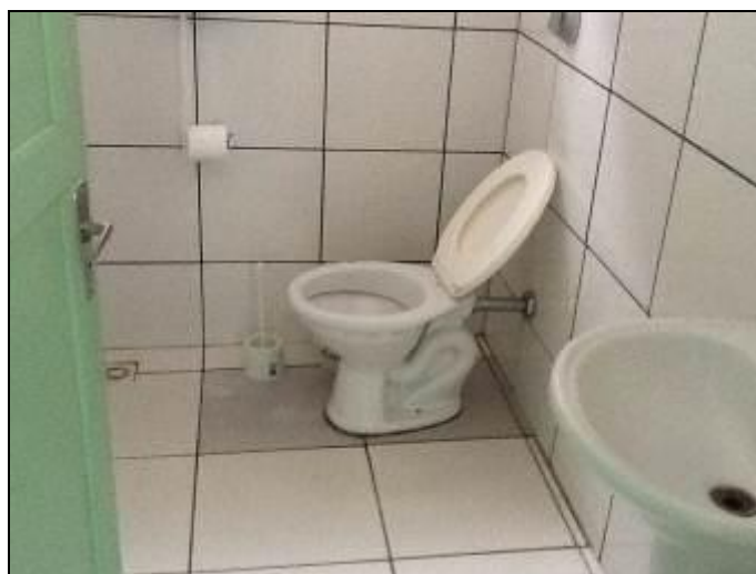
Sanitário do Escritório.

6) Existe sanitário disponível para uso dos funcionários (Resolução AGESAN nº 004 Art. 127)? Sim (x) Não ( ) Encontra-se em boas condições de higiene e limpeza? Sim (x) Não ( ) Pendência ( ):