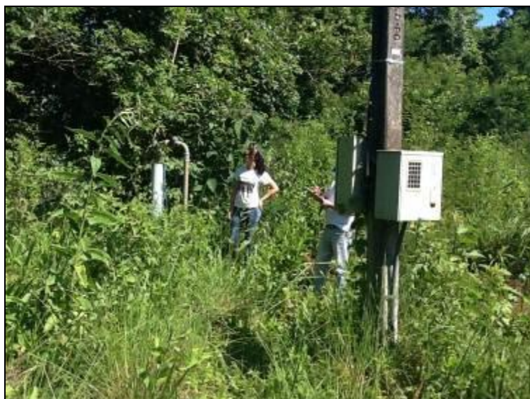
Área do Manancial: não identificada.

4) O volume captado atualmente garante o abastecimento de água sem haver colapso no abastecimento (NBR 12211 item 5.5)? Sim (x) Não ( ) Pendência ( ):