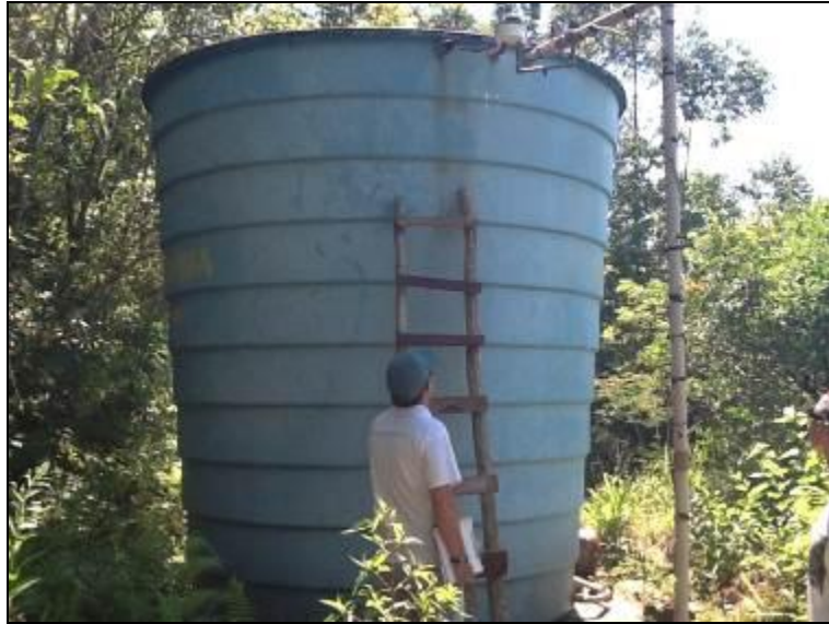
R-01A: Poço Rico