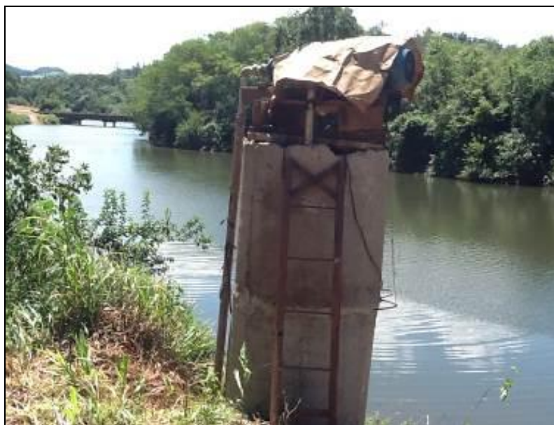
Área Manancial – Rio Sargento

Manancial 01: Rio Sargento - Localização: Linha Marmeleiro