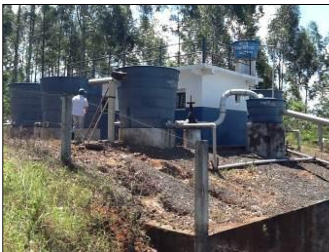
Fachada da ETA

1) A ETA possui licenciamento do órgão AMBIENTAL para funcionamento (Conama 237/97 Anexo 1)? Sim ( ) Não (x) - Nº: Não