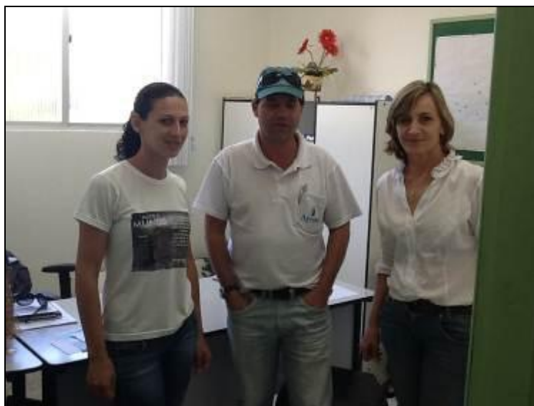
Técnica e Secretária de Saúde com Gerente de Fiscalização da AGESAN

2) Há placa indicativa do horário de funcionamento (Lei nº 8.078 - Art. 6º)? Sim (x) Não ( ) Pendência ( ):