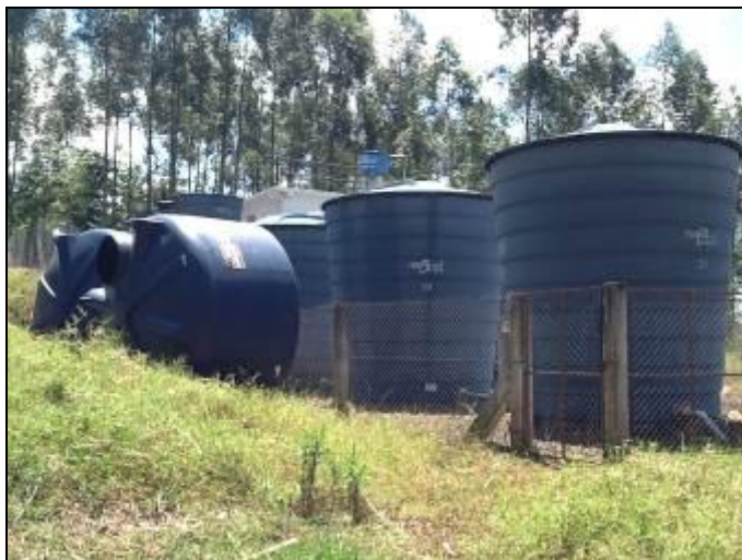
Cerca de Proteção da ETA

8) Existe cerca de proteção da ETA em bom estado de conservação (Resolução AGESAN N°11 - Art. 15º)? Sim (x) Não ( ) Pendência (