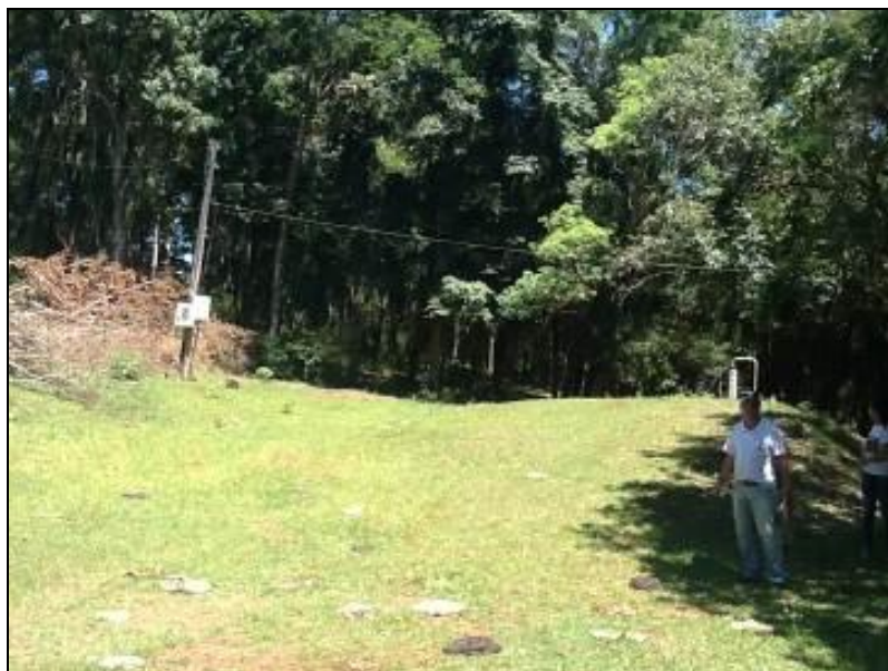
Flor da Serra