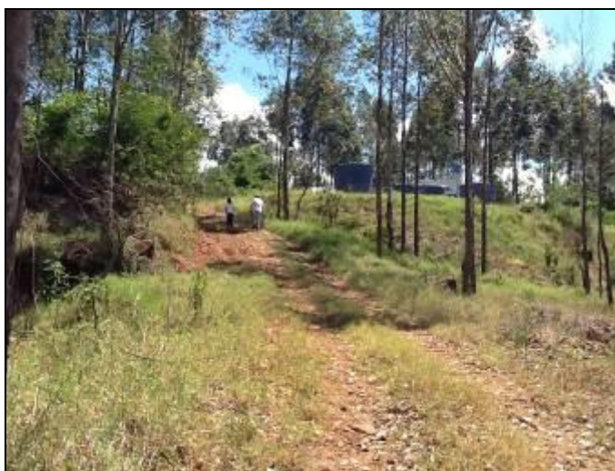
Acesso a ETA

2) O acesso à ETA está em boas condições (Resolução AGESAN Nº11 - Art. 15º)? Sim (x) Não ( ) Pendências ( ):