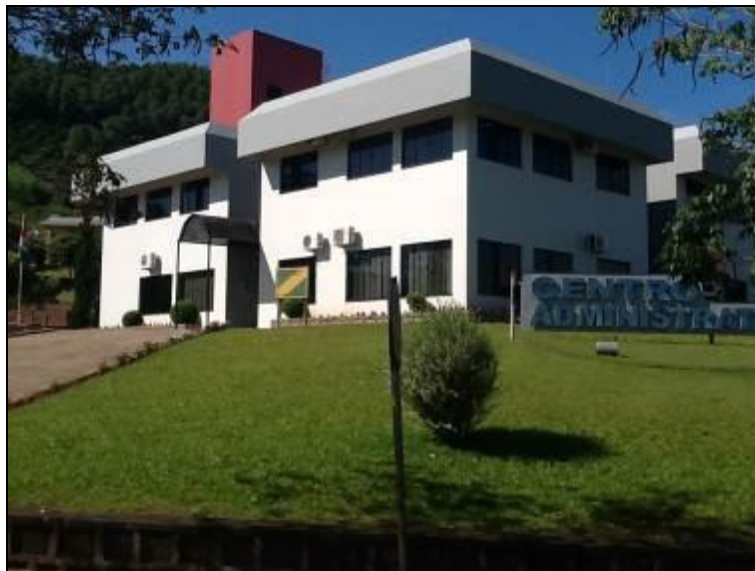
Fachada do Escritório.

Endereço: Av. Flor do Sertão, 533 - Centro – SC