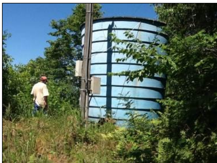
R-01: Poço Rico