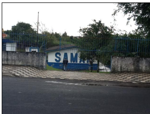
Acessos da ETA Central.

27) Quais parâmetros são analisados na ETA local? Cloro Flúor Outros: cor e turbidez.