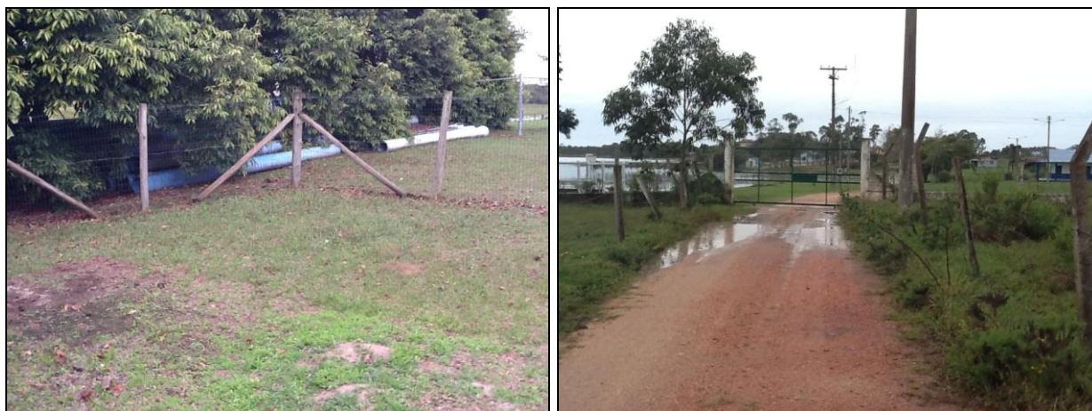
Alguns trechos do cercamento da ETA.

8) Existe cerca de proteção da ETA em bom estado de conservação (Resolução AGESAN Nº11 - Art. 15º)? Sim (x) Não ( ) Pendência ( ):