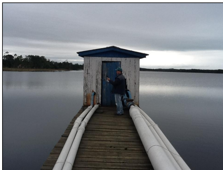
ERAB no interior