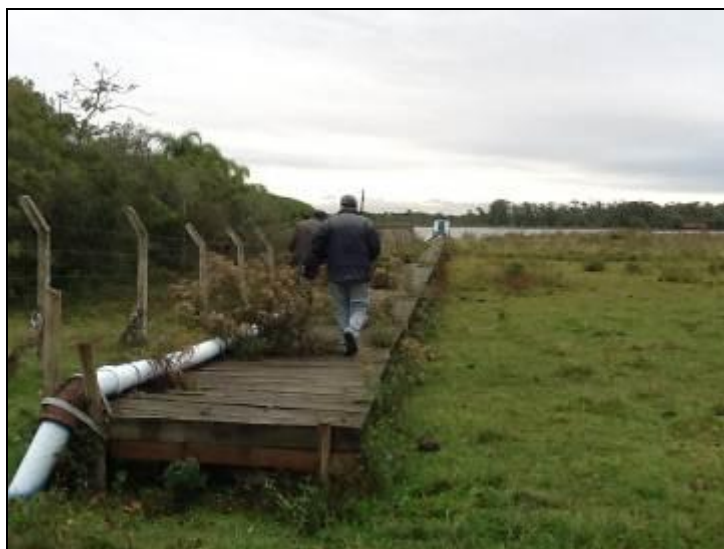
Acesso à área de captação terciária necessitando de melhorias.

7) Existe facilidade de acesso ao local (Resolução AGESAN N°11 - Art. 11º)? Sim (x) Não ( )