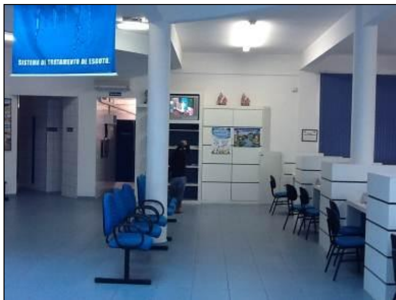
Estrutura interna para atendimento ao público.

1) Existe identificação de que ali funciona um escritório de atendimento (Lei nº 8.078 Art. 6º)? Sim (x) Não ( ) Pendência ( ): _____