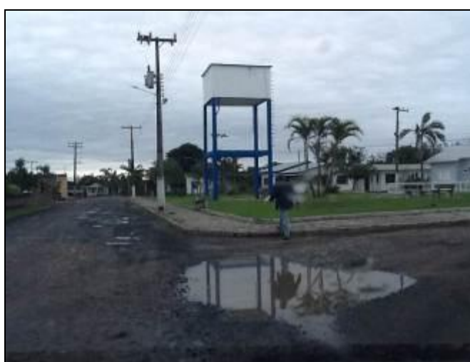
Reservatório Hercílio Luz