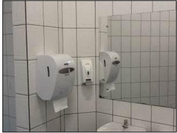
Sanitários disponíveis em Araranguá.