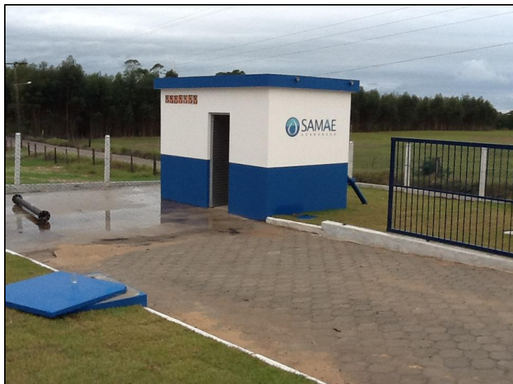
Entorno da ETA em boas condições

74) O acesso à ETA está em boas condições (Resolução AGESAN N°11 - Art. 15°)? Sim (x) Não ( ) Pendências ( ):