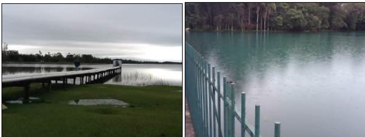
Áreas de Manancial à esquerda em Morro dos Conventos e à direita na área central.

A - Manancial: Lagoa dos Bichos - Localização: Morro dos Conventos.