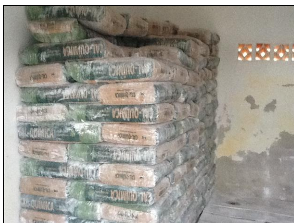
Acondicionamento de produtos químicos.