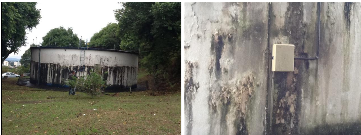
Áreas externas e de entorno dos Reservatórios do SAA Araranguá.