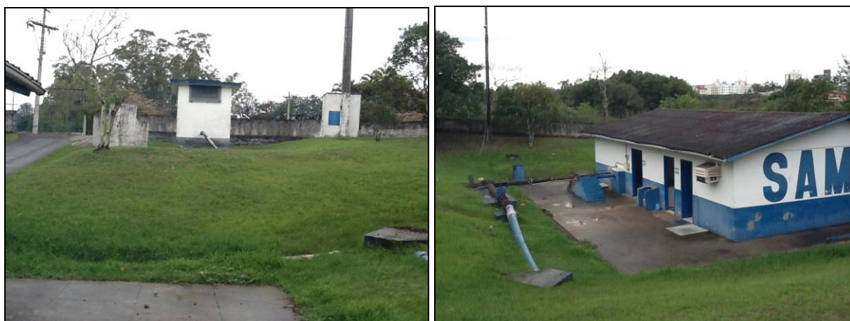
Áreas externas em estado razoável de conservação, com exceção dos prédios.

33) As condições de limpeza do pátio externo são boas (Resolução AGESAN N°11 - Art. 15º)? Sim (x) Não ( ) Pendência ( ): _____