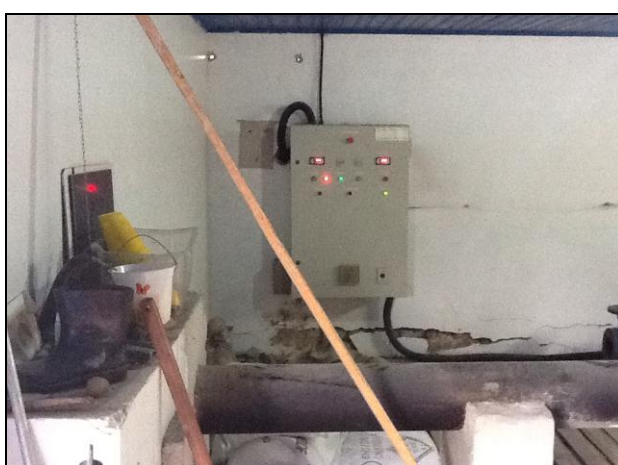
Estruturas internas da ETA Araranguá necessitando de melhorias.