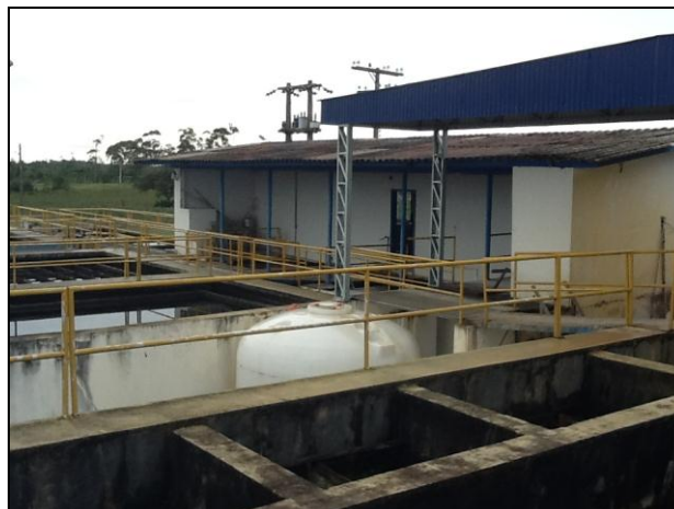
Estruturas de Filtros e Decantadores.

13) Existem escadas de acesso aos decantadores (Resolução AGESAN N°11 - Art. 15°)? Sim (x) Não ( ) Pendência ( ): _____