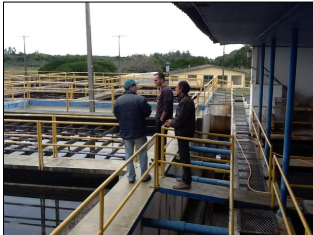
As áreas de tratamento físico da água contam com proteção de guarda-corpo.

12) Os decantadores estão em boas condições (Resolução AGESAN N°11 - Art. 15°)? Sim (x) Não ( ) - N° de decantadores: 01 (um) .