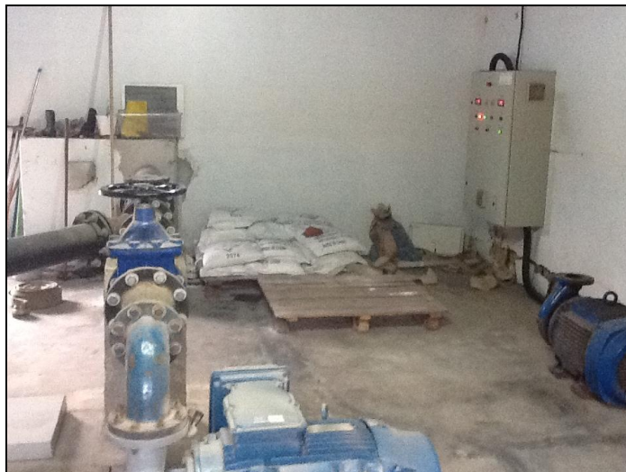
Acondicionamento de produtos químicos.

AGESAN N°11 - Art. 18° §2°)? Sim (x) Não ( ) Pendência ( ): _____