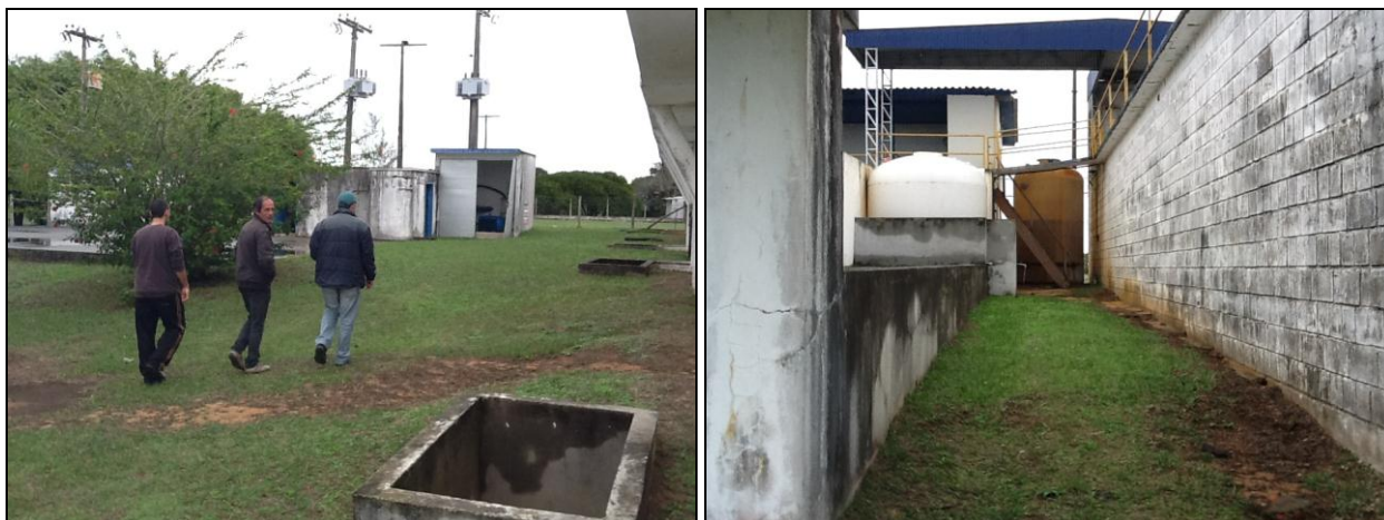
Pátios externos em bom estado de conservação, mas os prédios necessitam de pinturas.

9) As condições de limpeza do pátio externo são boas (Resolução AGESAN Nº11 - Art. 15º)? Sim (x) Não ( ) Pendência ( ):