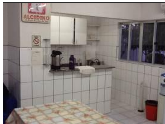
Áreas de uso comum em boas condições de organização e limpeza.