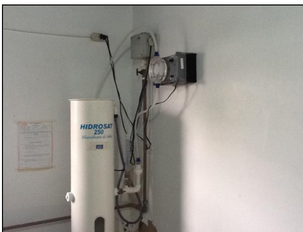
Outros equipamentos estruturais da ETA.

31) Existe alguma medida em relação ao controle de perdas (Resolução AGESAN N°11 - Art. 17°)? Sim Não