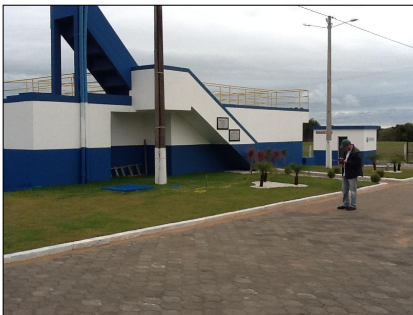
ETA às vésperas da inauguração