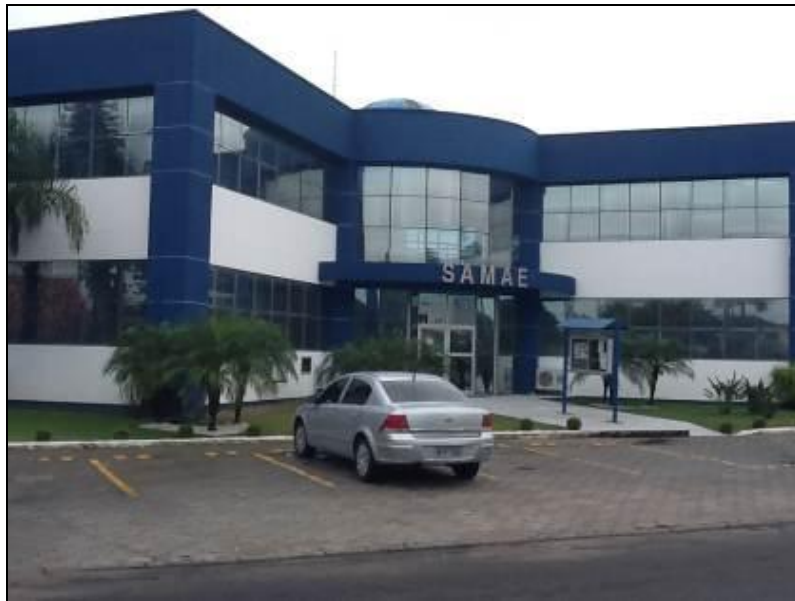
Fachada do Escritório

Endereço: Rua Expedicionário Iraci Luchina, 711 – Urussanguinha – Araranguá.