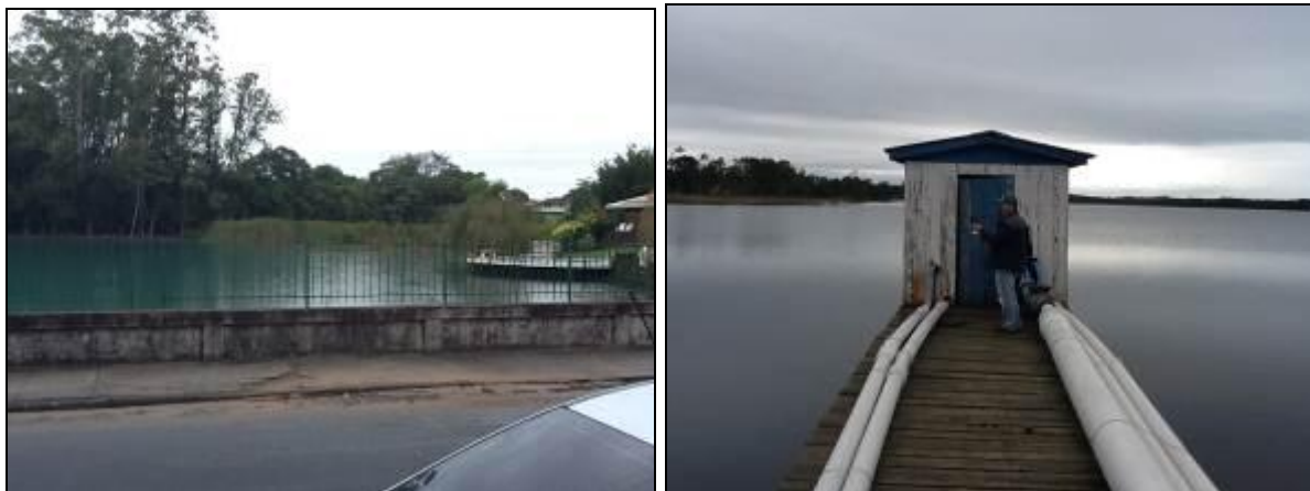
Lagoa da área central e à direita captação principal.

3) Existe cerca de proteção da área do manancial (Resolução AGESAN N°11- Art. 10º)? Sim ( ) Não (x) Obs.: No lago da área central há isolamento parcial.