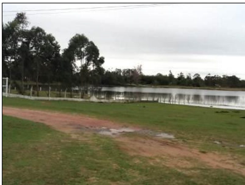
Área do Manancial.

B - Manancial: Lagoa da Serra - Localização: Lagoa da Serra.