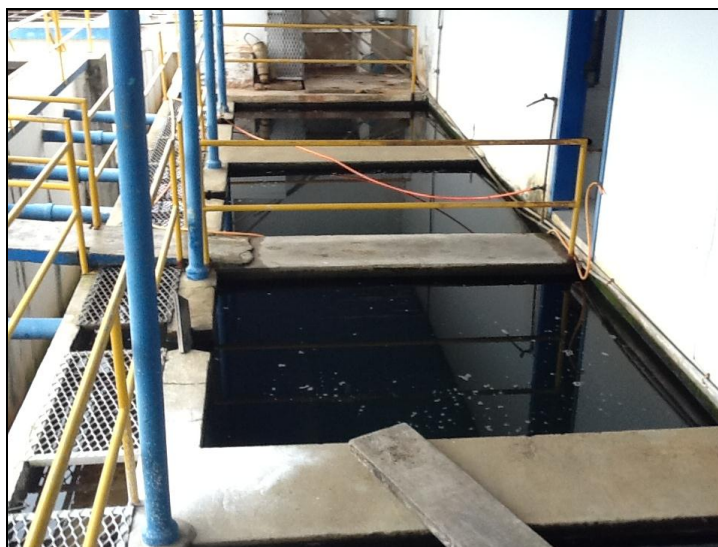
Outras estruturas de tratamento físico da ETA.