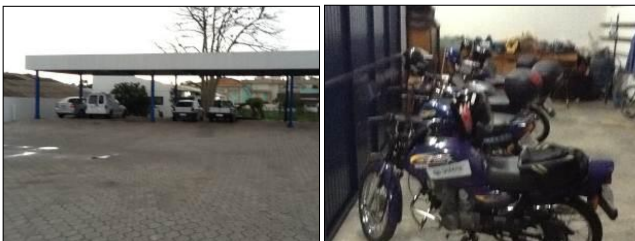
Alguns dos veículos à disposição da SAMAE.