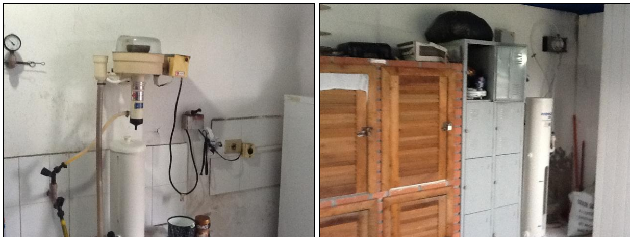
Outros equipamentos de acompanhamento da ETA.

6) Existe Macromedição na saída (Res. AGESAN nº11 - Art. 17º)? Sim ( ) Não (x)