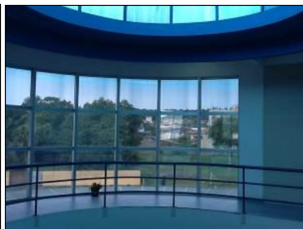
Áreas internas da sede do SAMAE - Araranguá.

5) Os equipamentos e instalações elétricas estão em bom estado (Resolução AGESAN Nº 004 - Art. 127)? Sim (x) Não ( ) Pendência ( ): _____