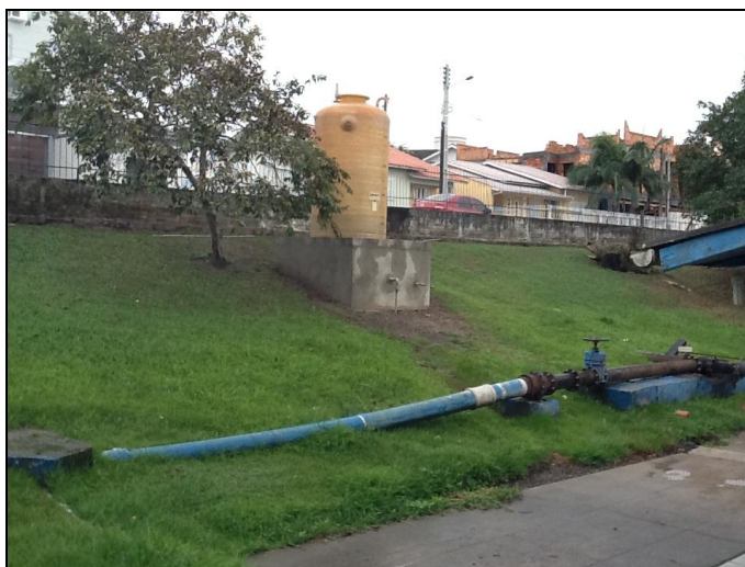
Alguns trechos do cercamento da ETA.

33) As condições de limpeza do pátio externo são boas (Resolução AGESAN N°11 - Art. 15º)? Sim (x) Não ( ) Pendência ( ): _____