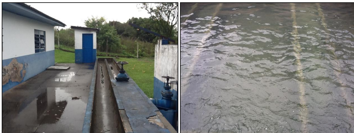
As áreas de tratamento físico da água contam com proteção de guarda-corpo.

35) Há guarda-corpos de segurança para os acessos e aerador (Resolução AGESAN n°11 - Art. 15º)? Sim (x) Não ( ) Pendência ( ): _____