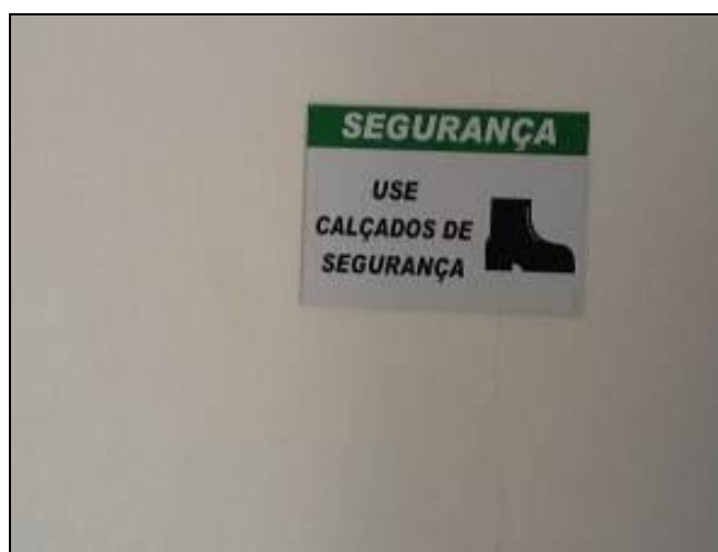
Orientação para uso de Equipamentos de Proteção Individual.

14) As ferramentas de trabalho estão dispostas em local adequado e seguro ( picaretas, pás, enxadas, alavancas etc. )? Sim (x) Não ( )