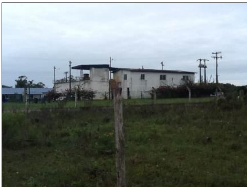
Fachada da ETA

Obs.: Tratamento Aplicado: Convencional.