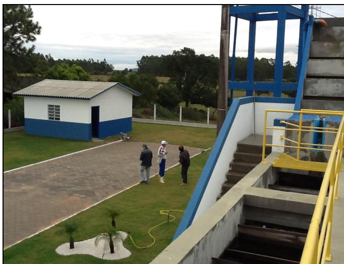
Área encontra-se toda cercada.

81) As condições de limpeza do pátio externo são boas (Resolução AGESAN N°11 - Art. 15º)? Sim (x) Não ( ) Pendência ( ): _____