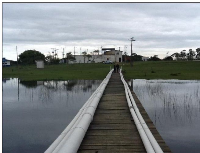
Vista geral da ETA.

Contato: Engº Mário Cesar Copetti - Fone(s): (48) 35240837