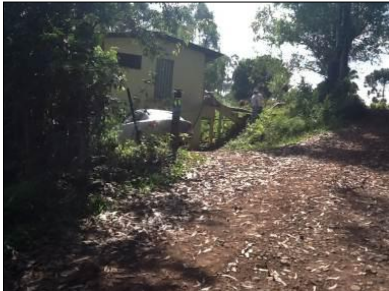
Acesso e entrada da ETA

3) As condições do Laboratório são adequadas? Sim ( ) Não ( ) Pendência (x): O laboratório encontra-se abandonado.