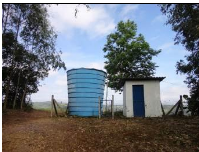
Reservatórios e recalque.