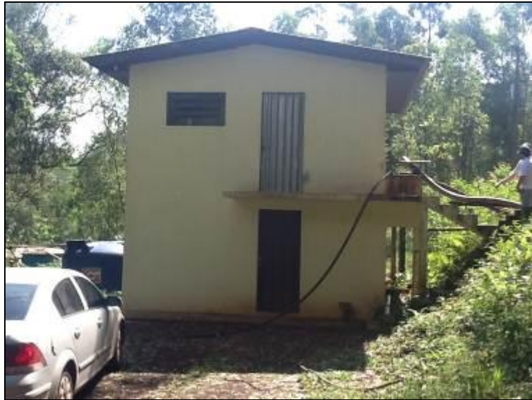
Fachada da ETA