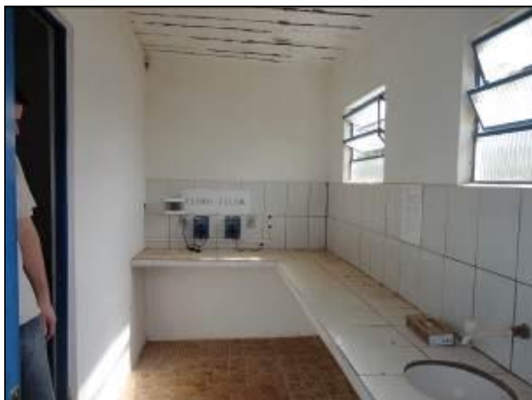
Laboratório da ETA