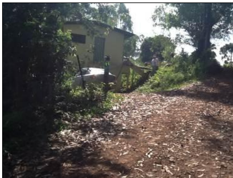
Áreas externas da Estação de Tratamento.