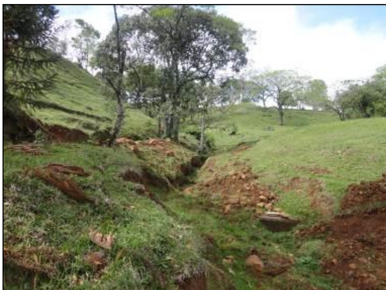
Área do manancial não é cercada, nem identificada.

4) O volume captado atualmente garante o abastecimento de água sem haver colapso no abastecimento (NBR 12211 item 5.5)? Sim ( ) Não ( ) Pendência (x): Quando há estiagem, não atende.