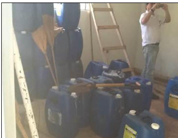
Acondicionamento de produtos químicos.

21) Existe almoxarifado para acondicionamento de produtos químicos (Resolução AGESAN N°11 - Art. 18º §2º)? Sim (x) Não ( ) Pendência ( ) :