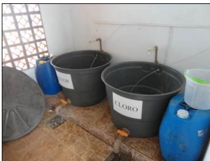
Casa de Química da ETA

20) A estrutura do prédio da casa de química está aparentemente segura (Resolução AGESAN N°11 Art. 15º)? Sim (x) Não ( ) Pendência ( ) :