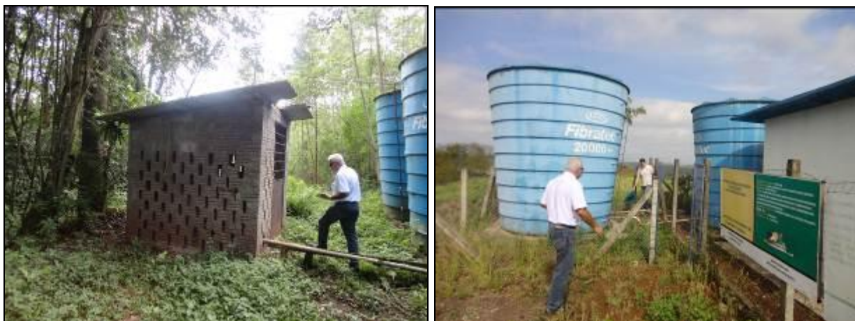
Áreas de entorno dos Reservatórios

RECOMENDAÇÃO 14: Manter as áreas de entorno em condições de limpeza e higiene adequados (roçadas, etc.)