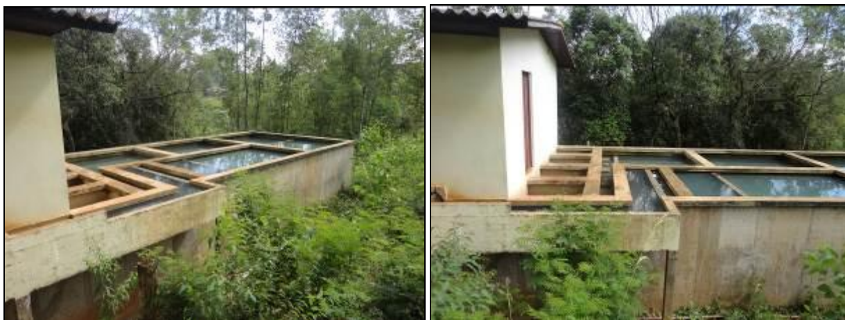
As áreas de tratamento físico da água.