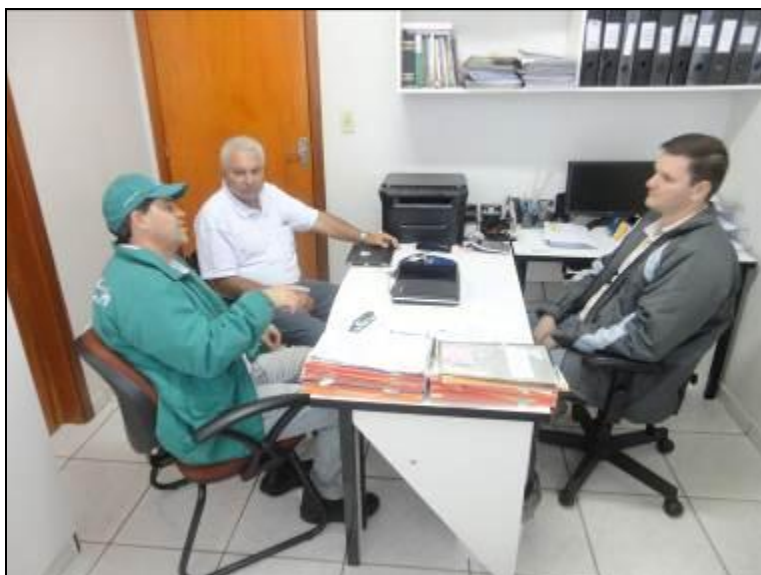
Áreas internas do Escritório.

5) Os equipamentos e instalações elétricas estão em bom estado (Resolução AGESAN nº 004 - Art. 127)? Sim (x) Não ( ) Pendência ( ):