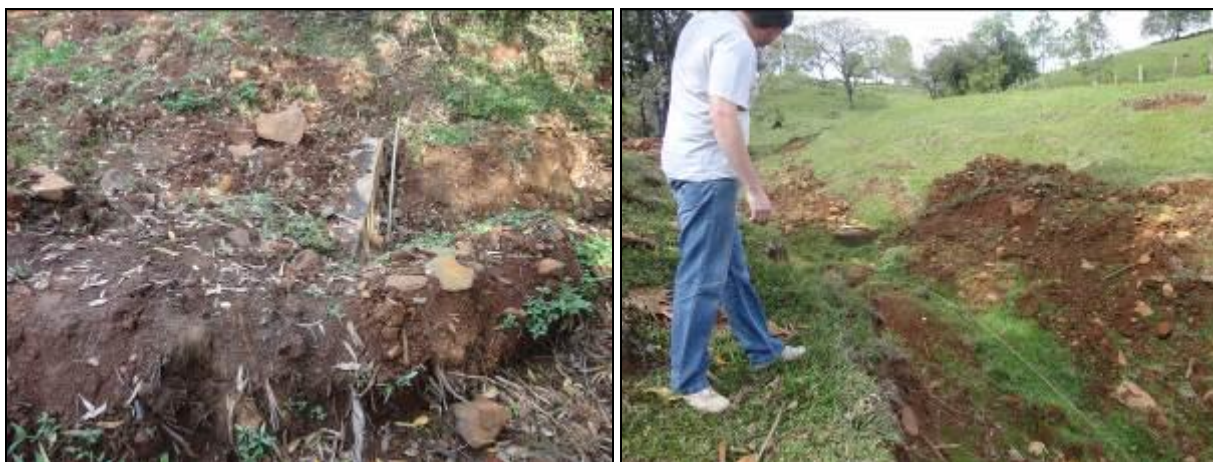
Área do manancial onde é feita a captação.

Manancial: Sem nome - Localização: Distrito Sede