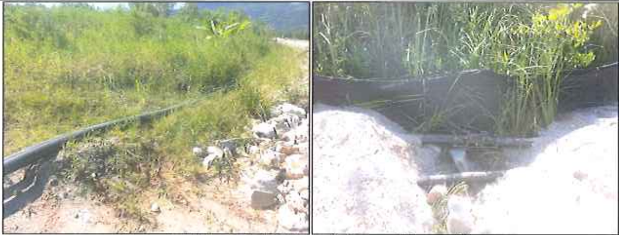
Figura 1: Adutoras de PEAD provisórias – 110 mm e 90 mm

A concessionária está monitorando a pressão na rede de distribuição até que a situação se normalize. A pressão deve variar entre 10 a 50 mca, conforme estabelece a norma técnica da Associação Brasileira de Normas Técnicas – ABNT NBR nº 12.218. Além disso, a concessionária também disponibilizou caminhões-pipas à população como forma de minimizar a falta de água.