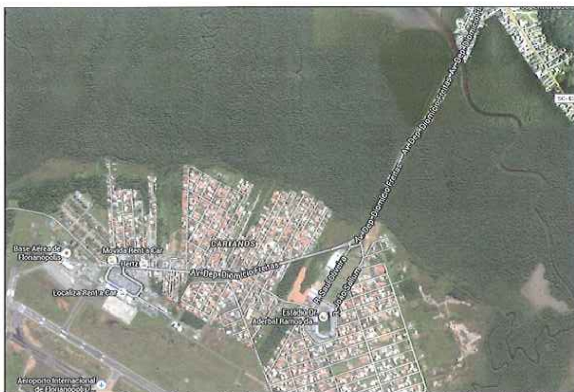
Figura 1: Localização da Avenida Deputado Diomício Freitas (Fonte: Google Earth)