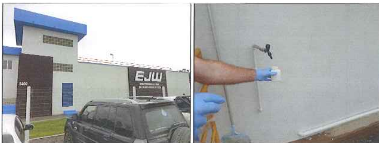
Figura 2: Coleta de amostra de água tratada na saída da ETA

Abaixo (Figura 2) há imagem da coleta de água neste local.