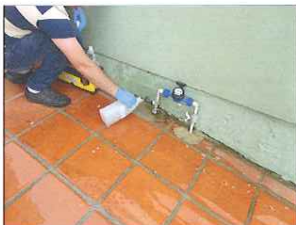
Figura 10: Coleta de amostra de água tratada no ponto da rede de distribuição na residência da Beira Mar Norte