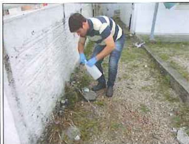
Figura 3: Coleta de amostra de água tratada no ponto da rede de distribuição da Prefeitura Municipal