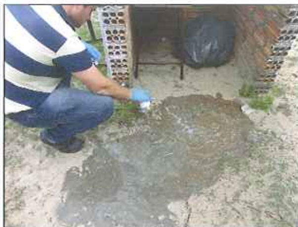
Figura 9: Coleta de amostra de água tratada no ponto da rede de distribuição da Escola Passo Fundo