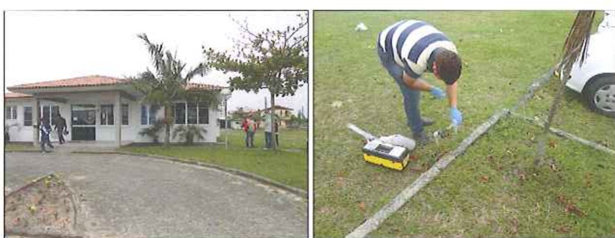
Figura 7: Coleta de amostra de água tratada no ponto da rede de distribuição da Delegacia de Polícia