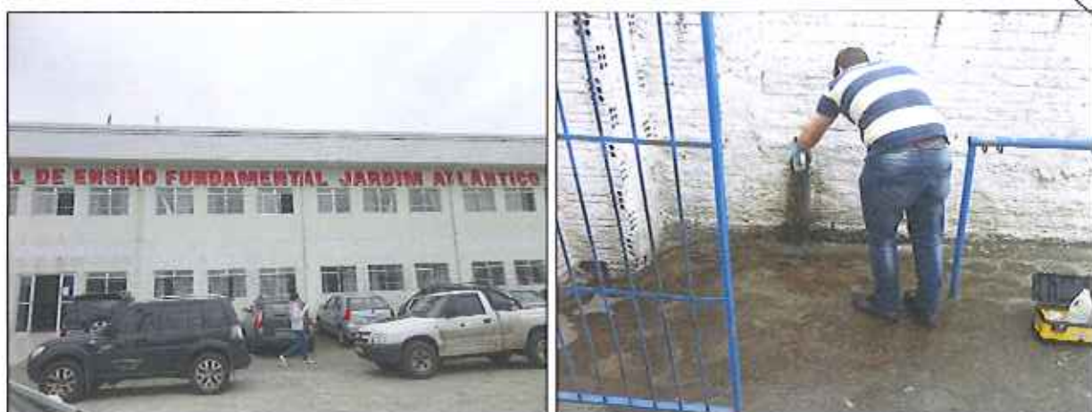
Figura 6: Coleta de amostra de água tratada no ponto da rede de distribuição da Escola Jardim Atlântico