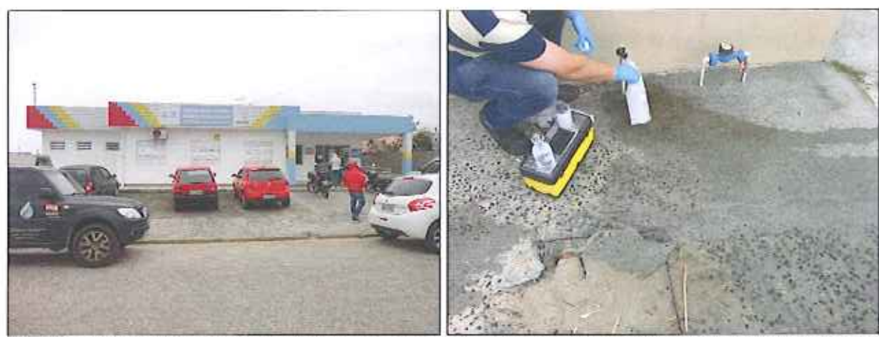
Figura 8: Coleta de amostra de água tratada no ponto da rede de distribuição da Unidade básica de saúde Marinho Miguel de Souza

Handwritten signatures and initials in blue ink, including the number 9.