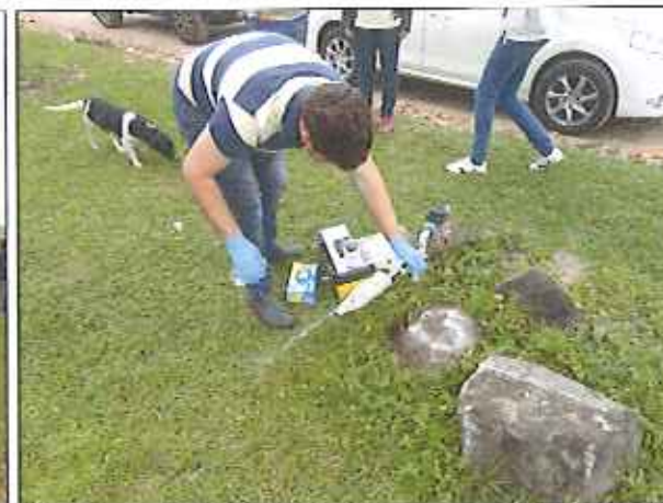
Figura 5: Coleta de amostra de água tratada no ponto da rede de distribuição na residência da Av. Rosano Pereira