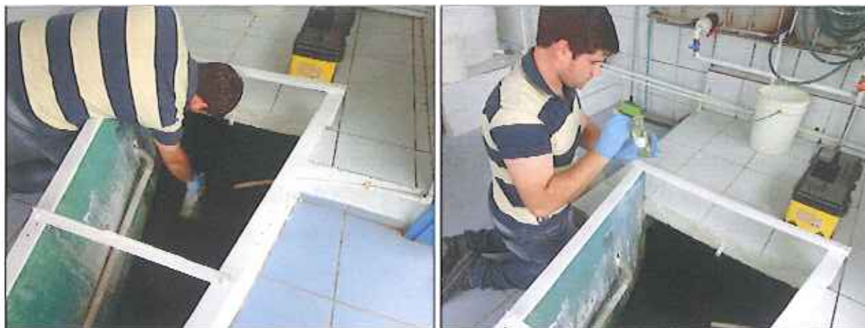
Figura 1: Coleta de amostra de água bruta na calha da ETA

Abaixo estão algumas imagens da coleta de água bruta realizada na entrada da ETA (Figura 1).