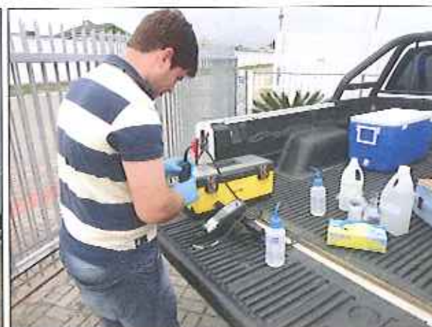
Figura 4: Coleta de amostra de água tratada no ponto da rede de distribuição do Escritório EJW