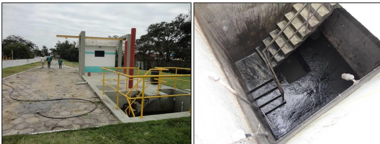
Figura 5: Estação Elevatória de Esgoto B02 Cachoeira (02/07/2015)

Na foto acima é possível verificar a altura que atinge o efluente bruto (pela marca na parede), quando ocorrem os vazamentos. Desta forma, é necessário um acompanhamento periódico da Estação Elevatória para verificar o real problema que vem acontecendo, seja entupimento de bomba, seja o corretamente dimensionamento das bombas para a vazão recebida.