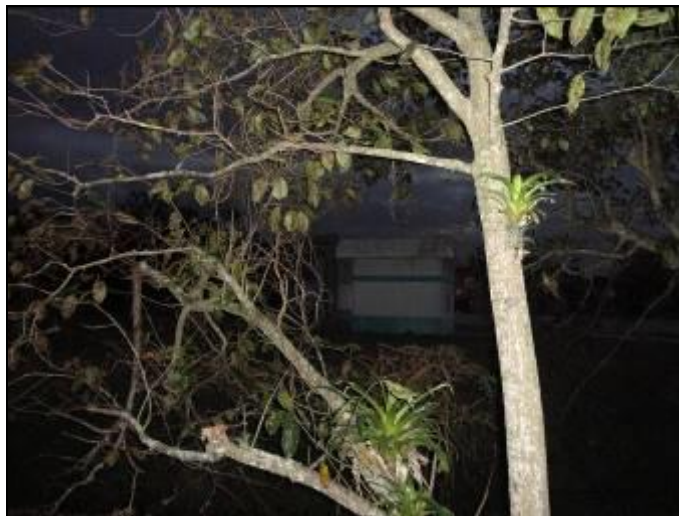
Figura 3: Estação Elevatória de Esgoto B02 Cachoeira próxima ao local do vazamento (01/07/2015)

Na manhã do dia 02/07/2015, a Agência foi informada que a equipe de manutenção da CASAN passou a madrugada na EEE B02 Cachoeira trabalhando de modo a sanar o vazamento. Desta forma, uma nova vistoria foi realizada pela equipe da AGESAN e foi constatado que o problema de vazamento do PV foi resolvido, bem como da Elevatória.