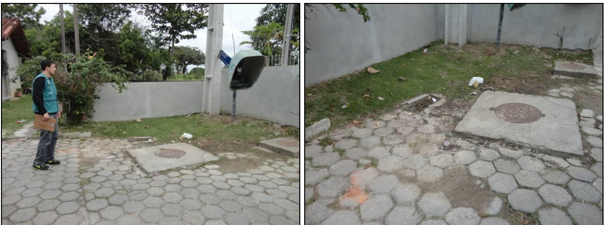
Figura 4: Poço de Visita localizado na Servidão Pacífico, 62 – Ponta das Canas (02/07/2015)

Na manhã do dia 02/07/2015, a Agência foi informada que a equipe de manutenção da CASAN passou a madrugada na EEE B02 Cachoeira trabalhando de modo a sanar o vazamento. Desta forma, uma nova vistoria foi realizada pela equipe da AGESAN e foi constatado que o problema de vazamento do PV foi resolvido, bem como da Elevatória.