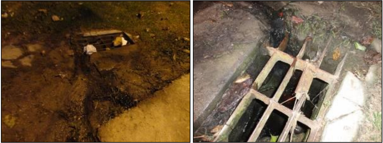
Figura 2: Vazamento do Poço de Visita desaguando na rede pluvial (01/07/2015)