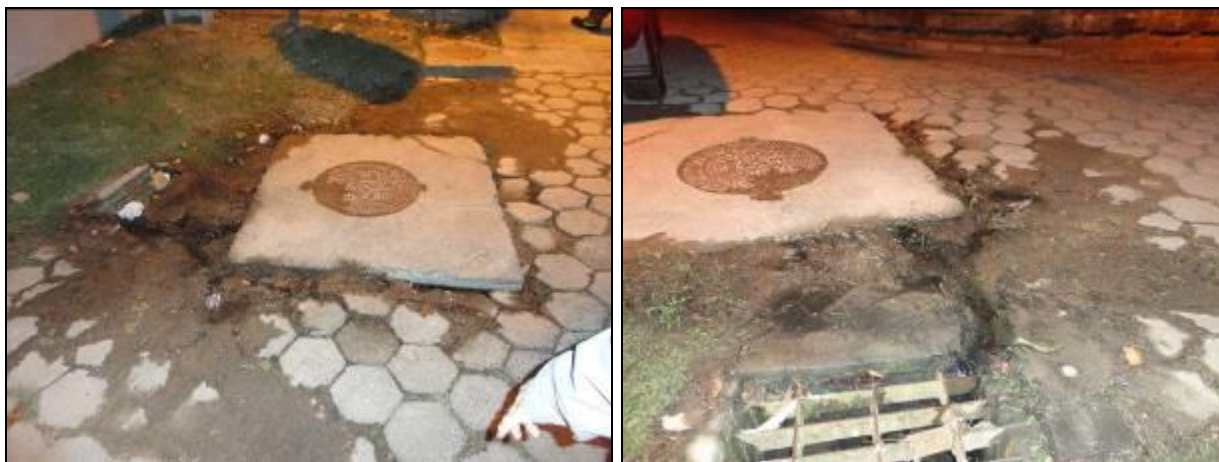
Figura 1: Poço de Visita localizado na Servidão Pacífico, 62 – Ponta das Canas (01/07/2015)

Imediatamente após constatar o fato, a equipe de manutenção da Companhia Catarinense de Águas e Saneamento (CASAN), concessionária do município, foi notificada para verificar e sanar o problema.