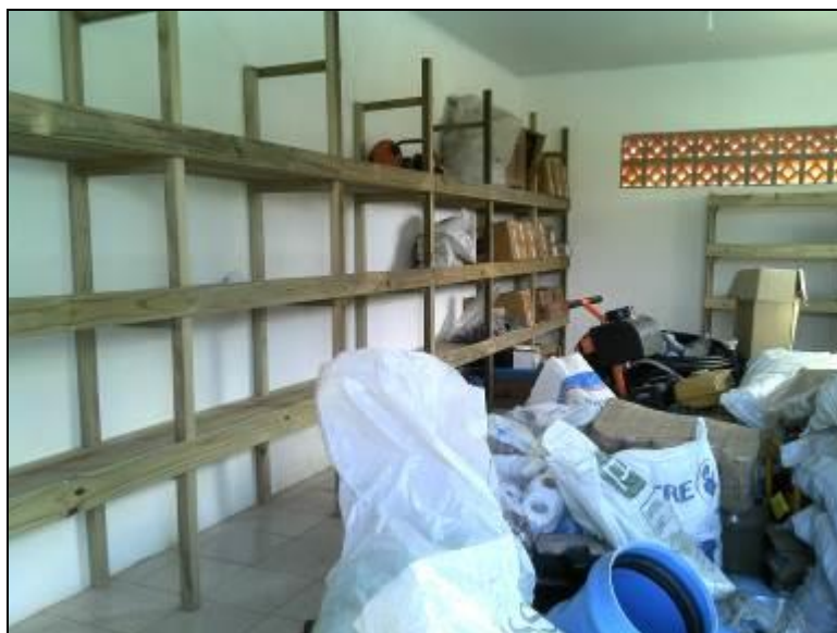
Figura 5: Almoxarifado (acompanhamento)

12) Os níveis de iluminação são favoráveis (Resolução AGESAN nº 004 - Art. 127)?