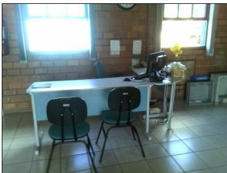
Figura 3: Imobiliário (acompanhamento)

7) As condições de mobiliário são favoráveis (Resolução AGESAN nº 004 - Art. 127)? Sim (x) Não ( ) Pendência ( ): Obs.: Falta trocar alguns móveis para padronização.