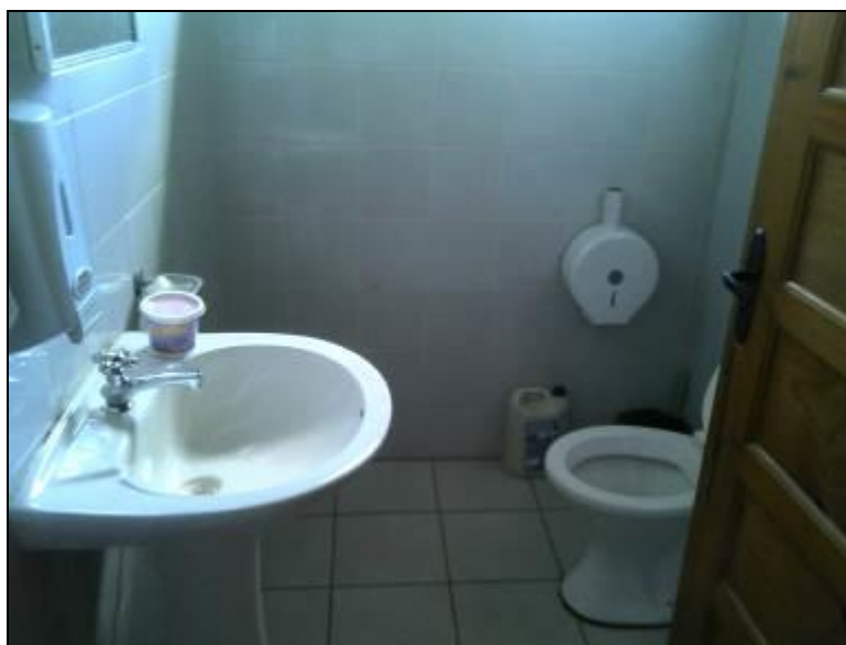
Figura 4: Banheiros (acompanhamento)

10) Há sanitários para os usuários (Resolução AGESAN nº 004 - Art. 127)? Sim ( ) Não (x) - Encontram-se em boas condições de higiene e limpeza? Sim ( ) Não ( ) Pendência ( ): Obs.: Os usuários utilizam os sanitários dos funcionários.