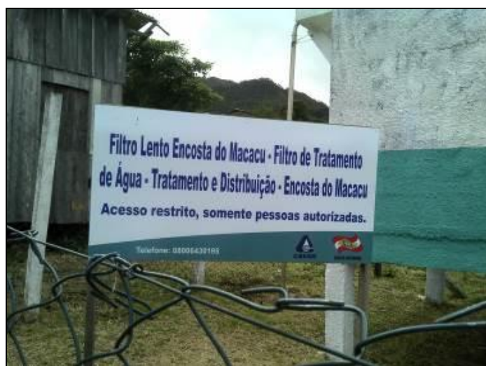
Figura 16: Identificação do Sistema (acompanhamento)

13) Existe placa de identificação com as restrições à utilização da área (Resolução AGESAN N°11 - Art. 10º)? Sim (x) Não ( ) Pendência ( ):