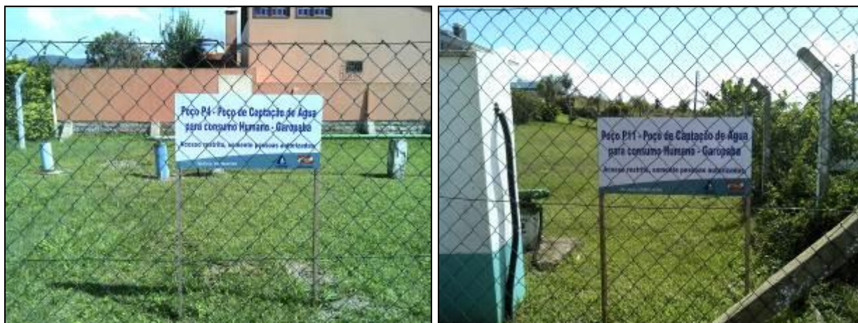
Figura 11: Identificação dos poços (acompanhamento)

13) Existe placa de identificação com as restrições à utilização da área (Resolução AGESAN N°11 - Art. 10º)? Sim (x) Não ( ) Pendência ( ): Obs.: Todos os poços estão devidamente identificados.