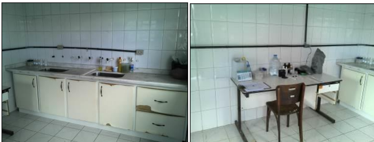
Figura 18: Laboratório ETA (acompanhamento)

8) Quais parâmetros são analisados na ETA local? Cloro (x) / Flúor (x) / PH ( ) / Cor ( ) / Turbidez ( ) / Outros: