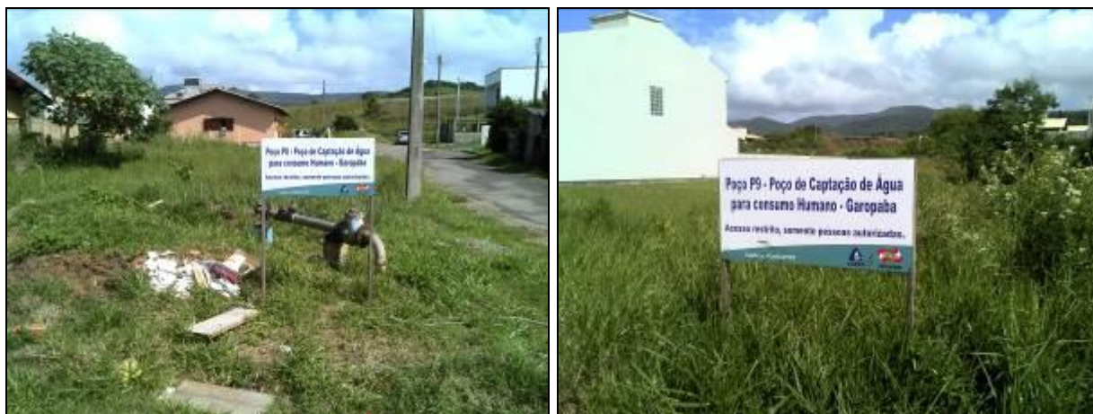
Figura 9: Poço 8 e Poço 9 (acompanhamento)