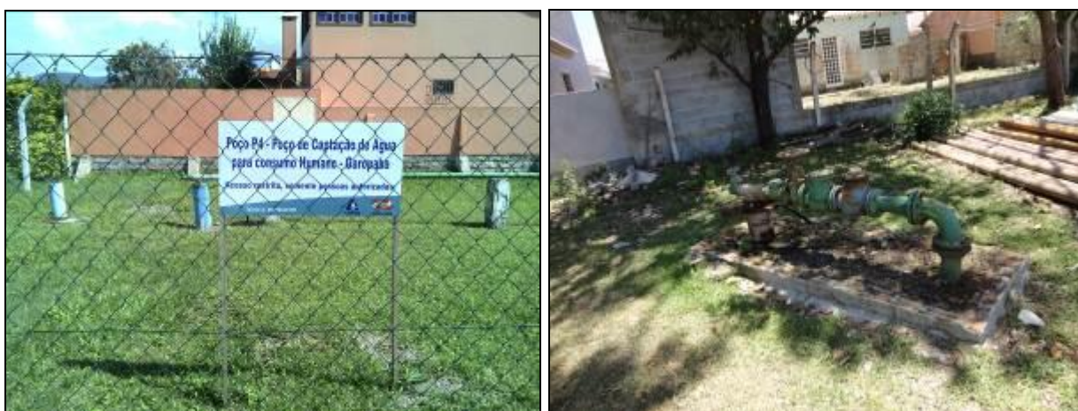
Figura 7: Poço 4 e Poço 5 ETA (acompanhamento)

Endereço: Área Central: Poço 04: Rua Nereu Ramos – Bairro Ferraz; Poço 5: Rua Marcos Inácio de Abreu nº 266 – Bairro Ferraz, Poço 6: Rua Tionáz Israel Bairro Ferraz; Poço 07: Rua Ismael Lobo, Bairro Ferraz, Poço 8: Rua Neri Inácio da Silva, Bairro Ferraz, Poço 9: Rua Manoel Geremias de Paula, Bairro Ferraz, Poço 10: Rua Maria Antônia dos Santos, Bairro Ferraz, Poço 11: Rua Ismael Lobo, Bairro Ferraz;