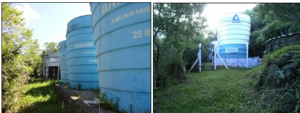
Figura 28: R-04 a R-09 (inicial e Acompanhamento)

Endereço: Morro da Silveira – Centro / Praia do Silveira