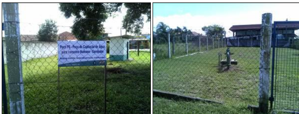
Figura 8: Poço 6 e Poço 7 (acompanhamento)