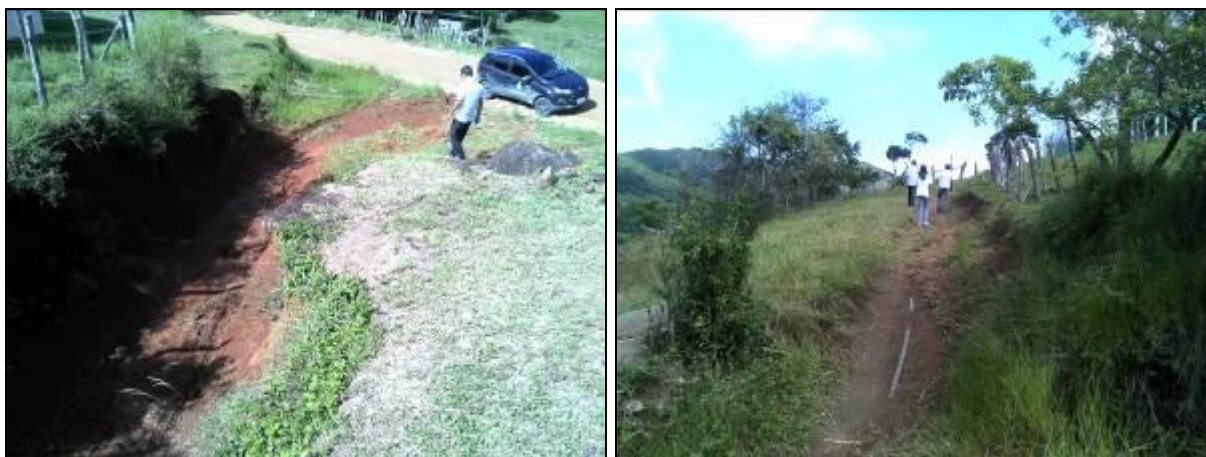
Figura 15: Acesso ao sistema Macacú (acompanhamento)

11) Existe proteção contra enchentes e entrada de pessoas estranhas e animais (Resolução AGESAN N°11 - Art. 10º)? Sim (x) Não ( ) Pendência ( ):