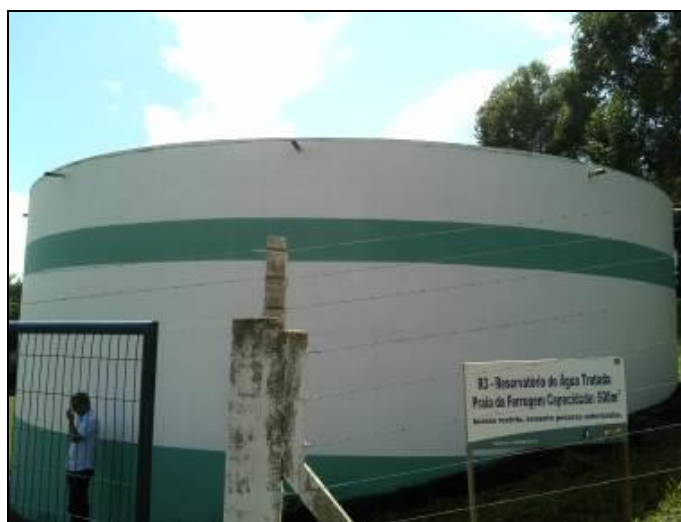
Figura 26: R-03 - (acompanhamento)

Endereço: Rua: Caixa Dagua – Praia do Ferrugem