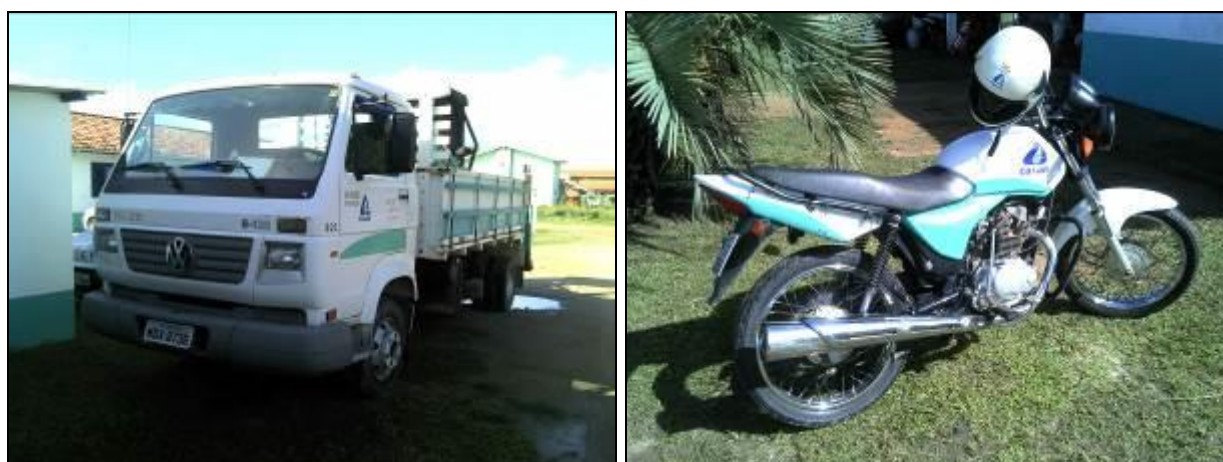
Figura 6: Frota de veículos da Agencia (acompanhamento)

20) O usuário é comunicado da possibilidade de acompanhamento das atividades/obras em suas instalações (Lei nº 8.078 - Art. 6º) 4 ? Sim (x) Não ( )