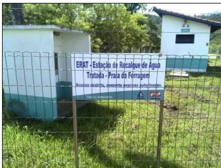
Figura 29: ERAT's (acompanhamento)

1) Qual o documento que garante a propriedade ou a posse da área/imóvel 17 ? (indicar o vencimento, se houver)