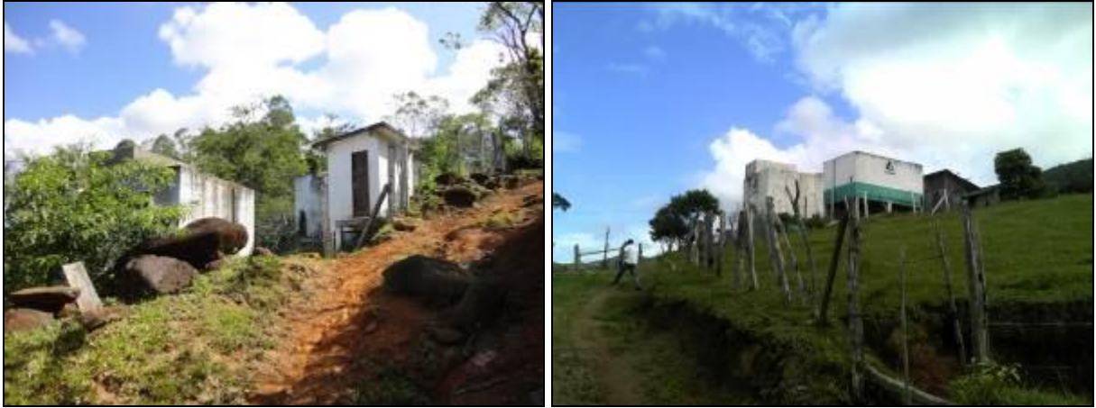
Figura 14: Sistema Isolado do Macacú (inicial e acompanhamento)

1) Qual o documento que garante a propriedade ou a posse da área/imóvel 9 ? (indicar o vencimento, se houver)