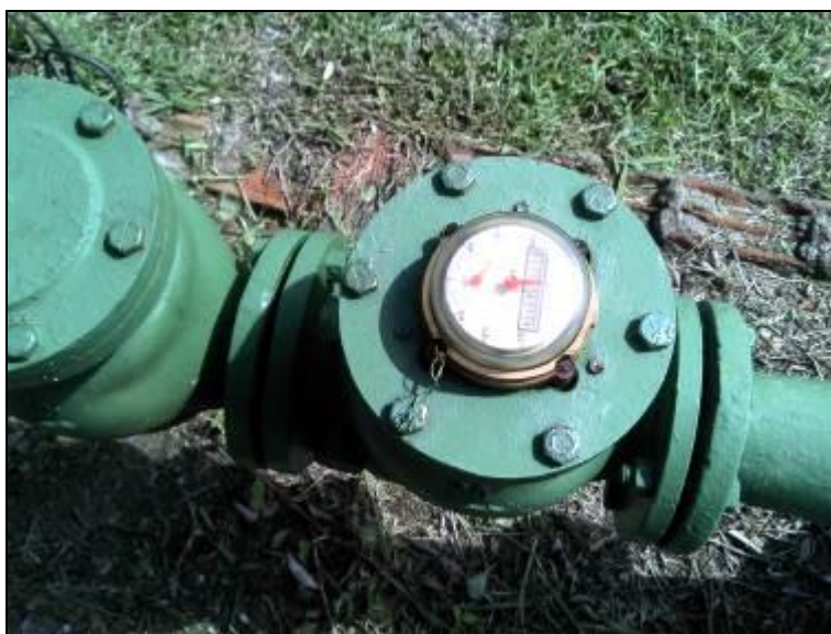
Figura 19: Macromedidor de entrada (acompanhamento)

10) Existe Macromedição na entrada (Res. AGESAN nº11 - Art. 17º)? Sim (x) Não ( )