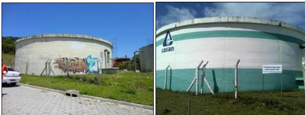
Figura 22: R-1 (inicial e acompanhamento)

Endereço: Rua: Bernardino Rodrigues – Centro