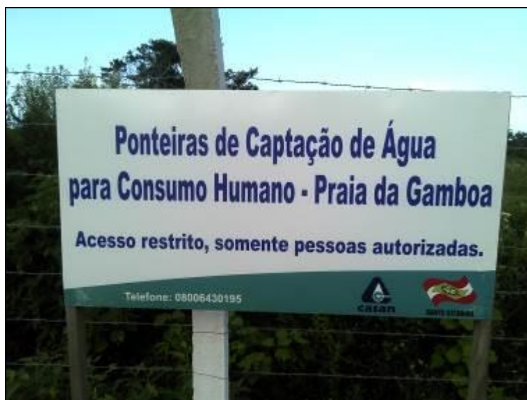
Figura 13: Identificação dos poços (acompanhamento)

13) Existe placa de identificação com as restrições à utilização da área (Resolução AGESAN Nº11 - Art. 10º)? Sim (x) Não ( ) Pendência ( ):