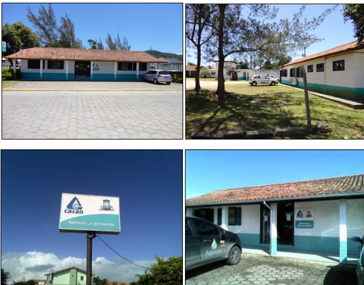
Figura 1: Fachadas principal e lateral do Escritório local. (inicial e acompanhamento)

1) Existe identificação de que ali funciona um escritório de atendimento (Lei nº 8.078 Art. 6º)? Sim (x) Não ( ) Pendência ( ):