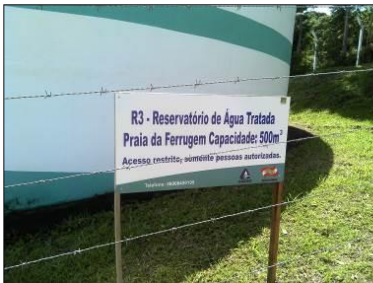
Figura 27: Identificação R-03 (acompanhamento)

31) Existem placas indicativas de propriedade e restrição de uso das áreas dos reservatórios (Resolução AGESAN nº 004 - Art.19 - §2º)? Sim (x) Não ( ) Pendência ( )