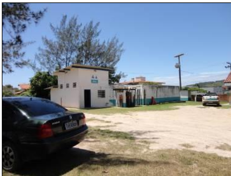
Figura 17: Área externa da ETA

7) As condições do Laboratório são adequadas? Sim ( ) Não (x) Pendência ( ):