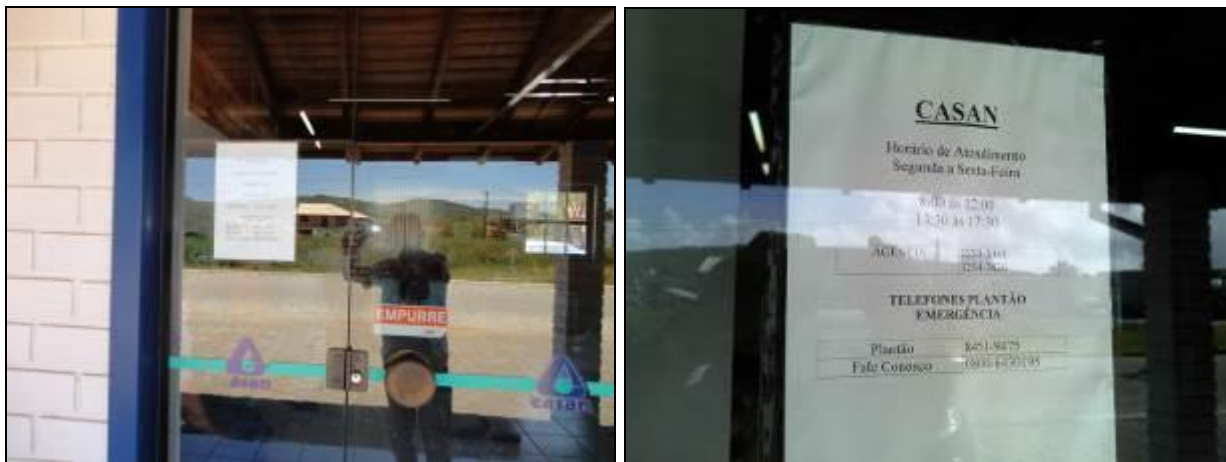
Figura 2: Cartaz de Atendimento ao Público (inicial e acompanhamento)

5) Existem manuais, guias e informações adequadas disponíveis aos usuários (CDC, Resoluções Agesan, etc.)? Sim ( ) Não (x) Pendência ( ):