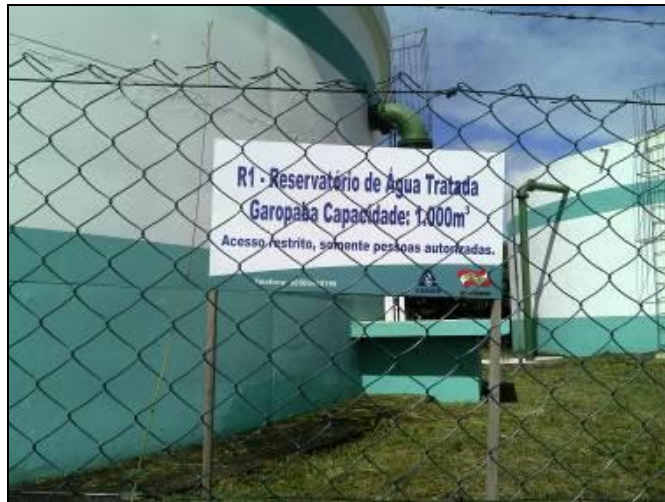
Figura 23: Identificação R-01 (acompanhamento)

6) As condições de limpeza dos entornos são adequadas (Resolução AGESAN nº11 - Art. 23º)? Sim (x) Não ( ) Pendência ( ): Obs.: Os próprios funcionários cuidam da limpeza.