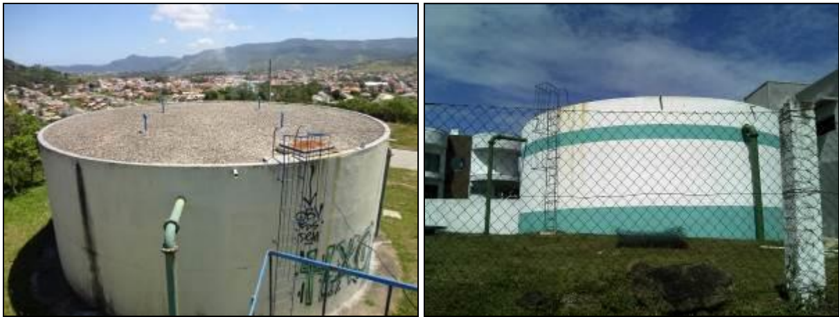
Figura 24: R-02 - (inicial e acompanhamento)

14) Qual o documento que garante a propriedade ou a posse da área/imóvel 12 ? (indicar o vencimento, se houver)