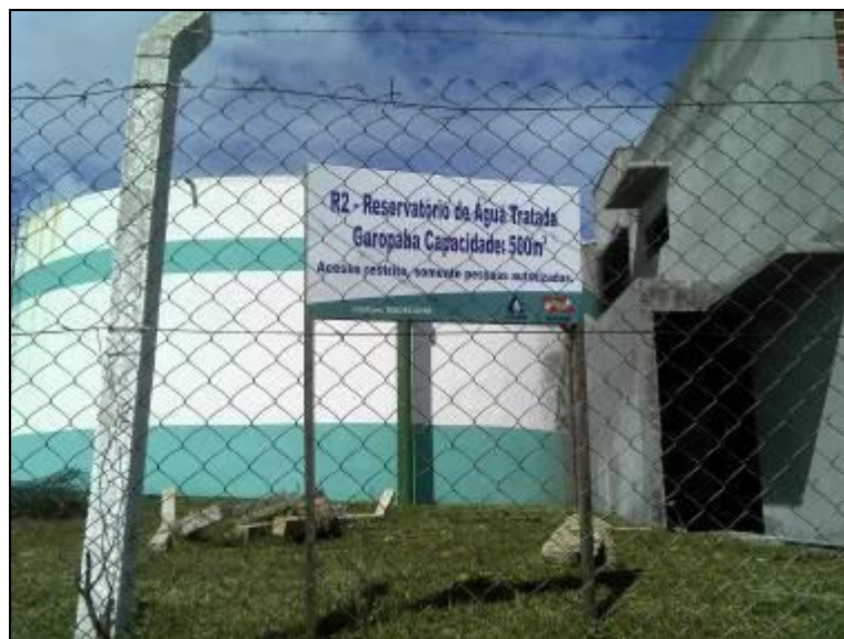
Figura 25: Identificação R-02 (acompanhamento)

18) Existem placas indicativas de propriedade e restrição de uso das áreas dos reservatórios (Resolução AGESAN nº 004 - Art.19 - §2º)? Sim (x) Não ( ) Pendência ( )