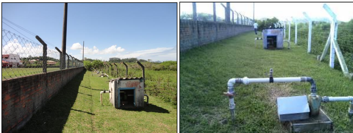
Figura 12: Ponteiras Gamboa (inicial e acompanhamento)

1) Qual o documento que garante a propriedade ou a posse da área/imóvel 8 ? (indicar o vencimento, se houver)