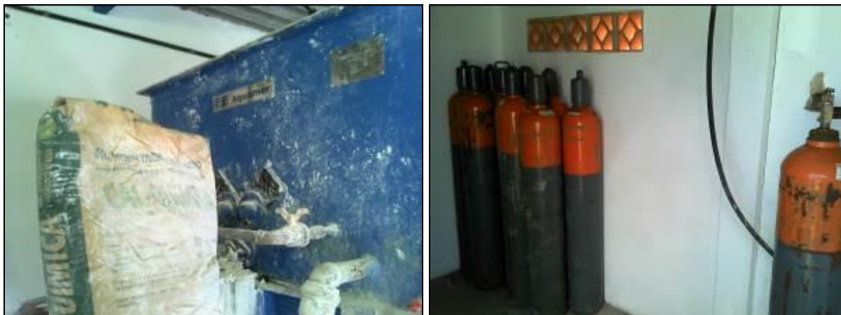
Figura 21: casa de química (acompanhamento)

24) A estrutura do prédio da casa de química está aparentemente segura (Resolução AGESAN nº11 Art. 15º)? Sim (x) Não ( ) Pendência ( ):