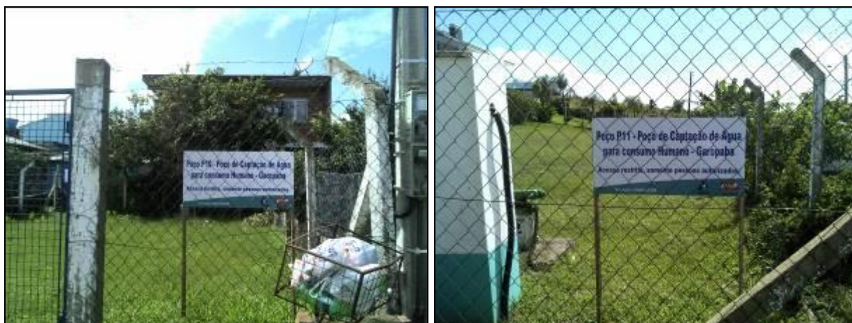
Figura 10: Poço 10 e Poço 11 (acompanhamento)

1) Qual o documento que garante a propriedade ou a posse da área/imóvel 7 ? (indicar o vencimento, se houver)