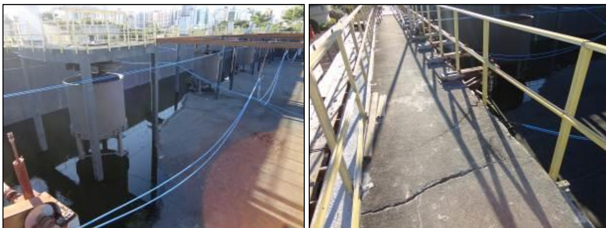
Figura 2: Parte da unidade que cedeu e rachaduras (30/05/2014)