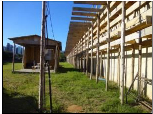
Figura 3: Unidade sendo recuperada (30/05/2014)