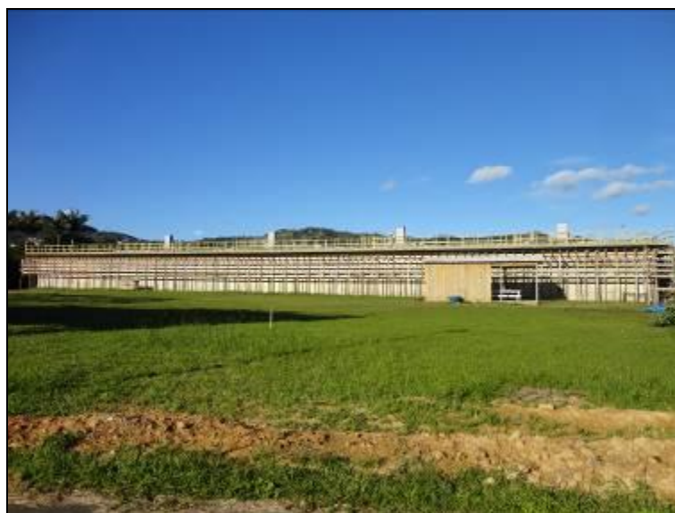
Figura 1: Unidade sendo recuperada (30/05/2014)

Abaixo, há imagens da situação das obras na unidade em questão (Figuras 1 a 5).