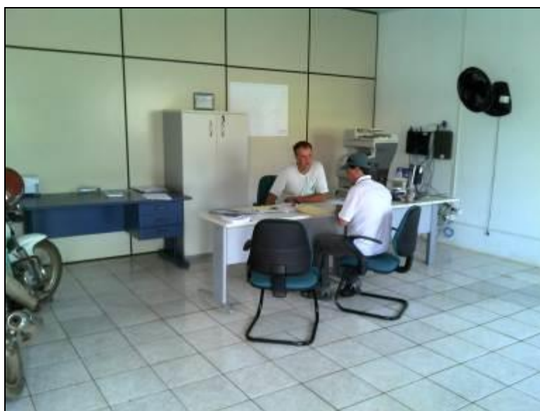
Figura 4: Mobiliário novo (acompanhamento)

6) As condições de mobiliário são favoráveis (Resolução AGESAN nº 004 - Art. 127)? Sim (x) Não ( ) Pendência ( ): Obs.: