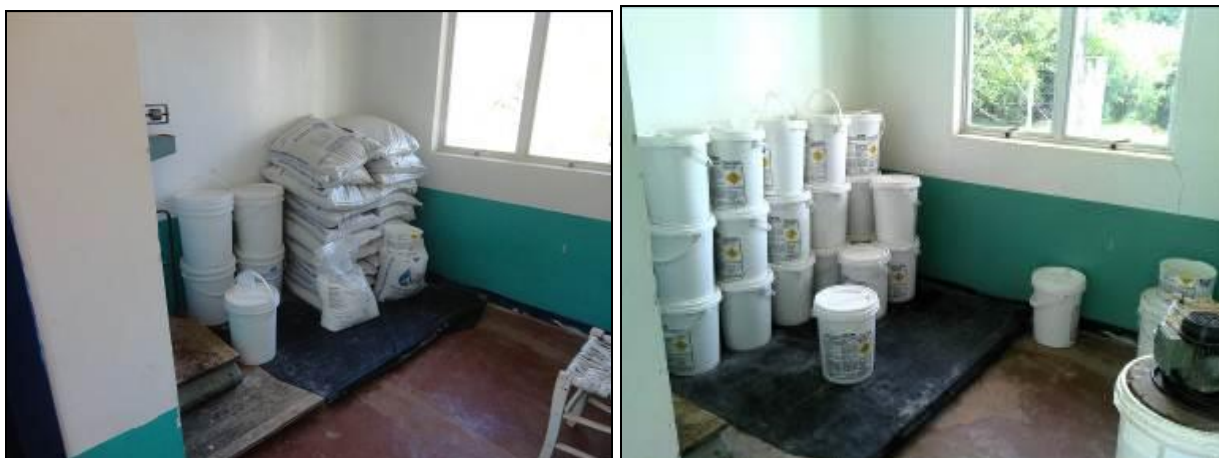
Figura 15: Acondicionamento produtos químicos (inicial e acompanhamento)

21) Existe almoxarifado para acondicionamento de produtos químicos (Resolução AGESAN nº11 - Art. 18º §2º)? Sim (x) Não ( ) Pendência ( ):