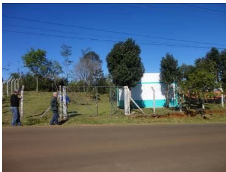
Figura 18: Reservatório