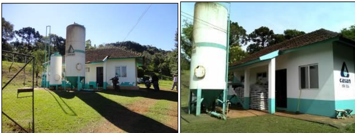
Figura 11: Eta 1 (Inicial e acompanhamento)

1) A ETA possui licenciamento do órgão AMBIENTAL para funcionamento (Conama 237/97 Anexo 1)? Sim ( ) Não (x) -