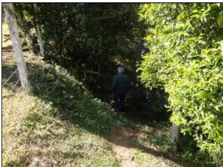
Figura 10: Acesso a Captação

8) Existe proteção contra enchentes e entrada de pessoas estranhas e animais (Resolução AGESAN Nº11 - Art. 10º)? Sim ( ) Não (x) Pendência ( ):