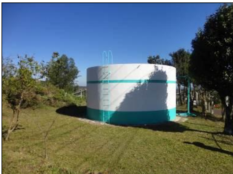
Figura 17: R 01