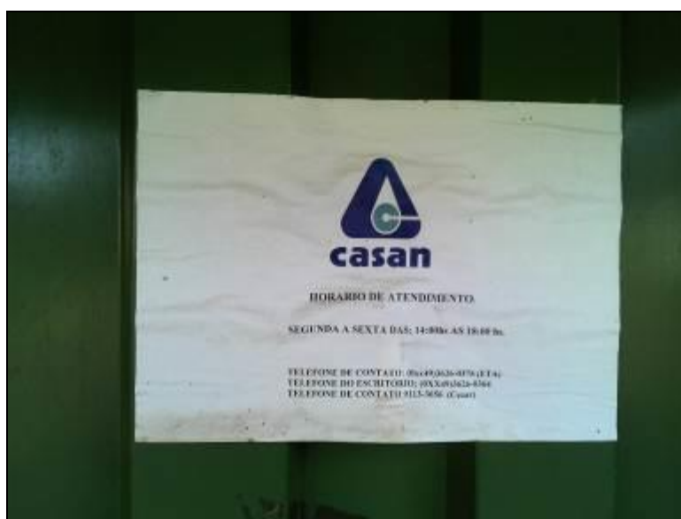
Figura 2: Identificação do horário (acompanhamento)

3) Há placa indicativa do horário de funcionamento (Lei nº 8.078 - Art. 6º)? Sim (x) Não ( ) Pendência ( ) : Obs.: O cartaz foi fixado após recomendação na visita inicial.