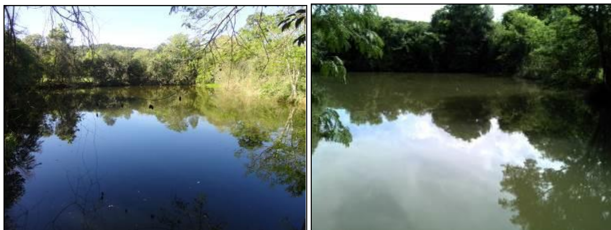
Figura 8: Área do manancial (inicial e acompanhamento)

Onde é tratada a água deste manancial? Na ETA