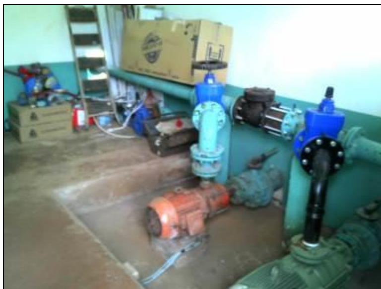
Figura 16: Bombeamento da ETA (acompanhamento)

24) Existe comunicação do operador da ETA com outras unidades do sistema? Sim (x) Não ( ) Qual o sistema? Telefone fixo