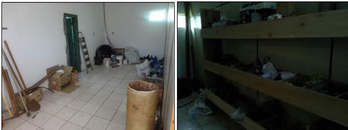
Figura 6: Almoxarifado (inicial e acompanhamento)

10) Existe almoxarifado em boas condições? Sim (x) Não ( ) Pendência ( ):