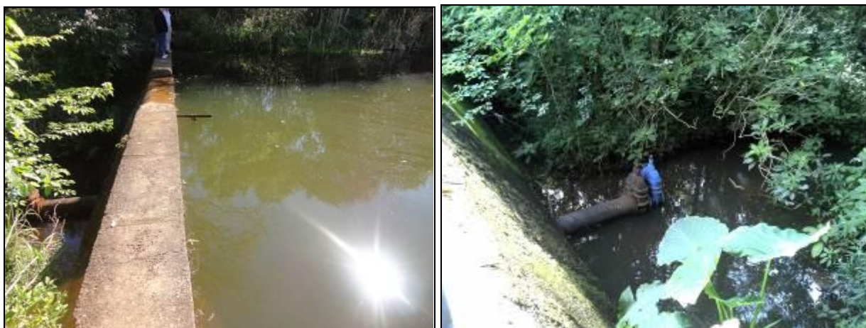
Figura 9: Área do manancial desprotegida (inicial e acompanhamento)

RECOMENDAÇÃO 03: Providenciar isolamento da área conforme determina a Resolução.