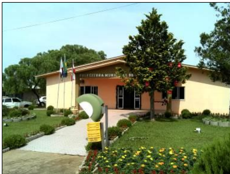
Figura 20: fachada da Prefeitura Municipal.