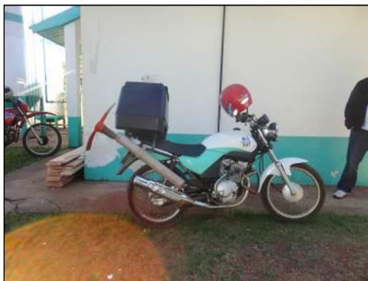
Figura 7: Moto para uso da manutenção