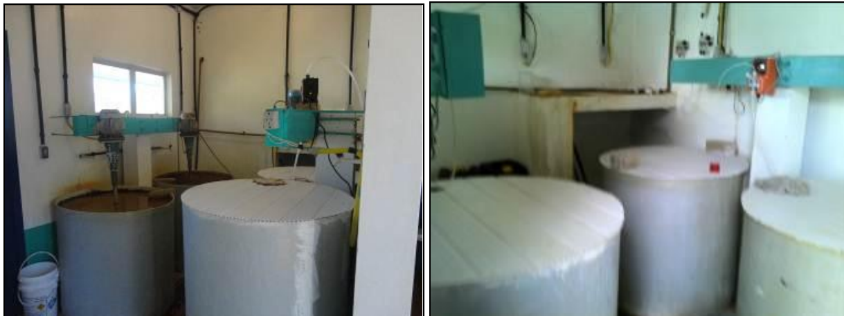
Figura 14: casa de Química (inicial e acompanhamento)

20) A estrutura do prédio da casa de química está aparentemente segura (Resolução AGESAN nº11 Art. 15º)? Sim (x) Não ( ) Pendência ( ):