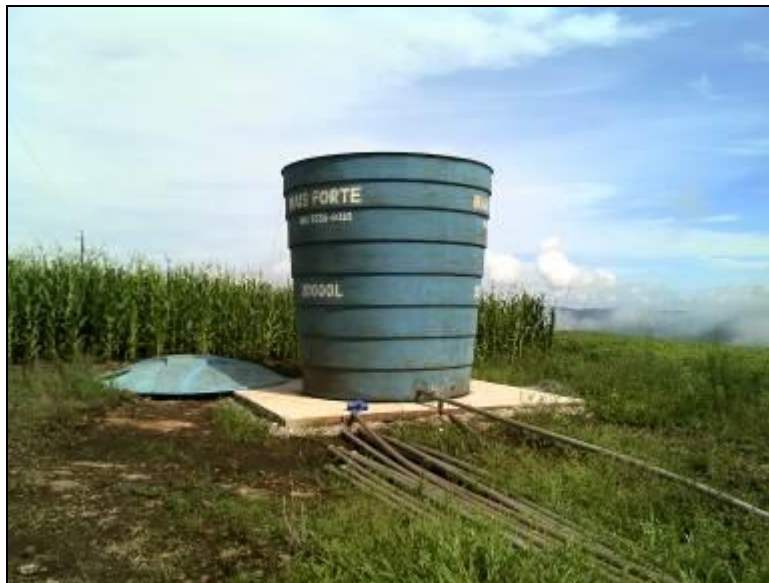
Figura 19: Reservatório SC 492 - Área Industrial.

9) Existe medidor de nível do reservatório em condições adequadas (Resolução AGESAN N°11 - Art. 23º)? Sim (x) Não ( ) Pendência ( ):