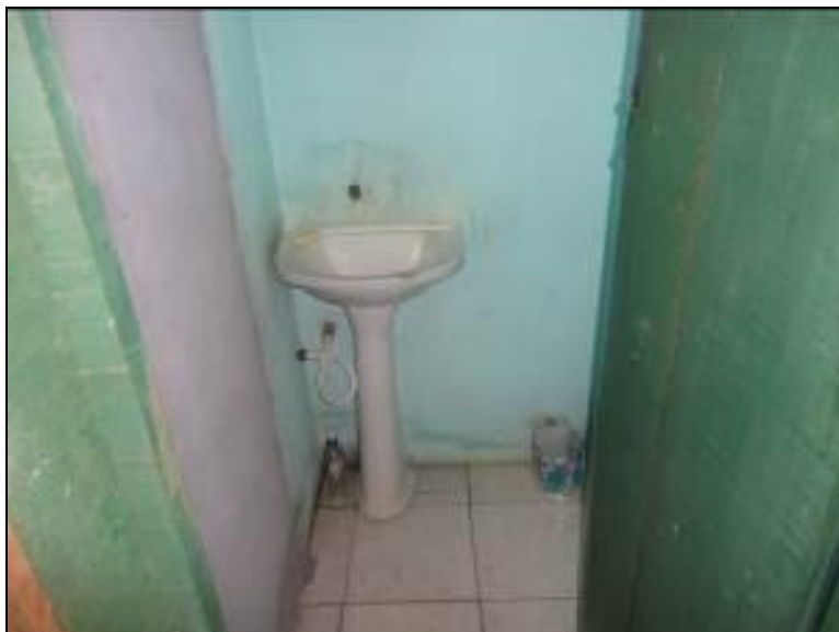
Figura 5: Banheiro compartilhado

8) Existe sanitário disponível para uso dos funcionários (Resolução AGESAN nº 004 Art. 127)? Sim (x) Não ( ) - Encontra-se em boas condições de higiene e limpeza? Sim ( ) Não (x) Pendência ( ):