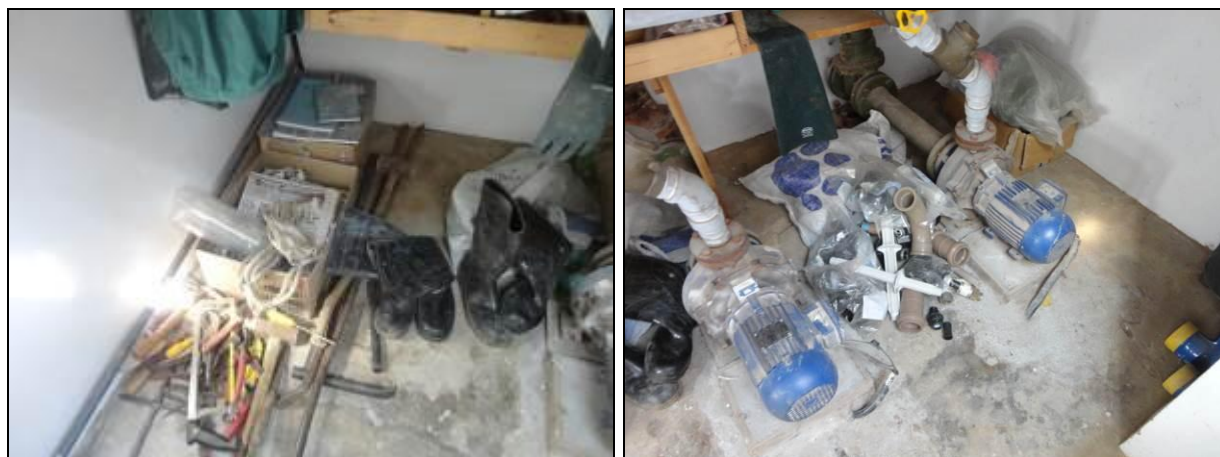
Figura 5 – Material mal instalados

RECOMENDAÇÃO 02: Providenciar acomodações propícias para os materiais.