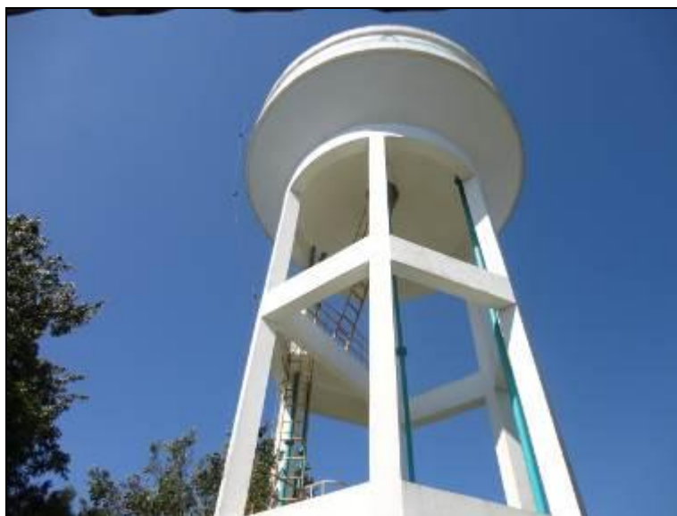
Figura 21 – Guarda corpo do Reservatório

6) Existe guarda-corpo nas áreas de visitação (Resolução AGESAN N°11 Art. 23º)? Sim (x) Não ( ) Pendência ( ):