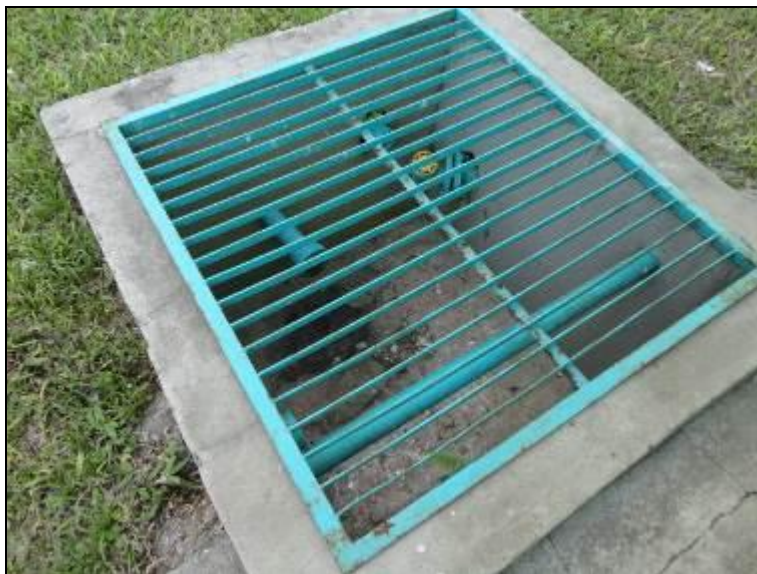
Figura 15 – Instrumentos com tampa

18) Os instrumentos possuem tampas (Resolução AGESAN nº11 - Art. 15º)? Sim (x) Não ( ) Pendência ( ) :