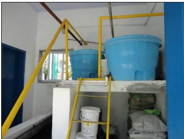
Figura 16 – Casa de Química

20) A estrutura do prédio da casa de química está aparentemente segura (Resolução AGESAN nº11 Art. 15º)? Sim (x) Não ( ) Pendência ( ) :