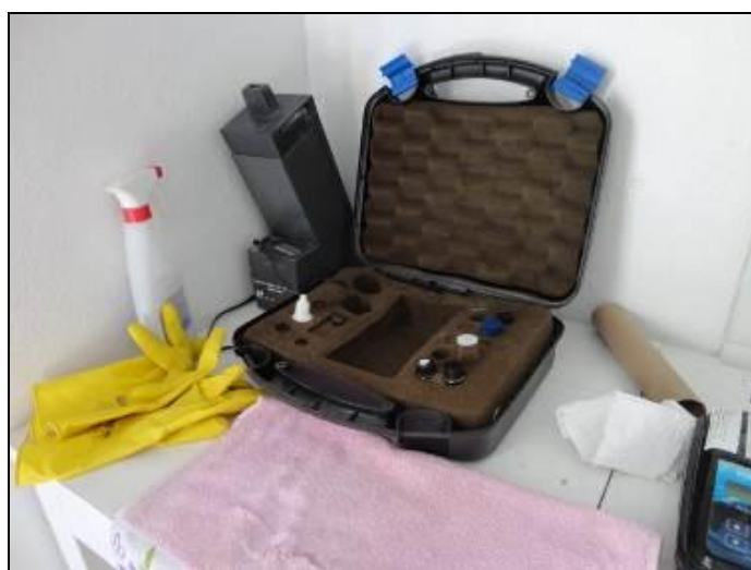
Figura 12 – Laboratório da ETA

4) Quais parâmetros são analisados na ETA local? Cloro (x) / Flúor (x) / PH (x) / Cor (x) / Turbidez (x) / Outros: