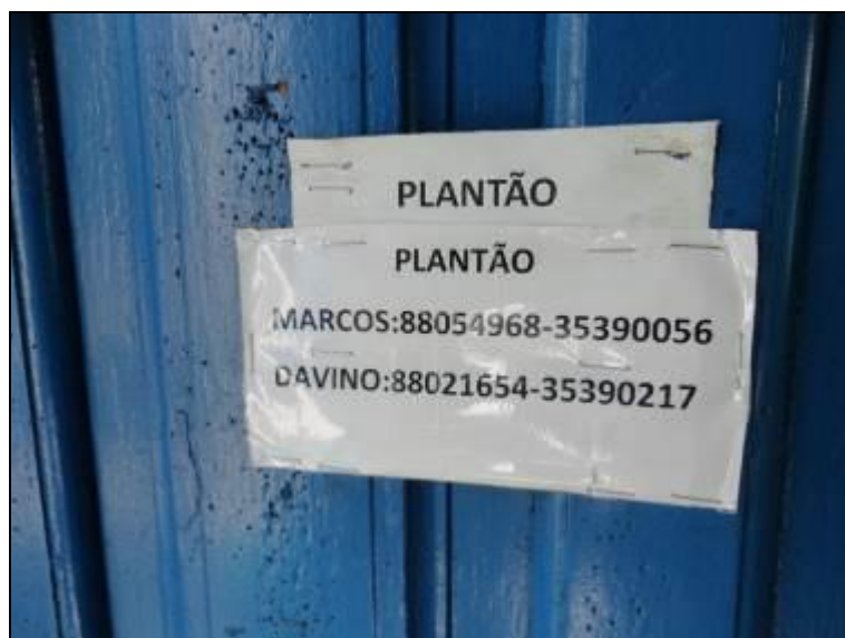
Figura 2 – Somente identificação dos Funcionários