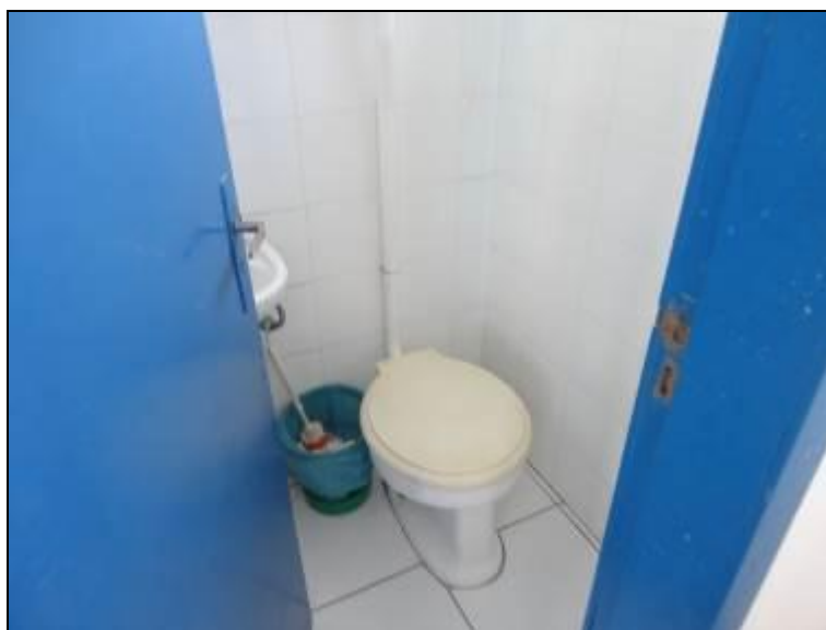
Figura 4 – Banheiro coletivo

8) Existe sanitário disponível para uso dos funcionários (Resolução AGESAN nº 004 Art. 127)? Sim (x) Não ( ) - Encontra-se em boas condições de higiene e limpeza? Sim (x) Não ( ) Pendência ( ):