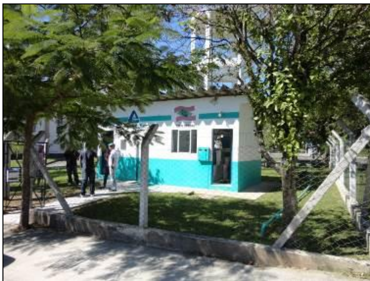
Figura 1 – Identificação do Escritório

1) Existe identificação de que ali funciona um escritório de atendimento (Lei nº 8.078 Art. 6º)? Sim (x) Não ( ) Pendência ( ):