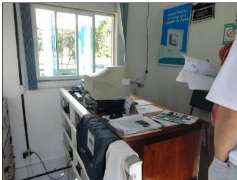
Figura 6 – Condições de limpeza razoável

13) As condições gerais de limpeza são favoráveis (Resolução AGESAN N° 004 - Art. 127)? Sim ( ) Não ( ) Pendência (x): Apresenta condições razoáveis