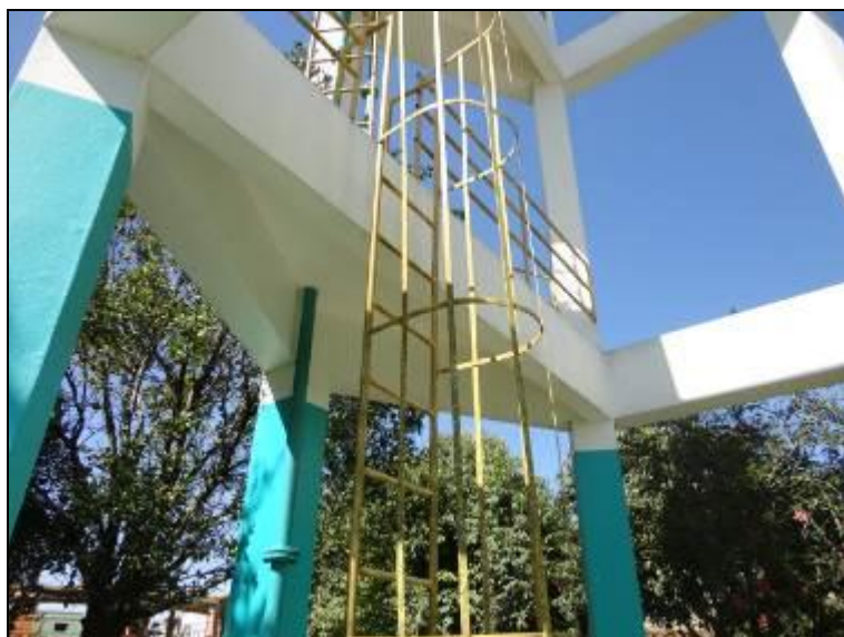
Figura 20 – Escada do Acesso

5) Existem escadas em boas condições de uso (Resolução AGESAN nº11 - Art. 23º)? Sim (x) Não ( ) Pendência ( ):