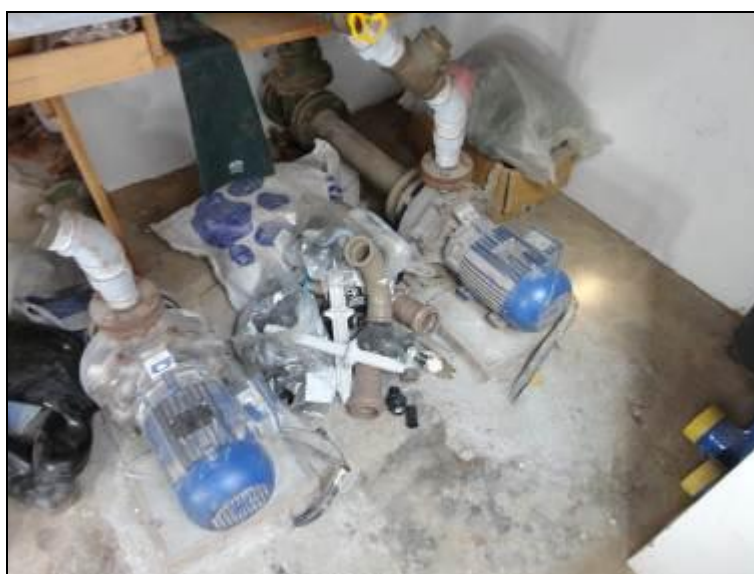
Figura 22 – ERAT junto com a ETA

1) Estão devidamente isoladas? Sim (x) Não ( ) Pendência ( ):