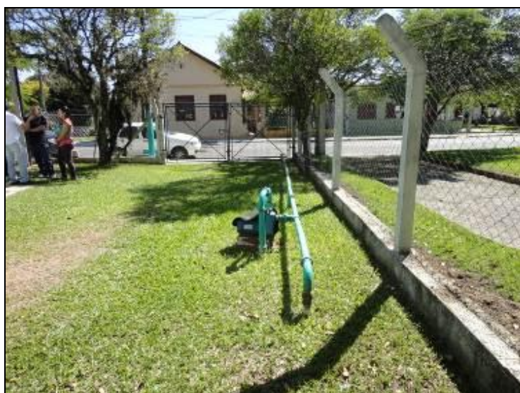
Figura 10 – Proteção das Ponteiras

7) Existe proteção contra enchentes e entrada de pessoas estranhas e animais (Resolução AGESAN N°11 - Art. 10º)? Sim (x) Não ( ) Pendência ( ):