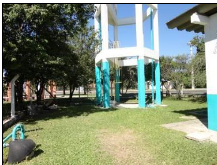
Figura 19 – Área do reservatório devidamente cercada

4) As áreas estão devidamente cercadas e trancadas (Resolução AGESAN nº11 - Art. 23º)? Sim ( x) Não ( ) Pendência ( ):