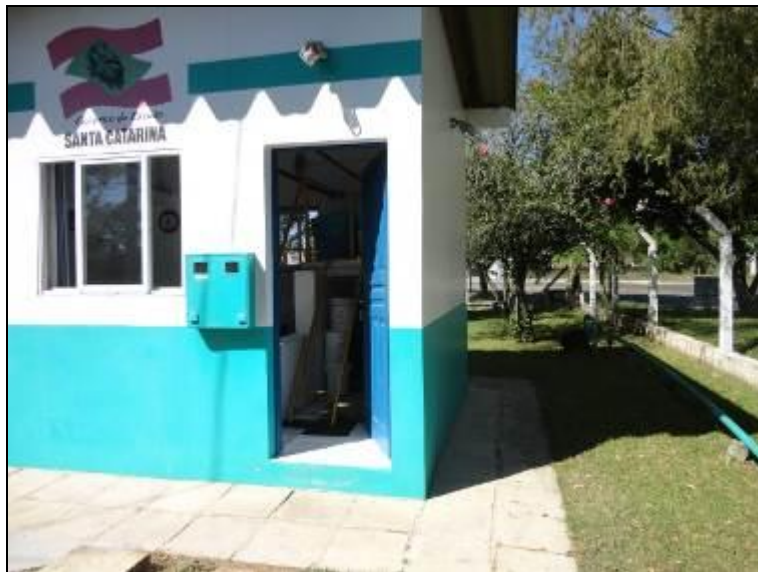
Figura 14 – Área da ETA protegida

9) Existe cerca de proteção da ETA em bom estado de conservação (Resolução AGESAN Nº11 - Art. 15º)? Sim (x) Não ( ) Pendência ( ):