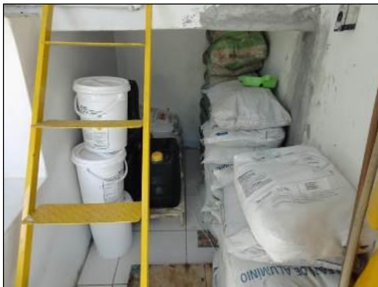
Figura 17 – Acondicionamento dos produtos químicos

AGESAN nº11 - Art. 18º §2º)? Sim (x) Não ( ) Pendência ( ):