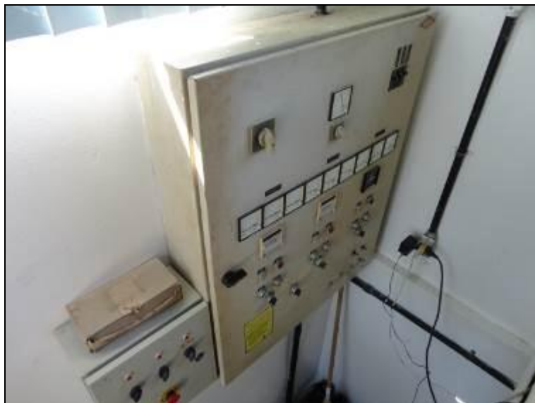
Figura 24 – Quadro de Energia

3) O disjuntor está devidamente trancado? Sim (x) Não ( ) Pendência ( ):