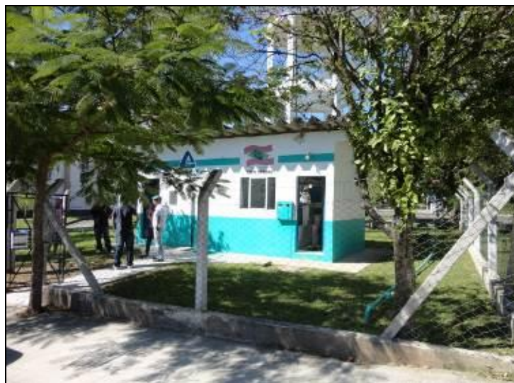
Figura 18 – Acesso ao Reservatório

1) Existe facilidade de acesso ao local? Sim (x) Não ( )