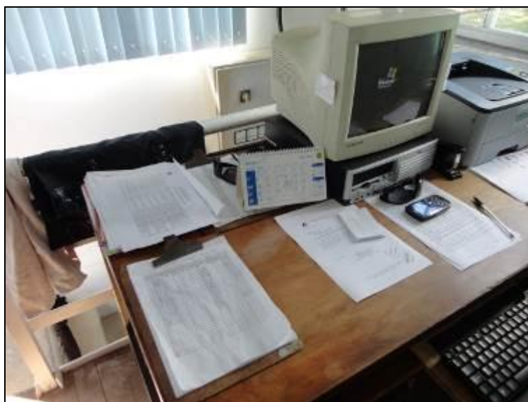
Figura 3 – Estrutura do escritório