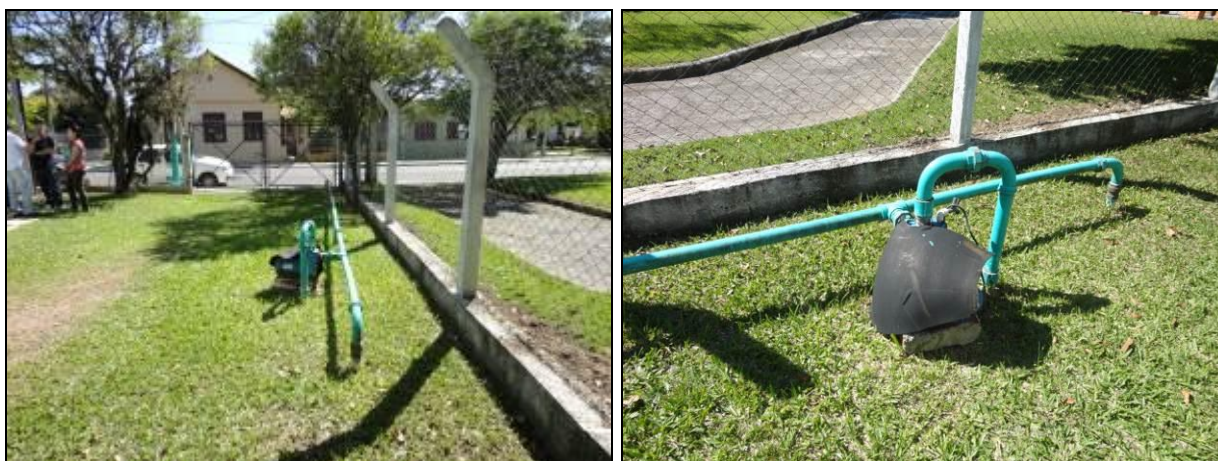
Figura 8 – Captação das Ponteiras

5) O tipo de captação é adequado (NBR 12.213)? Sim (x) Não ( ) Pendência ( ):