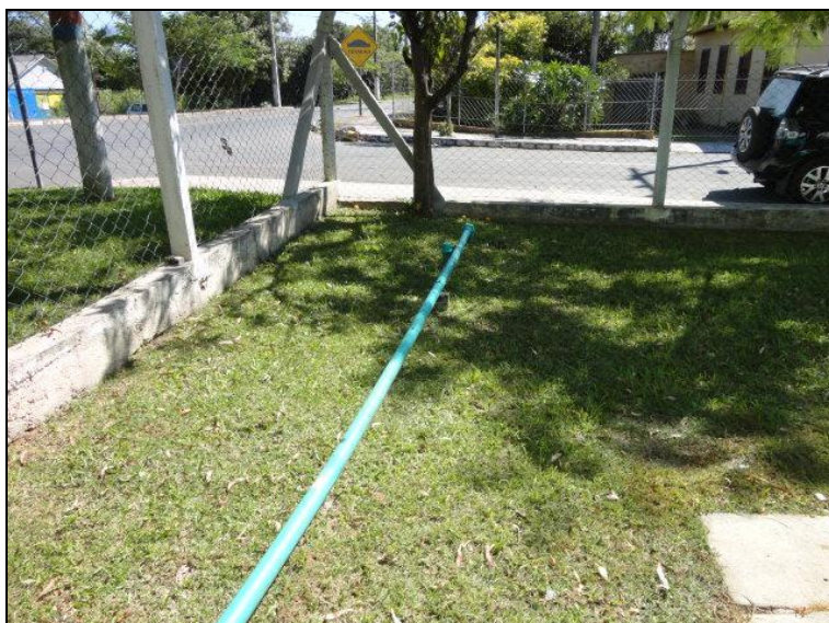
Figura 9 – Acesso as ponteiras

7) Existe proteção contra enchentes e entrada de pessoas estranhas e animais (Resolução AGESAN N°11 - Art. 10º)? Sim (x) Não ( ) Pendência ( ):