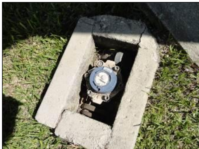
Figura 13 - Macromedidor

6) Existe Macromedição na entrada (Res. AGESAN nº11 - Art. 17º)? Sim (x) Não ( )