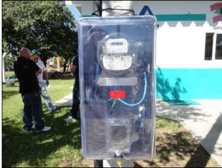
Figura 23 – Relógio contador de energia.

3) O disjuntor está devidamente trancado? Sim (x) Não ( ) Pendência ( ):