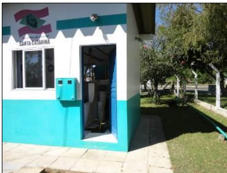
Figura 7 – Área de Proteção ETA

3) Existe cerca de proteção da área do manancial (Resolução AGESAN nº11- Art. 10º)? Sim (x) Não ( ) Pendência ( ):