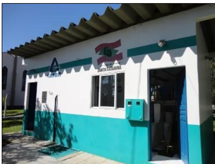
Figura 11 – Acesso a ETA

3) As condições do Laboratório são adequadas? Sim (x) Não ( ) Pendência ( ):