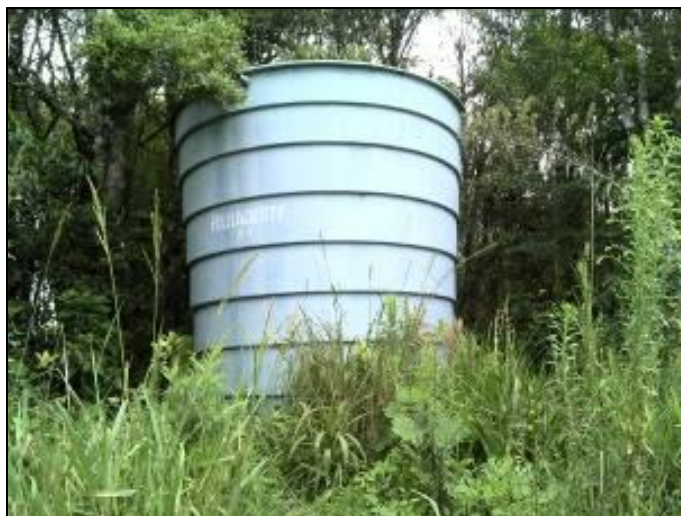
Figura 40: Reservatório Corredeira

Coordenadas geográficas: 26° 10' 99" S / 49° 23' 50" O