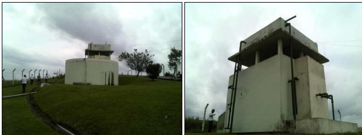
Figura 21: ETA Fragoso

Unidades de tratamento: Filtro de areia e desinfecção.