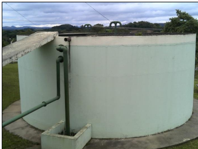
Figura 37: Reservatório Fragoso

Coordenadas geográficas: 26° 10 '29" S / 49° 23' 55" O