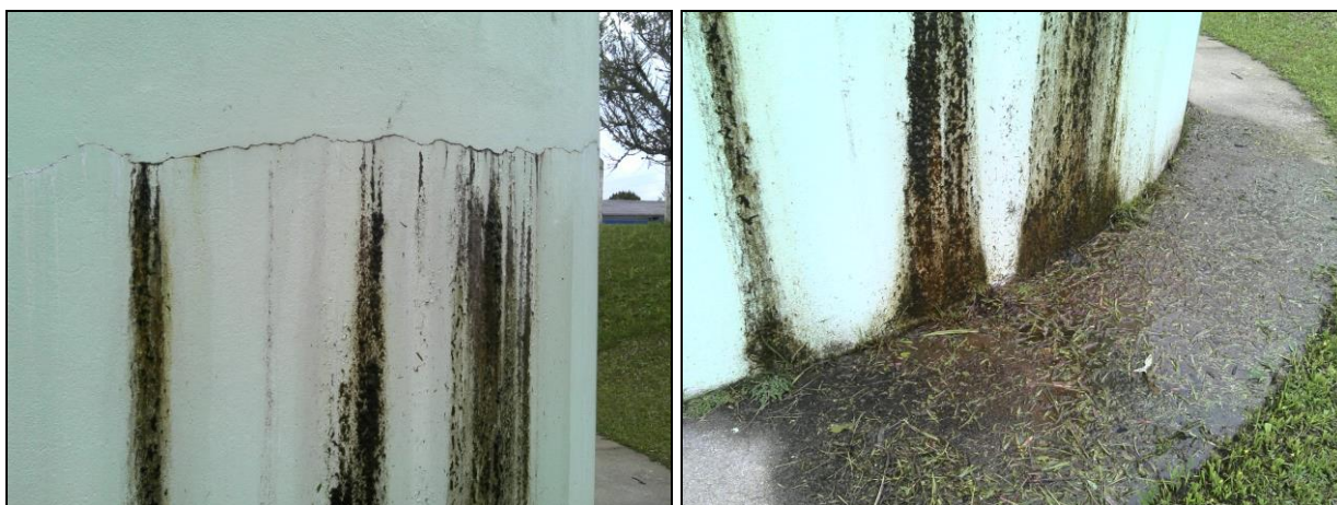
Figura 39: Infiltrações do reservatório

RECOMENDAÇÃO 93: Providenciar os devidos reparos de infiltração, impermeabilização e pintura.