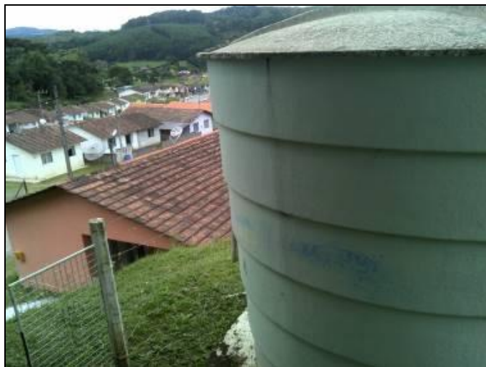
Figura 33: Reservatório Bela Vista

Coordenadas geográficas: 26° 12' 12" S / 49° 16' 47" O