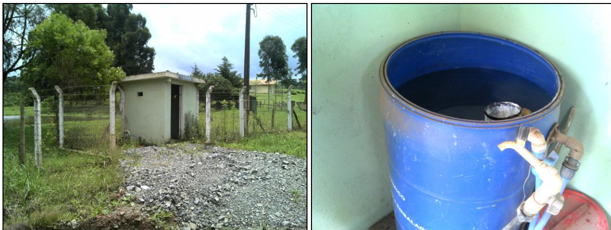
Figura 20: Casa de química Poço Avenquinha II

01) Qual o documento que garante a propriedade ou a posse da área/imóvel ou locação 15 ? Não informado.