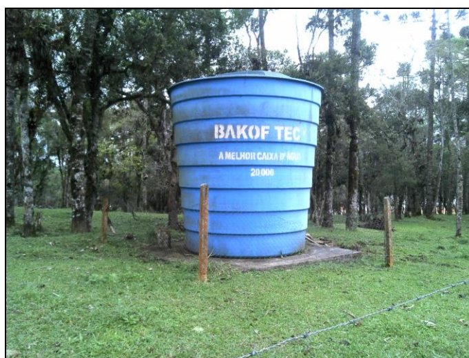
Figura 43: Reservatório Lajeado Parque Industrial

Coordenadas geográficas: 26° 09 '61" S / 49° 15 '43" O