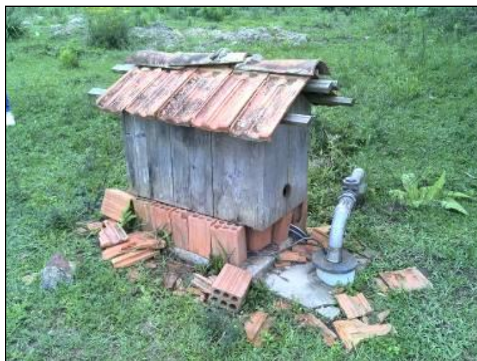
Figura 5: Poço Avenquinha

1) Qual o documento que garante a propriedade ou a posse da área/imóvel ou locação 7 ? Terreno particular.