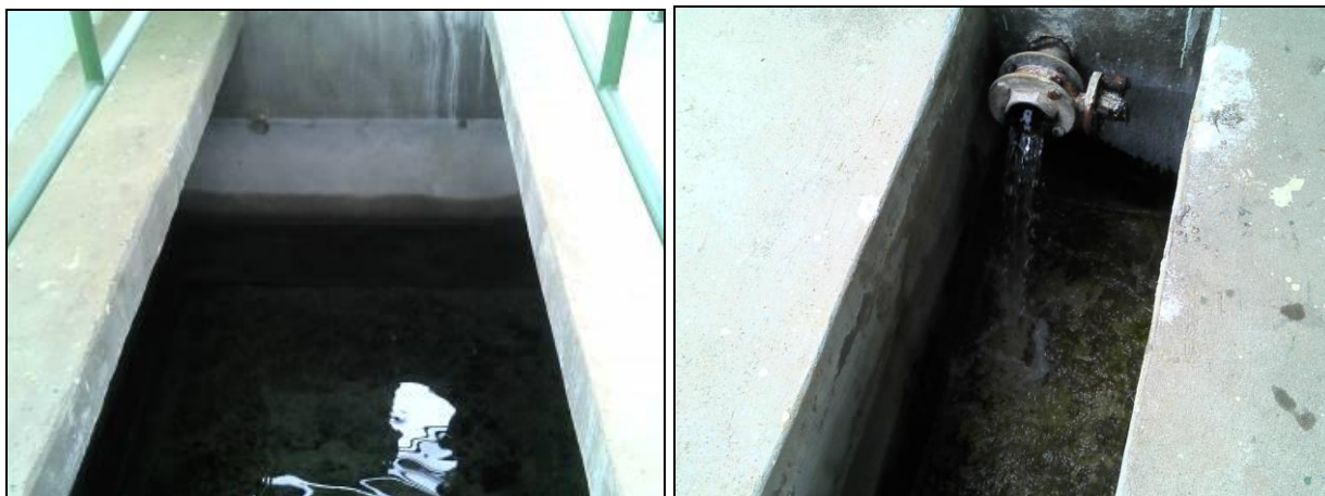
Figura 23: Filtros da ETA

21) Os instrumentos possuem tampas (Resolução ARESC N°11 - Art. 17º)? Sim ( ) Não ( x )