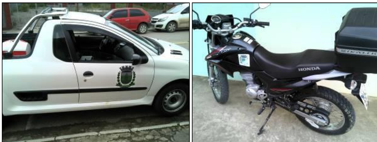
Figura 4: Frota de veículos

19) Existem veículos para uso dos funcionários 3 ? Sim ( x ) Não ( )