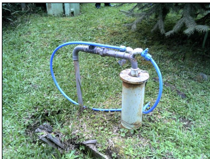
Figura 9: Poço São Miguel

Coordenadas geográficas: 26° 10' 07" S / 49° 12' 93" O