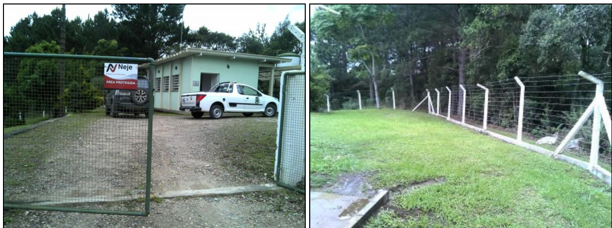
Figura 16: Entorno da ETA

15) Existe cerca de proteção da ETA em bom estado de conservação (Resolução ARESN N°11 - Art. 17°)? Sim ( x ) Não ( )