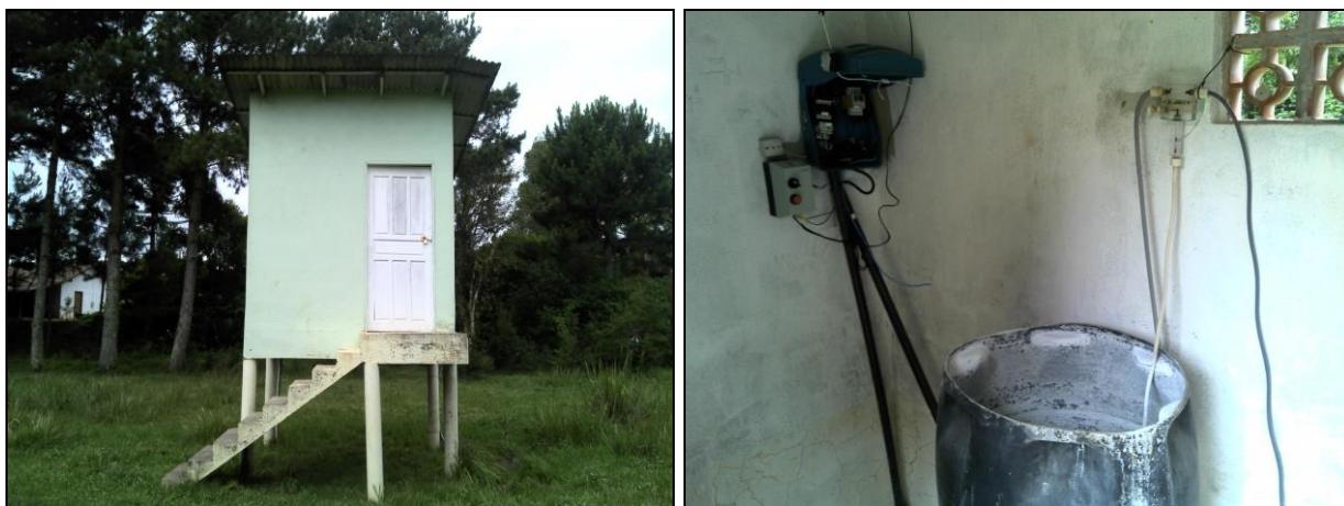
Figura 26: Casa de química Poço Lageado Comunidade

RECOMENDAÇÃO 61: Providenciar tratamento adequado imediatamente (fluoretação).