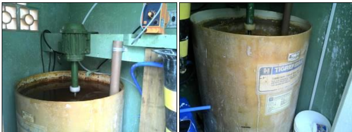
Figura 18: Casa de química da ETA

25) A estrutura do prédio da casa de química está aparentemente segura (Resolução ARESC nº11 Art. 15º)? Sim ( x ) Não ( )