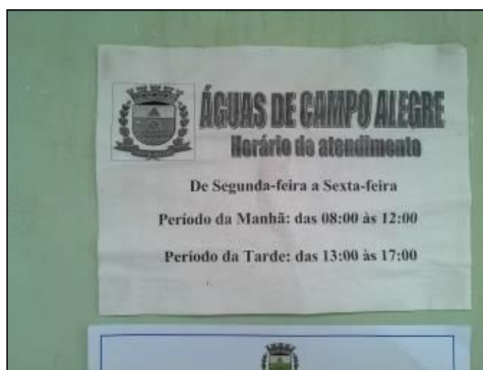
Figura 2: Placa indicativa de atendimento

4) Há placa indicativa do horário de funcionamento (Lei nº 8.078 - Art. 6º)? Sim ( x ) Não ( )