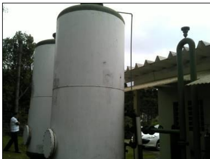
Figura 17: Filtros da ETA

23) Os filtros estão em boas condições (Resolução ARESC Nº11 - Art. 17º)? Sim ( x ) Não ( ) N° de filtros: 02 filtros.