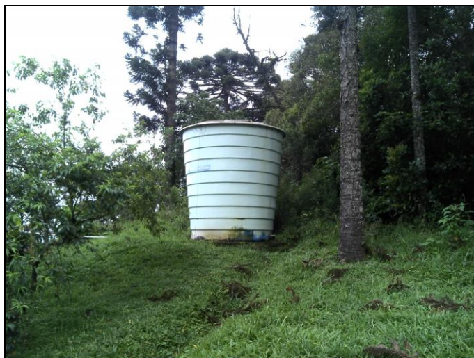
Figura 42: Reservatório São Miguel

i) Reservatório São Miguel – Endereço: São Miguel.