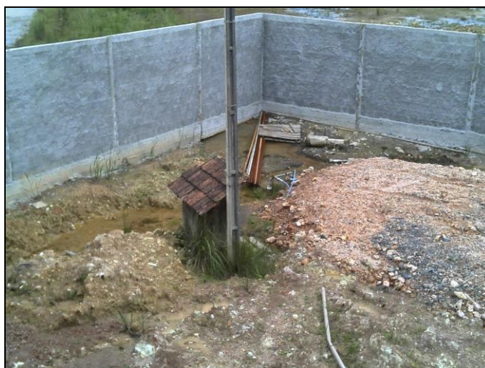
Figura 10: Poço Lageado

Coordenadas geográficas: 26° 09' 34" S / 49° 15' 33" O