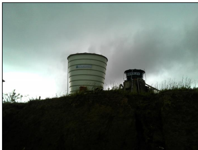
Figura 45: Reservatório Bateias de Baixo