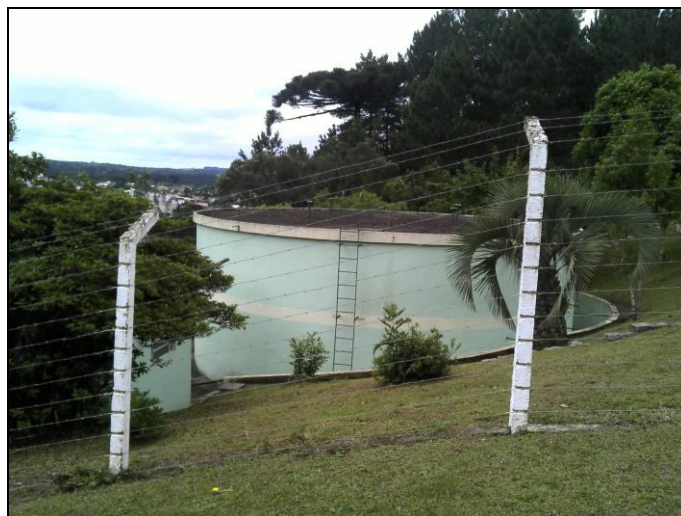
Figura 27: Reservatório da ETA

Coordenadas geográficas: 26° 12' 03" S / 49° 15 69" O