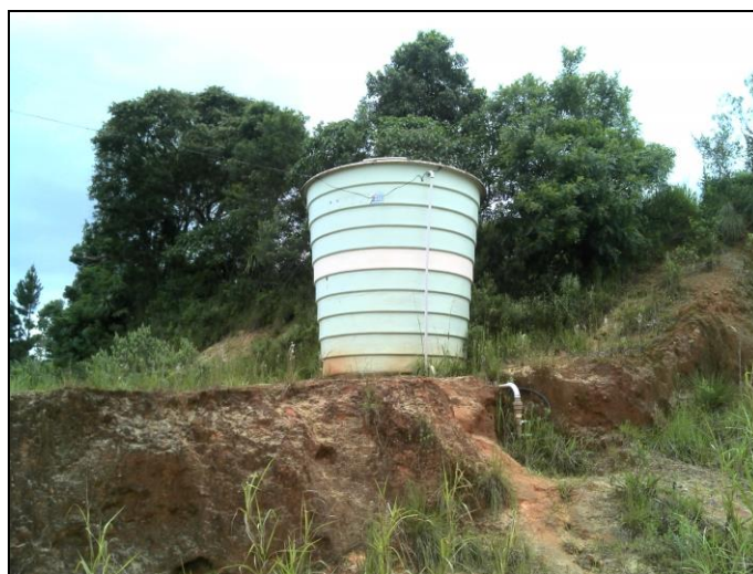
Figura 41: Reservatório Mutirão da Boa Vista

h) Reservatório Mutirão da Boa Vista – Endereço: Boa Vista.