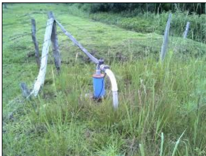
Figura 8: Poço Corredeira

01) Qual o documento que garante a propriedade ou a posse da área/imóvel ou locação 10 ? Não informado.