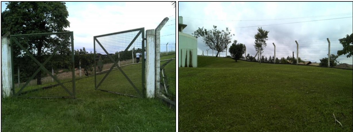
Figura 22: Portão de acesso e cercas da ETA

13) As condições de limpeza do pátio externo são boas (Resolução ARESC n°11 - Art. 15º)? Sim ( x ) Não ( )