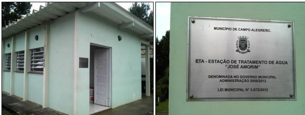
Figura 12: ETA José Amorim

Unidades de tratamento: Ocorre somente filtração e desinfecção (tanque de contato).