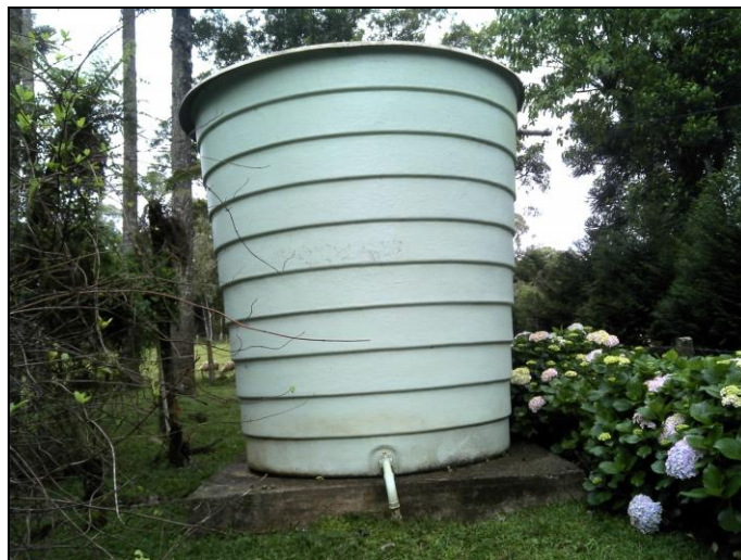
Figura 44: Reservatório Lajeado Comunidade

k) Reservatório Lajeado Comunidade – Endereço: Lajeado.