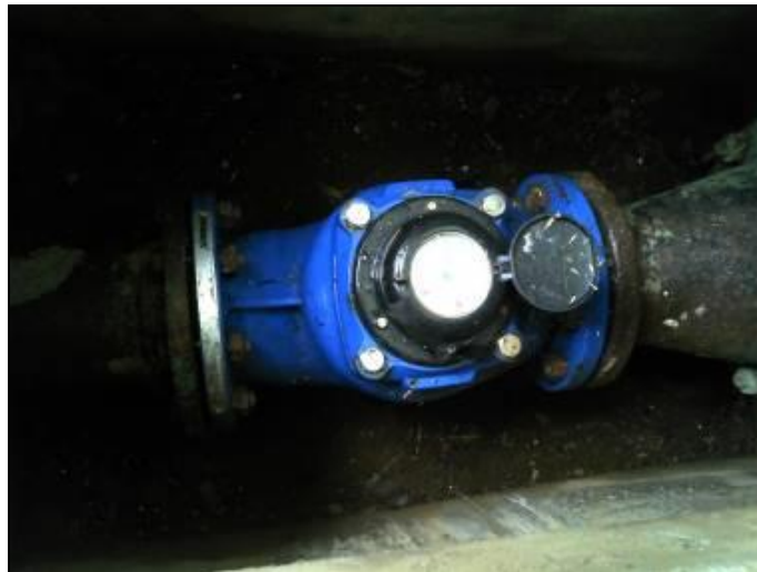
Figura 15: Macromedidor de água tratada

13) Existe Macromedição na saída (Resolução ARESN N°11 - Art. 17°)? Sim ( x ) Não ( )