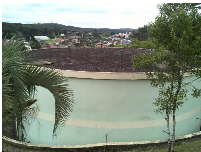
Figura 29: Área de cobertura do reservatório

10) As áreas de cobertura encontram-se em condições adequadas (Resolução ARESC N°11 - Art. 23º)? Sim ( x ) Não ( )