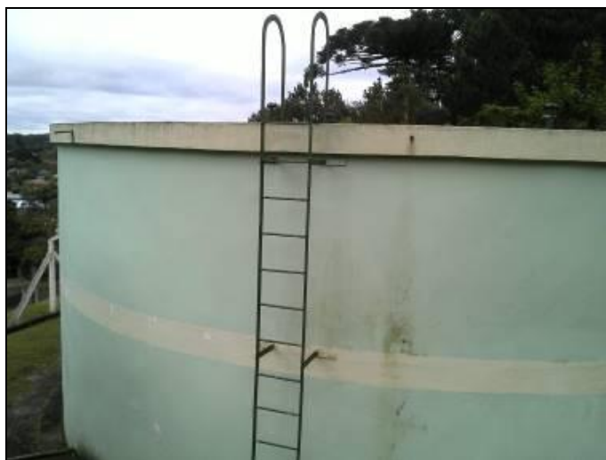
Figura 28: Escada inadequada

09) Existe guarda-corpo nas áreas de visitação (Resolução ARESC N°11 Art. 23º)? Sim ( ) Não ( x )