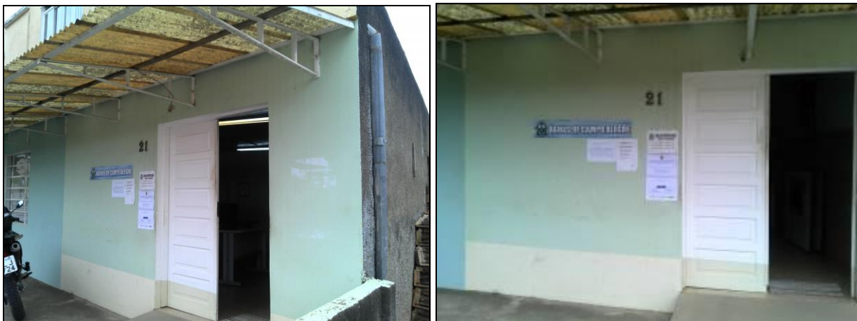
Figura 1: Fachada do escritório

2) O imóvel é: Próprio ( ) Alugado ( ) – Obs.: Não informado.