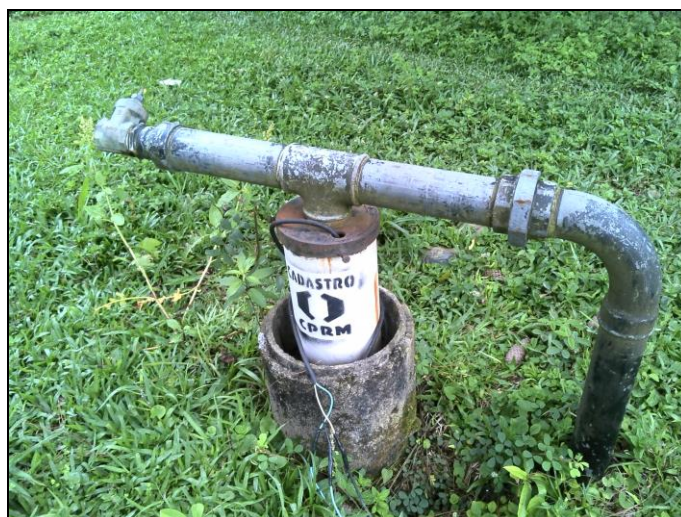
Figura 7: Poço Fragoso

Coordenadas geográficas: 26° 09' 66" S / 49° 22' 86" O