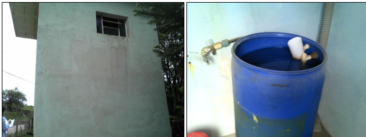
Figura 25: Casa de química Poço São Miguel

RECOMENDAÇÃO 56: Providenciar tratamento adequado imediatamente (fluoretação).