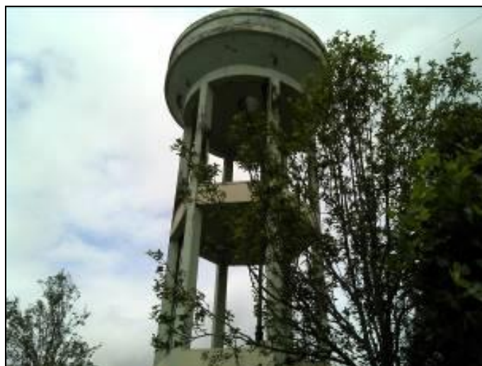
Figura 34: Reservatório Vila Schide

Coordenadas geográficas: 26° 11' 12" S / 49° 15' 19" O