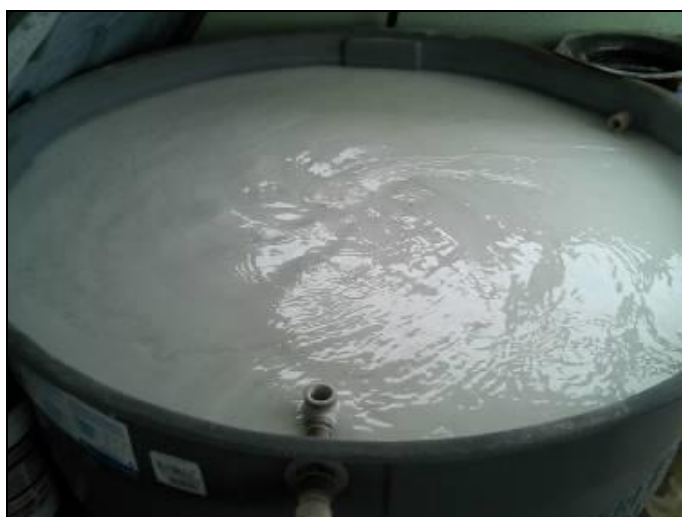
Figura 24: Tanque de cloro

22) A estrutura do prédio da casa de química está aparentemente segura (Resolução ARESC n°11 Art. 15º)? Sim ( x ) Não ( ) - Obs.: Recentemente foi adquirido dosador automático para o cloro.