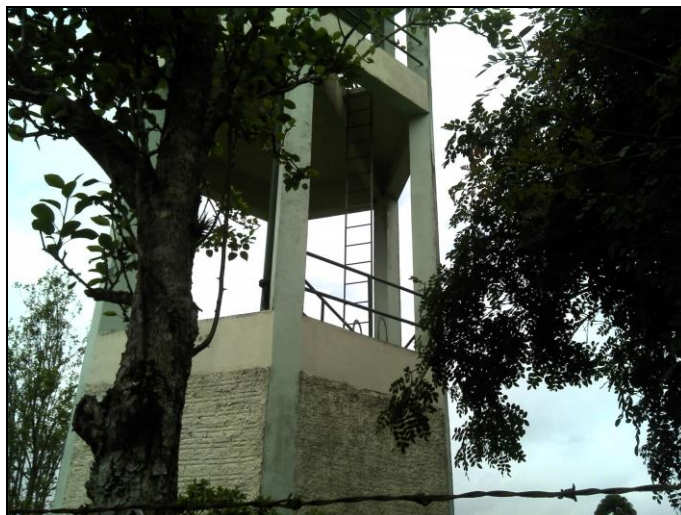
Figura 35: Escadas e guarda-corpo

10) As áreas de cobertura encontram-se em condições adequadas (Resolução ARESC N°11 - Art. 23°)? Sim ( ) Não ( ) – Obs.: Não vistoriado.