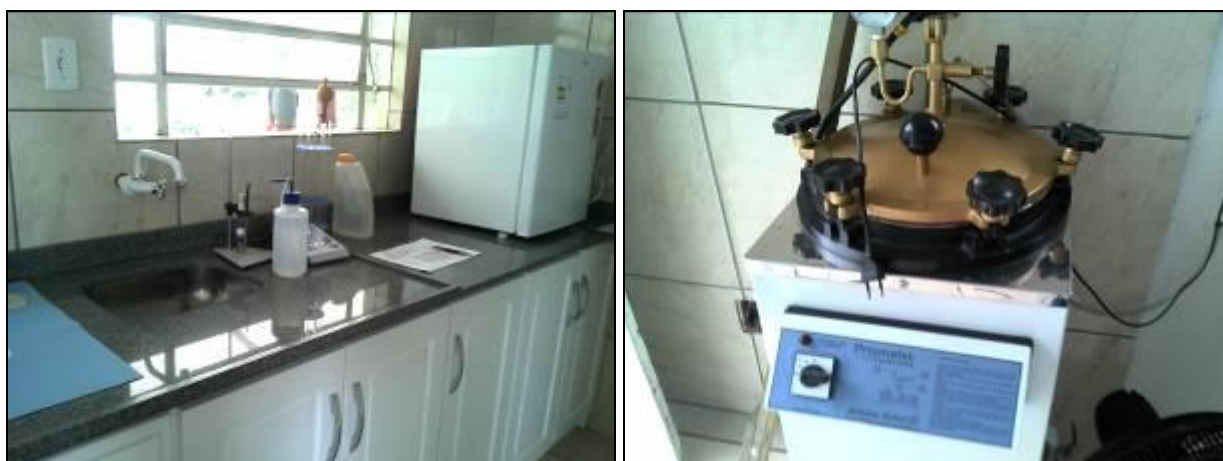
Figura 14: Laboratório da ETA

12) Existe Macromedição na entrada (Res. (Resolução ARESN N°11 - Art. 17°)? Sim ( ) Não ( x )