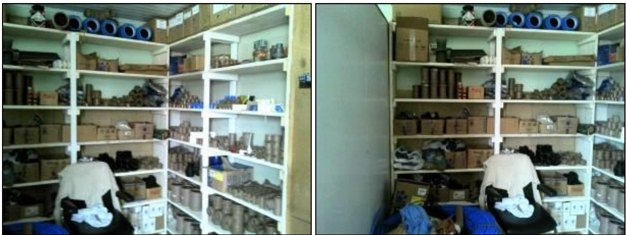
Figura 3: Almoxarifado

11) Existe almoxarifado em boas condições? Sim ( x ) Não ( )