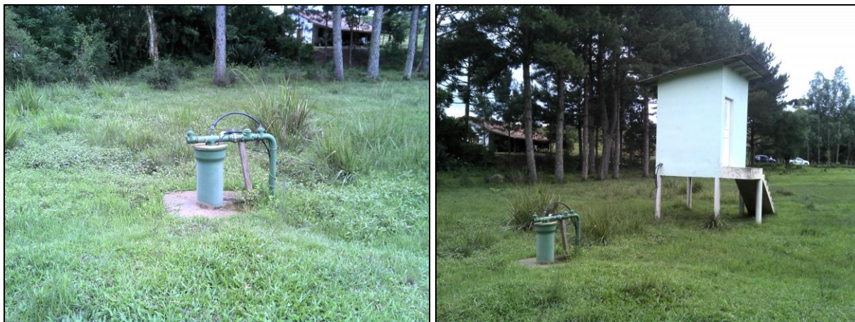
Figura 11: Poço Lageado Comunidade

01) Qual o documento que garante a propriedade ou a posse da área/imóvel ou locação 13 ? Não informado.