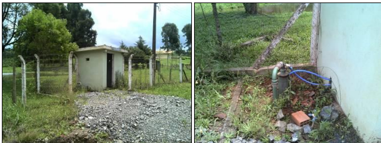
Figura 6: Poço Avenquinha II

Coordenadas geográficas: 26° 09' 66" S / 49° 19' 72" O