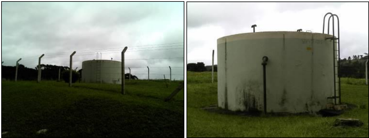
Figura 32: Reservatório Vila Cedro