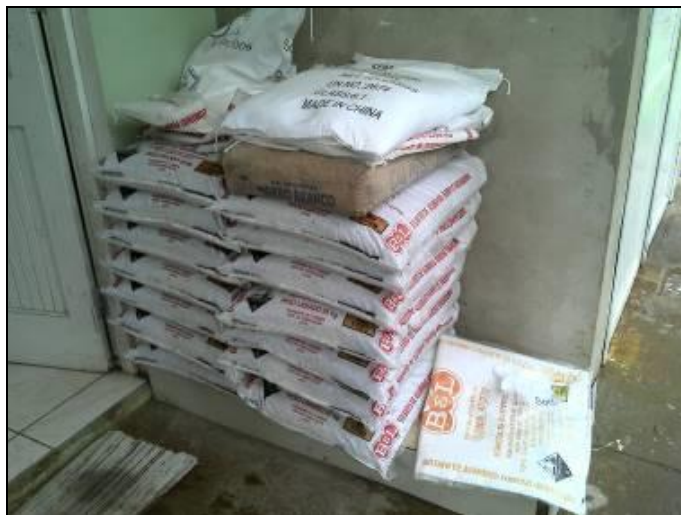
Figura 19: Almoxarifado da ETA

RECOMENDAÇÃO 45: Providenciar local adequado para armazenamento dos produtos químicos.