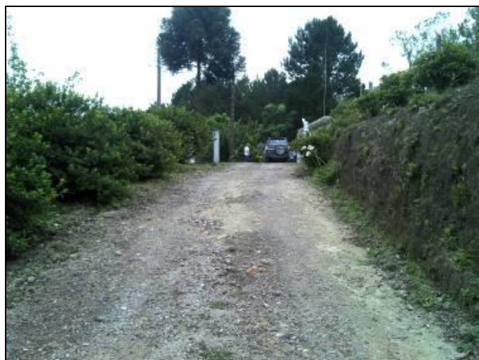
Figura 13: Acesso à ETA

06) O acesso à ETA está em boas condições (Resolução ARESN N°11 - Art. 15°)? Sim ( x ) Não ( )