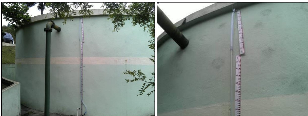
Figura 30: Medidor de nível inadequado

12) Quando foi feita a última limpeza? Não informado.