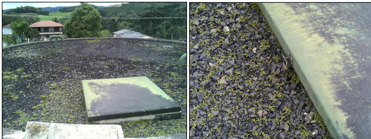
Figura 38: Cobertura do reservatório

10) As áreas de cobertura encontram-se em condições adequadas (Resolução ARESC Nº11 - Art. 23º)? Sim ( x ) Não ( )