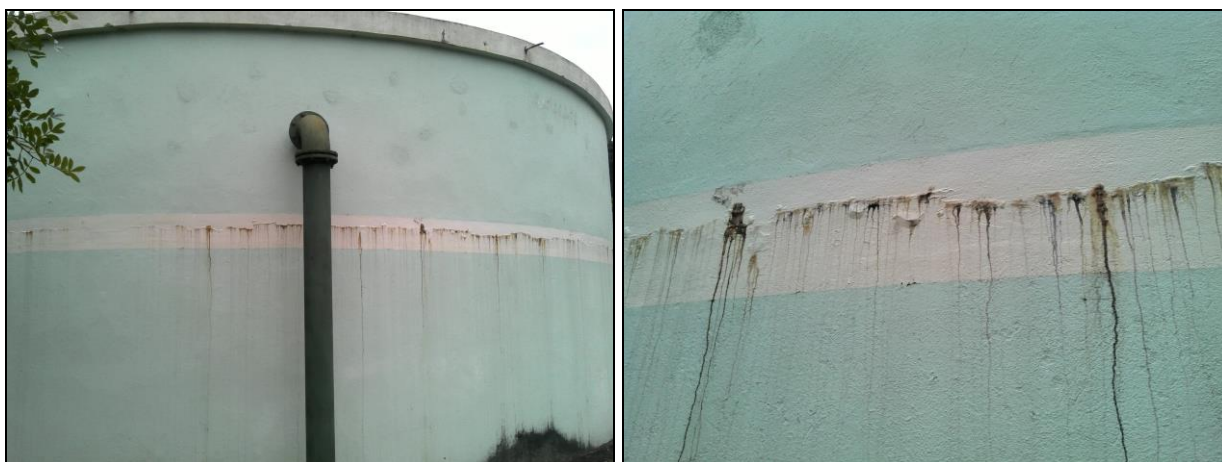
Figura 31: Infiltrações no reservatório

RECOMENDAÇÃO 72: Providenciar os devidos reparos de infiltração, impermeabilização e pintura.