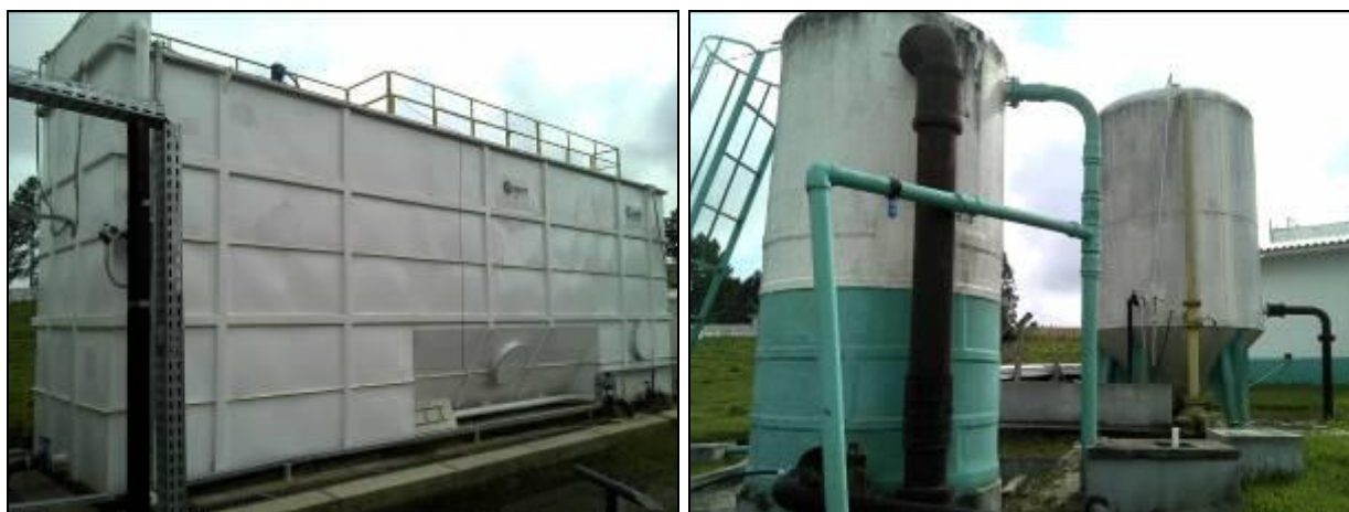
Figura 4: ETA Compacta Nova e ETA antiga (Acompanhamento GEFIS nº 015/2015)

CONCLUSÃO AGESAN: A nova ETA compacta começou sua operação somente no final de 2014 (Figura 4). Ainda restam melhorias a serem feitas, como a retirada da ETA antiga, assentar o terreno e reparar as cercas e o portão de acesso, fazer a drenagem do terreno, entre outros. Os macromedidores foram instalados, porém somente o medidor de entrada de água bruta está em funcionamento (Figura 5).