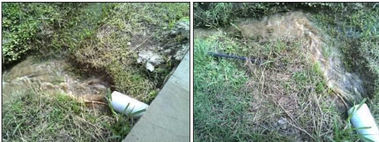
Figura 6: Descarte incorreto do lodo (Acompanhamento GEFIS nº 015/2015)

CONCLUSÃO AGESAN: O descarte correto do lodo não adequado, mesmo com a instalação de uma nova Estação. O lodo é descartado no próprio terreno, sendo direcionado para a rede pluvial da rua, conforme Figura 6.