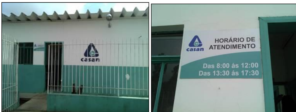
Figura 1: Cartaz com horário de atendimento (Acompanhamento GEFIS nº 015/2015)

CONCLUSÃO AGESAN: Cartaz afixado (Figura 1).