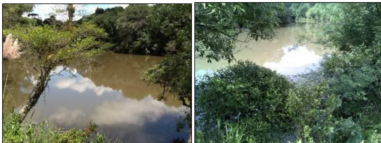
Figura 3: Manancial (Inicial GEFIS nº 068/2013 e Acompanhamento GEFIS nº 015/2015)

CONCLUSÃO AGESAN: Os prazos solicitados pela Concessionária expiraram e o local permanece sem isolamento e sem placas de identificação e restrição de acesso (Figura 3). Segundo Chefe da Agência, o proprietário do terreno onde fica localizada a captação cedeu outro espaço para que ocorra a mudança de local e as devidas melhorias.