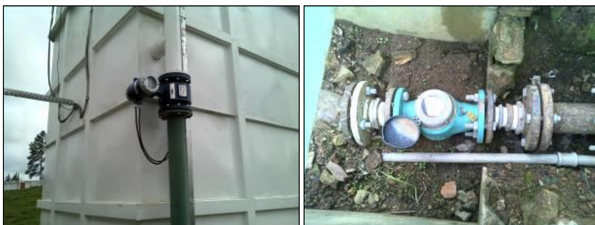
Figura 5: Macromedidores (Acompanhamento GEFIS nº 015/2015)

ITEM 15: O lodo lançado pelos decantadores é disposto de forma adequada? Sim ( ) Não (x) - Onde? R.: No meio ambiente.