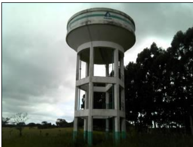
Figura 7: Reservatório (Acompanhamento GEFIS n° 015/2015)

CONCLUSÃO AGESAN: Sem placa de identificação e restrição de acesso, conforme Figura 7.