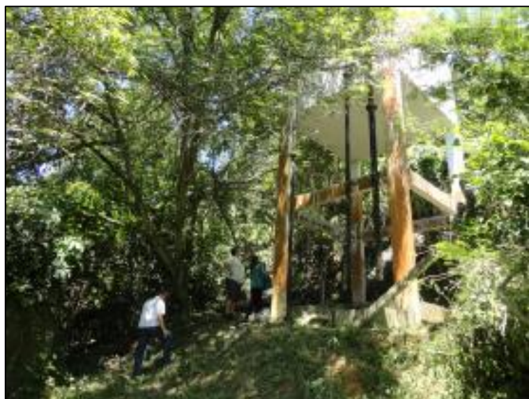
Figura 4: Reservatório que abastece o Loteamento Vila Cachoeira