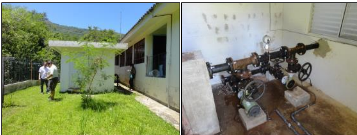
Figura 1: Vista externa e interna da ERAT Vila Cachoeira (29/01/2014)