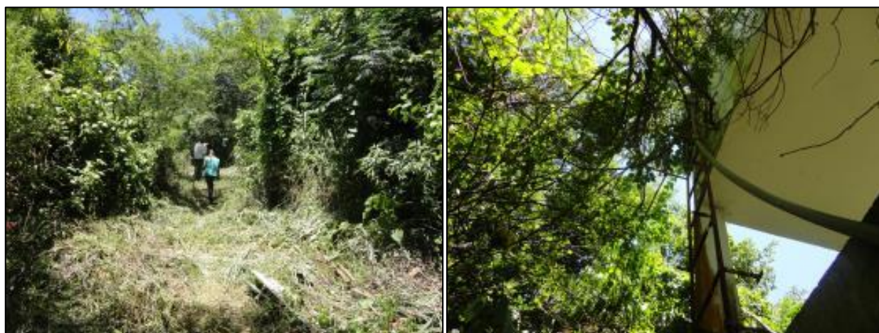
Figura 5: Acesso ao reservatório (à esquerda) e escada do reservatório enferrujada e danificada (à direita)