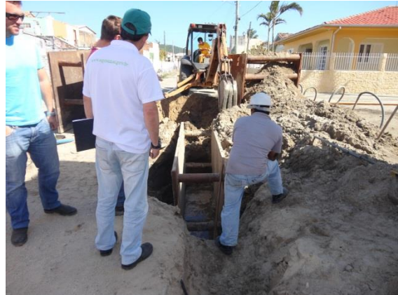
Figura 1: Bairro Esperança