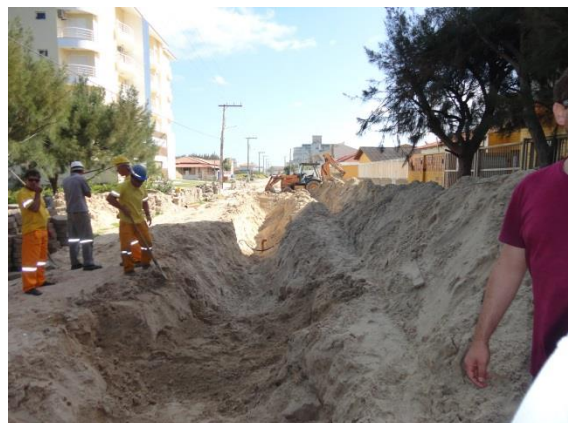
Figura 3: Mar Grosso