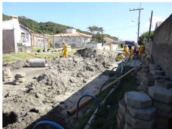
Figura 2: Bairro Progresso