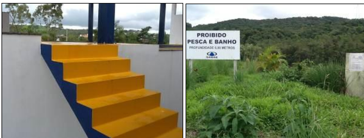
Figura 13: ETA recém inaugurada (ainda faltam guarda-corpos) e placas de orientação (d)