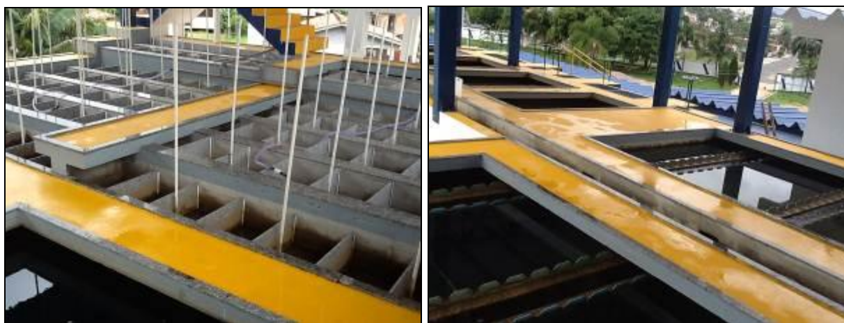
Figura 9: Floculadores e Decantadores