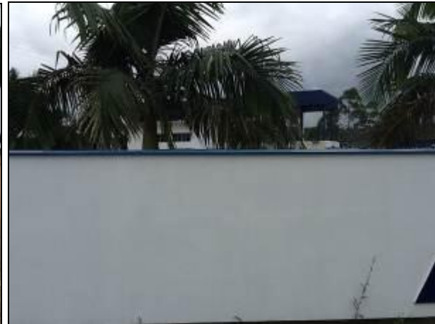
Figura 7: Vista da ETA

1) As condições do Laboratório são adequadas? Sim (x) Não ( ) Pendência ( ):