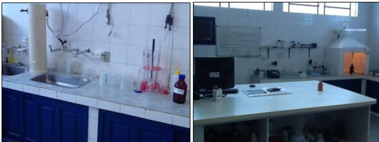
Figura 8: Laboratório