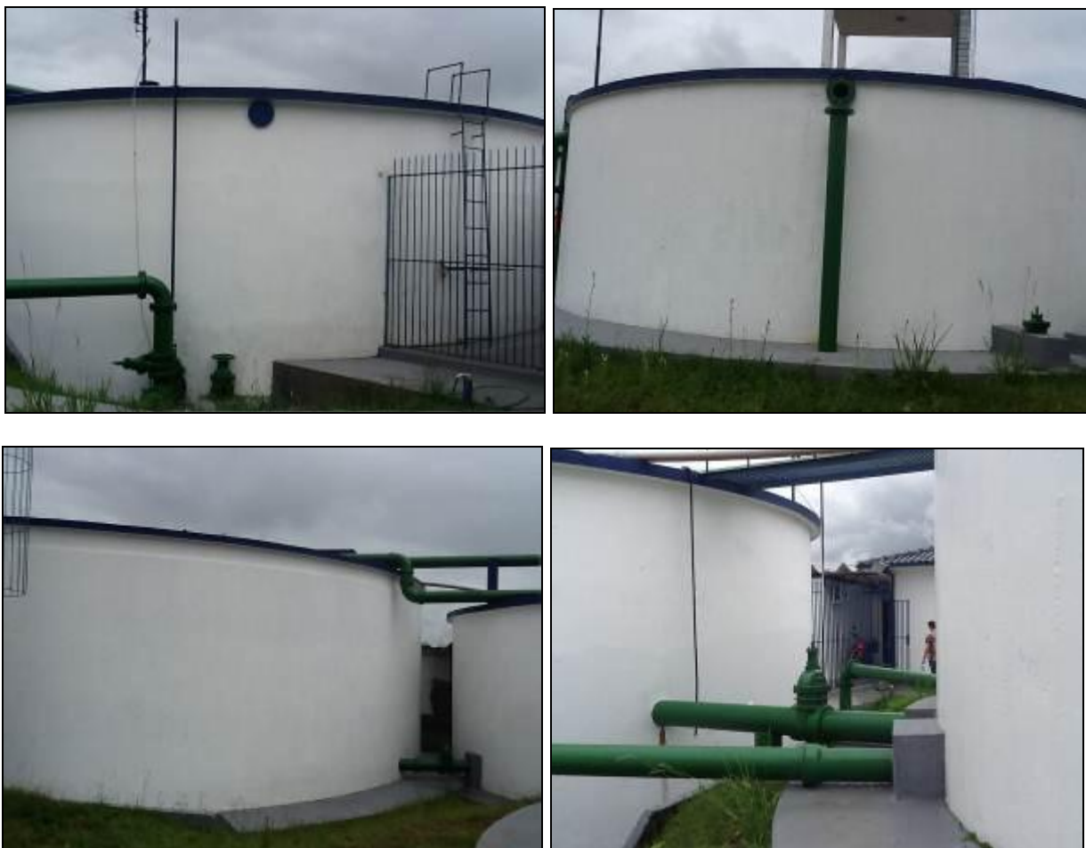
Figura 10: Reservatórios