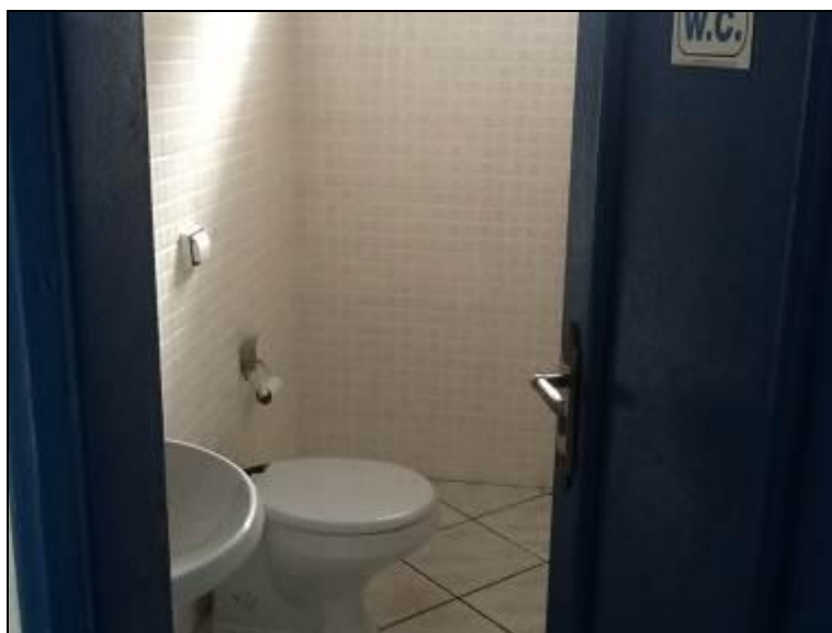
Figura 2: Sanitário Disponível