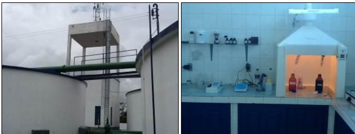
Figura 12: Reservatório suspenso (desativado) e à direita, Laboratório.