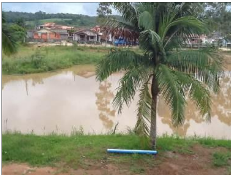
Figura 5: Área de captação do Rio Cocal.

Onde é tratada a água deste manancial? Na ETA Central.