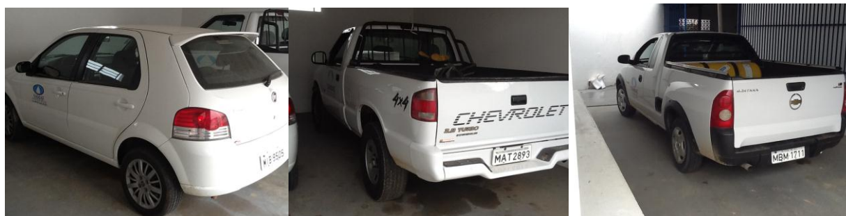
Figura 4: Veículos do SAMAE

9) Existem veículos para uso dos funcionários? Sim (x) Não ( ) Pendência ( ): Quantos? 1 saveiro, 1 montana, 1 palio, 1 S10, 2 motos e 1 retroescavadeira.