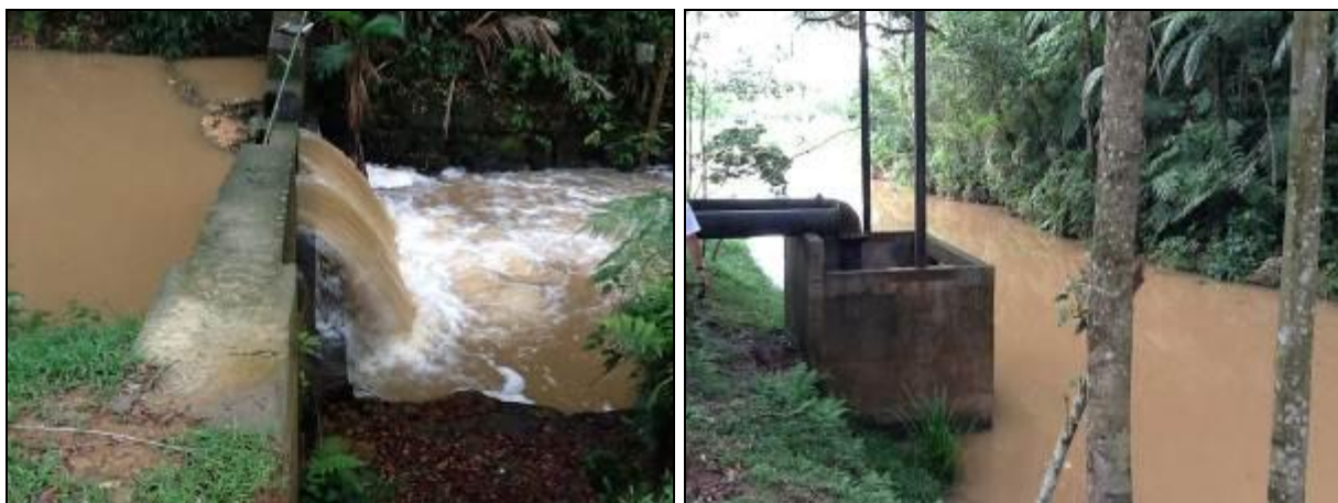
Figura 6: Rio Tigre

Onde é tratada a água deste manancial? Na ETA Central.