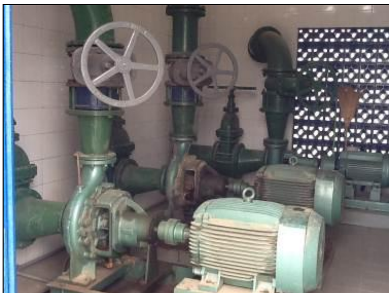
Figura 11: ERAT