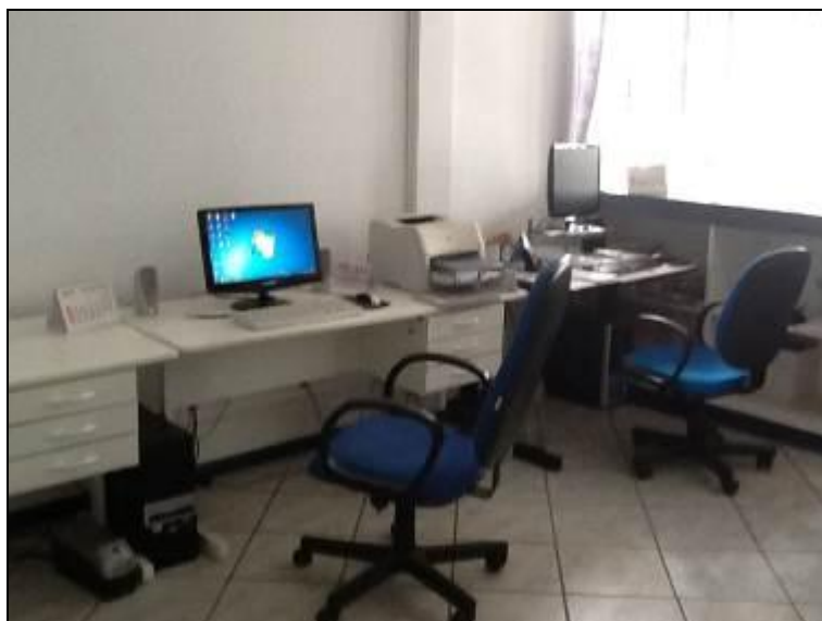
Figura 3: Área de atendimento ao Público

7) O número de funcionários está atendendo à demanda de serviço existente (Resolução AGESAN nº 004 - Art. 131)? Sim (x) Não ( ) Pendência ( ): Quantos são? 20 (vinte).