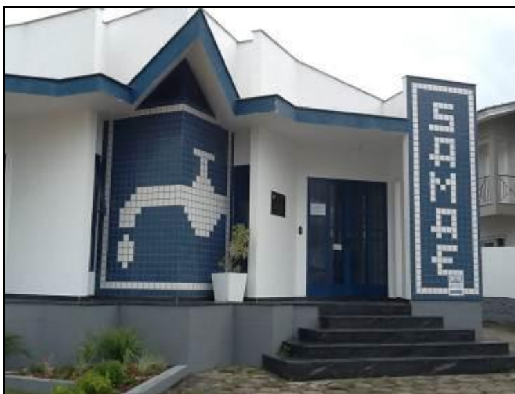
Figura 01 – Fachada do Prédio

1) Existe identificação de que ali funciona um escritório de atendimento (Lei nº 8.078 Art. 6º)? Sim (x) Não ( ) Pendência ( ):