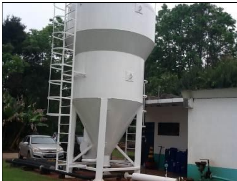
ETA Compacta de Riqueza.