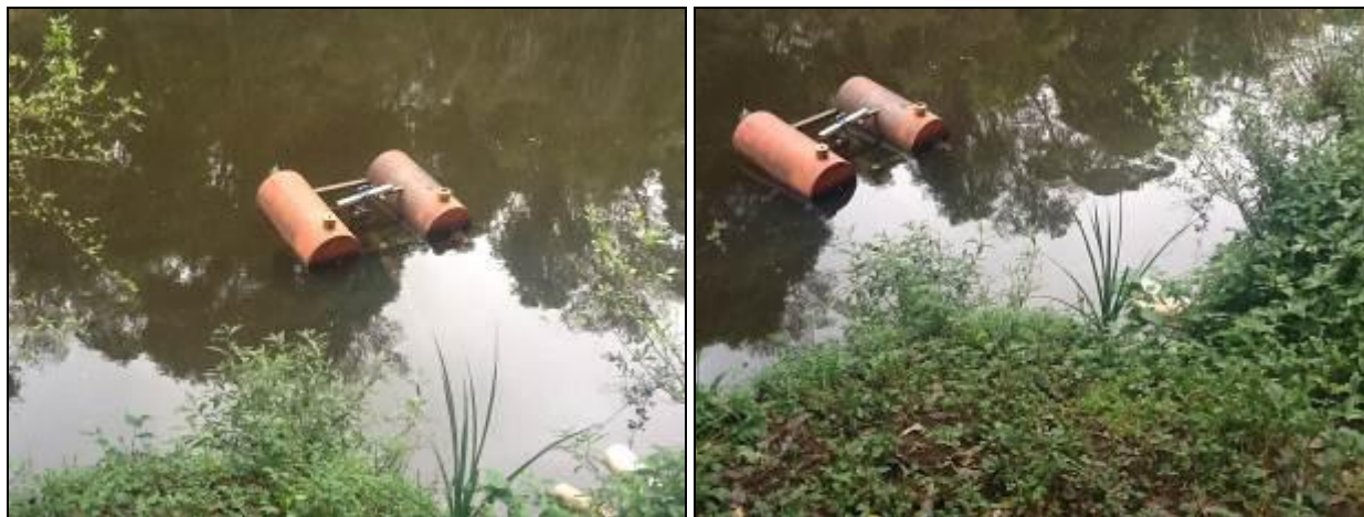
Área do manancial onde é feita a captação.

Manancial: Rio Iracema - Localização: Riqueza