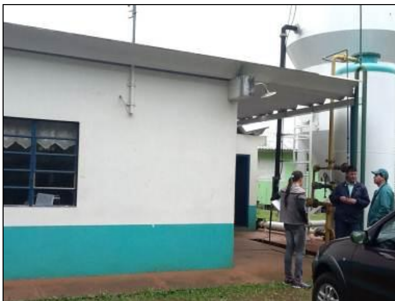
Áreas externas em bom estado de conservação.