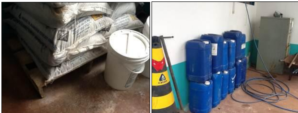
Acondicionamento de produtos químicos.

22) O empilhamento dos produtos químicos é adequado (Resolução AGESAN N°11 - Art. 18° §2°)? Sim (x) Não ( ) Pendência ( ):