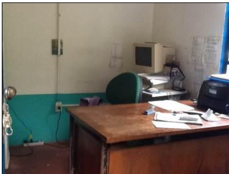
Áreas internas do Escritório.

5) Os equipamentos e instalações elétricas estão em bom estado (Resolução AGESAN nº 004 - Art. 127)? Sim (x) Não ( ) Pendência ( ): _____