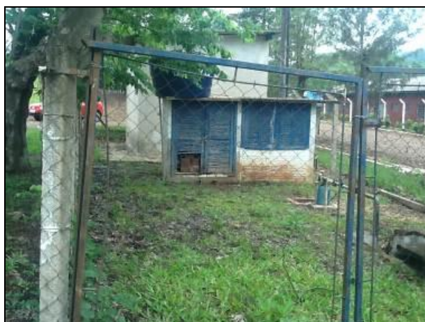
Área do manancial onde é feita a captação.

Manancial: Interior - Localização: Cambucica