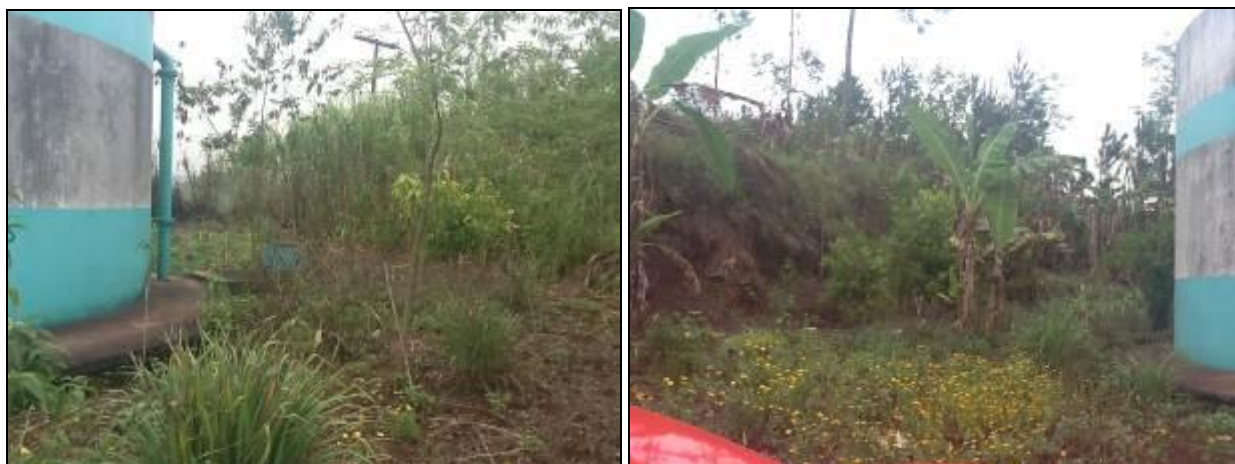
Áreas de entorno dos Reservatórios do SAA.

4) As condições de limpeza dos entornos são adequadas (Resolução AGESAN N°11 - Art. 23°)? Sim ( ) Não (x) Pendência ( ):