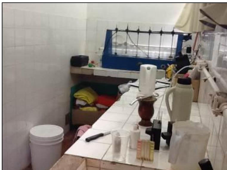
Espaço que serve ao laboratório de Riqueza.