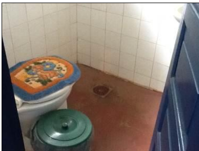
Sanitários de unidades da estrutura de Curitibaanos

6) Existe sanitário disponível para uso dos funcionários (Resolução AGESAN nº 004 Art. 127)? Sim (x) Não ( ) Encontra-se em boas condições de higiene e limpeza? Sim (x) Não ( ) Pendência ( ): _____