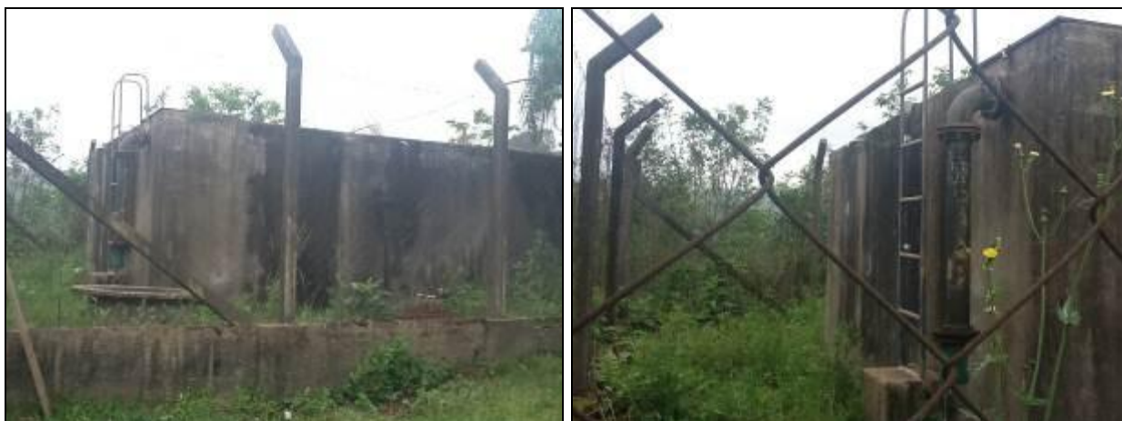
Reservatório do interior em condições péssimas.

RECOMENDAÇÃO 20: Adotar melhorias de manutenção e pintura.