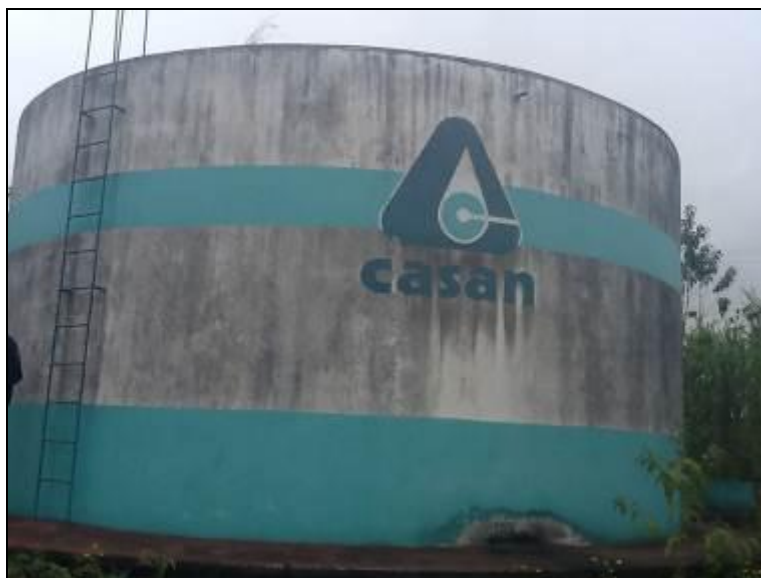
Acondicionamento de produtos químicos.

3) Existem placas indicativas de propriedade e restrição de uso das áreas dos reservatórios (Resolução AGESAN N° 004 - Art.19 - §2°)? Sim ( ) Não (x) Pendência ( ): RECOMENDAÇÃO 18: Colocar placas necessárias.