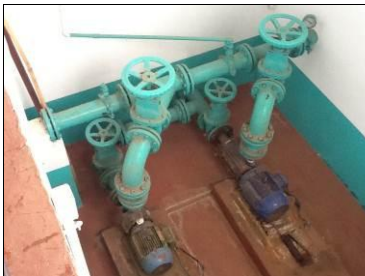
Casa das bombas onde é feito o recalque para o Reservatório

8) Existe proteção contra enchentes e entrada de pessoas estranhas e animais (Resolução AGESAN N°11 - Art. 10º)? Sim ( ) Não (x) Pendência ( ):