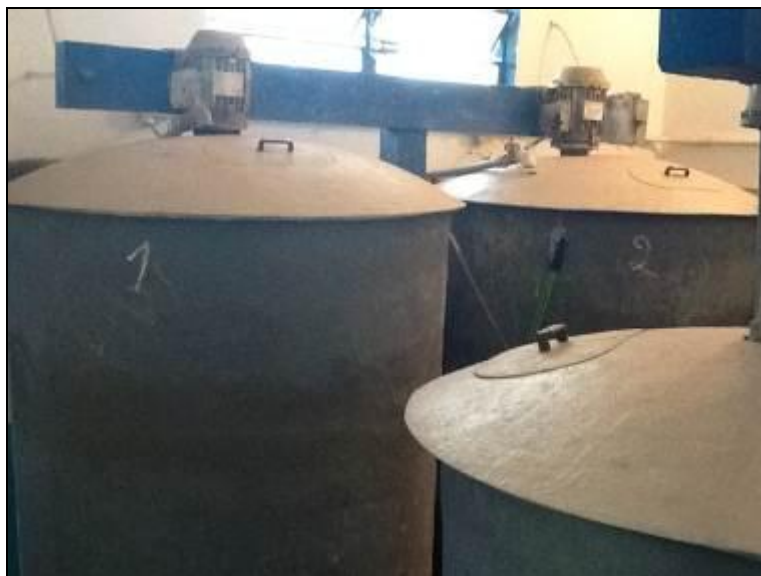
Área de adição dos produtos químicos.

20) A estrutura do prédio da casa de química está aparentemente segura (Resolução AGESAN N°11 Art. 15º)? Sim (x) Não ( ) Pendência ( ) : _____