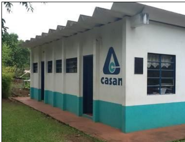
Escritório funciona junto à ETA.

Endereço: Rua José Bressan, s/n – Centro - Riqueza