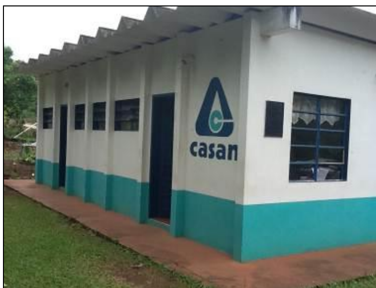
Fachada da ETA

Localização: Rua José Bressan, s/n - Riqueza.