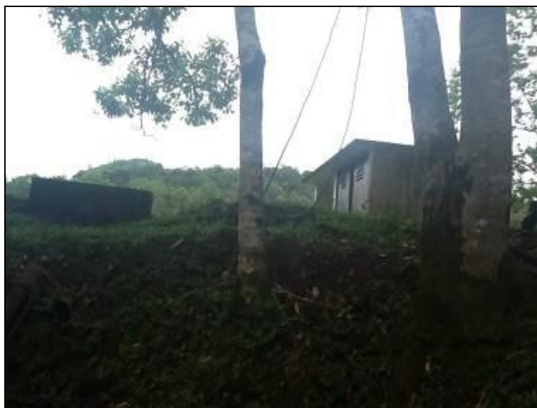
Área do manancial não é cercada, nem identificada.

3) Existe cerca de proteção da área do manancial (Resolução AGESAN nº11- Art. 10º)? Sim ( ) Não (x) Pendência ( ):