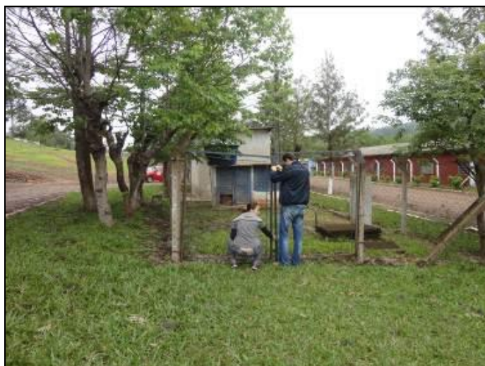
Área do manancial é cercada, mas não identificada.

13) Existe cerca de proteção da área do manancial (Resolução AGESAN nº11- Art. 10º)? Sim ( ) Não (x) Pendência ( ):