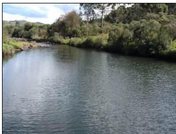
Área do Manancial com a Represa em destaque à esquerda.