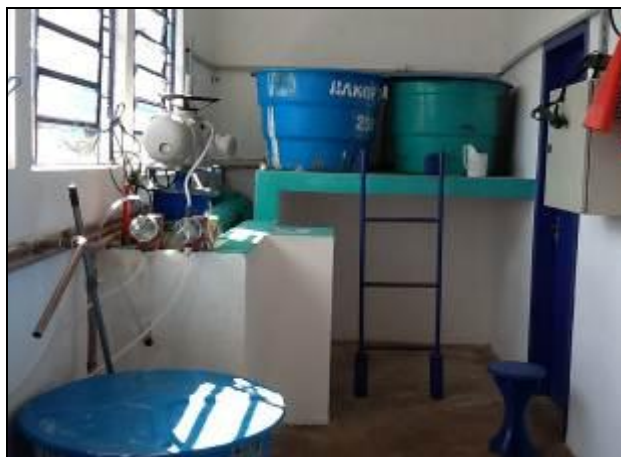
ETA / Casa de Química.

20) Existe almoxarifado para acondicionamento de produtos químicos (Resolução AGESAN N°11 - Art. 18° §2°)? Sim (x) Não ( ) Pendência ( ): _____