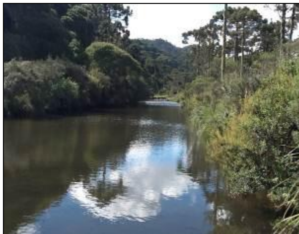
Manancial não dispõe de proteção/isolamento.

4) O volume captado atualmente garante o abastecimento de água sem haver colapso no abastecimento (NBR 12211 item 5.5)? Sim (x) Não ( ) Pendência ( ): _____