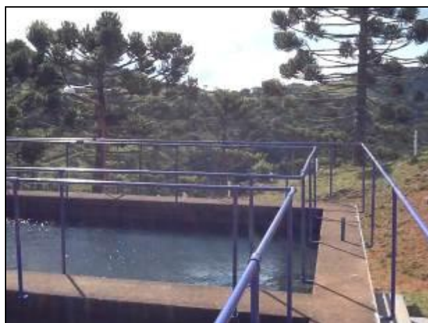
Área oferece segurança de guarda-corpos.