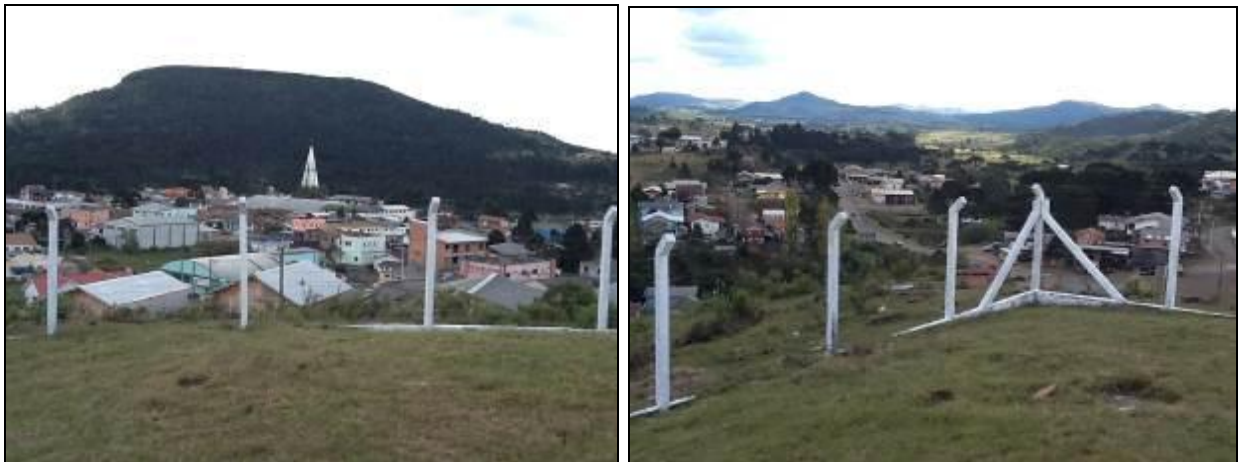
Área de entorno do R-02.

5) As áreas estão devidamente cercadas e trancadas (Resolução AGESAN Nº11 - Art. 23º)? Sim ( ) Não ( ) Pendência (x): Cercar com defeitos estavam sendo consertadas por ocasião da visita.