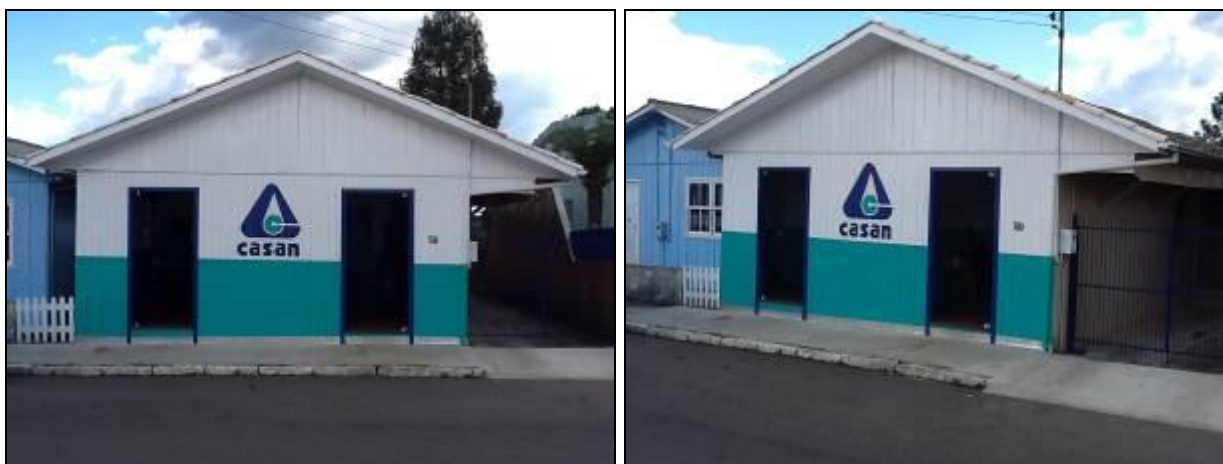
Fachada do Escritório

Endereço: Av. Manoel Esteves, 59 - Centro