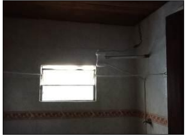
Sanitário que serve à Agência local

7) Há sanitários para os usuários (Resolução AGESAN N° 004 - Art. 127)? Sim ( ) Não ( ) Encontram-se em boas condições de higiene e limpeza? Sim ( ) Não ( ) Pendência (x): Usam os dos usuários.