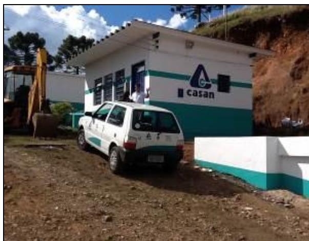
Vista geral da ETA – Bom Jardim da Serra