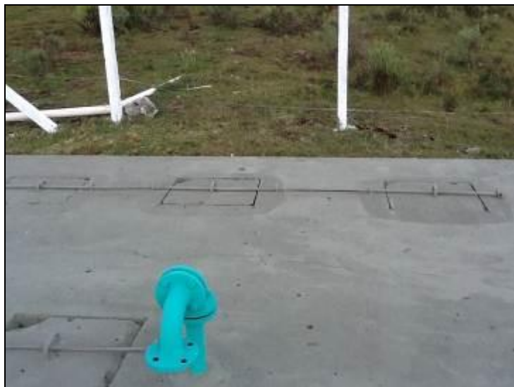
Cobertura do R-02

8) As áreas de cobertura encontram-se em condições adequadas (Resolução AGESAN N°11 - Art. 23°)? Sim (x) Não ( ) Pendência ( ): _____