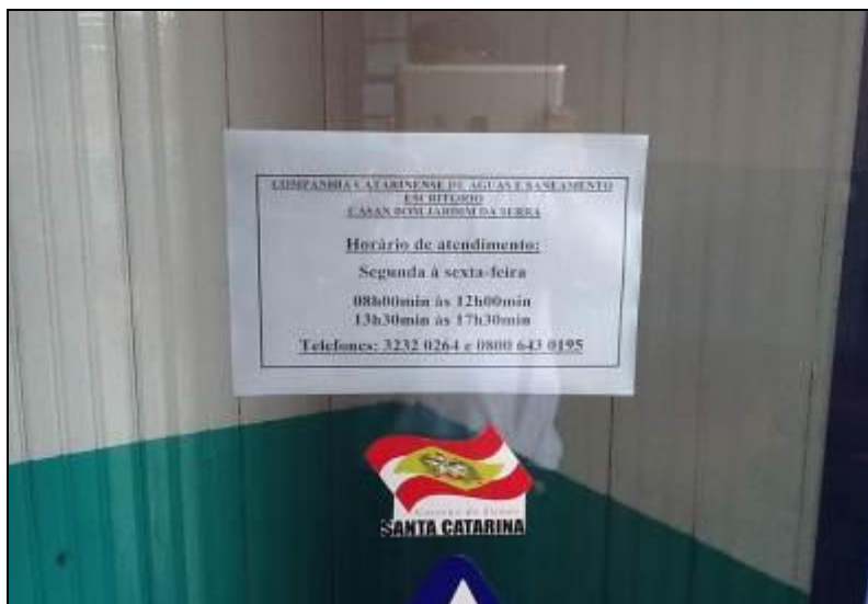
Cartaz com horário de atendimento

3) A estrutura do prédio está aparentemente segura (Resolução AGESAN N° 004 - Art. 127)? Sim (x) Não ( ) Pendência ( ): _____