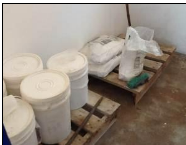
Armazenamento de produtos químicos.

21) O empilhamento dos produtos químicos é adequado (Resolução AGESAN N°11 - Art. 18° §2°)? Sim (x) Não ( ) Pendência ( ): _____