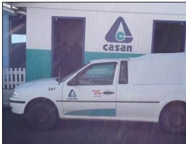
Veículo que atende a Bom Jardim.

16) O usuário é comunicado da possibilidade de acompanhamento (Lei nº 8.078 - Art. 6º) ? Sim ( ) Não (x) Pendência: Não há comunicação.