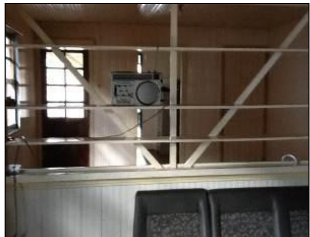
As instalações encontram-se em bom estado de limpeza e conservação.

11) O número de funcionários está atendendo à demanda de serviço existente (Resolução AGESAN N° 004 - Art. 131)? Sim (x) Não ( ) Pendência ( ): _____