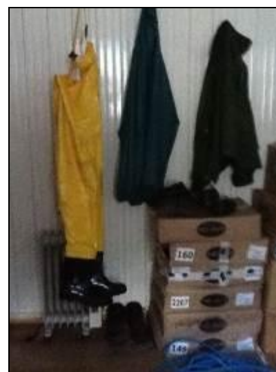
Almoxarifado e equipamentos de proteção individual.

15) Existem veículos para uso dos funcionários? Sim (x) Não ( )