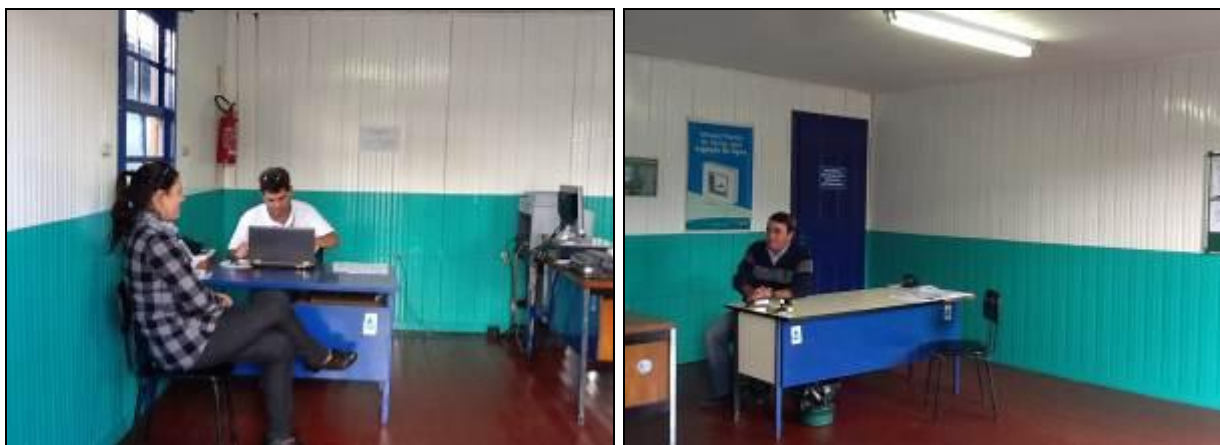
Áreas internas do Escritório.

R1: Apresentar Processo Licitatório referente às providências na SRS para a solução da Constatação.