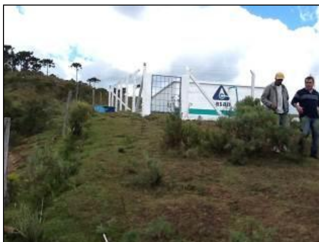
Visão Geral do R-02

6) Existem escadas em boas condições de uso (Resolução AGESAN Nº11 - Art. 23º)? Sim (x) Não ( ) Pendência ( ): _____