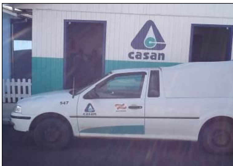
Identificação da Unidade

1) Existe identificação de que ali funciona um escritório de atendimento (Lei nº 8.078 Art. 6º)? Sim (x) Não ( ) Pendência ( ): _____