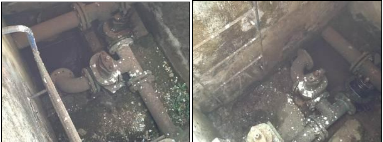
Algumas estruturas não são gradeadas e apresentam pequenos vazamentos.