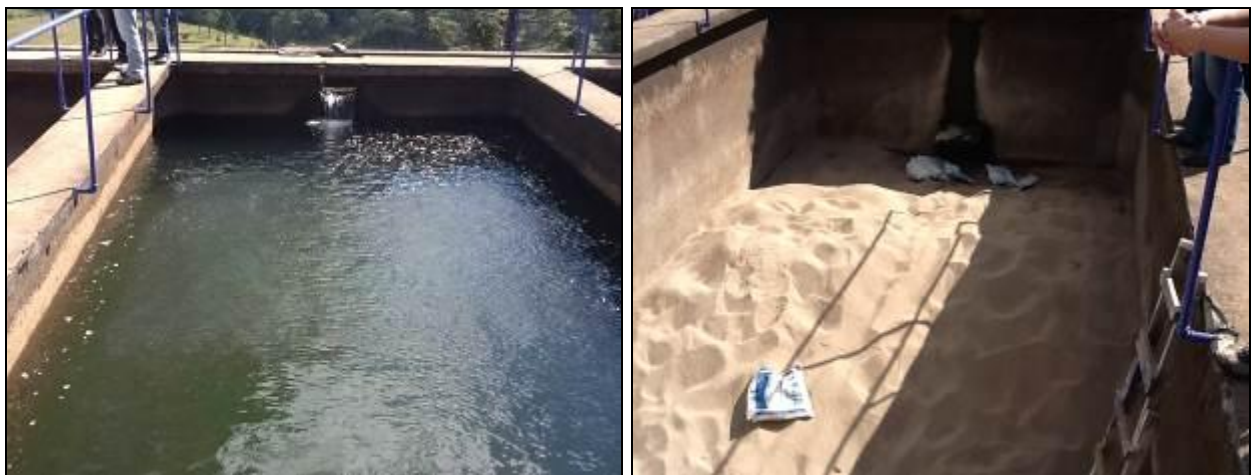
Vista dos filtros.

16) Os filtros estão em boas condições (Resolução AGESAN N°11 - Art. 15º)? Sim ( ) Não (x) N° de filtros: 03( três) . Obs.: Um está em manutenção.