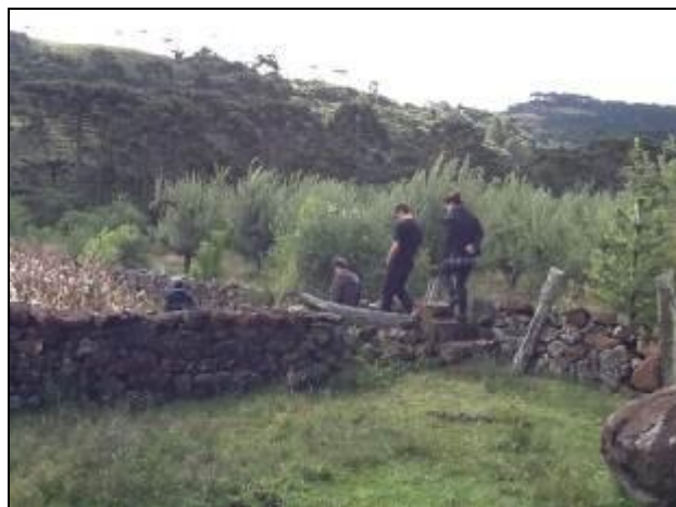
Acesso por trilha com dificuldades de caminamento e falta de segurança

8) Existe proteção contra enchentes e entrada de pessoas estranhas e animais (Resolução AGESAN Nº11 - Art. 10º)? Sim ( ) Não ( ) Pendência (x): Entorno desprotegido e sem informações de acesso restrito. Informado da existência de projeto.