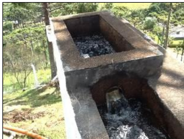
Instalações/equipamentos da ETA

6) Existe Macromedição na saída (Resolução AGESAN Nº11 - Art. 17º)? Sim (x) Não ( )