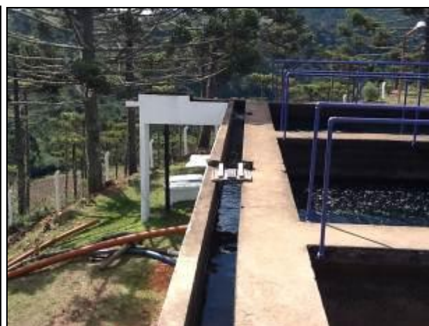
Reservatório e área de tratamento físico.

10) As escadas de acesso estão em boas condições de uso (Resolução AGESAN N°11 - Art. 15º)? Sim (x) Não ( ) Pendência ( ): _____