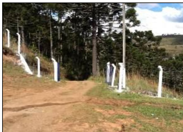
Acesso à ETA está sendo melhorado.

3) Quais parâmetros são analisados na ETA local? (x) Cloro (x) Flúor ( ) Outros: cor e turbidez.