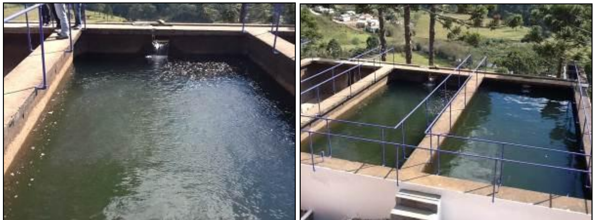
Área de filtros lentos.

12) Os decantadores estão em boas condições (Resolução AGESAN N°11 - Art. 15º)? Sim ( ) Não (x) - N° de decantadores: