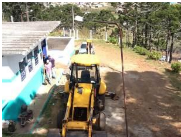
Áreas externas da ETA – Bom Jardim.

9) As condições de limpeza do pátio externo são boas (Resolução AGESAN N°11 - Art. 15º)? Sim (x) Não ( ) Pendência ( ): _____