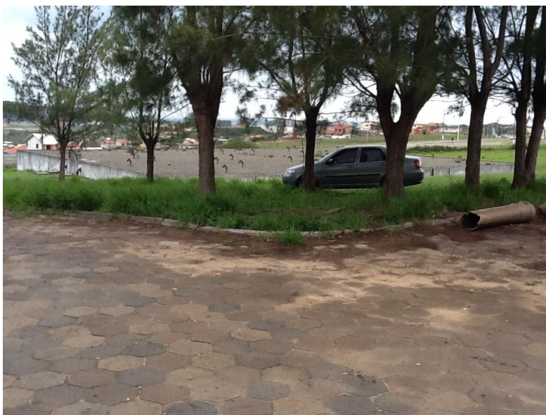
R-03 Nova Alvorada (desativado)