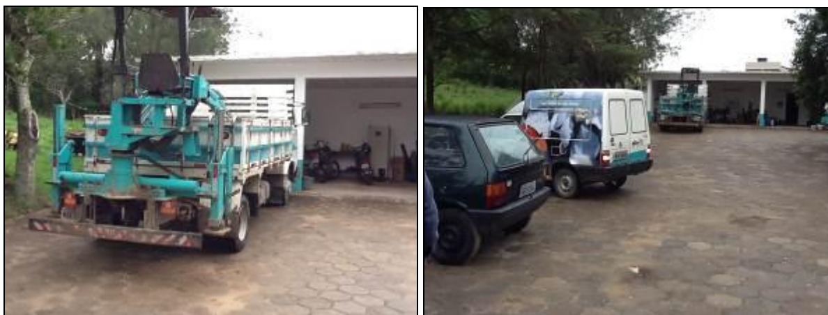
Alguns dos veículos à disposição de Imituba

16) O usuário é comunicado da possibilidade de acompanhamento ( verificar como se dar a comunicação ) (Lei nº 8.078 - Art. 6º) ? Sim (x) Não ( )