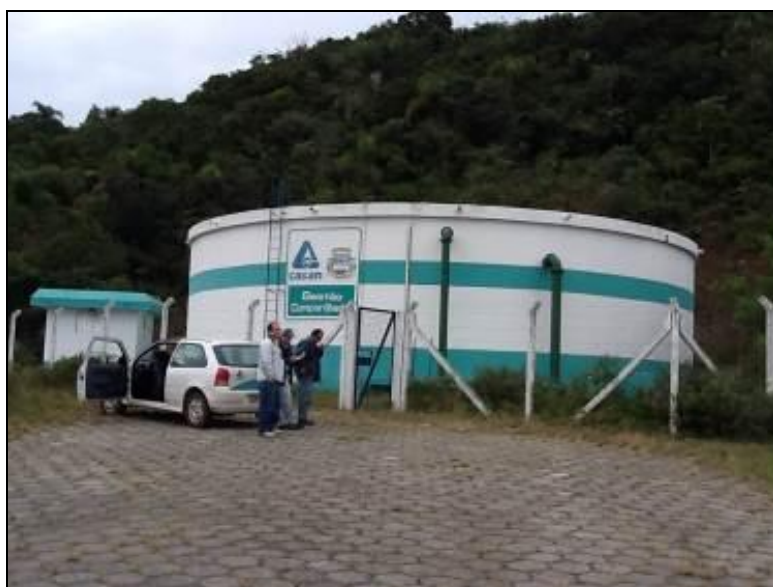
R-07 Ibiraguera – Coordenadas: 0730474 / 6884962