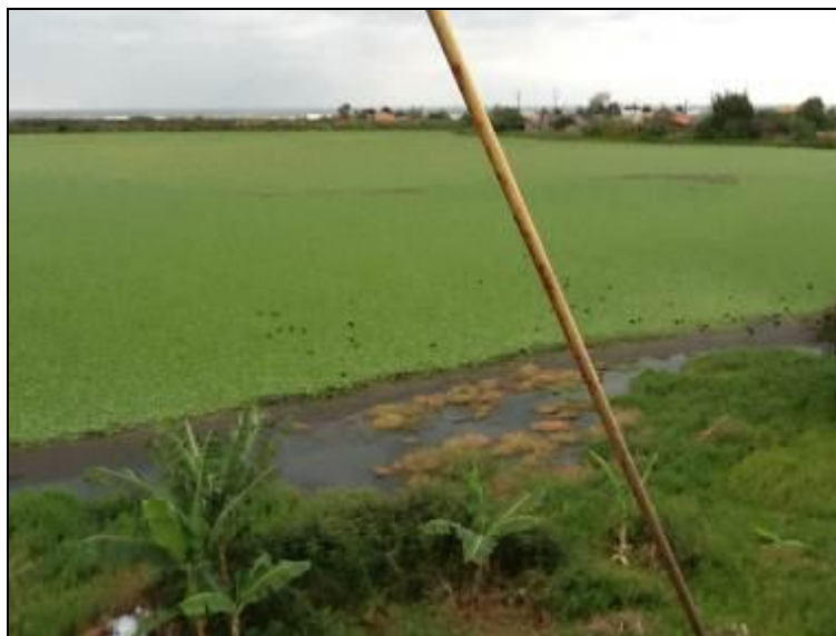
Corpo receptor do efluente final da ETE.