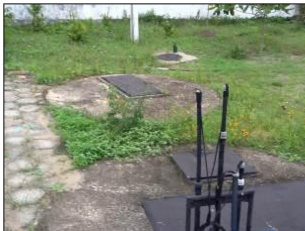
Áreas externas da ETE Imbituba.

12) Existe reclamação de moradores das proximidades a respeito de maus odores e/ou barulho? Sim ( ) Não (x)