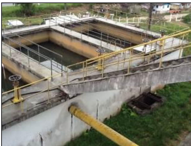
Filtros da ETA Imbituba.