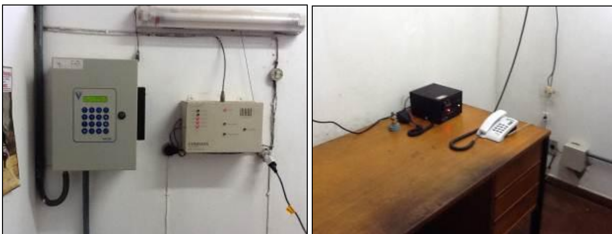
Outros equipamentos da ETA.

R16: Deverá ser providenciado controles de entrada e saída com respectivos relatórios para auxiliar redução das perdas físicas do sistema. Apresentá-los na próxima fiscalização.