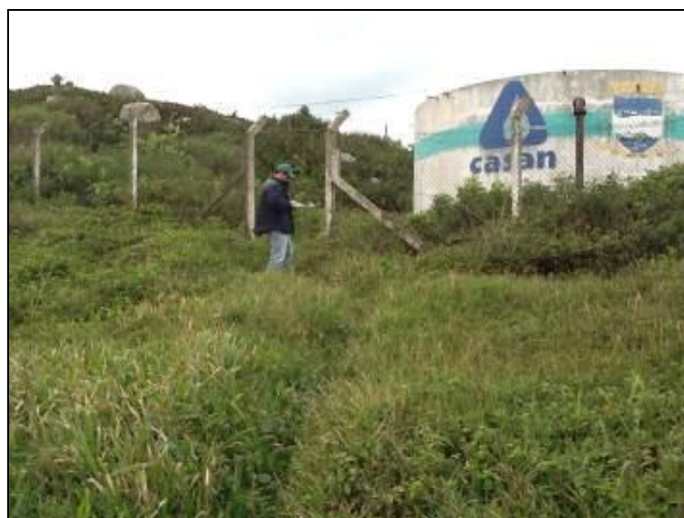
R-10 Itapirubá – Coordenadas 0722782 / 6863366