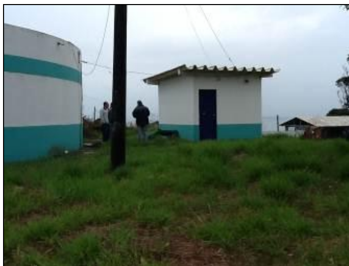
ERAT Vila Nova Alvorada

7) Estão devidamente identificadas? Sim ( ) Não (x) Pendência ( ): _____