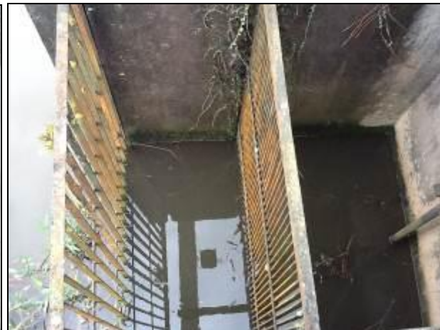
Área de sucção/entrada da água para as bombas de recalque.

R10: As condições de acesso são muito ruins. Além da distância, em condições de chuvas a área fica praticamente inacessível. Sugere-se buscar parceria com a PMI para melhorias e manutenção do acesso.