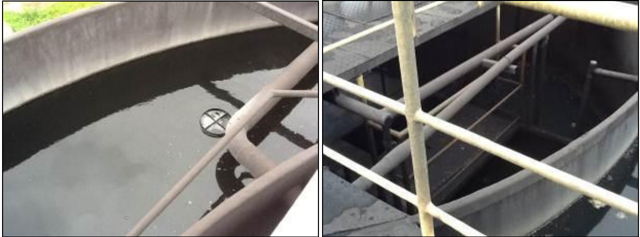
Estação de Tratamento compacta.