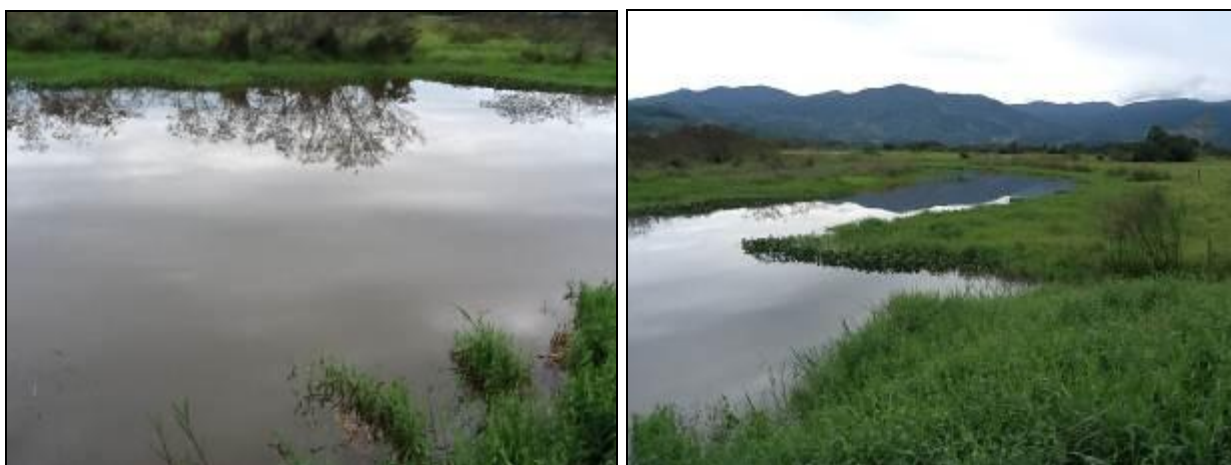
Área do Manancial: Rio D'Una. Coordenadas UTM: 0721052 / 6888750

Manancial: Rio D'Una - Localização: Penhinha, também conhecido como Coréia.