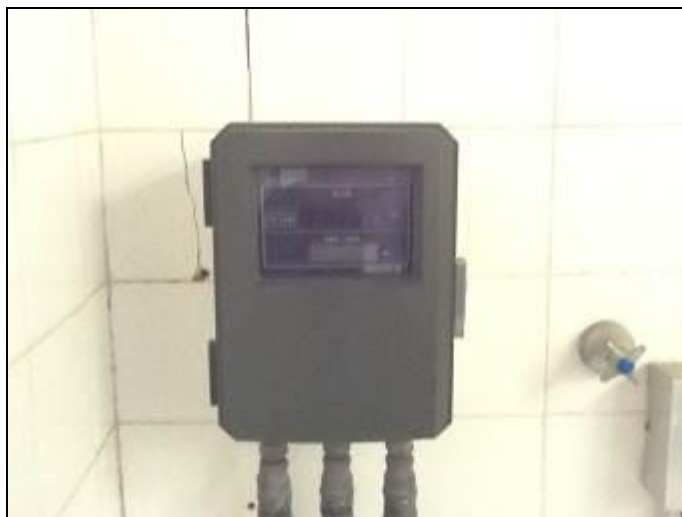
Macro medidor inativo por avaria.

Não ( ) Pendência (x): O medidor encontrado estava parado por avaria.