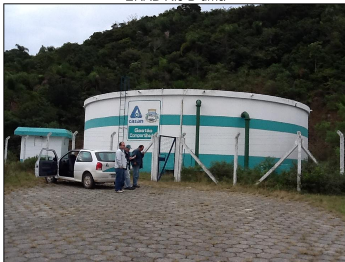
ERAT Caminho do Rei.