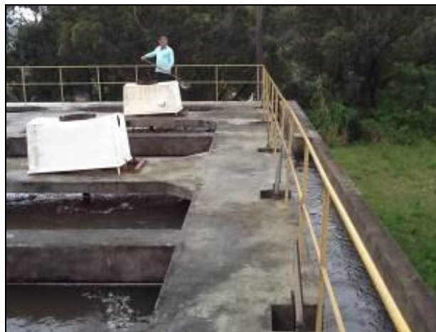
Floculadores necessitando melhorias.

13) O lodo é lançado retido pelos decantadores é disposto de forma adequada? Sim ( ) Não (x) Onde? Lançado em córrego próximo.