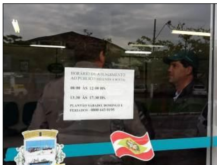
Cartaz com horário de funcionamento

2) Há placa indicativa do horário de funcionamento (Lei nº 8.078 - Art. 6º)? Sim (x) Não ( ) Pendência ( ): _____