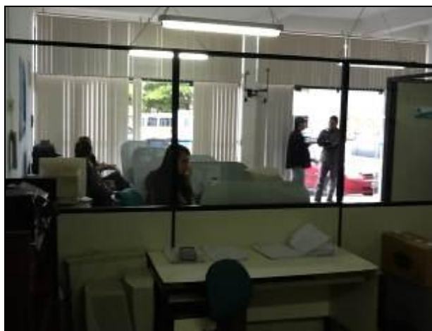
Aspectos internos da Agência

10) As condições gerais de limpeza são favoráveis (Resolução AGESAN n° 004 - Art. 127)? Sim (x) Não ( ) Pendência ( ): _____