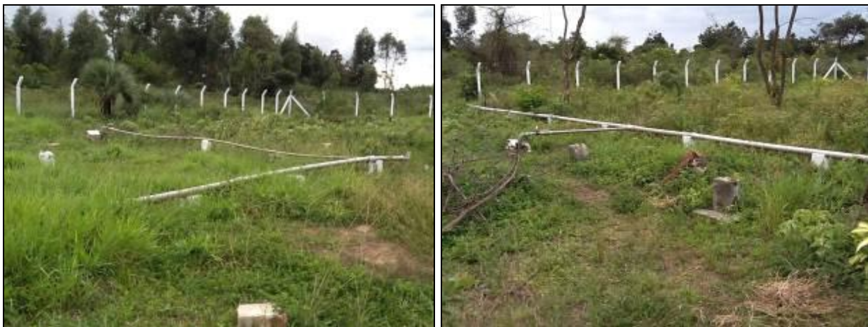
Área cercada, mas sem qualquer manutenção do entorno.

12) Existe cerca de proteção da área do manancial (Resolução AGESAN N°11- Art. 10º)? Sim (x) Não ( ) Pendência ( ): _____