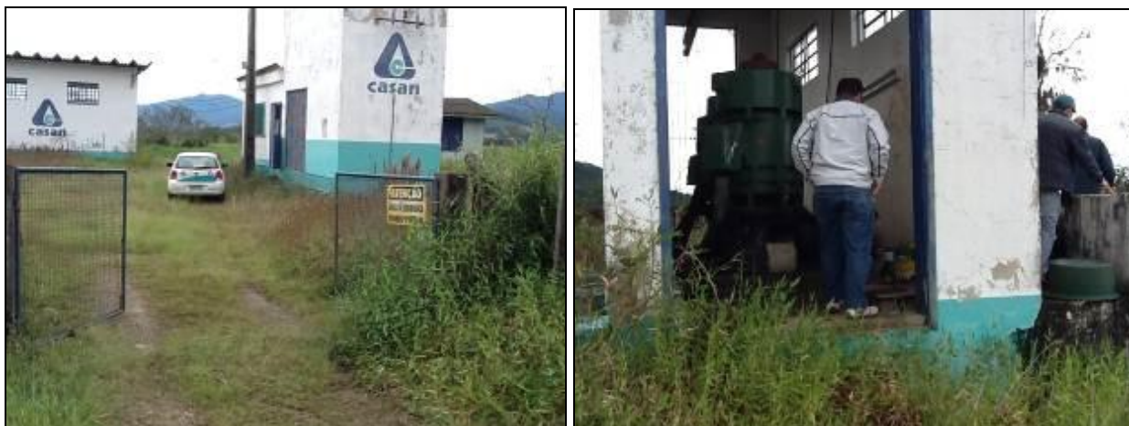
As estruturas são elevadas o que evita alagamentos.

acesso de pessoas e animais não! Conforme já exposto acima.