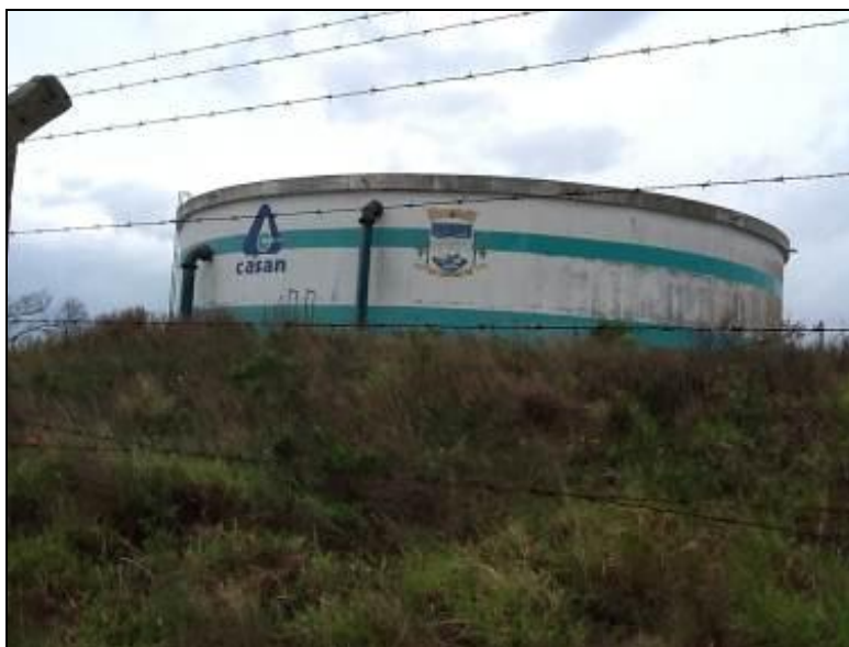
R-06 – Ribanceira – Coordenadas: 0728142 / 6878321