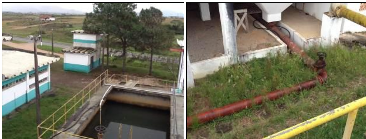
Áreas externas em mal estado de conservação.

R17: Apresentar solução para a situação das Unidades.