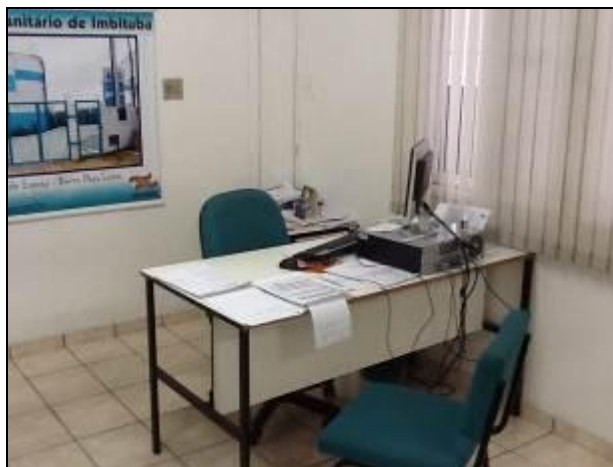
Áreas em boas condições de organização e limpeza.

11) O número de funcionários está atendendo à demanda de serviço existente (Resolução AGESAN n° 004 - Art. 131)? Sim (x) Não ( ) Pendência ( ): _____