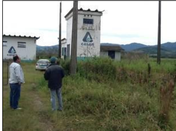
Área do manancial encontrava-se sem manutenção do entorno.

4) O volume captado atualmente garante o abastecimento de água sem haver colapso no abastecimento (NBR 12211 item 5.5)? Sim (x) Não ( ) Pendência ( ): O tipo de captação é adequado (NBR 12.213)? Sim (x) Não ( ) Pendência ( ): _____