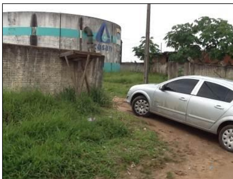
R-04 – Nova Alvorada