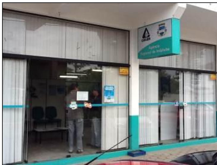
Fachada do Escritório de Imbituba

1) Existe identificação de que ali funciona um escritório de atendimento (Lei nº 8.078 - Art. 6º)? Sim (x) Não ( ) Pendência ( ): _____