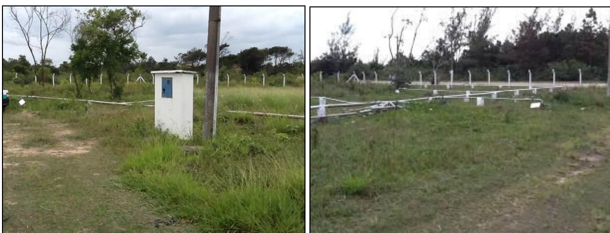
Área do Manancial subterrâneo em Itapirubá. Coordenadas UTM: 0722782 / 6863366

Manancial: Poço (10 ponteiros) - Localização: Itapirubá.