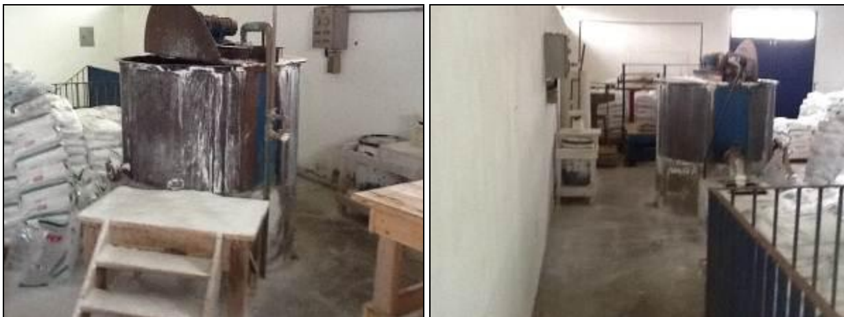
Casa de Química da ETA Imituba.

18) A estrutura do prédio da casa de química está aparentemente segura (Resolução AGESAN N°11 Art. 15°)? Sim (x) Não ( ) Pendência ( ) : _____