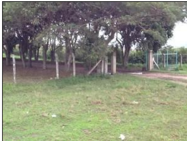
Acessos da ETA de Imbituba.

3) Quais parâmetros são analisados na ETA local? (x) Cloro (x) Flúor ( ) Outros: cor, turbidez, acidez (PH).