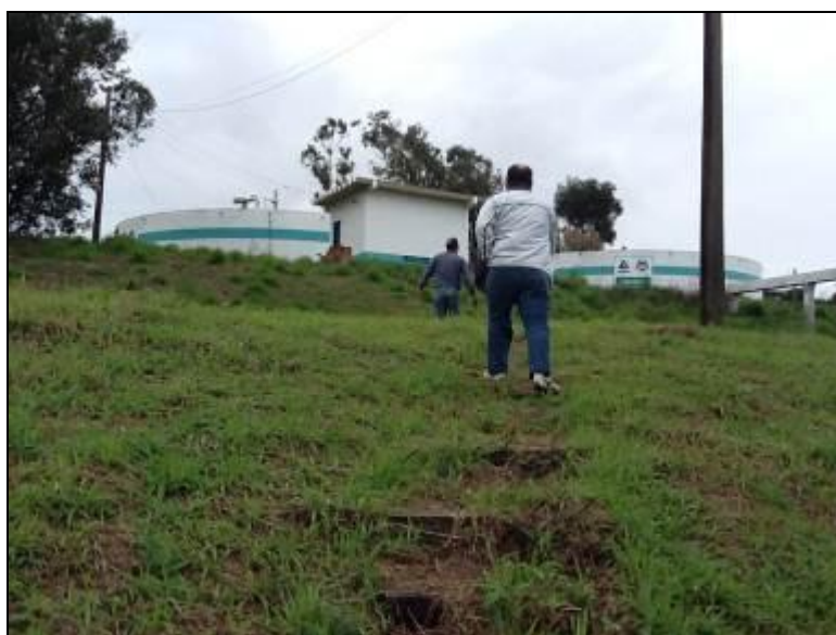
R01 e R02 Reservatórios Centrais – Coordenadas 0728475 / 6876216