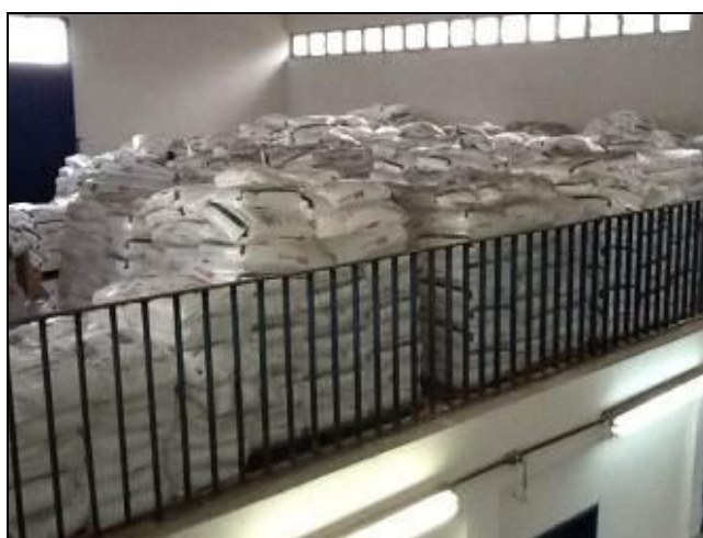
Produtos químicos acondicionados na ETA.

19) Existe almoxarifado para acondicionamento de produtos químicos (Resolução AGESAN N°11 - Art. 18° §2°)? Sim (x) Não ( ) Pendência ( ) : _____