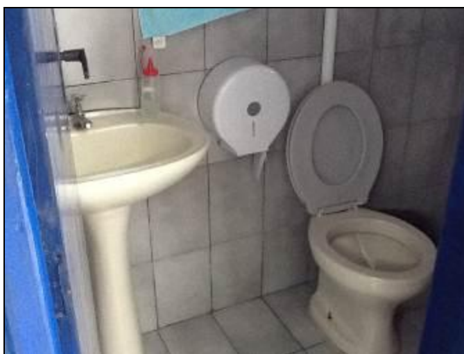
Sanitário disponível no Escritório

6) Existe sanitário disponível para uso dos funcionários (Resolução AGESAN nº 004 - Art. 127)? Sim (x) Não ( ) Encontra-se em boas condições de higiene e limpeza? Sim (x) Não ( ) Pendência ( ): _____