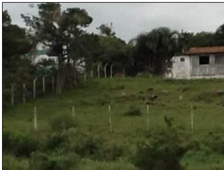
R-09 Reservatório Guaiuba – Coordenadas 0725218 / 6869062

3) Existem placas indicativas de propriedade e restrição de uso das áreas dos reservatórios (Resolução AGESAN N° 004 - Art.19 - §2º)? Sim ( ) Não (x) Pendência ( ):