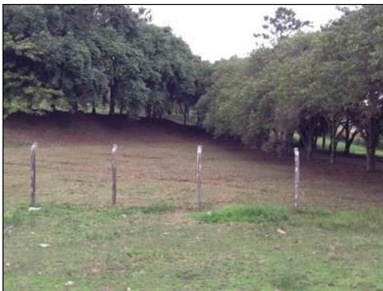
Parcela do cercamento e da área externa da ETA.

9) As condições de limpeza do pátio externo são boas (Resolução AGESAN N°11 - Art. 15°)? Sim ( ) Não ( ) Pendência (x): As áreas externas de todas as Unidades do SAA necessitam de melhorias consideráveis.