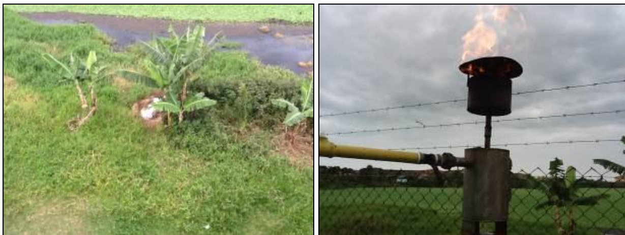
Entorno (esquerda) e queimador de metano à direita

31) Com que frequência é feita análise deste efluente? Quinzenalmente. Diários: Oxigênio Dissolvido, PH, Temperatura e Sólidos Sedimentáveis.