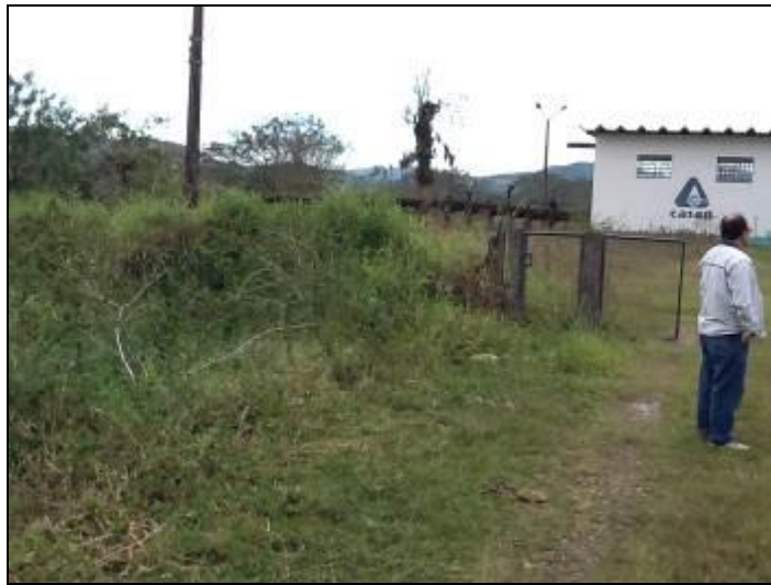
ERAB Rio D'uma