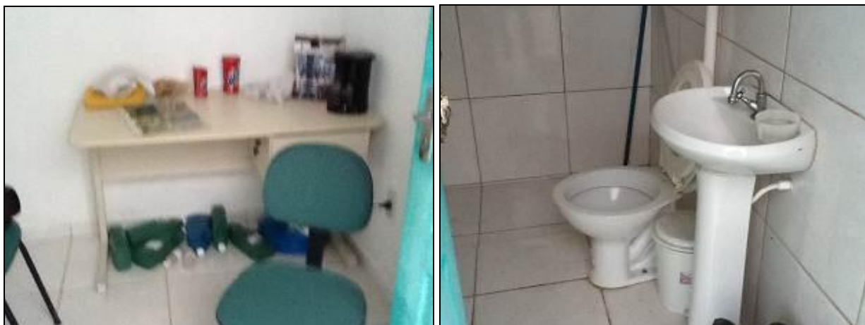
Estruturas de apoio da ETE.

13) Existem edificações de apoio (guarita, casa/abrigo, banheiros, vestiários, refeitório, etc.) para uso dos operadores? Sim (x) Não ( )