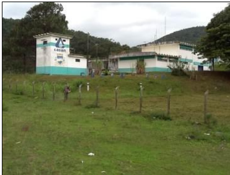
Vista geral da ETA - Imbituba. Coordenadas UTM: 0726359 / 6876772

Localização: Av.: Marieta Konder Bornhausen – Nova Brasília – Imbituba.