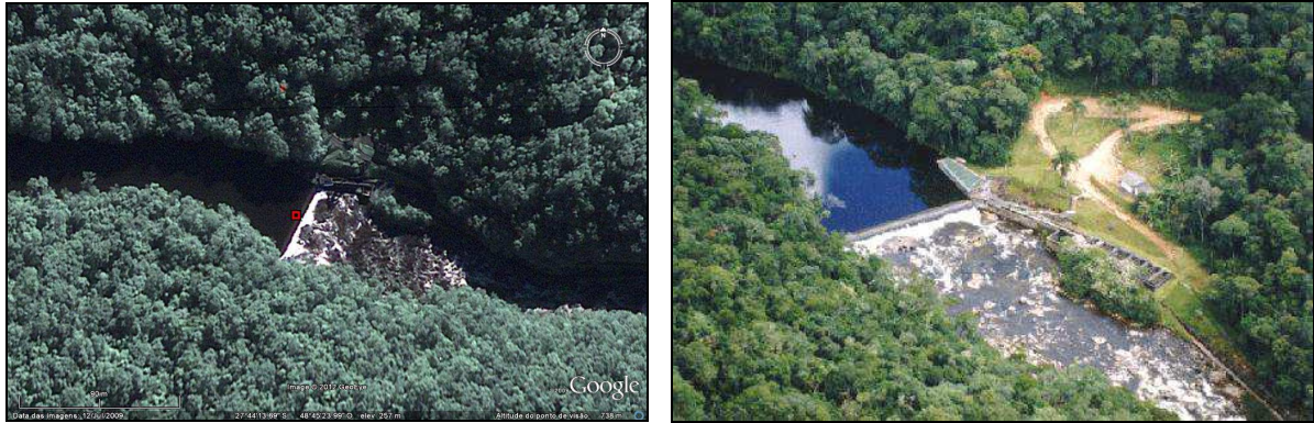
Imagem 1 e 2 - Captação do Rio Pilões