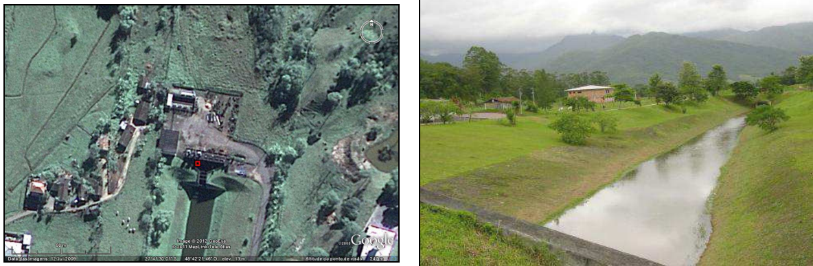
Imagem 3 e 4 - Captação do Rio Cubatão