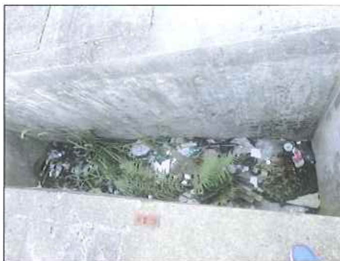
Figura 7: Área com acúmulo de resíduos