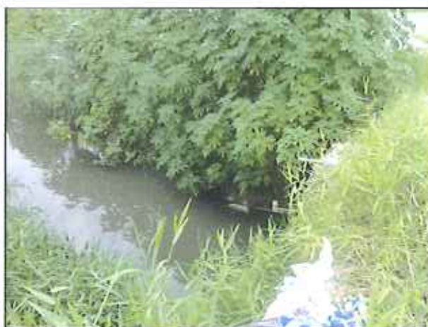
Figura 9: Rio Carolina entre José Nitro e Morar Bem