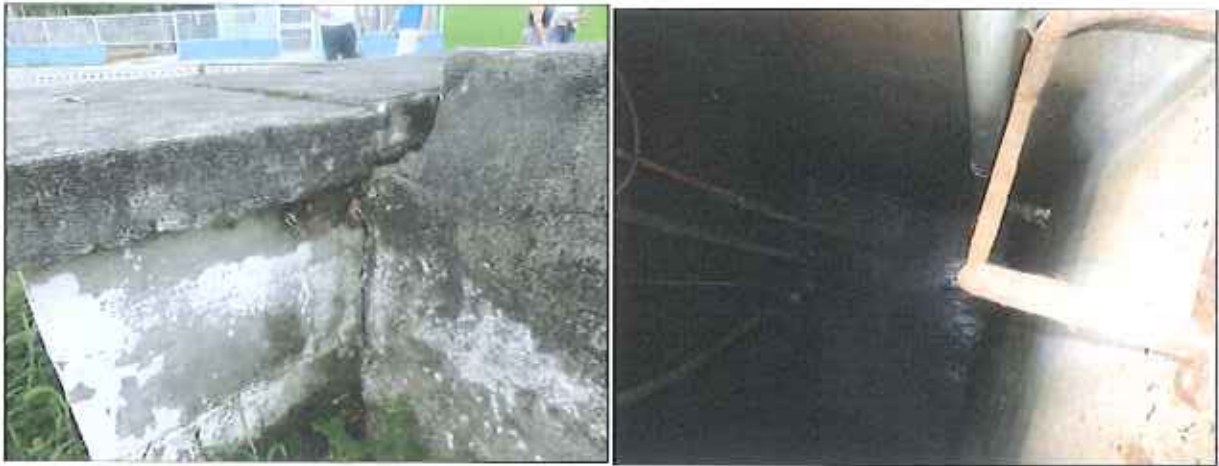
Figura 2: Vista externa e interna do poço úmido