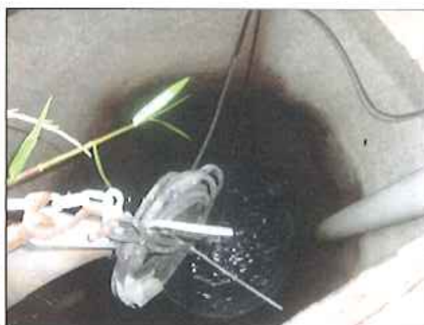
Figura 8: Vista externa e interna do poço úmido

Entre os dois locais de tratamento, encontra-se o Rio Carolina, o qual receber o efluente tratado das duas unidades, conforme figura 9.