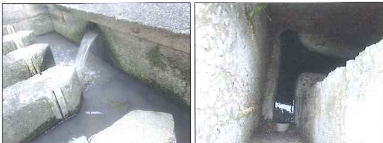
Figura 6: Entrada e saída do efluente