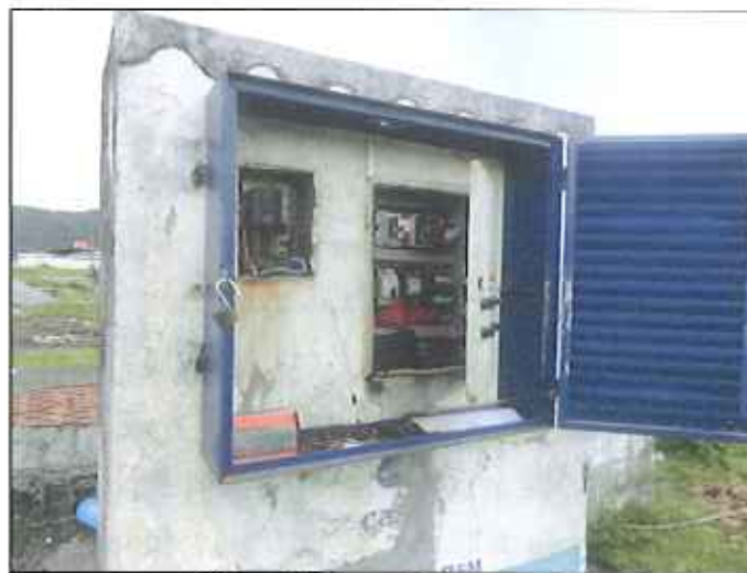
Figura 3: Casa de comando