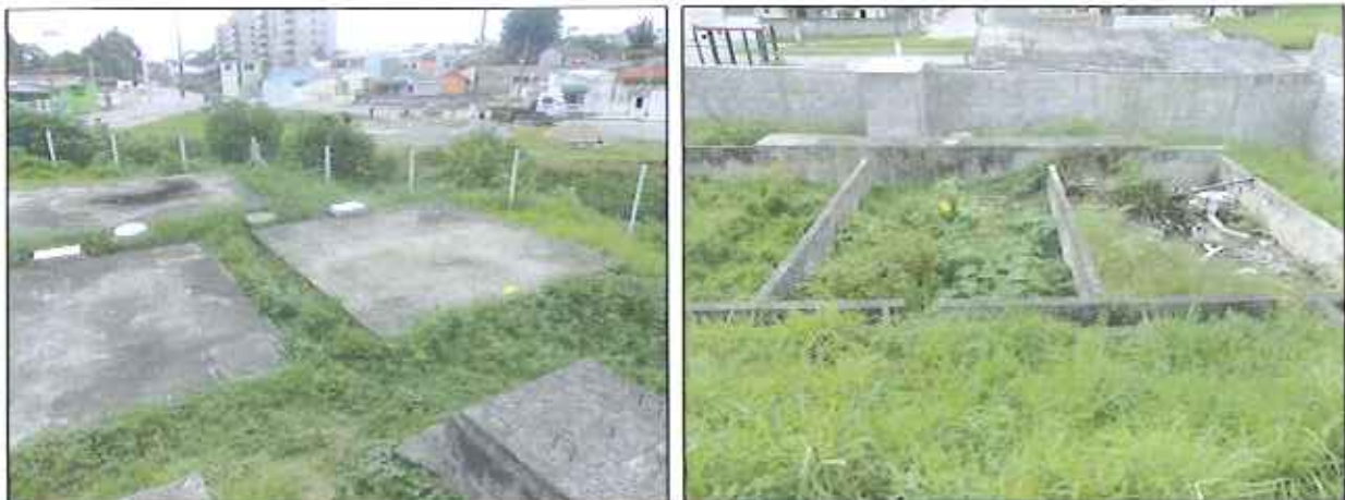
Figura 5: Vista de cima do tratamento e do leito de secagem inoperante