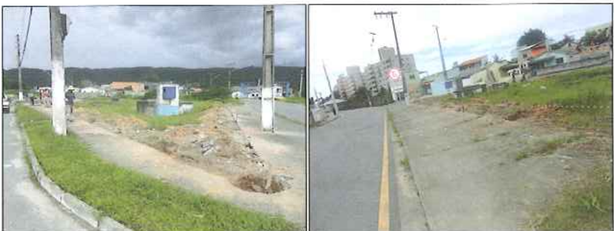
Figura 1: Vista externa do local de tratamento de esgoto do Conjunto Habitacional Morar Bem

Abaixo se encontram imagens do local de tratamento de esgoto do bairro Morar Bem (figuras 1 a 3).