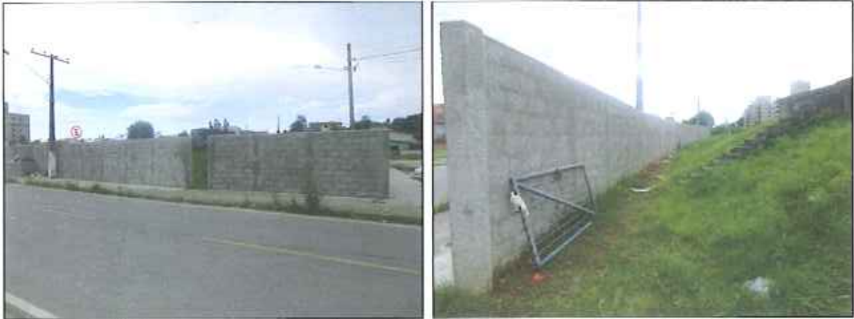
Figura 4: Vista externa do local de tratamento de esgoto do Conjunto Habitacional José Nitro

Abaixo se encontram imagens do local de tratamento de esgoto do bairro José Nitro (figuras 4 a 8).