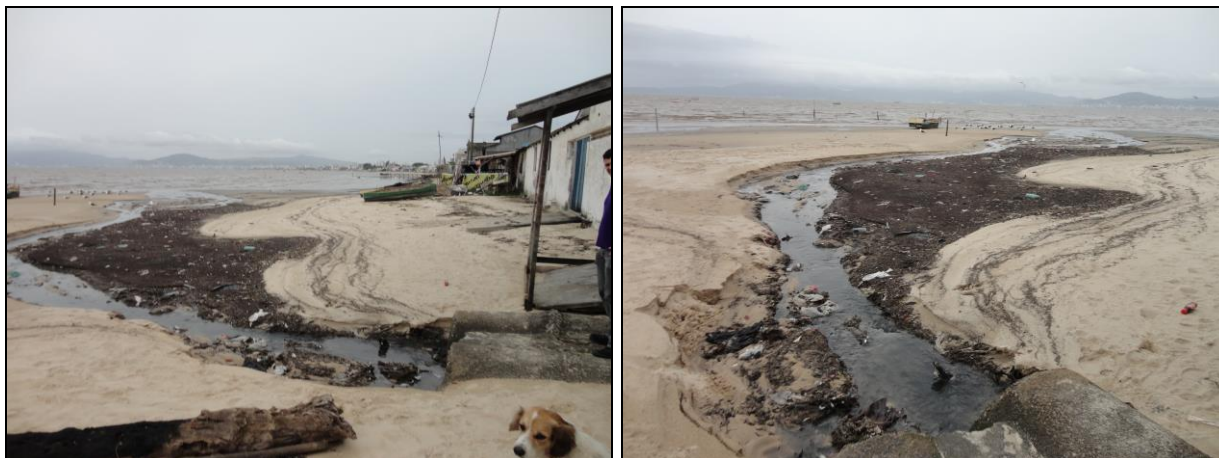
Figura 3: Vista geral dos fundos da EEE GB Barreiros

acompanhada da equipe técnica da concessionária. Foi somente verificada a área onde ocorre a saída do extravasor para o mar (fundos da Elevatória). No momento da vistoria, não foi constatado peixes mortos no praia, conforme figuras 3 e 4.