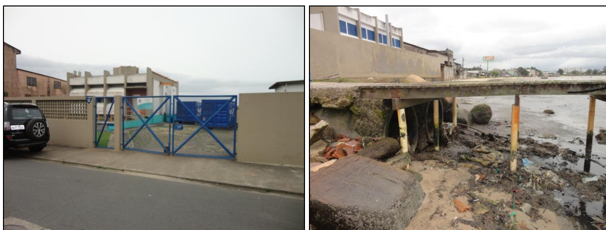
Figura 2: EEE GB Barreiros vista de frente para a rua e de fundos para o mar

A equipe técnica da ARESC não entrou especificamente na área da Elevatória, pois não estava