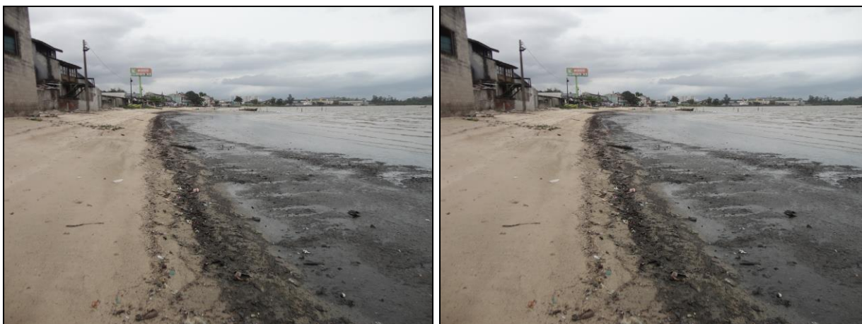
Figura 4: Vista geral dos fundos da EEE GB Barreiros

É importante salientar que o esgoto sanitário é composto por efluentes domiciliares, e menores quantidades de efluentes industriais, hospitalares e água da chuva. O extravasamento do esgoto sanitário bruto para o mar propicia uma baixa quantidade de oxigênio na água e conseqüentemente pode provocar a mortandade de peixes. Outra possível causa seria o despejo inadequado de algum produto tóxico à montante que acabou chegando ao mar, próximo ao local de saída do extravasor da Estação Elevatória.