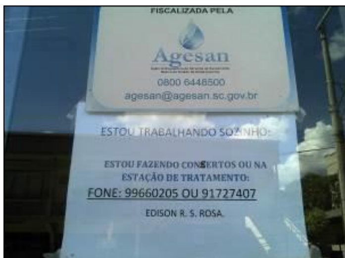
Figura 2: Identificação somente do numero do telefone (acompanhamento)

RECOMENDAÇÃO 02: Afixar placa de identificação de horário conforme determina Resolução.