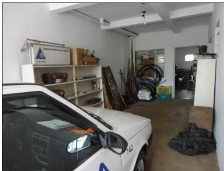
Figura 7: Veículo de uso da agencia.

18) Existem veículos para uso dos funcionários? Sim (x) Não ( ) Pendência ( ):