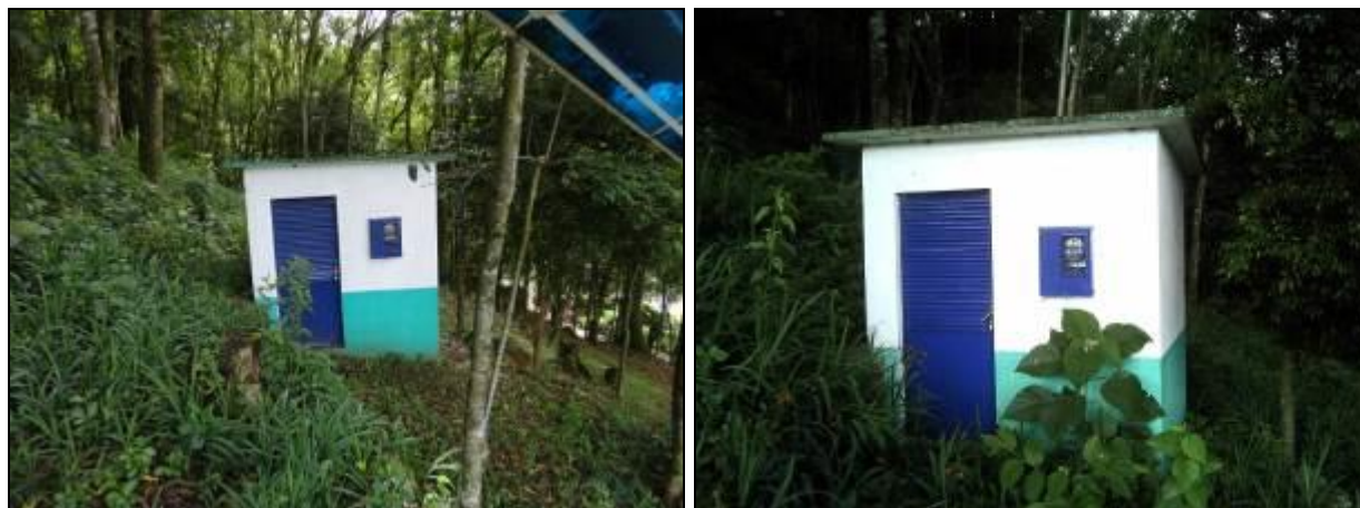
Figura 18: ERAT (inicial e acompanhamento)

1) Estão devidamente identificadas? Sim ( ) Não (x) Pendência ( ):