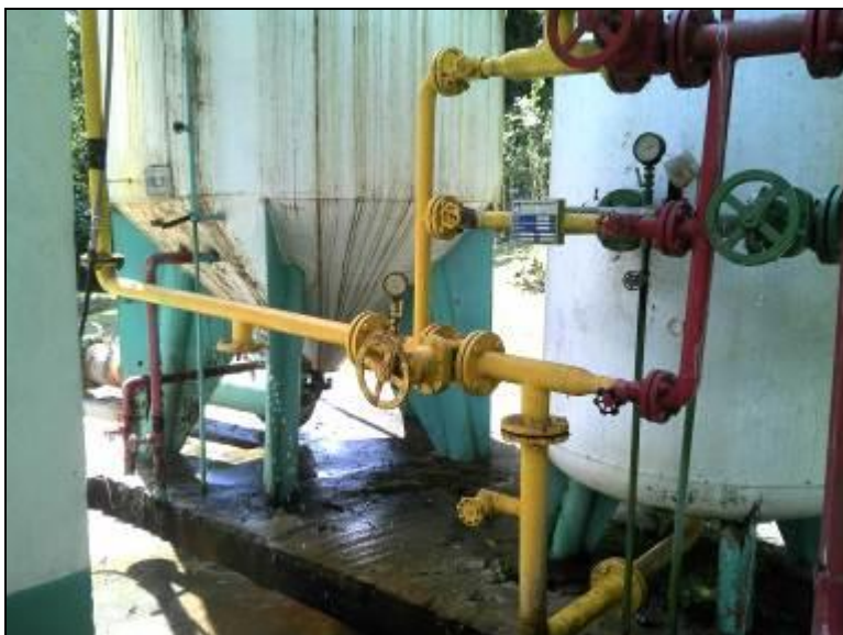
Figura 16: Vazamentos nas tubulações dos filtros (acompanhamento)

RECOMENDAÇÃO 17: Providenciar o concerto dos vazamentos.