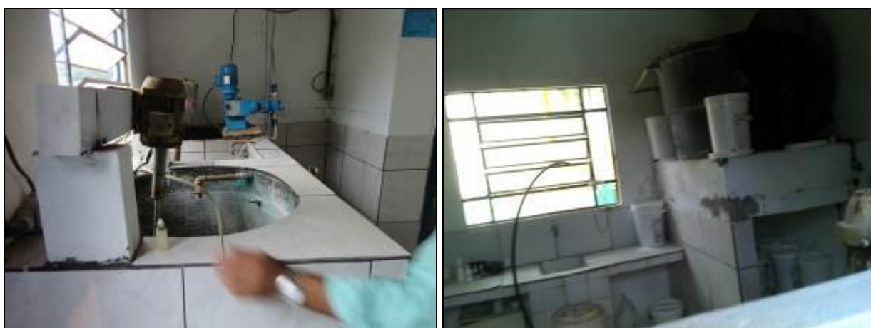
Figura 11: Laboratório em estado abandonado (inicial)

3) As condições do Laboratório são adequadas? Sim (x) Não ( ) Pendência ( ):