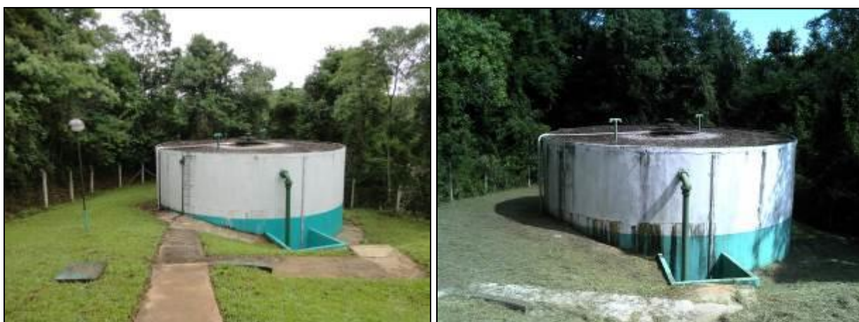
Figura 17: R-01 (inicial e acompanhamento)

Posição: Apoiado (x) Elevado ( ) Outro ( )