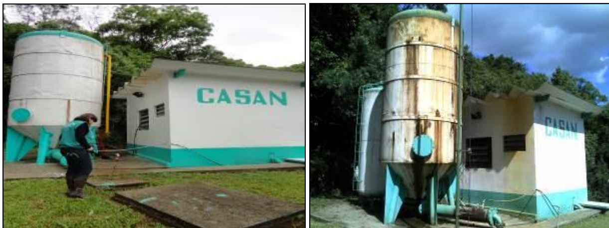
Figura 13: Filtros da ETA (inicial e acompanhamento)

18) Os instrumentos possuem tampas (Resolução AGESAN nº11 - Art. 15º)? Sim ( ) Não (x) Pendência ( ) : Obs.: Não se aplica.