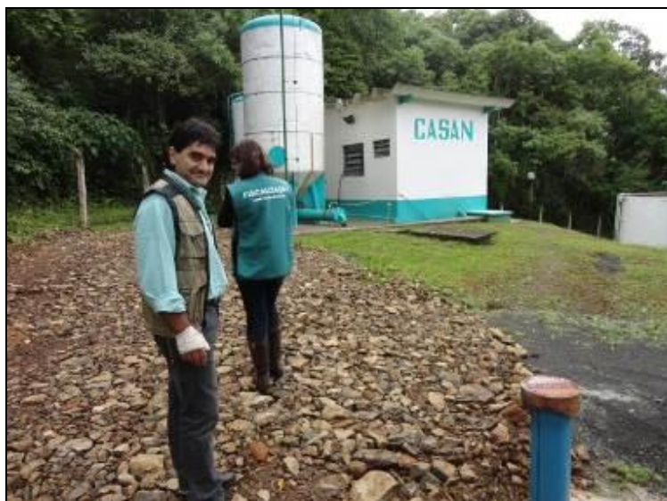
Figura 9: Poço 2

Endereço: Euclides D'Agostini – junto a ETA - S27°15'83" W51° 32'79"