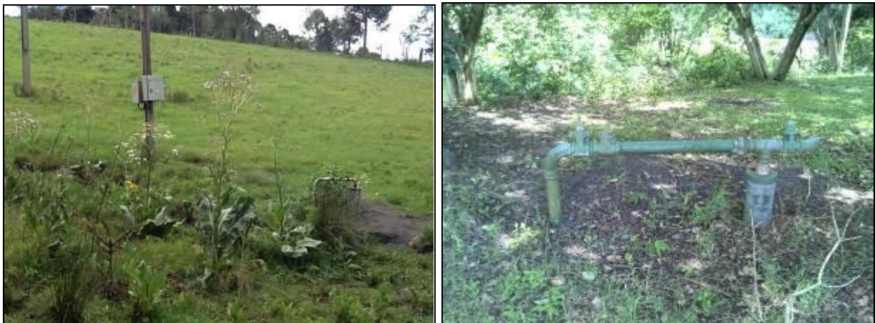
Figura 8: Poço 1 - Sede (Inicial e acompanhamento)

Endereço: Área central da Cidade - Coordenada Geográfica: S27°15'83" W51° 32'79"