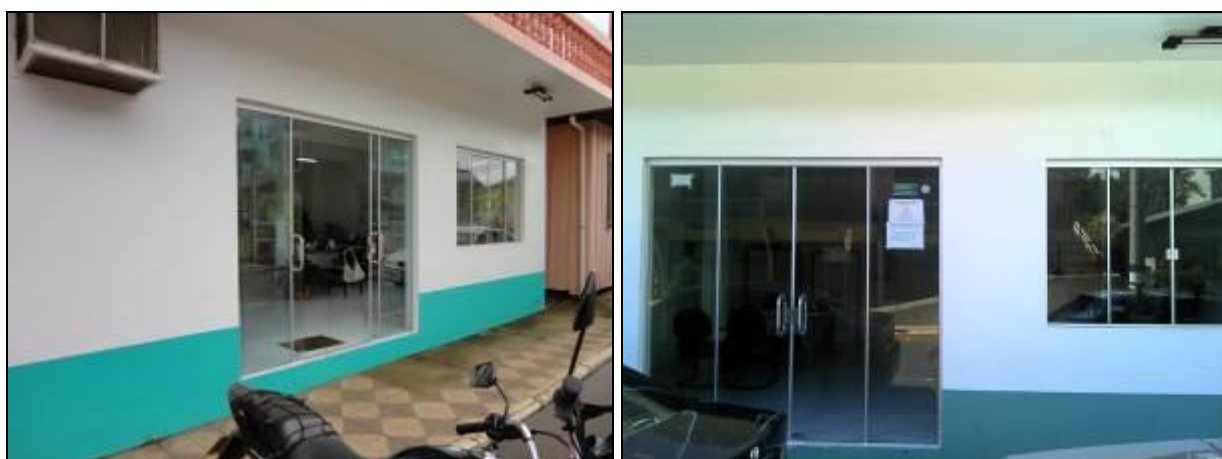
Figura 1: Fachada do Prédio da Prefeitura (inicial e acompanhamento)

RECOMENDAÇÃO 01: Providenciar placa ou pintura com identificação da Agência