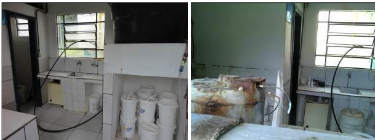
Figura 14: Casa de Química (inicial e acompanhamento)

20) A estrutura do prédio da casa de química está aparentemente segura (Resolução AGESAN nº11 Art. 15º)? Sim (x) Não ( ) Pendência ( ):