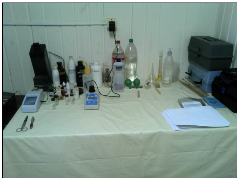
Figura 12: Laboratório localizado na agencia (acompanhamento)

4) Quais parâmetros são analisados na ETA local? Cloro (x) / Flúor (x) / PH (x) / Cor (x) / Turbidez (x) / Outros: Obs.: Não informado (todos os parâmetros citados são analisados)