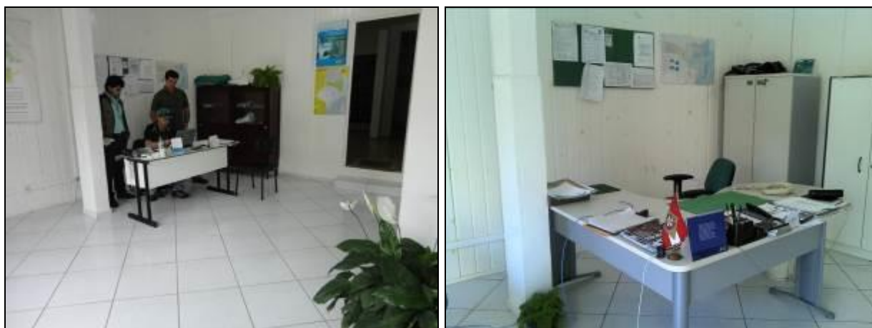
Figura 4: mobiliário da Agencia (inicial e acompanhamento)

7) Os equipamentos e instalações elétricas estão em bom estado (Resolução AGESAN nº 004 - Art. 127)? Sim (x) Não ( ) Pendência ( ):