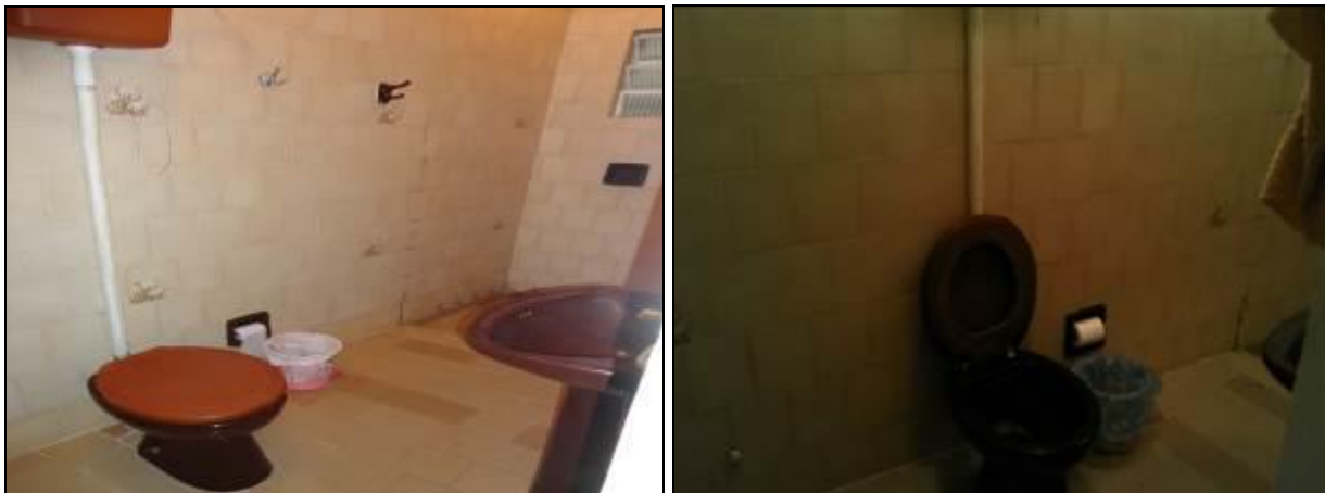
Figura 5: Banheiro da Agência (inicial e acompanhamento)

9) Há sanitários para os usuários (Resolução AGESAN nº 004 - Art. 127)? Sim ( ) Não ( ) Encontram-se em boas condições de higiene e limpeza? Sim ( ) Não (x) Pendência ( ):