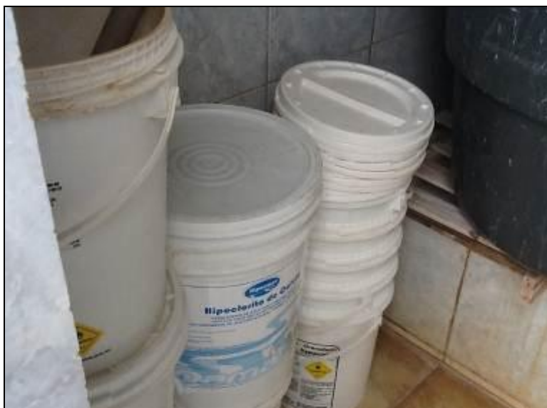
Figura 15: Acondicionamento dos produtos químicos.

22) O empilhamento dos produtos químicos é adequado (Resolução AGESAN N°11 - Art. 18º §2º)? Sim (x) Não ( ) Pendência ( ):