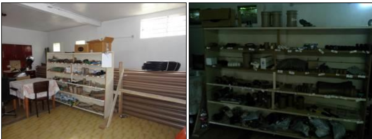
Figura 6: Almoxarifado (inicial e acompanhamento)

10) Existe almoxarifado em boas condições? Sim (x) Não ( ) Pendência ( ):