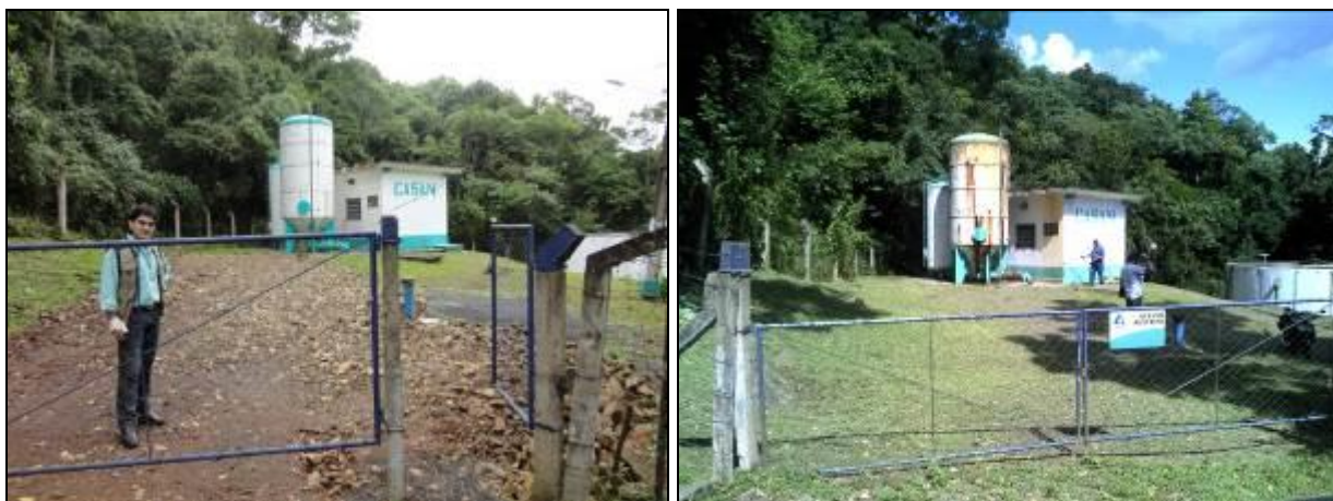
Figura 10: Vista da ETA (inicial e acompanhamento)

3) As condições do Laboratório são adequadas? Sim (x) Não ( ) Pendência ( ):