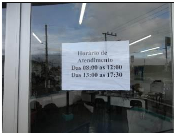
Cartaz com horário

2) Há placa indicativa do horário de funcionamento (Lei nº 8.078 - Art. 6º)? Sim (x) Não ( ) Pendência ( ): _____