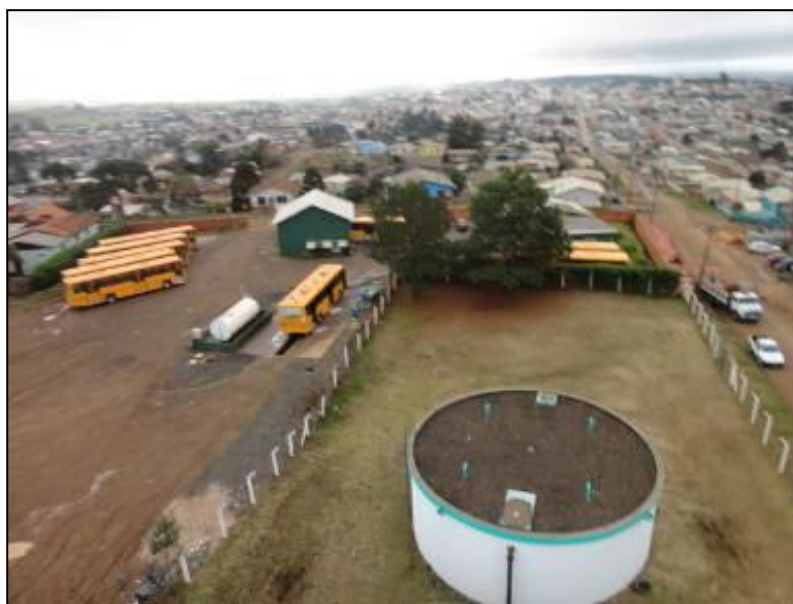
Áreas de entorno dos Reservatórios do SAA Curitibaanos.

5) As áreas estão devidamente cercadas e trancadas (Resolução AGESAN N°11 - Art. 23°)? Sim (x) Não ( ) Pendência ( ):