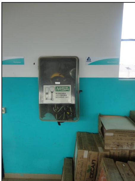
Equipamentos de Proteção Individual.

14) As ferramentas de trabalho estão dispostas em local adequado e seguro ( picaretas, pás, enxadas, alavancas etc. )? Sim (x) Não ( )