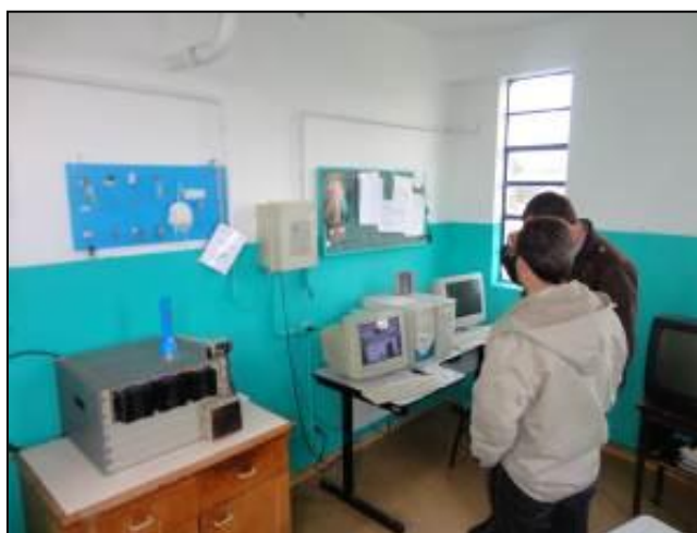
Outros equipamentos de acompanhamento da ETA.

6) Existe Macromedição na saída (Resolução AGESAN N°11 - Art. 17°)? Sim (x) Não ( )