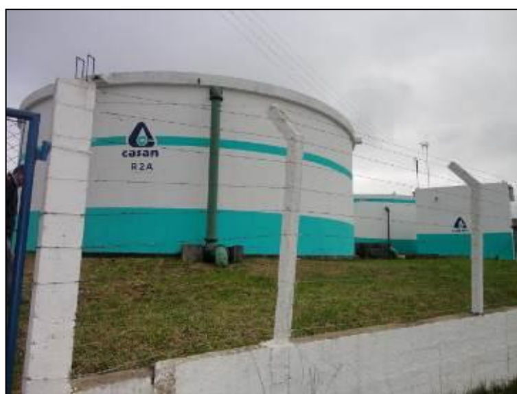
Fotos R-2A e e R-2.