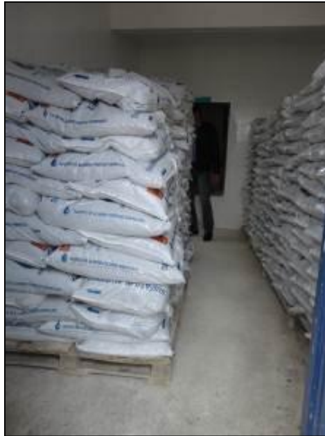
Acondicionamento de produtos químicos.

21) O empilhamento dos produtos químicos é adequado (Resolução AGESAN N°11 - Art. 18º §2º)? Sim (x) Não ( ) Pendência ( ): _____