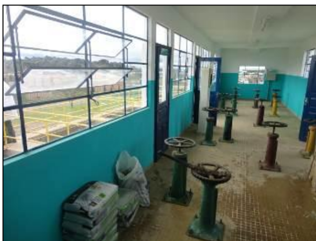
Acessos da ETA Curitibanos.

2) O acesso à ETA está em boas condições (Resolução AGESAN N°11 - Art. 15°)? Sim (x) Não ( ) Pendências ( ):