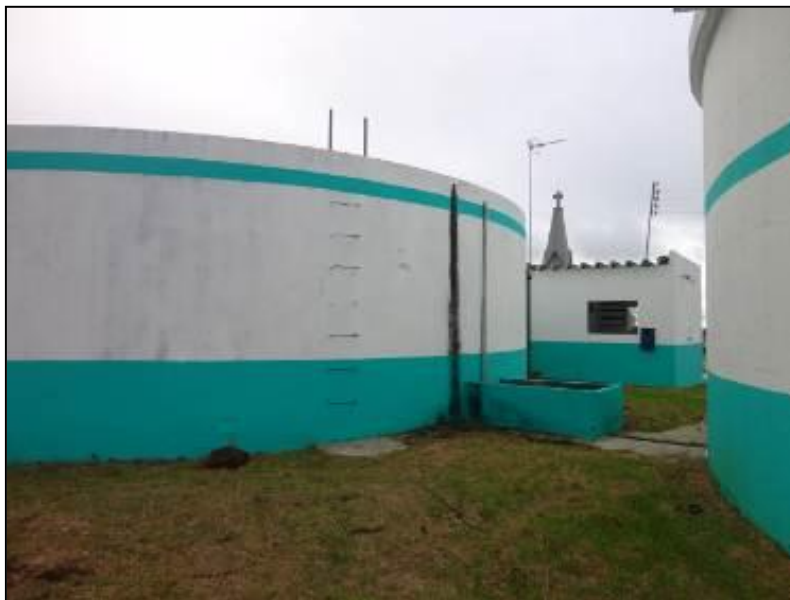
Escadas de acesso à cobertura dos reservatórios (R2) com pequenos reparos a ser feito.

6) Existem escadas em boas condições de uso (Resolução AGESAN N°11 - Art. 23°)? Sim (x) Não ( ) Pendência ( ): _____