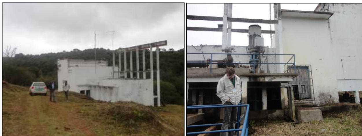
Cada das máquinas onde é feito o recalque para a ETA.

7) Existe facilidade de acesso ao local (Resolução AGESAN N°11 - Art. 11º)? Sim (x) Não ( ) Pendência: _____