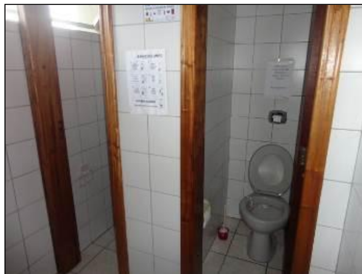
Sanitários de unidades da estrutura de Curitibaanos

6) Existe sanitário disponível para uso dos funcionários (Resolução AGESAN N° 004 Art. 127)? Sim (x) Não ( ) Encontra-se em boas condições de higiene e limpeza? Sim (x) Não ( ) Pendência ( ): _____