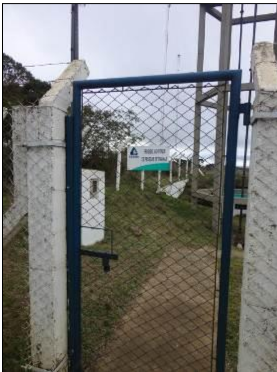
Placas indicativas de restrição de acesso.

3) Existem placas indicativas de propriedade e restrição de uso das áreas dos reservatórios (Resolução AGESAN N° 004 - Art.19 - §2°)? Sim (x) Não ( ) Pendência ( ):