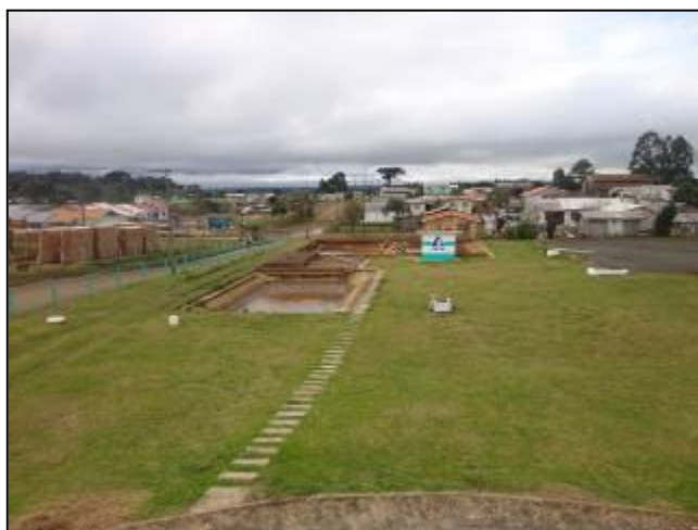
Áreas externas em bom estado de conservação.

9) As condições de limpeza do pátio externo são boas (Resolução AGESAN Nº11 - Art. 15º)? Sim (x) Não ( ) Pendência ( ): _____