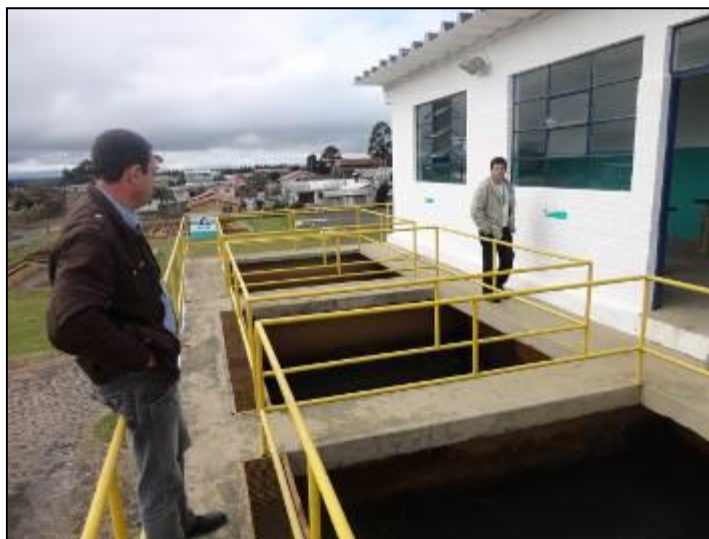
Filtros da ETA Curitibaanos..

16) Os filtros estão em boas condições (Resolução AGESAN N°11 - Art. 15°)? Sim (x) Não ( ) N° de filtros: 02 (dois) .