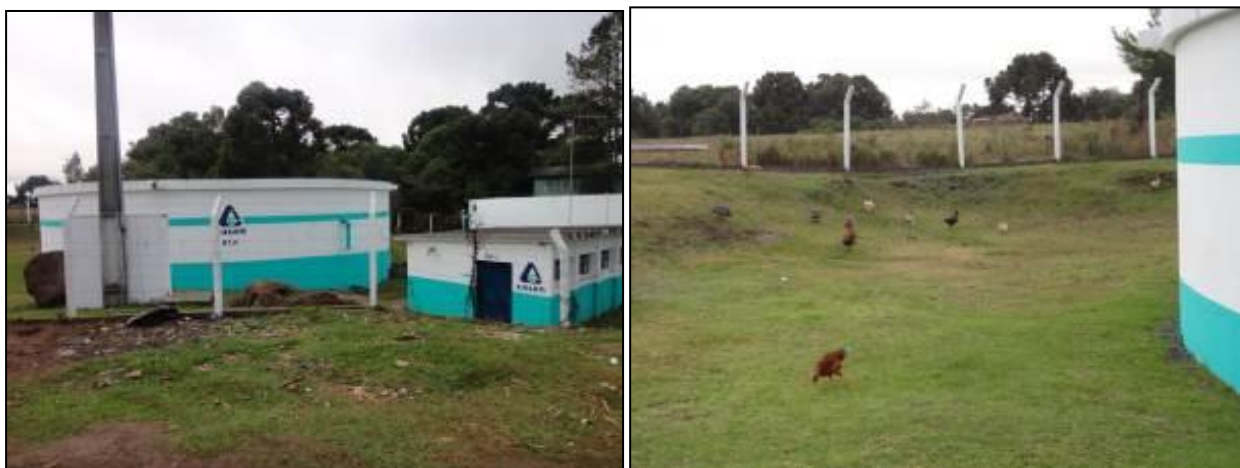
Fotos de R-1A e R-1 ao seu lado (atrás da estação elevatória) porém sem identificação na esquerda. À direita, percebe-se a presença de animais nas imediações do reservatório.