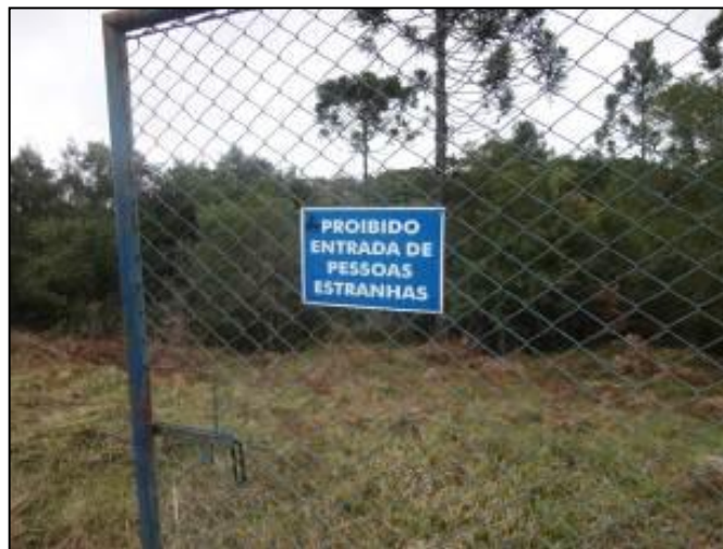
Placas de identificação conforme orientação da Agência Reguladora.

10) Existe placa de identificação com as restrições à utilização da área (Resolução AGESAN N°11 - Art. 10º)? Sim (x) Não ( ) Pendência ( ): _____