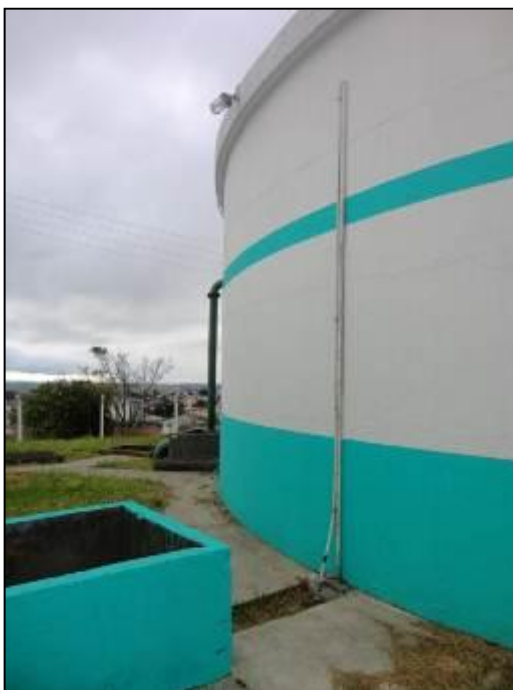
Iluminação junto ao R-02.

9) Apresentam para-raios, iluminação e sinalização noturna (Resolução AGESAN N°11 - Art. 23º)? Sim (x) Não ( ) Encontram-se em boas condições? Sim ( ) Não ( ) Pendência (x): Necessitando manutenção.