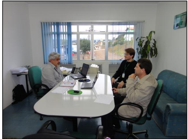
Áreas internas do Escritório.

5) Os equipamentos e instalações elétricas estão em bom estado (Resolução AGESAN N° 004 - Art. 127)? Sim (x) Não ( ) Pendência ( ): _____