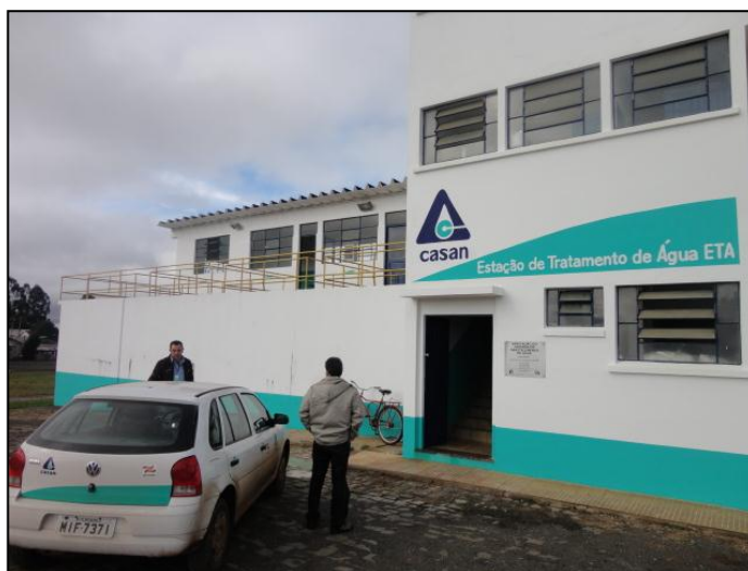
Alguns dos veículos à disposição de Curitibaanos

16) O usuário é comunicado da possibilidade de acompanhamento ( verificar como se dar a comunicação ) (Lei nº 8.078 - Art. 6º) ? Sim (x) Não ( )