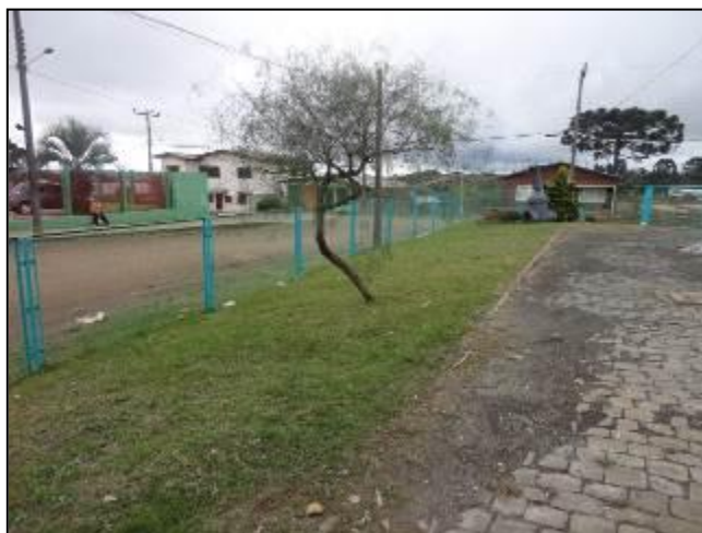
Alguns trechos do cercamento da ETA.

8) Existe cerca de proteção da ETA em bom estado de conservação (Resolução AGESAN Nº11 - Art. 15º)? Sim (x) Não ( ) Pendência ( ): _____