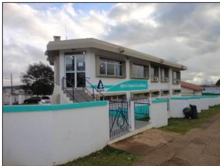
Fachada do Escritório

Endereço: Av. Leoberto Leal, nº 222, Bairro Água Santa – Curitiba - SC