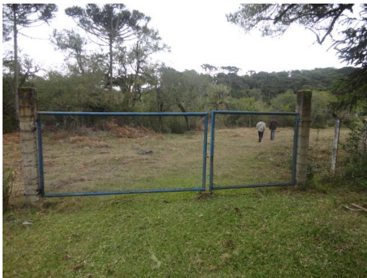
Área do manancial cercada porém não identificada.

3) Existe cerca de proteção da área do manancial (Resolução AGESAN N°11- Art. 10º)? Sim (x) Não ( ) Pendência ( ):