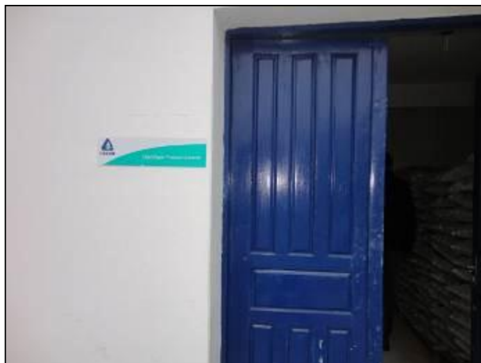
Casa de Química da ETA Curitibaanos.

19) A estrutura do prédio da casa de química está aparentemente segura (Resolução AGESAN N°11 Art. 15°)? Sim (x) Não ( ) Pendência ( ) : _____